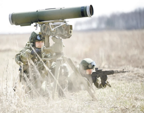
Подготовил Павел БЕЛКИН

В тренировке приняли участие более 100 военнослужащих подразделений морской пехоты КФЛ, было задействовано порядка 10 единиц военной техники.