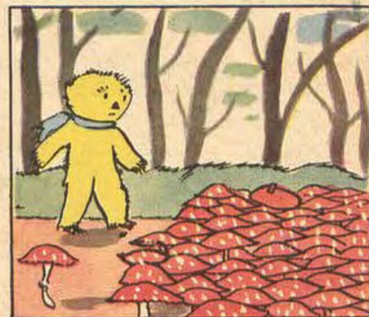
Рисунок на обложке В. ЛОСИНА