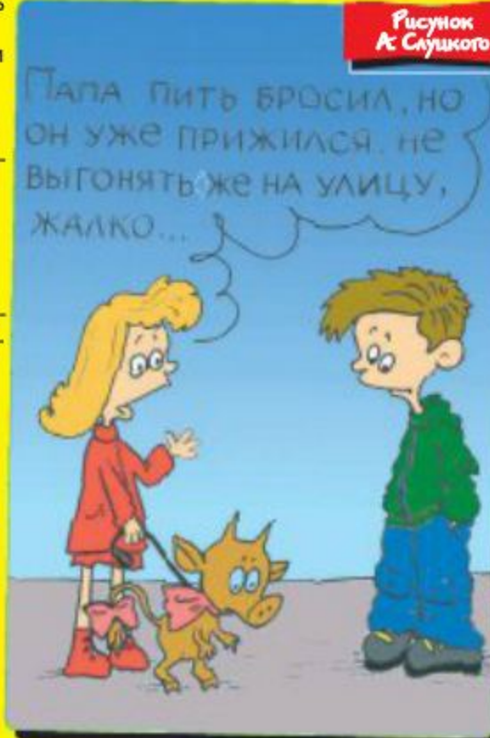
Рисунок А. Слущкого

Социологический опрос. Назовите ваш самый главный семейный праздник: — Новый год; — 8 Марта;