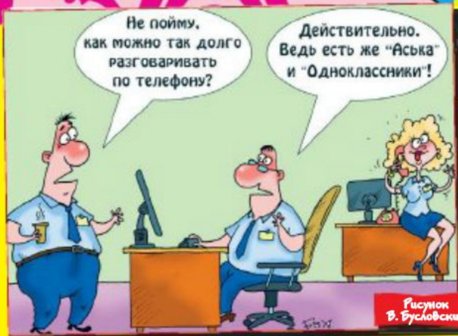
Рисунок В. Бусловских