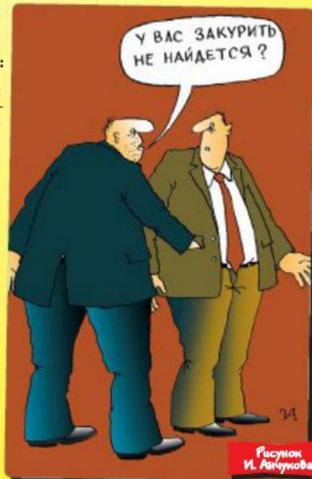
Рисунок И. Анчукова

ваша жена с соседкой улетели на Багамы, а к вам в комнату из всех щелей лезут голые управдомы и говорят «милый!».