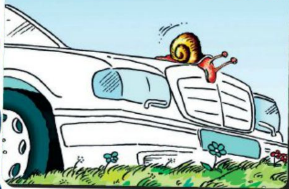
Рисунок В. Александрова