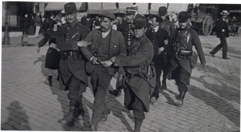
АРЕСТ ЖАНДАРМАМИ УЧАСТНИКОВ АКЦИИ ПРОТЕСТА ПРОТИВ ПОВЫШЕНИЯ ЦЕН НА ПРОДУКТЫ (СЕН-КВЕНТИН, ФРАНЦИЯ, 30 НОЯБРЯ 1911 ГОДА)

Французская жандармерия ведет свою родословную с 1445 года, когда король Карл VII издал ордонанс (указ) об организации 15 регулярных воинских формирований, названных ордонансными ротами. В состав одной роты входили сто рыцарей, каждый из которых был обязан прибыть на службу с пятью вооруженными слугами. Традиционно эти подразделения комплектовались представителями самых знатных дворянских фамилий, а служба в них считалась очень почетной. Этих рыцарей первоначально и называли жандармами. Долгое время они считались элитой вооруженных сил Франции и одними из лучших кавалерийских частей Европы. Позже на жандармов были возложены и полицейские функции. Но времена меняются, остались в прошлом короли и рыцари, а вот жандармские подразделения дожили до наших дней. Поскольку Франция всегда считалась законодательницей мод, то по ее примеру во многих странах Европы жандарме-