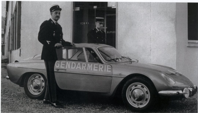
ALPINE RENAULT НА СЛУЖБЕ В ЖАНДАРМЕРИИ (ФРАНЦИЯ, 1966 ГОД)

Купе Alpine Renault A310 тоже относится к категории спортивных машин. Автомобиль дебютировал на автосалоне в Женеве весной 1971 года. Поначалу A310 выпускался параллельно с более ранней моделью A110, а затем сменил ее на рынке. Производились A310 исключительно для европейских потребителей.