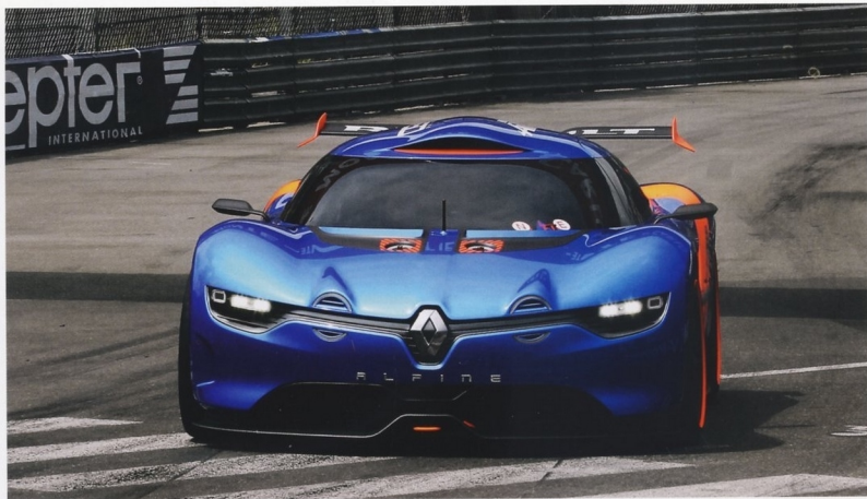
КОНЦЕПТ-КАР RENAULT ALPINE A110-50 БЫЛ ПРЕДСТАВЛЕН ПУБЛИКЕ НА ТРАССЕ ФОРМУЛЫ-1 В МОНТЕ-КАРЛО 25 МАЯ 2012 ГОДА

и со временем превратилась в подразделение корпорации Renault, специализирующееся на проектировании и постройке спортивных и гоночных автомобилей.