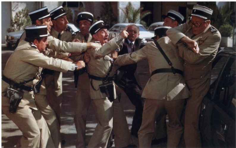
ЛУИ ДЕ ФЮНЕС (В ЦЕНТРЕ) В КОМЕДИИ «ЖАНДАРМ И ИНОПЛАНЕТЯНЕ» (ФРАНЦИЯ, 1978 ГОД)

деление воинских частей на жандармерию департаментов, насчитывавшую 685 офицеров и 22 656 нижних чинов, и республиканскую гвардию ( garde républicaine ), состоявшую из 3890 человек под командованием 131 офицера. Республиканская гвардия по традиции расквартирована в Париже. Служба в жандармерии — дело нелегкое: личному составу приходится работать не только во Франции, но и во французских заморских территориях, в местах с тяжелым климатом — в горах, пустынях, на речных и морских побережьях и т.д. Поэтому жандармам необходима хорошая физическая подготовка, профессиональная выучка и умение пользоваться современной техникой. По своему техническому оснащению французская жандармерия считается одной из лучших в Европе. Помимо обычных патрульных автомобилей, машин для перевозки личного