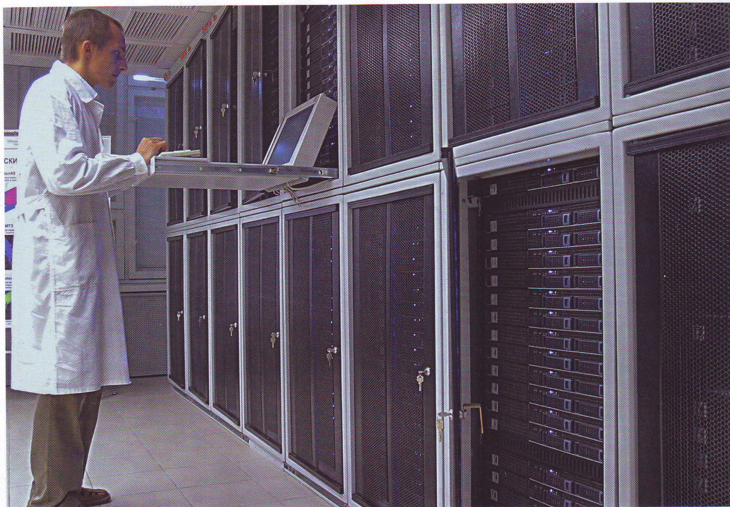
СУПЕРКОМПЬЮТЕР СКИФ К-1000, СОЗДАННЫЙ В ОБЪЕДИНЕННОМ ИНСТИТУТЕ ПРОБЛЕМ ИНФОРМАТИКИ НАЦИОНАЛЬНОЙ АКАДЕМИИ НАУК БЕЛАРУСИ, ВКЛЮЧЕН В СПИСОК СТА САМЫХ ВЫСОКОПРОИЗВОДИТЕЛЬНЫХ ВЫЧИСЛИТЕЛЬНЫХ СИСТЕМ В МИРЕ

два года во всех областных управлениях внутренних дел сформировали отделы криминальной милиции по борьбе с киберпреступностью. Результат не заставил себя ждать. Если за три года (с 1998 по 2000 год) было возбуждено только три уголовных дела, связанных с преступным использованием компьютерных технологий, то в 2001–2005 годах возбудили уже 1813 подобных дел.