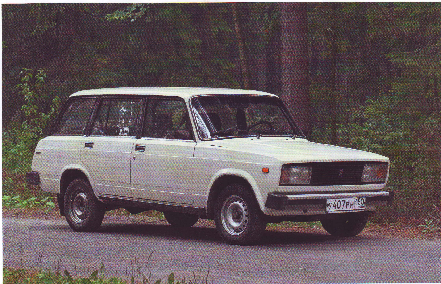
УНИВЕРСАЛ ВАЗ-2104 ПРИШЕЛ НА СМЕНУ ВАЗ-2102 В 1985 ГОДУ

Салон ВАЗ-2104 в стандартной комплектации был выдержан в том же спартанском стиле, что и салон базовой модели: скромная немаркая обивка из искусственной кожи, минимально необходимое количество приборов и напольные коврики из резины. В более дорогих комплектациях предлагалась панель приборов с центральной консолью, на которой располагались дополнительные функциональные клавиши и контрольная аппаратура. Рулевое колесо также было другим. А если добавить к этому тканую обивку кресел, цельноформованные накладки дверей, ворсистые коврики на полу, то получался просто роскошный по советским меркам автомобиль.