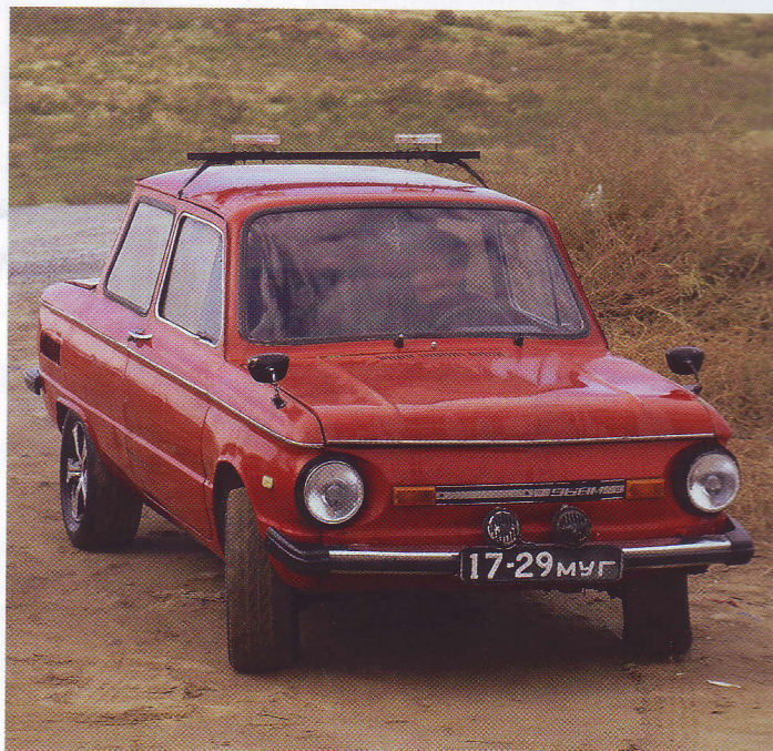
ВИТЕБСКИЙ МАНЬЯК ЧАСТО ИСПОЛЬЗОВАЛ В СВОИХ ПРЕСТУПЛЕНИЯХ АВТОМОБИЛЬ «ЗАПОРОЖЕЦ» КРАСНОГО ЦВЕТА

После первого преступления маньяк затаился и на новое дело решился только в октябре. Вторая попытка оказалась неудачной: жертва сопротивлялась, и сбежавшиеся на ее крики люди спугнули душителя. Однако это его не остановило, и в тот же день на окраине Витебска он задушил другую женщину.