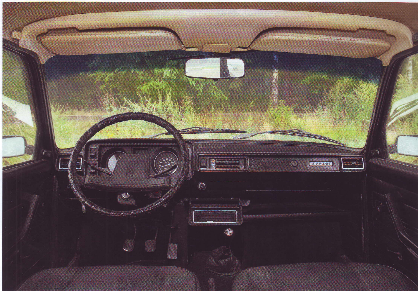
ПО СЕГОДНЯШНИМ МЕРКАМ САЛОН ВАЗ-2104 В ЛЮБОЙ КОМПЛЕКТАЦИИ ВЫГЛЯДИТ СКОРЕЕ ПРИМИТИВНЫМ, ЧЕМ ПРОСТЫМ

Кроме того, была разработана машина с дизельным двигателем объемом 1,5 л и 5-ступенчатой механической КПП, носившая индекс ВАЗ-21045Д. В серийное производство дизельная версия не пошла по чисто экономическим причинам: себестоимость такого автомобиля была намного выше, чем бензинового, а цена дизтоплива в СССР, а затем и в России, практически равнялась цене бензина. К тому же советское дизельное топливо было довольно низкого качества и поэтому не могло гарантированно обеспечивать стабильную работу мотора, особенно в зимний период, когда отечественный соляр с высоким содержанием парафинов на морозе превращался в желеобразную массу, напрочь забивавшую топливную систему. Всего же за время производства было создано более десятка различных версий «четверки».