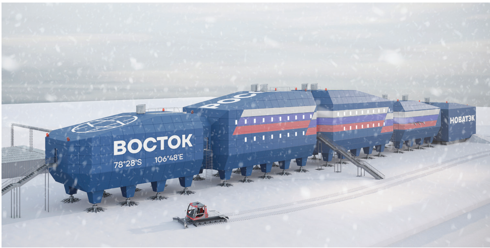
Новая станция «Восток».

Научно-исследовательское судно «Академик Фёдоров» 15 ноября вышло из Санкт-Петербурга в 68-ю Российскую антарктическую экспедицию. Для большинства средств массовой информации эта новость показалась такой скучной, что была ими проигнорирована. На деле же сделан важный ход в гигантской геополитической партии, на кону которой стоит обладание несметными запасами последней нескрытой «кладовой» человечества ■