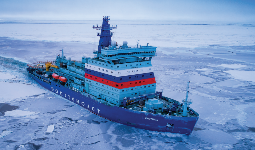
Ледокол «Арктика».