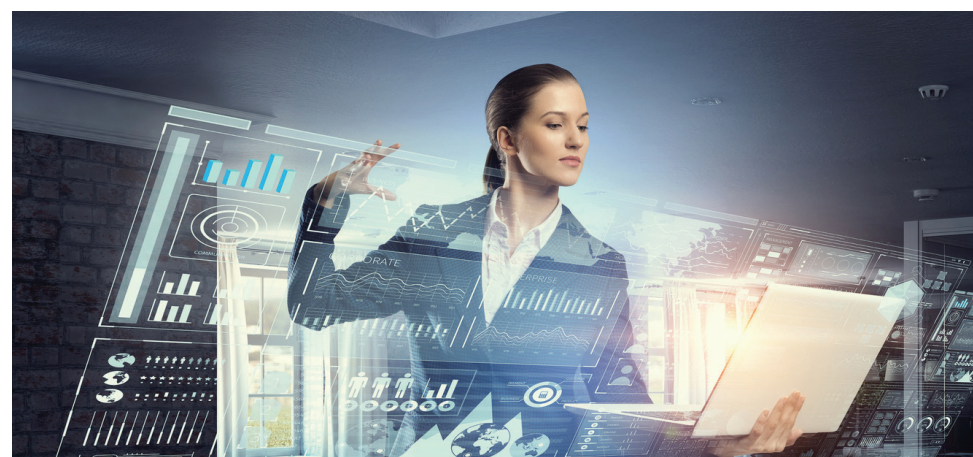
Коллаж: Сергей Нивенс

А также и крупнейшим поставщиком азотных удобрений. В этом году Россия побила исторический рекорд и намолотила 150 млн тонн зерна, что превосходит показатели всего СССР в его лучшие годы. Без сельхозсырья, продовольствия и удобрений России обеспечить глобальную безопасность просто невозможно. Как и без пресной воды, 20% мировых запасов которой также сосредоточены у нас.