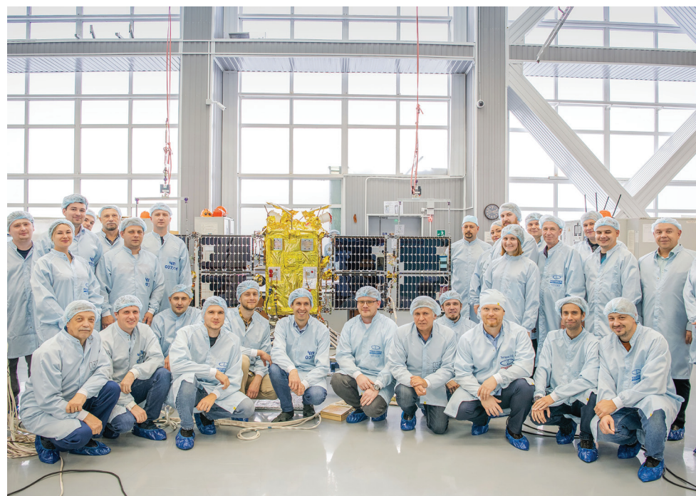
Они создают наше будущее — специалисты компании ИСС им. академика М.Ф. Решетнёва.