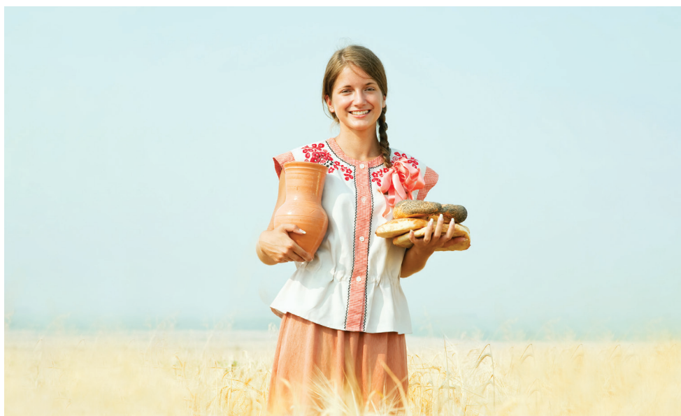
Еды хватит на всех.

До недавнего времени в мире одновременно существовали целых две сверхдержавы — США и СССР. После краха последней американцы какое-то время удерживали свой статус, но сегодня он подвергнут большому сомнению, и титул безоговорочной сверхдержавы остаётся вакантным. В этом году Россия установила один важный рекорд, приблизивший нас к этому званию ■