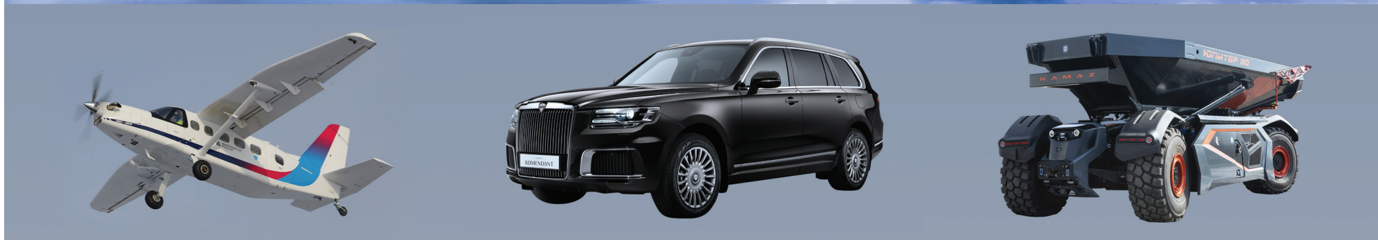
Слева направо: самолёт ЛМС-901 «Байкал», внедорожник «Аурус Комендант», самосвал «Юпитер»