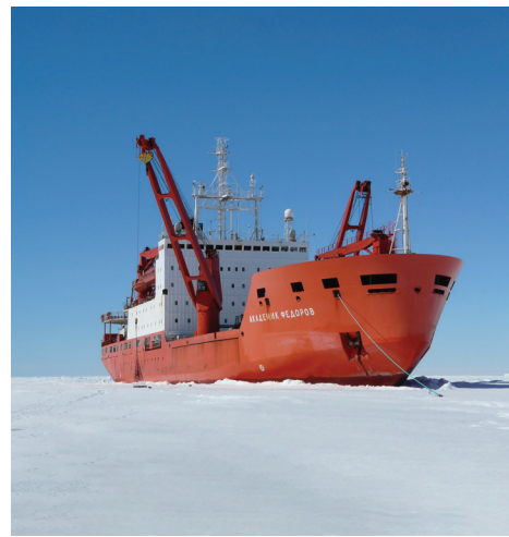
НЭС «Академик Фёдоров».

ВНИМАНИЕ прессы приковано к Арктике, которая становится очередной точкой геополитического противостояния, а вот про Антарктиду рассказывается крайне редко, хотя там кипят не меньшие страсти. В задачи новой экспедиции входит не только научная работа, но и продолжение строительства зимовочного комплекса на станции «Восток». Это грандиозное современное и сверхтехнологичное сооружение возводится в тяжелейших условиях на полюсе холода планеты, где была зарегистрирована самая низкая температура в истории наземных наблюдений — минус 89,2 градуса по Цельсию.