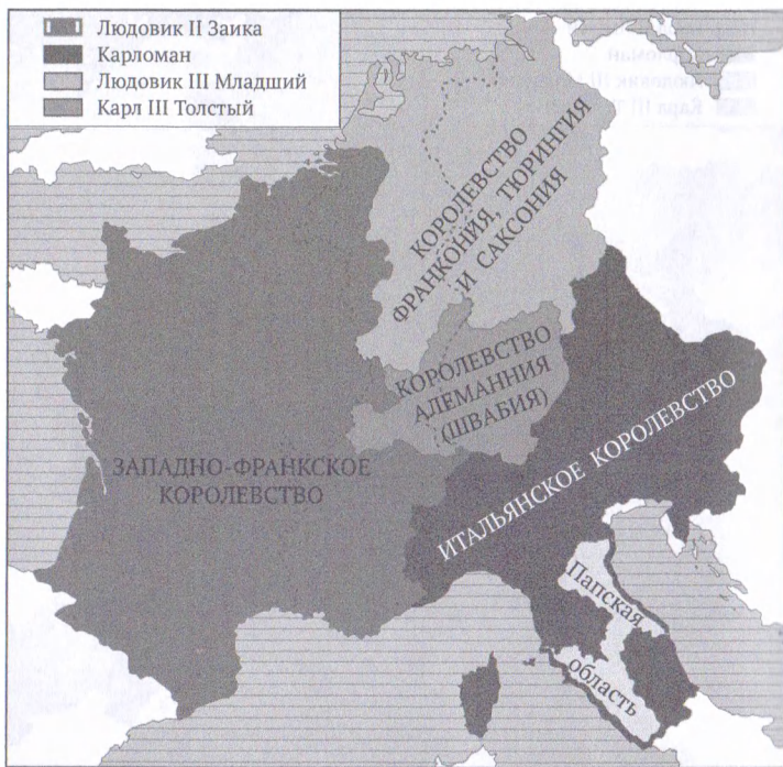
Франкская империя в 877 г.