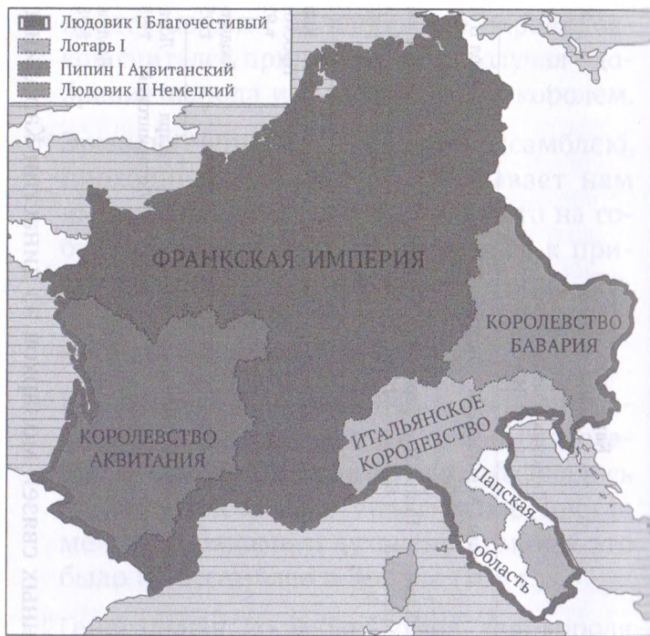
Франкская империя в 828 г.