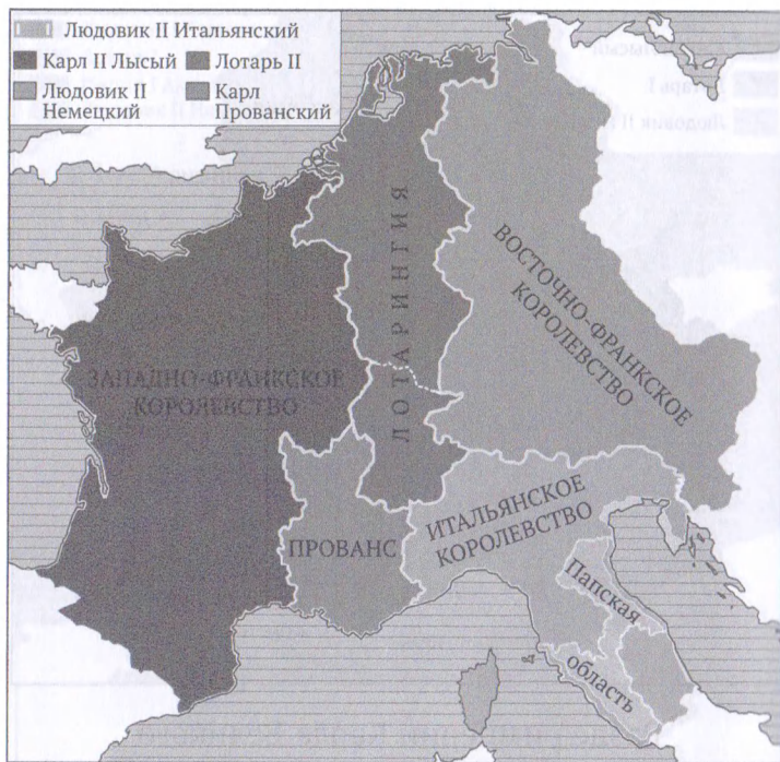
Франкская империя в 855 г.