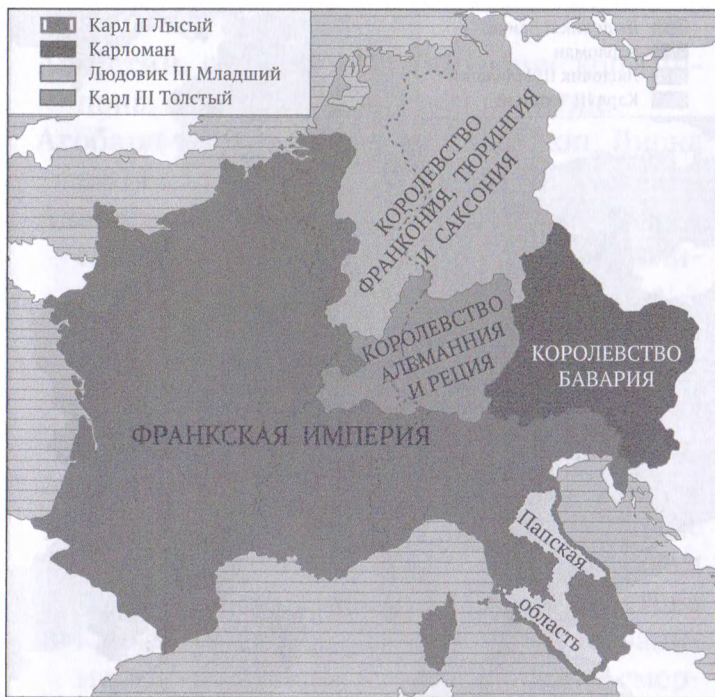
Франкская империя в 876 г.