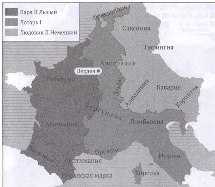
Раздел империи Карла Великого в соответствии с Верденским договором (843 г.)