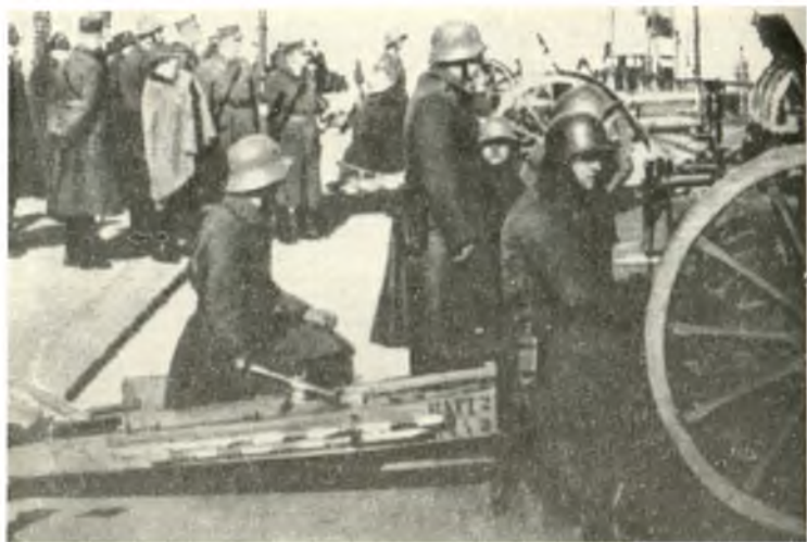
Энгельберт Дольфус рассматривает в бинокль результаты бомбардировки домов рабочих, совершенной по его приказу.