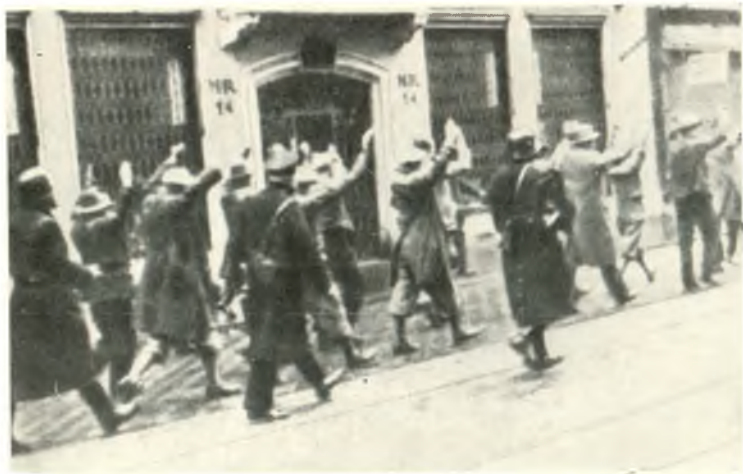
Полиция и солдаты конвоируют безоружных шуцбундовцев.