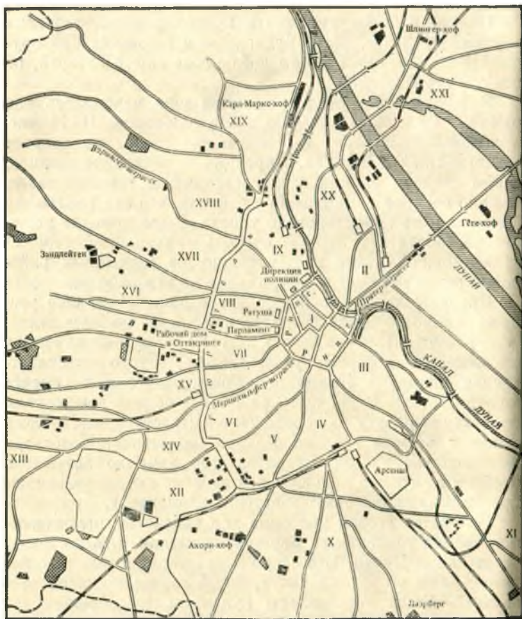
Схема Вены, 1934 г.

снова вернулись, но уже в стальных шлемах, сменив резиновые дубинки на карабины. До этого «внутренний город», в котором располагались федеральные органы и важнейшие правительственные учреждения, не имел