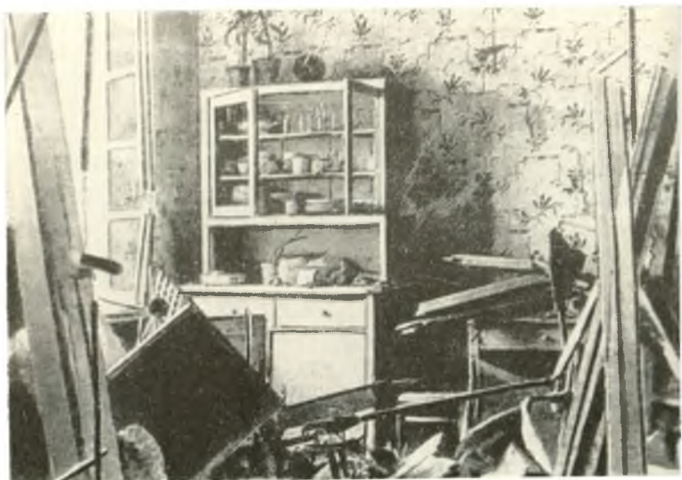
Квартира рабочего в Доме Гёте после обстрела.