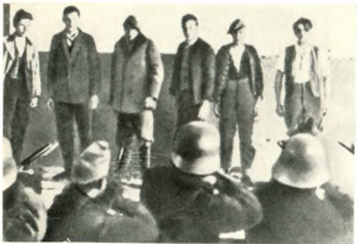
Расстрел карательным отрядом шуцбундовцев в Хольцлейтене (Верхняя Австрия)