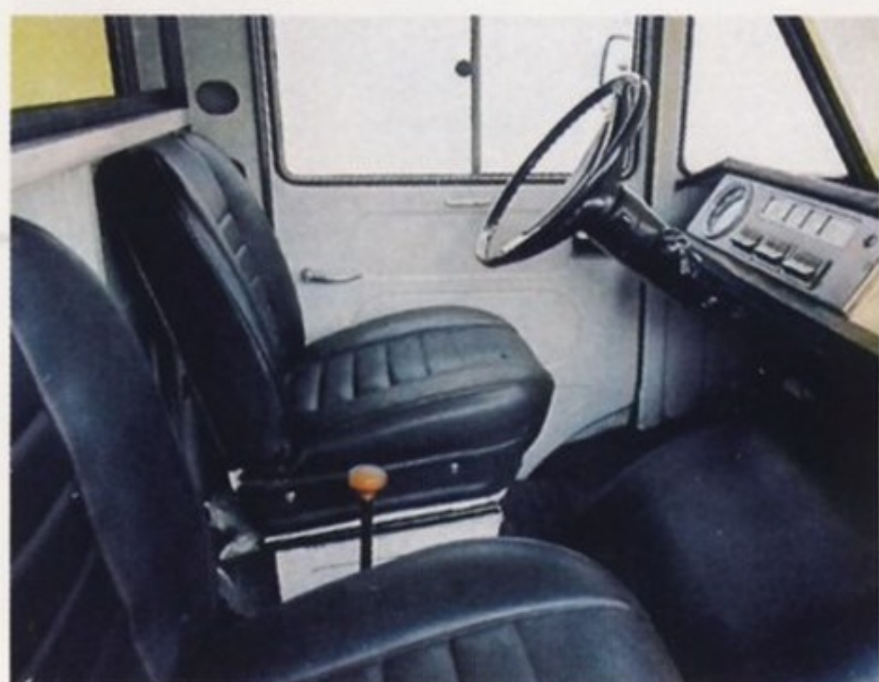
Кабина автомобиля Żuk

С ноября 1974 года на автомобилях ŻUK использовалась совершенно новая тормозная система — с вакуумным усилителем и двумя отдельными контурами, действующими на передние и задние колеса, а вместо прежнего стояночного тормоза, воздействующего на карданный вал, использовали «ручник» с приводом на задние барабанные тормозные механизмы.