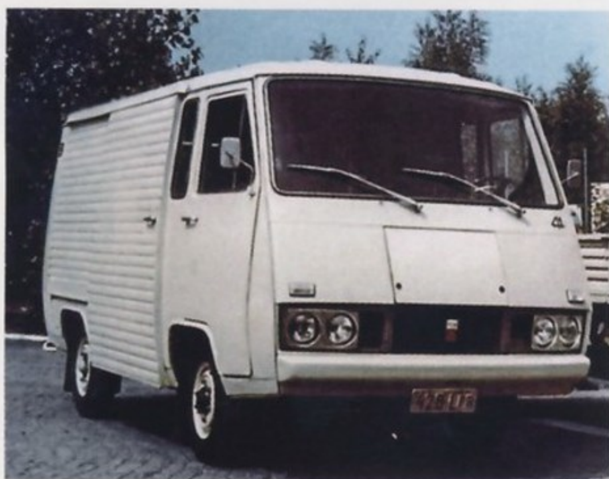
Опытный образец FSC 40

были склонны к перевороту, даже на относительно небольшой скорости).