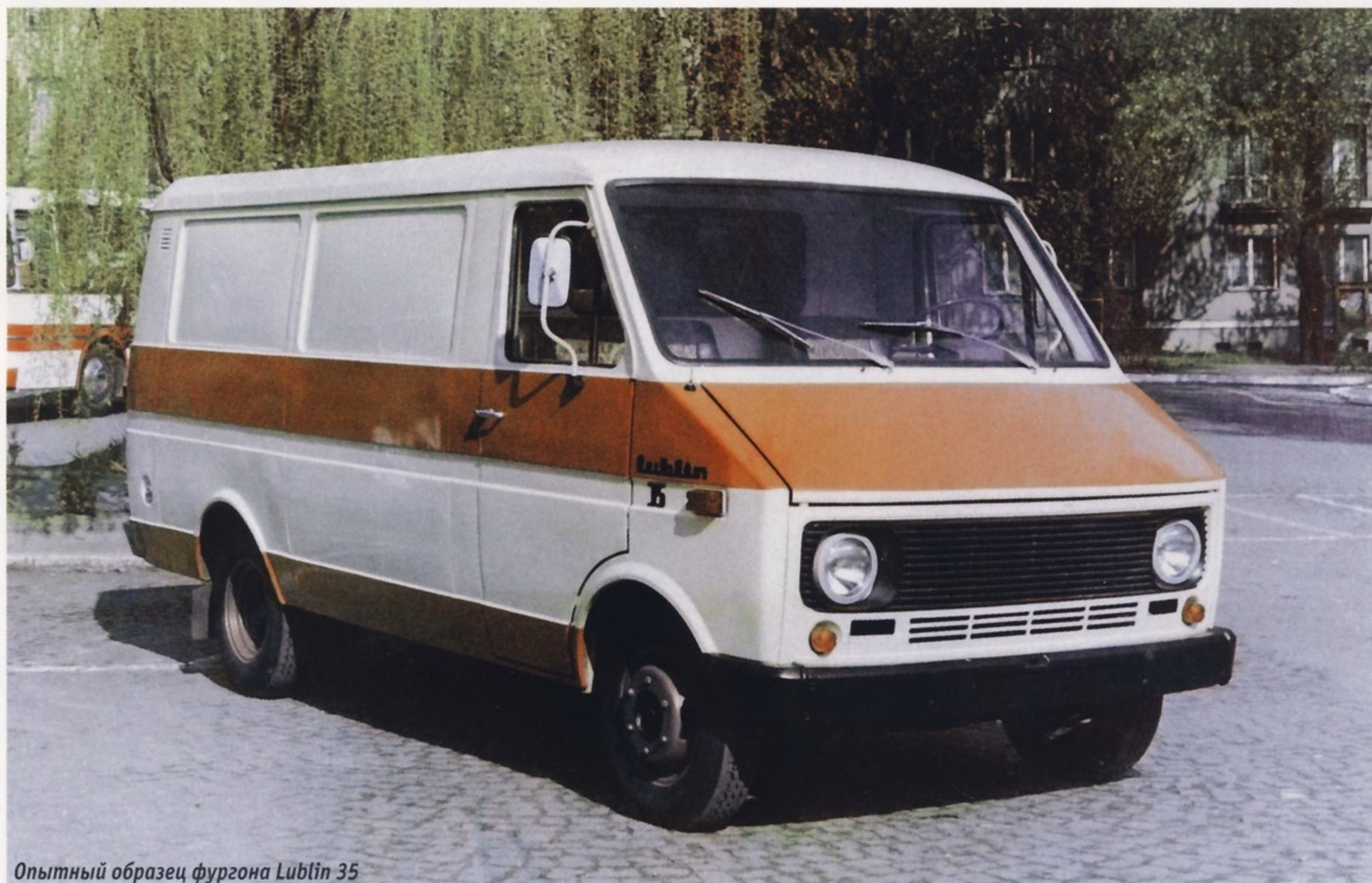
Опытный образец фургона Lublin 35

Примерно в это же время шла интенсивная работа над автомобилями с электрическим приводом. Совместно с Институтом электротехники и Центральной лабораторией батарей и элементов питания был создан малотоннажный бортовой грузовик модели FSC A32E , унифицированный с опытным «сороковым» семейством. На нем стоял электрический двигатель постоянного тока мощностью 22 кВт (30 л.с.) и тиристорная система управления. Поскольку аккумуляторные батареи имели массу 1200 кг, грузоподъемность самого автомобиля оказалась небольшой — всего 500 кг. Не впечатляла и его максимальная скорость — 60 км/ч. Следующая попытка создать современный малотоннажный грузовик на замену семейства «Жуков» относится ко второй половине 70-х годов. В это время были разработаны новые модели Lublin 25 (полная масса 2,5 т,