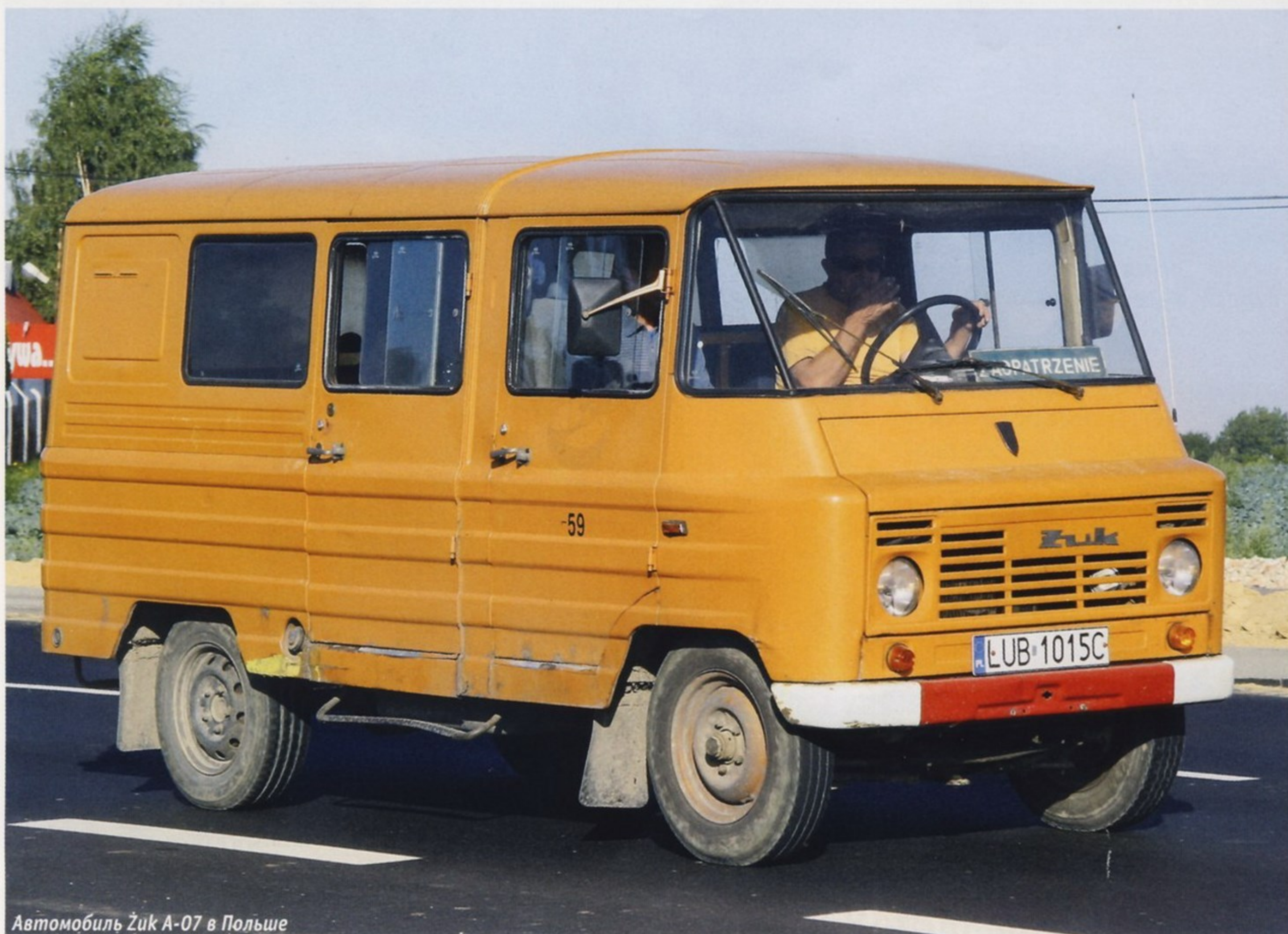
Автомобиль Żuk A-07 в Польше

С ноября 1974 года на автомобилях Żuk стала использоваться совершенно новая тормозная система — с вакуумным усилителем и двумя отдельными контурами, действующими на передние и задние колеса, а вместо прежнего стояночного тормоза, воздействующего на карданный вал, использовали «ручник» с приводом на задние барабанные тормозные механизмы. Перемены затронули двигатель S-21 (изменили систему смазки, поставили воздушный фильтр с «сухим» фильтрующим элементом и новый карбюратор), шасси