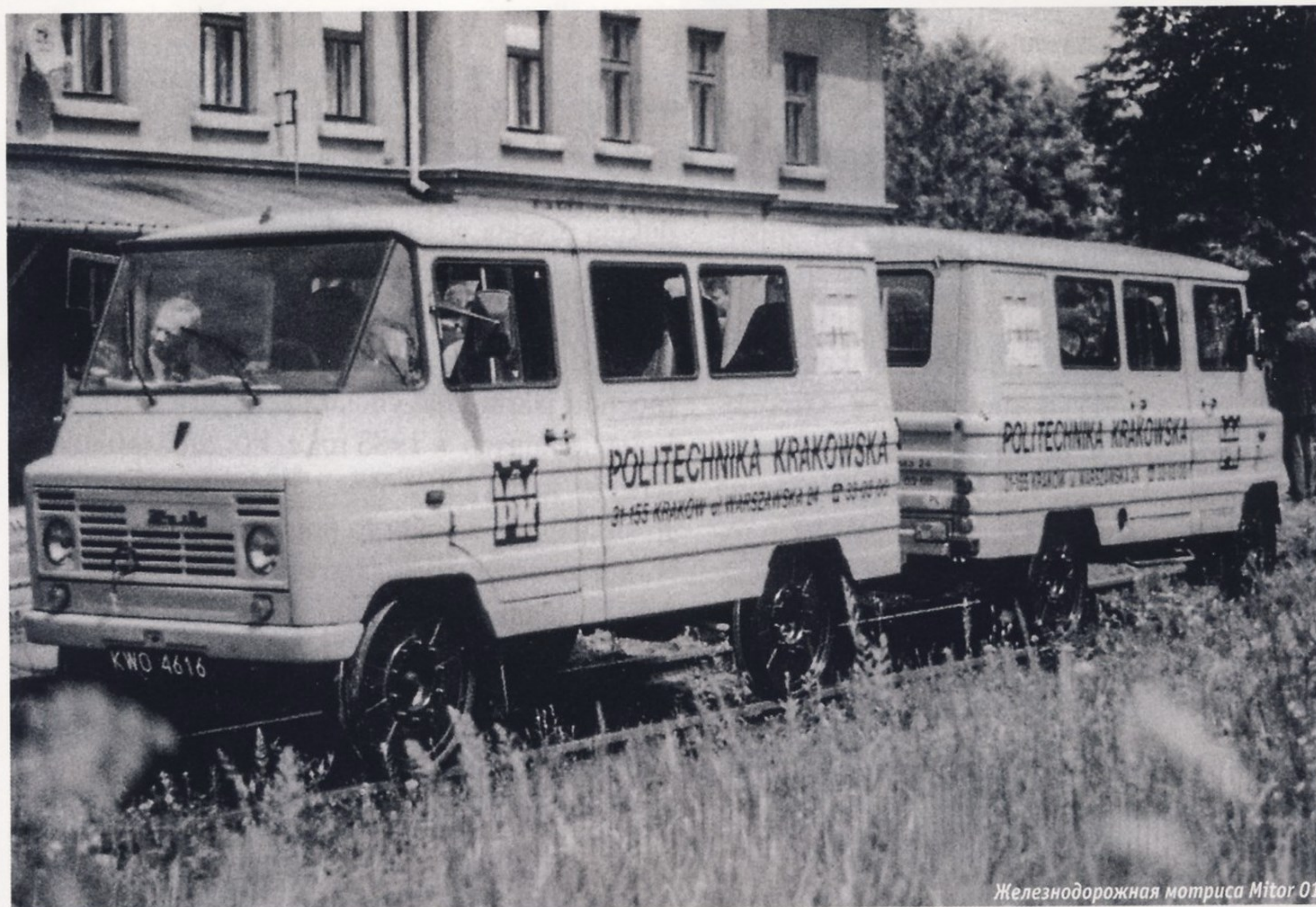
Железнодорожная мотриса Mitor 01