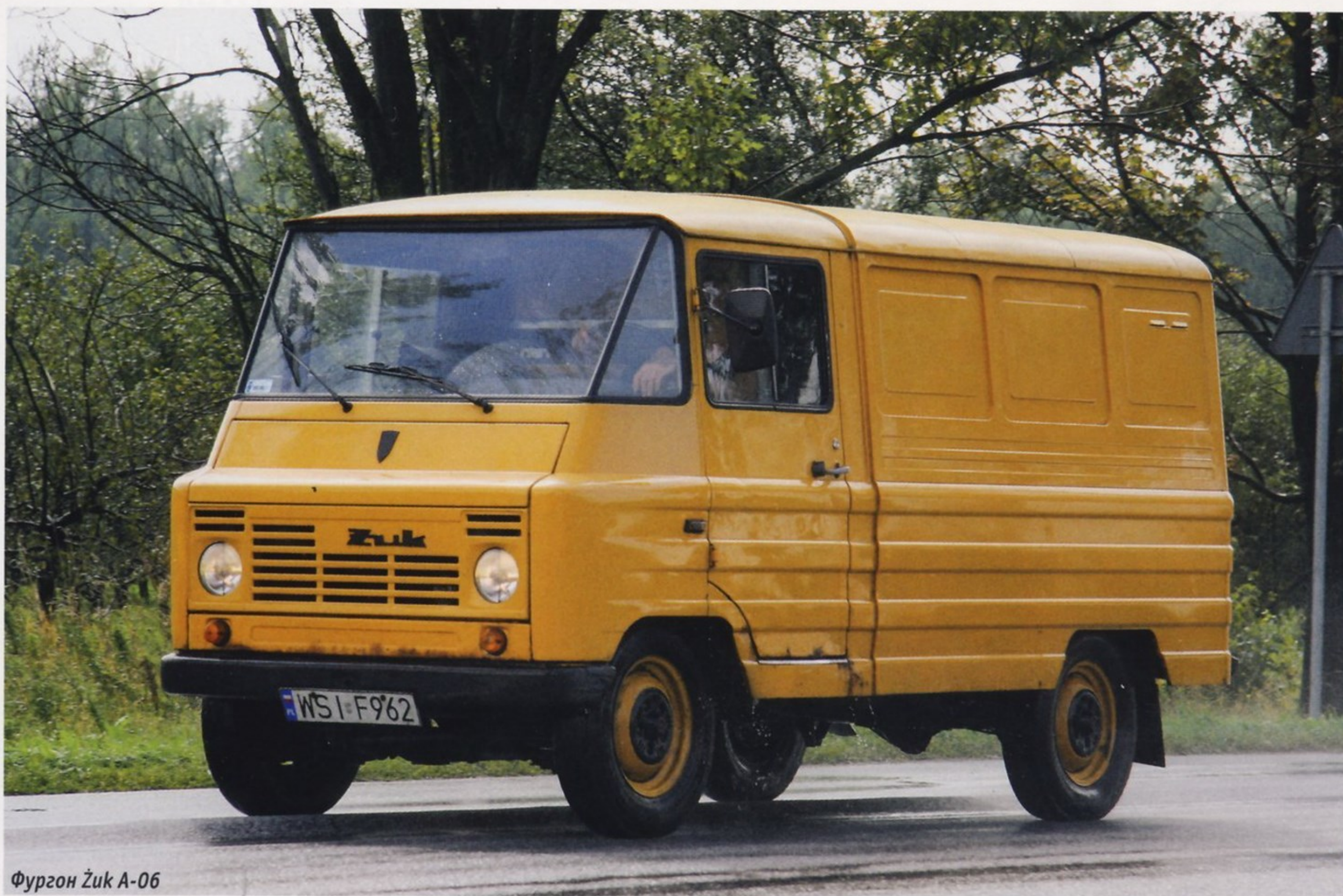
Фургон Żuk A-06

Żuk A-13 от Żuk A-03 практически невозможно. Зато благодаря более мощному силовому агрегату машина стала динамичнее — максимальная скорость поднялась с 80 до 95 км/ч (иногда максимальную скорость в технических характеристиках округляли до «красивой» цифры — 100 км/ч). В 1967 году новым мотором стал комплектоваться бортовой грузовик Żuk A-11