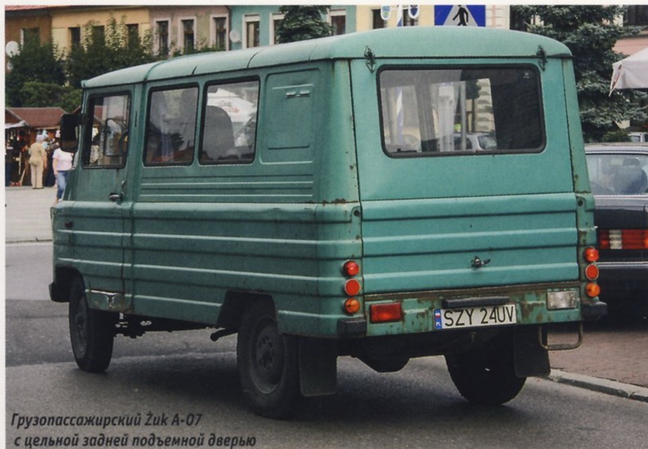
Грузопассажирский Żuk A-07 с цельной задней подъемной дверью

Такая схема задних дверей на развозных фургонах и автомобилях с кузовом «универсал» была популярна в 50–60-х годах, но позже от нее отказались, поскольку она была неудобной в эксплуатации. Даже удивительно, что на «Жуках» эти двери продержались до 1998 года, хотя была возможность заказать для машины цельную подъемную дверь в виде опции.