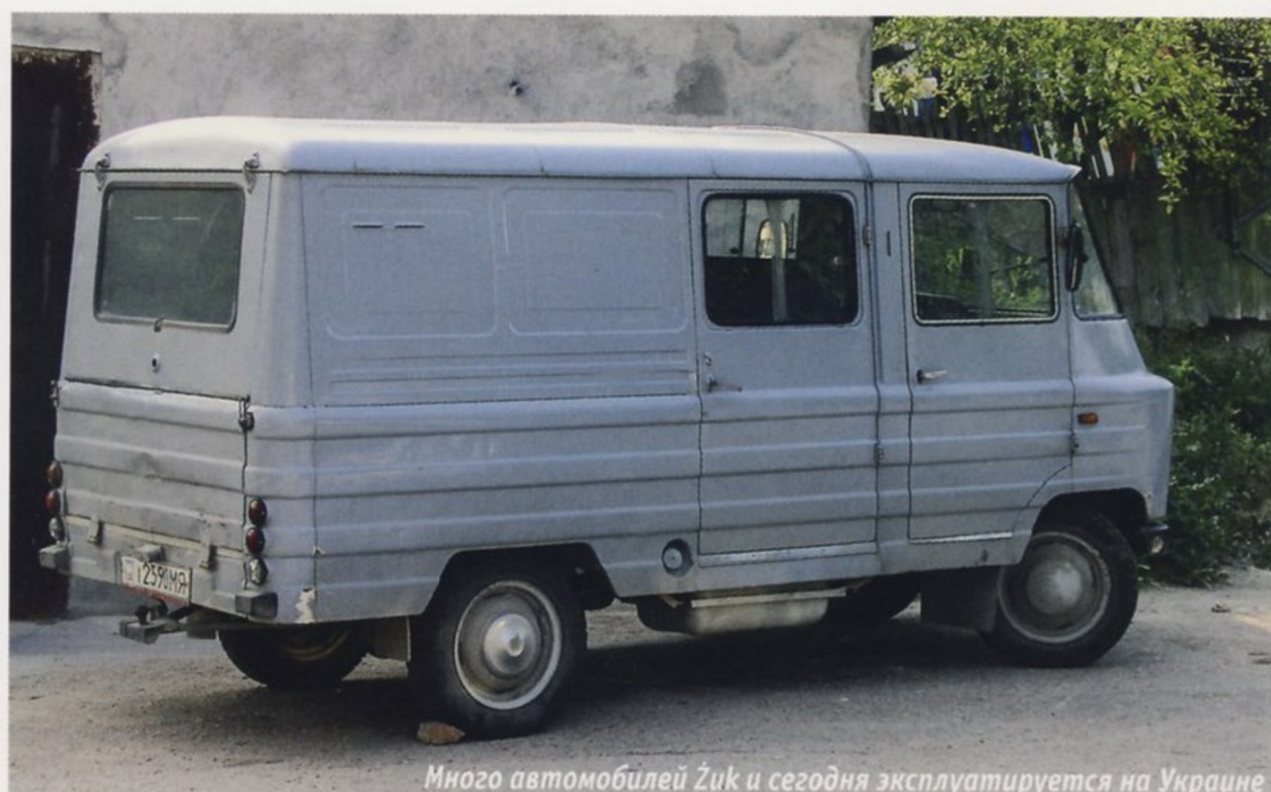
Много автомобилей Żuk и сегодня эксплуатируется на Украине