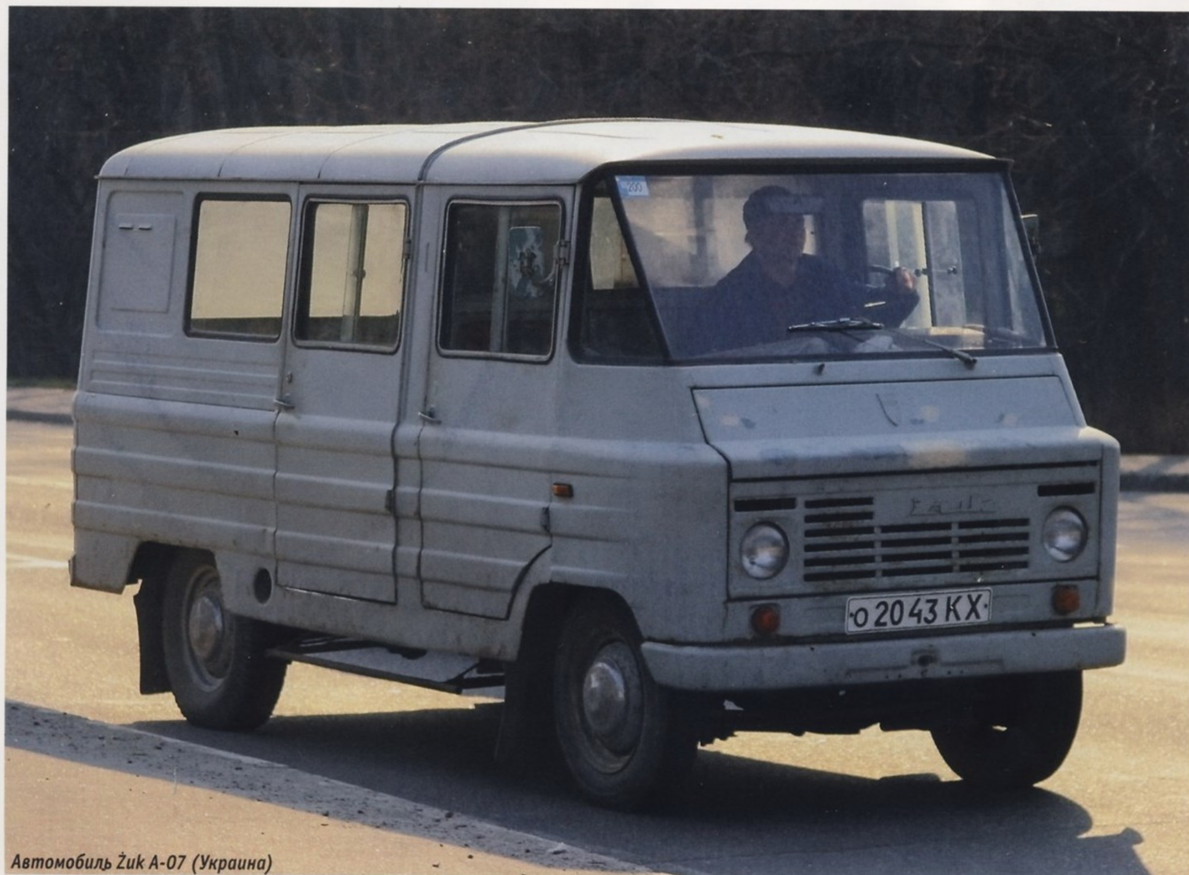
Автомобиль Żuk A-07 (Украина)

годы счет шел уже на тысячи, но отношение к этим машинам поначалу было неоднозначным. С одной стороны, они базировались на знакомой отечественным автомобилистам агрегатной базе (в основу «Жуков» была положена польская копия советской «Победы»), были неприхотливы в эксплуатации и хорошо приспособлены к плохим дорогам, поскольку предназначались для польских фермеров. С другой, обладали множеством врожденных недостатков. Вот нелестное заключение экспертов НИИАТ (Научно-исследовательского института автомобильного транспорта) по автомобилям марки Żuk: «Не рекомендован для эксплуатации в СССР из-за дефектов, выявленных при испытаниях (неудовлетворительная обзорность, неудовлетворительная работа амортизаторов, поломка зубьев шестерен коробки передач, кузов не обеспечивает сохранность перевозимых грузов)». Возможно, это несколько предвзятое мнение, тем более что при модернизации в начале 70-х годов многие из перечисленных выше недостатков были поляками