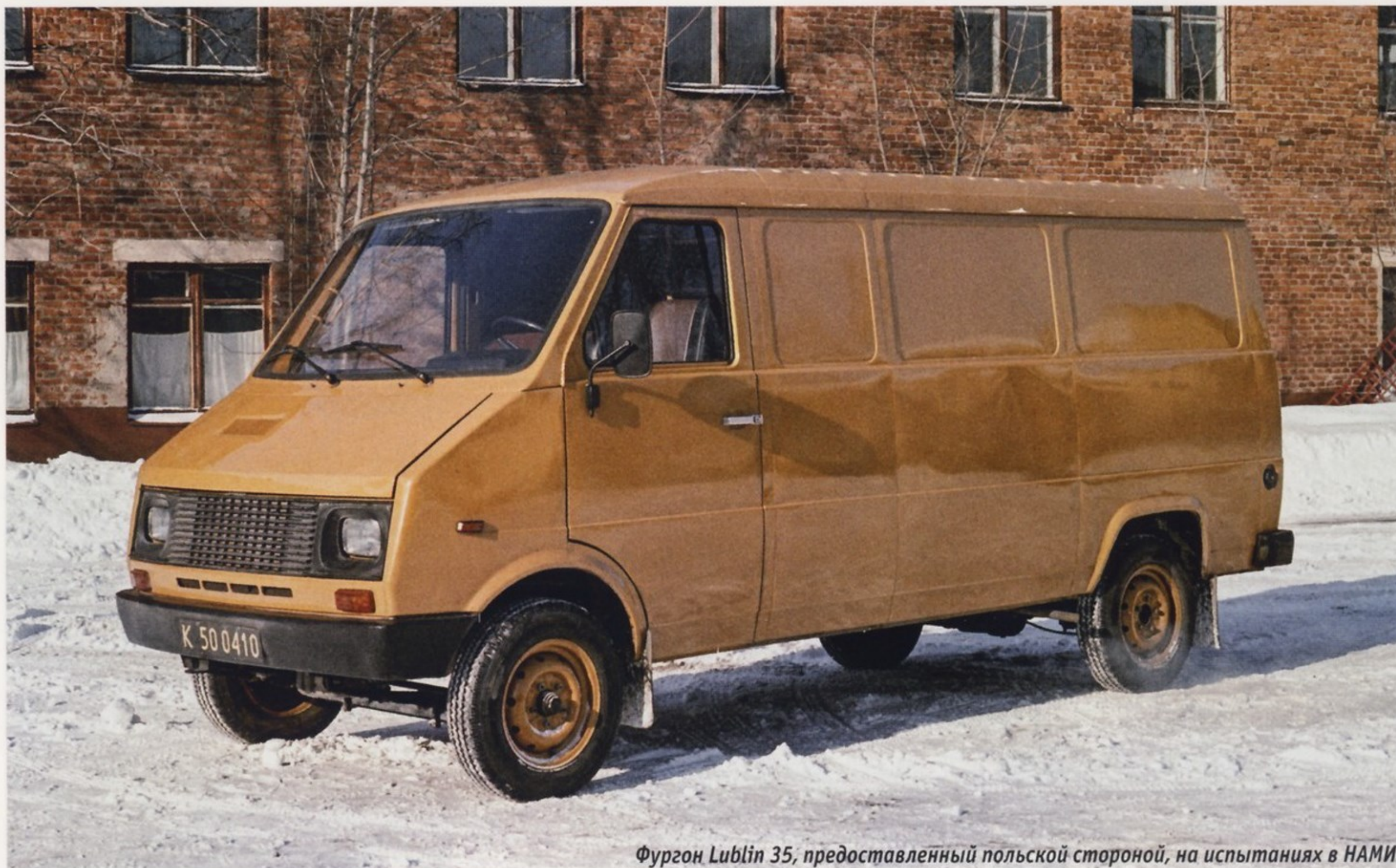
Фургон Lublin 35, предоставленный польской стороной, на испытаниях в НАМИ

Для движения по рельсам обычные колеса «Жука» заменили специальными железнодорожными колесами с ребордами, благо колея автомобиля практически совпадала с европейской железнодорожной колеей