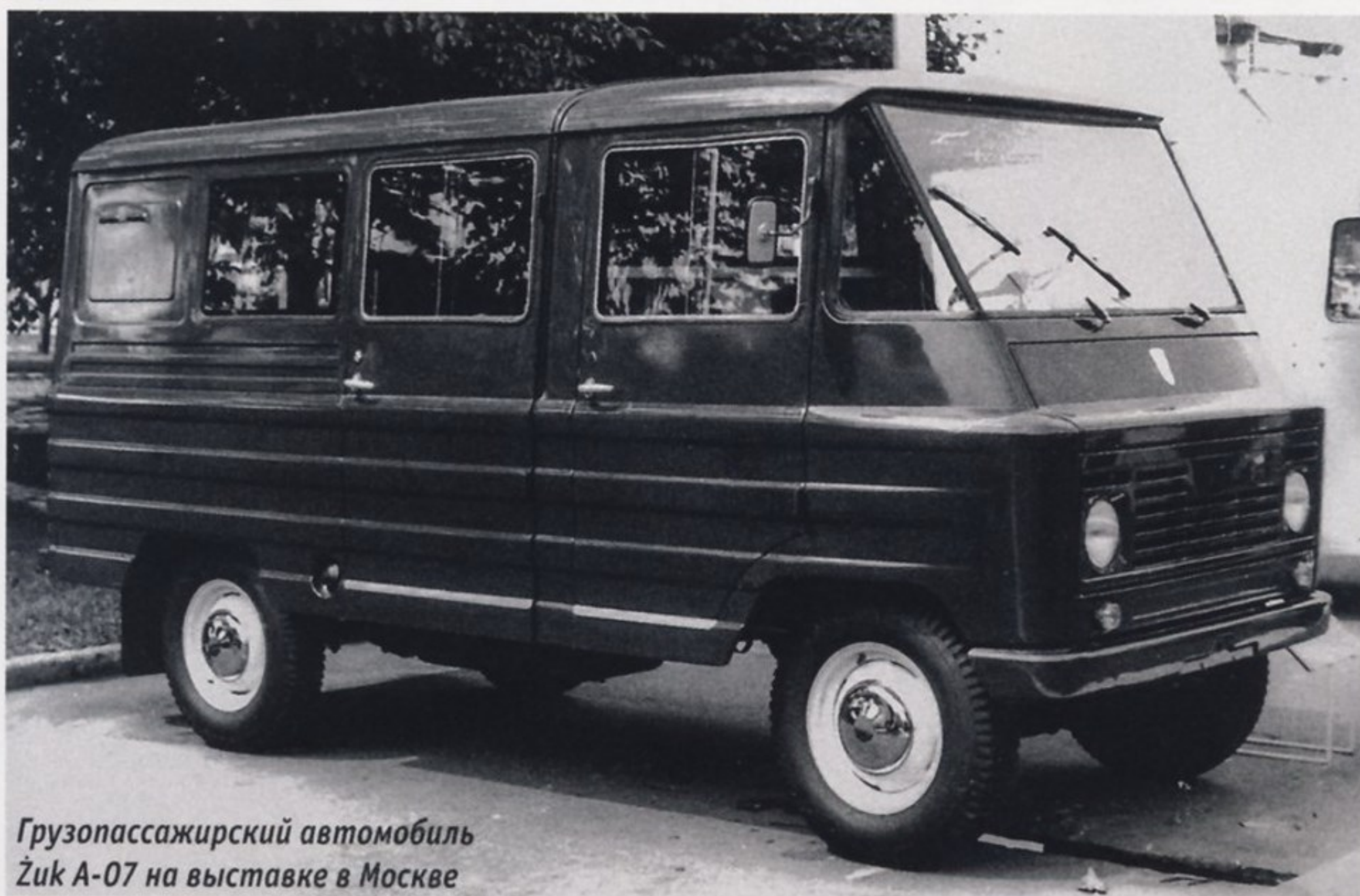
Грузопассажирский автомобиль Żuk A-07 на выставке в Москве

Главная особенность нового передка — увеличенный капот, который был призван облегчить доступ к двигателю. Дело в том, что у «Жуков» предыдущего поколения был очень узкий капот и после установки нового двигателя S-21 подобраться к его навесным агрегатам для ремонта или обслуживания стало практически невозможно. Модернизированные машины также получили увеличенное по высоте ветровое стекло и стеклоомыватели. В кабине появились места для крепления ремней безопасности и новый обогреватель с двумя независимыми вентиляторами. Впервые обновленные автомобили показали на Международной ярмарке в Познани в 1972 году, а в следующем году они были