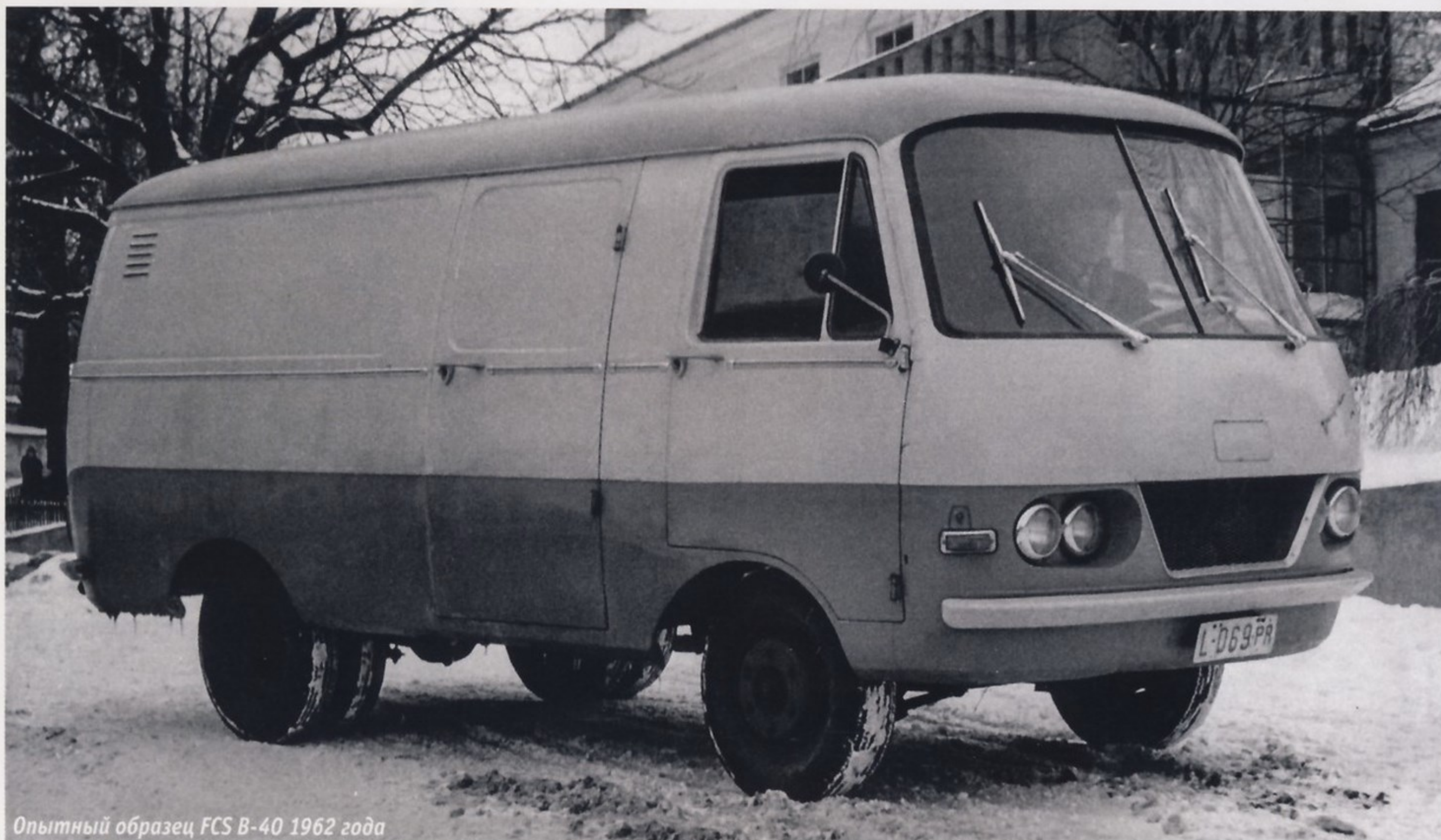
Опытный образец FCS B-40 1962 года