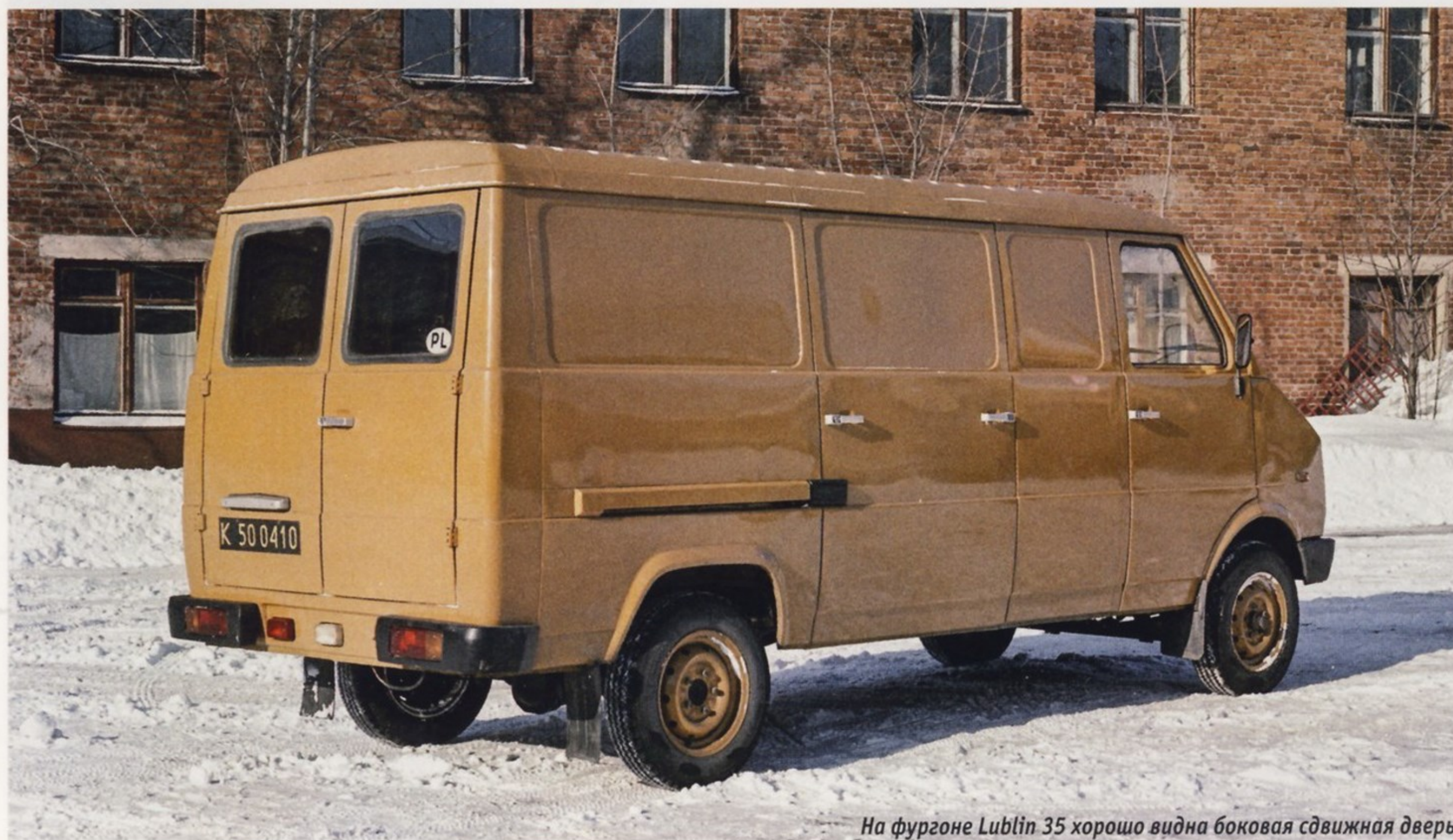
На фургоне Lublin 35 хорошо видна боковая сдвижная дверь

Mitor 01 успешно прошла предварительные испытания на линии Tarnow-Szczucin, но польские железнодорожные власти не проявили интереса к этому проекту, и он так и не был реализован.