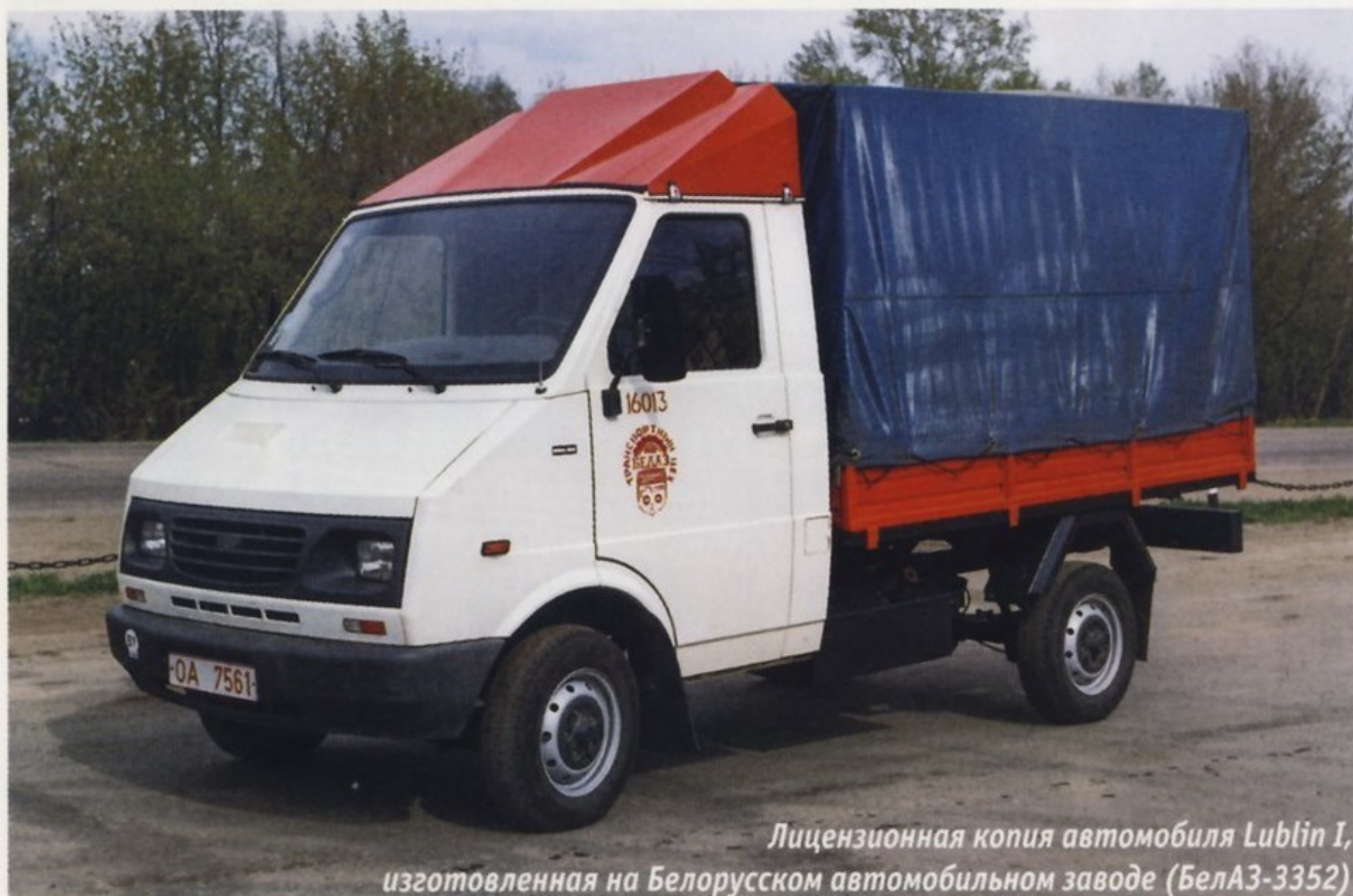
Лицензионная копия автомобиля Lublin I , изготовленная на Белорусском автомобильном заводе (БелАЗ-3352)

В 1995–1996 годах собственником польского завода FSC стала южнокорейская компания Daewoo Corporation , создавшая совместное предприятие Daewoo Motor Polska . После прихода новых владельцев все семейство автомобилей Lublin было еще раз модернизировано. Машины Lublin II стали оснащаться передними дисковыми тормозами, немного изменился дизайн кабины и элементы салона. В 2004 году в Белоруссии сделали попытку вернуться к производству польских грузовиков на своей территории, теперь уже серии Lublin II . Сборка автомобилей из польских машинокомплектов была организована на автосборочном заводе в поселке Обчак под Минском. Но и эта попытка не увенчалась успехом.