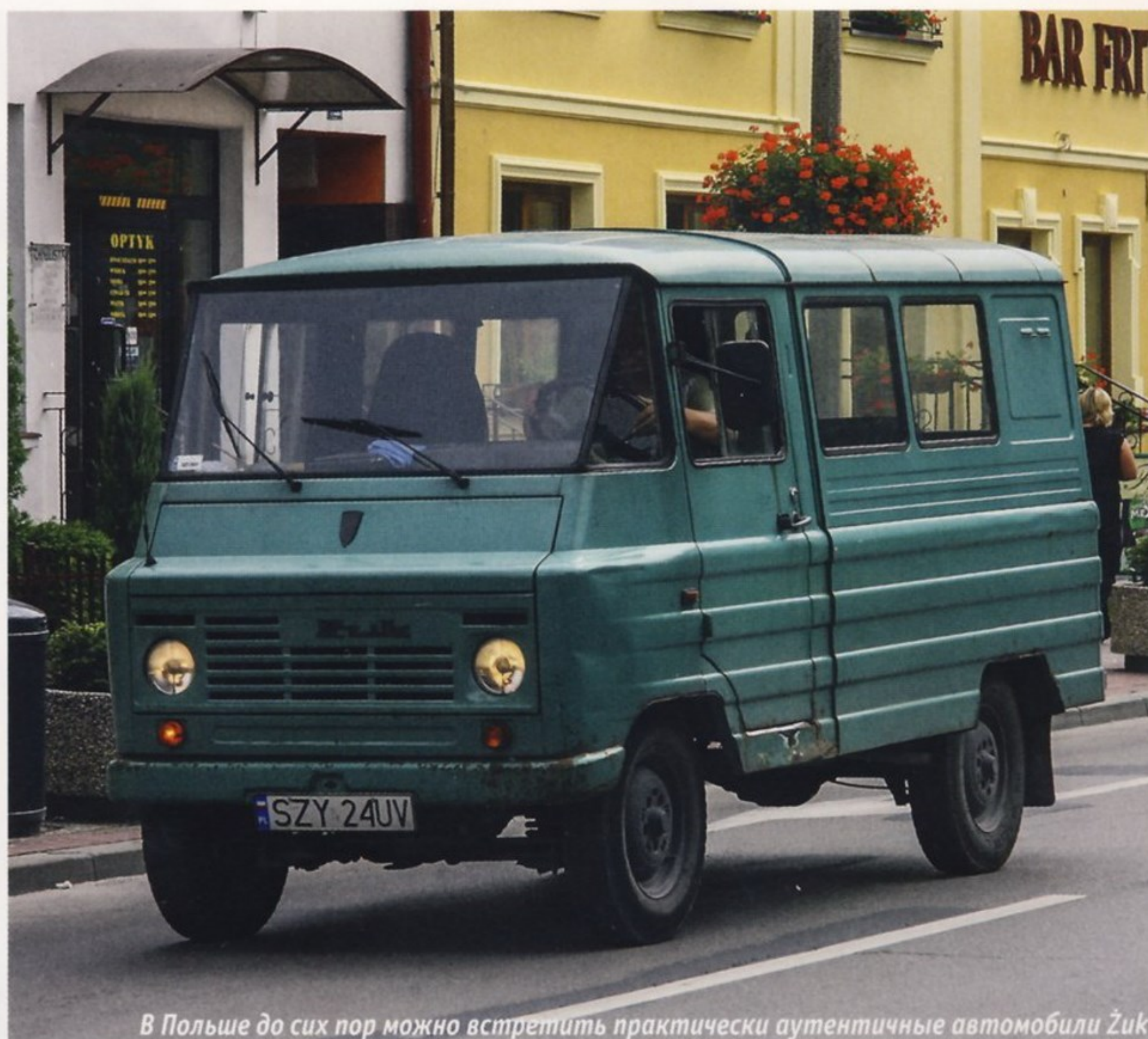
В Польше до сих пор можно встретить практически аутентичные автомобили Żuk

Силовая передача состояла из однодискового сцепления, трехскоростной коробки передач с синхронизаторами на второй и третьей передачах и заднего ведущего моста с конической главной передачей. Рулевое управление сконструировали в виде глобоидальной передачи, в которой червяк взаимодействует с двойным роликом. Передние колеса имели независимую подвеску на винтовых пружинах с телескопическими гидравлическими амортизаторами двустороннего действия и поперечным стабилизатором, уменьшающим наклоны и боковую раскачку кузова в поворотах. Задний ведущий мост подвешивался на продольных полуэллиптических рессорах, работающих совместно с гидрав-