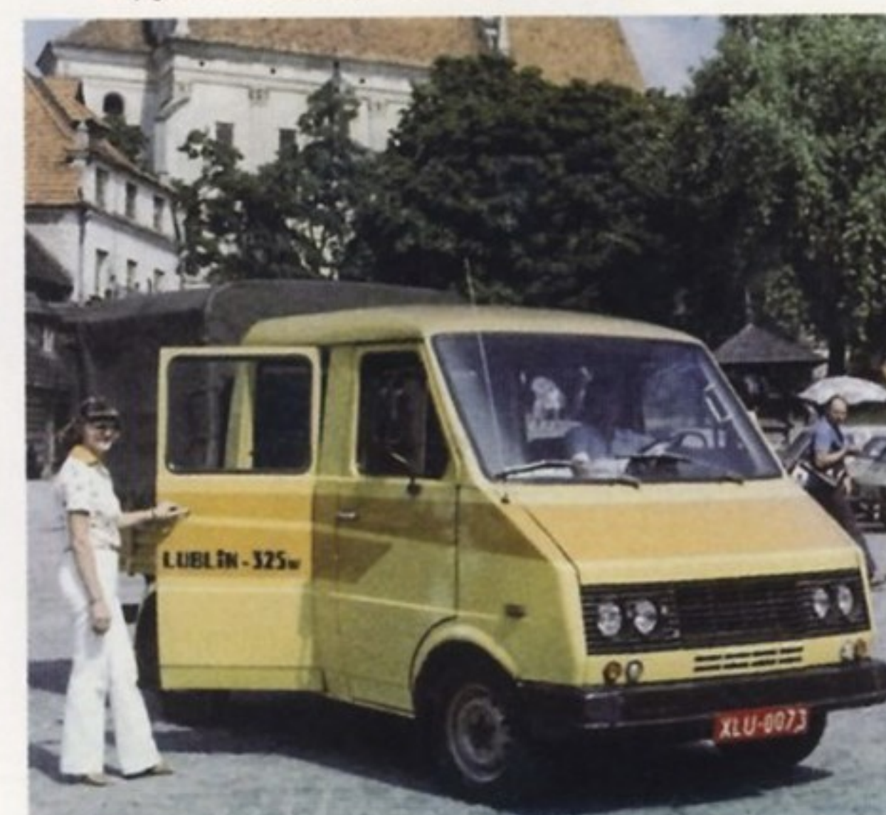
Грузопассажирский автомобиль Lublin 325w

в противоположные стороны. Это позволяло легко использовать мотрису для движения в любом направлении, не разворачивая ее. При этом во время движения один из «Жуков» действовал как локомотив, а второй — как прицепной вагон.