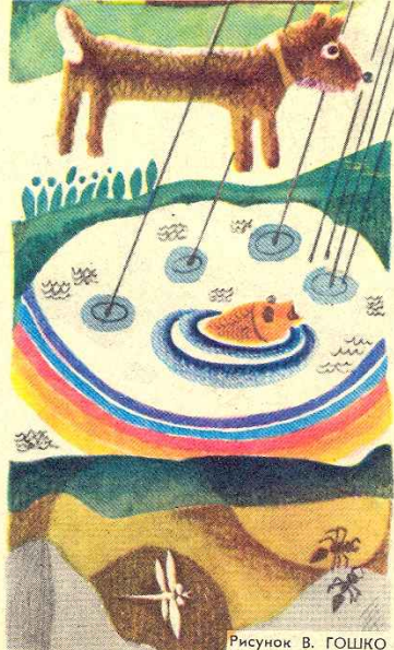
Рисунок В. ГОЛШКО

Во дворе Трещит мотор, В конуре Рычит Трезор. Дождь шуршит, Грохочет гром — Буква «эр» Звучит кругом!