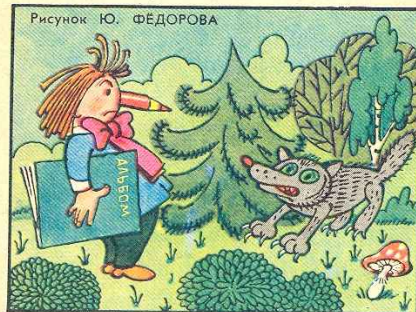
Рисунок Ю. ФЕДОРОВА

Я сегодня Рано встал. Рот раскрыл, Загрохотал: — Трррракторрр. Грррач. Порррттрррет. Игррра. Рррадость. Рррадуга. Ура!