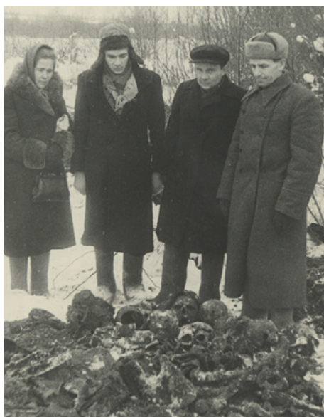
Эксгумация жертв «тайлькоманды» у деревни Жестяная Горка. 1947 г.