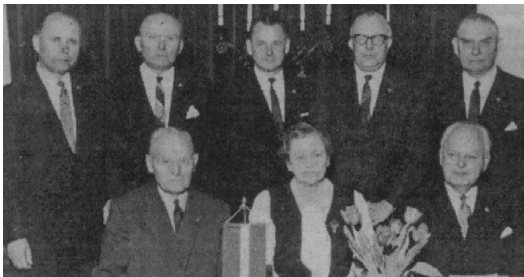
Члены правления организации «Даугавас ванаги», 1969 г.

В 1969 г. члены правления латышского ветеранского общества «Даугавас ванаги» сфотографировались для истории. Опубликованная в одной из эмигрантских газет протокольная фотография на первый взгляд выглядит довольно скучно. За украшенным одиноким латышским флажком столом сидят два пожилых мужчины и одна женщина, позади них выстроились еще пятеро мужчин. Все в костюмах и галстуках, на лацканах — памятные значки «Даугавас ванаги». Вопреки обычной практике, имена членов правления под фотографией не написаны, и это не случайно — увековеченным на фотографии людям было что скрывать.