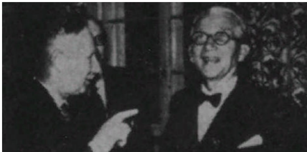
В кулуарах заседания «Даугавас ванаги» в Лондоне «глава латвийской дипломатии в изгнании» Карлис Зариньш по-дружески беседует с Вилисом Янумсом. 1956 г.

тивников ЦРУ, получив криптоним «ALLEYCAT-14». Судя по документам, несомненная причастность Штиглица к массовым убийствам интереса у ЦРУ не вызвала, в отличие от информации о его оперативных возможностях. «В Риге имел в своем распоряжении 2000 полицейских и осведомителей. До сих пор поддерживает связь со многими из них: в Германии, России, Латвии и Финляндии. Имеет своих людей в Москве, однако в настоящее время не активен», — записал ведущий Штиглица сотрудник ЦРУ. Судя по всему, полицейский оказался полезен американской разведслужбе; с 1961 г. он переехал в США.