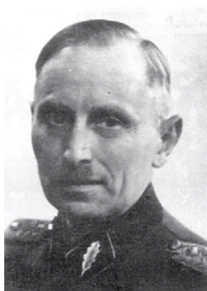
Вилис Янумс в форме СС, 1944 г.