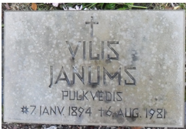
Могила Вилиса Янумса в Риге.