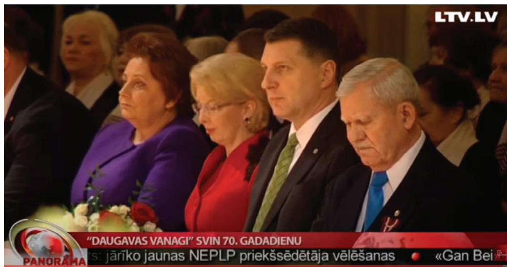
Торжественное заседание по случаю 70-летия «Даугавас ванаги». Спикер Сейма Латвии Инара Мурниеце, справа от неё — Раймонд Вейонис. 2015 год.

Представляется интересным современное положение организации «Даугавас ванаги». Несмотря на то, что подавляющее большинство ветеранов Латышского легиона СС уже умерло, организация продолжает активно действовать. «Даугавас ванаги» активно поддерживают ежегодное празднование т.н. «дня легионеров» 16 марта. Так, например, в Риге традиционным организатором шествия легионеров СС и их молодых сторонников выступает лимбажское отделение «Даугавас