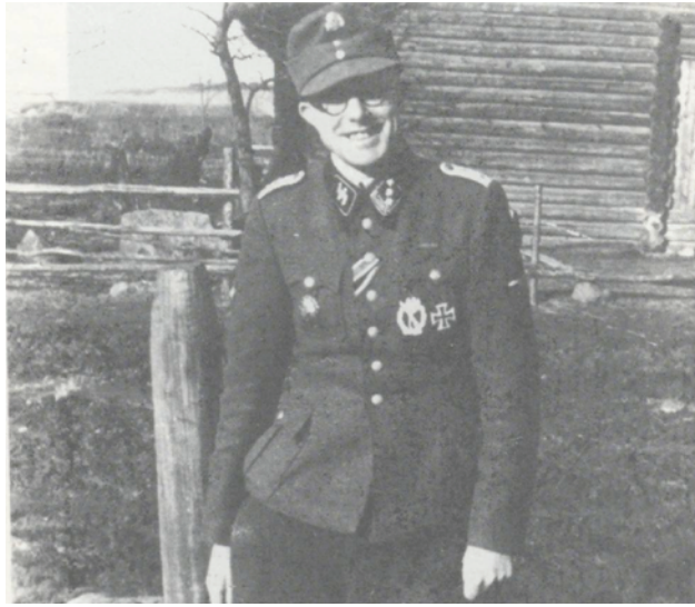
Вилис Хазнерс в форме СС, 1944 г.