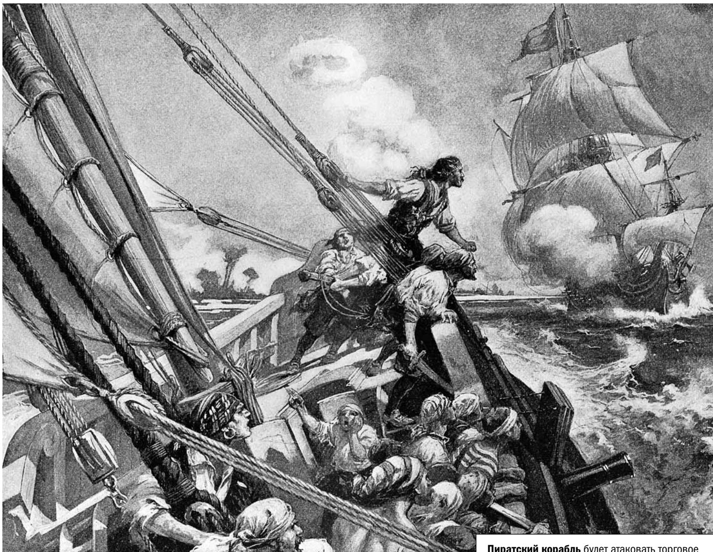
Пиратский корабль будет атаковать торговое судно. Команда сгрудилась на носу, готовая к abordажу

пираты шли на abordаж или на штурм, то, по свидетельству одного английского моряка, «это было похоже на нашествие крыс». Захватив пленных, пираты пытали их, чтобы выведать имущество и назначить соответствующий выкуп. Если население города или экипаж корабля оказывали упорное сопротивление, пираты никого не щадили. В таком случае они должны были отрубать головы всем подряд и приносить их капитанам, получая награду, так сказать, поголовно.