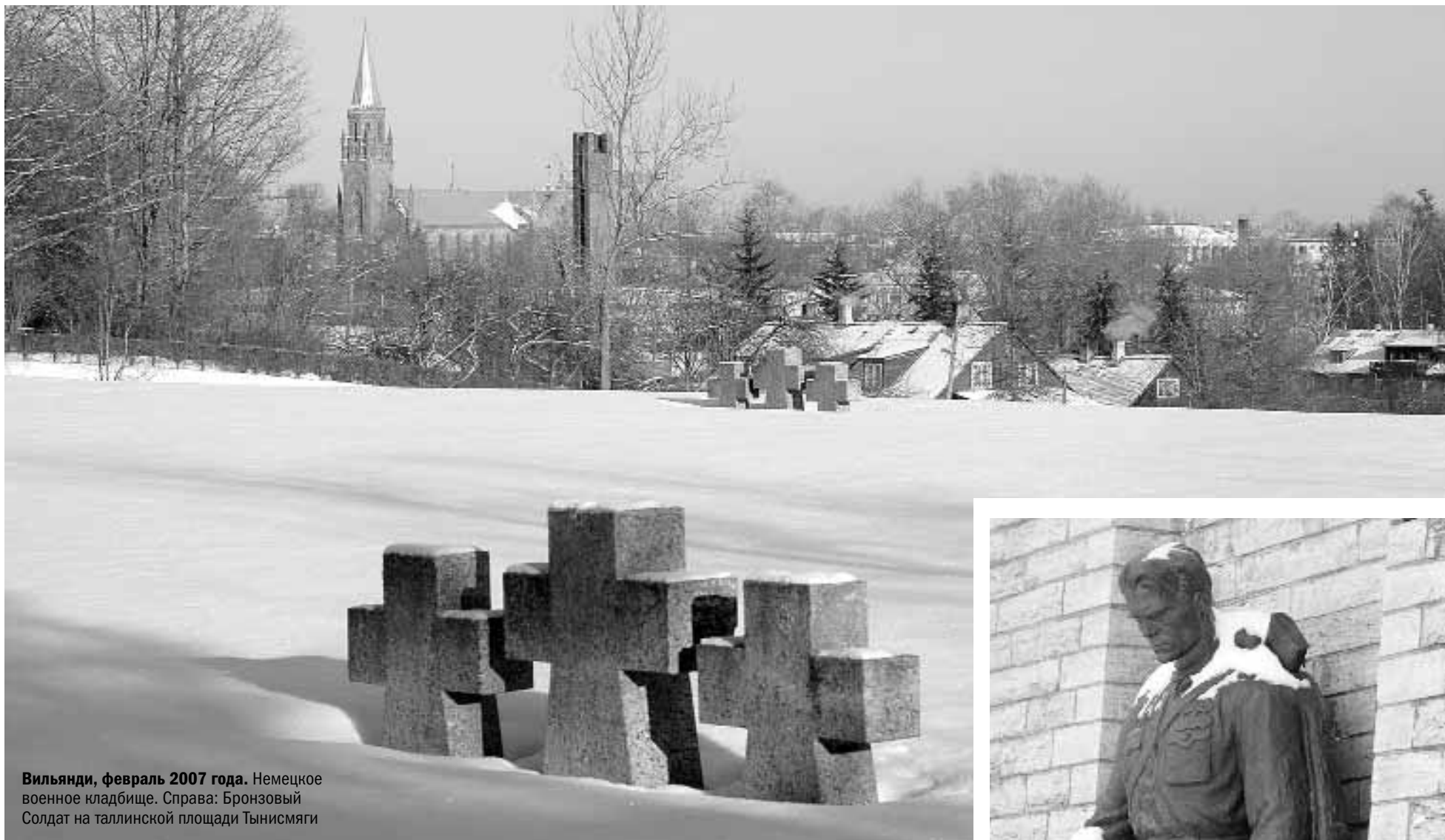
Вилянди, февраль 2007 года. Немецкое военное кладбище. Справа: Бронзовый Солдат на таллинской площади Тынисмяги