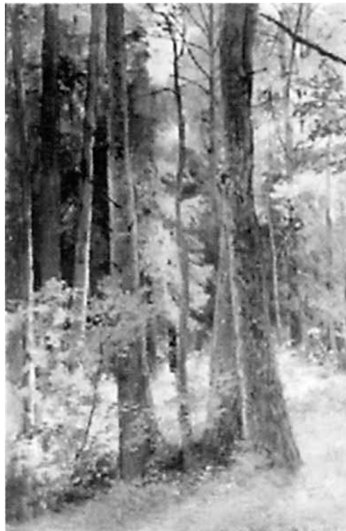
И. Шишкин. «Ели, освещенные солнцем», 1897 год. Похищена из Тюменского областного музея изобразительных искусств

Таможенный кодекс России были внесены соответствующие поправки. «Какое раньше мнение бытовало о коллекционерах? Правильно — мол, это жулики и фарцовщики, — говорит Анатолий Вилков. — На самом деле коллекционер — это человек, который в конце концов захочет поделиться своими сокровищами с другими. И государство идет ему сейчас навстречу. Мэр Москвы, к примеру, выделил обладателю богатой коллекции Давиду Якобашвили здание на Солянке. Ви-