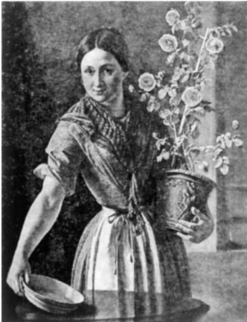
В. Тропинин. «Девочка с горшком роз», 1850 год. Пропала из Алупкинского дворца с выставки Русского музея