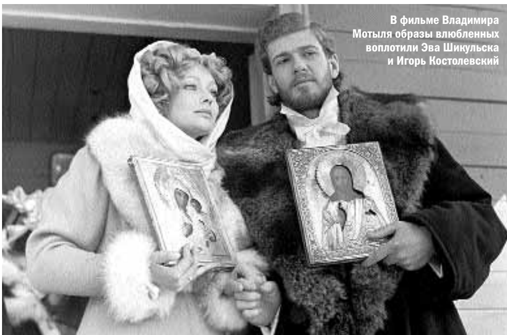
В фильме Владимира Мотыля образы влюбленных воплотили Эва Шикунска и Игорь Костоловский

В Москву Полин и Анненков прибыли только в ноябре. Здесь их и застало известие о кончине императора Александра I, которое, как заметила Полин, озаботило ее друга. Несколько дней кряду в доме у Анненкова сходились молодые офицеры, вели между собой разговоры, из которых Полин поняла, что Иван Александрович состоит членом какого-то тайного общества и внезапная смерть императора почему-то грозит ему бедой. Вскоре поручик засобирился в Петербург — 2 декабря он выехал, но в спешке забыл порт-