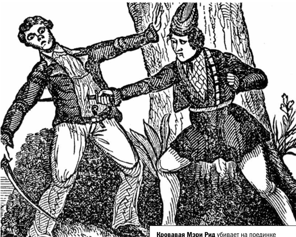
Кровавая Мэри Рид убивает на поединке обидчика своего любовника. Вверху: Капитан Рекхэм «Красавчик», на корабле которого под видом мужчин служили две женщины. Английские гравюры XVIII века

Однажды один из пиратов задел возлюбленного Мэри, тот ответил, как подобает мужчине, и завязалась ссора. Пиратский закон запрещает поединки на борту, сводить счеты с оружием в руках разрешается только на берегу. Поединок на саблях назначили на утро. Мэри пришла в ужас, когда узнала об этом. Она понимала, что у ее возлюбленного немного шансов победить отчаянного головореза. В то же время она гордилась своим избранником, бросившим вызов обидчику. Наконец, Мэри нашла выход: она затеяла ссору с этим же пиратом и вызвала его на поединок, притом на час раньше.