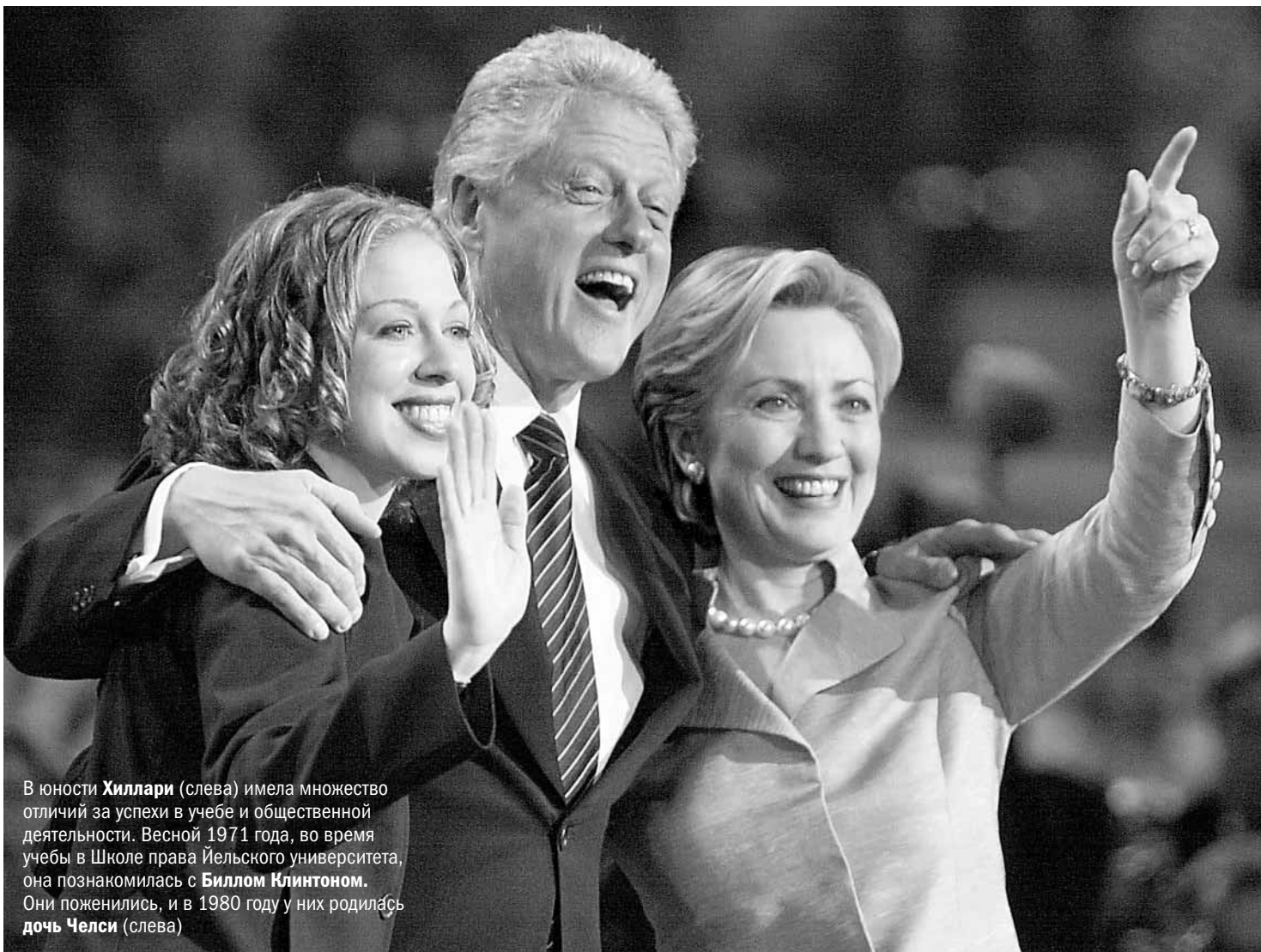
В юности Хиллари (слева) имела множество отличий за успехи в учебе и общественной деятельности. Весной 1971 года, во время учебы в Школе права Йельского университета, она познакомилась с Биллом Клинтон. Они поженились, и в 1980 году у них родилась дочь Челси (слева)

предложила ему уйти в отставку лично, в прямом эфире, на глазах у миллионов. И он ушел, сделав пиар самому опасному конкуренту республиканцев.