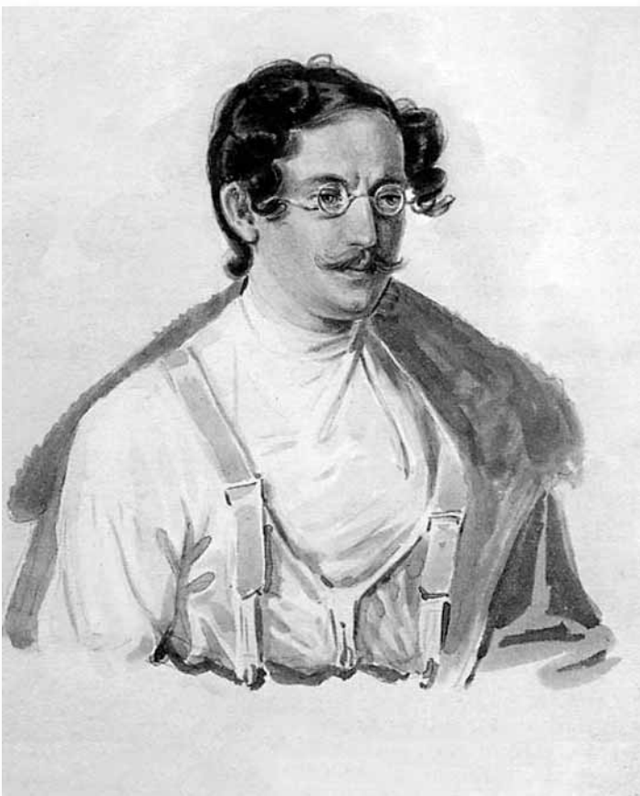
ИЗ СОБРАНИЯ И.С. ЗИЛЬБЕРШТЕЙНА