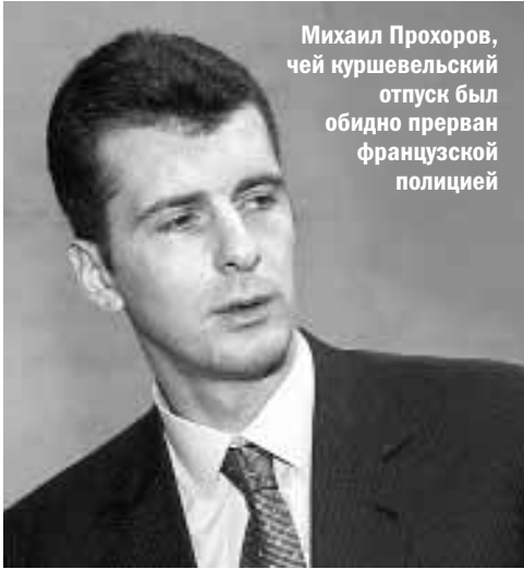
Михаил Прохоров, чей куршевельский отпуск был обидно прерван французской полицией