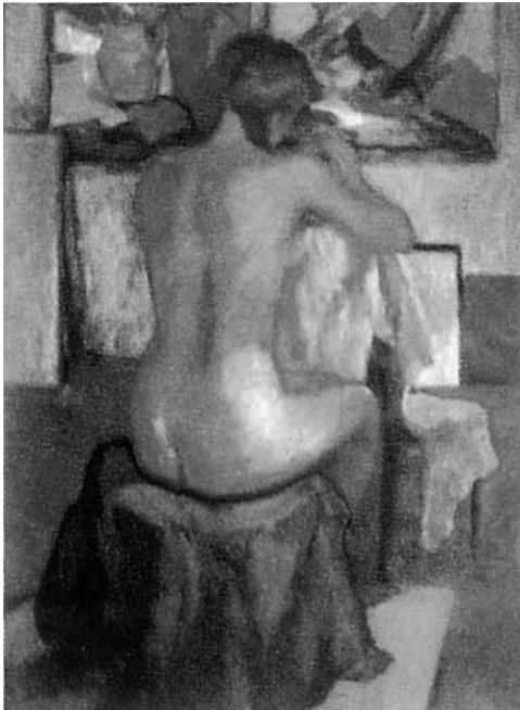
Н. А. Тырса «Натурщица», первая половина XX века. Это полотно было похищено из частного собрания