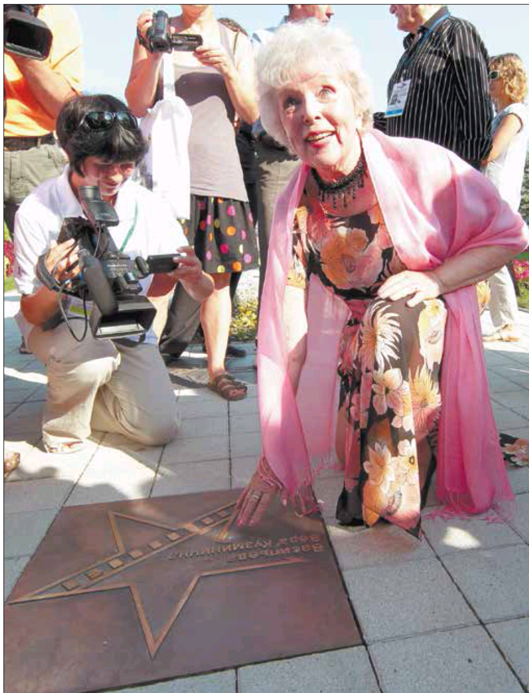
НАРОДНАЯ АРТИСТКА СССР ВЕРА ВАСИЛЬЕВА У СВОЕЙ ИМЕННОЙ ЗВЕЗДЫ НА «АЛЛЕЕ ЗВЁЗД». АНАПА, ФЕСТИВАЛЬ «КИНОШОК». СЕНТЯБРЬ 2011

...С Верой Кузьминичной мы встретились на служебном входе Театра сатиры перед началом спектакля. Ровно в назначенное время раздался звонкий стук её каблучков. Сразу бросилось в глаза, как сотрудники театра при виде её как-то по-особенному оживали, выпрямлялись. Ещё бы! Её статная фигура, прямая спина, ухоженные руки, изысканные манеры и речь воздействуют магически... Язык не поворачивается назвать её одной из старейших действующих актрис. Другое дело — легенда, королева сцены, актриса с походкой и осанкой голливудской дивы. Подписывая мне на память свою новую книгу «Золушка с Чистых прудов», она сказала удивительную фразу: «Я хочу, чтобы зрители помнили меня не потому, что я долго жила, а потому, что, долго живя, я не разуверилась в своих понятиях о жизни, о любви, о красоте человеческих чувств».