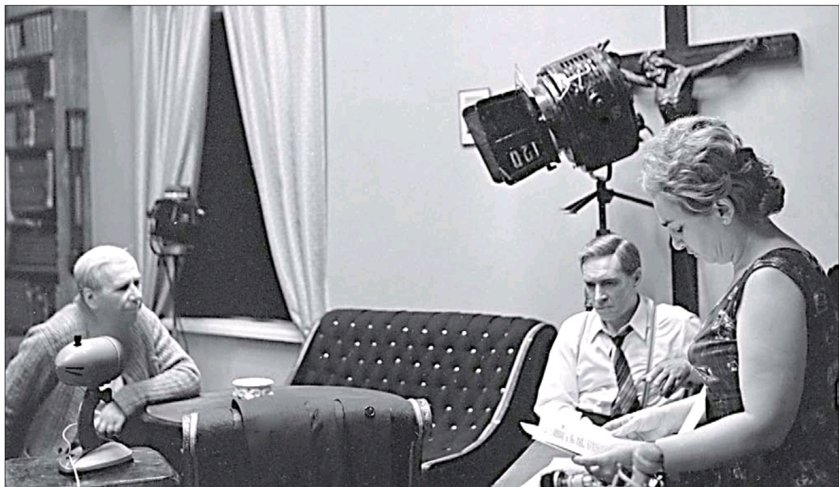
РЕЖИССЁР ТАТЬЯНА ЛИОЗНОВА (СПРАВА), АКТЁРЫ РОСТИСЛАВ ПЛЯТТ (СЛЕВА) И ВЯЧЕСЛАВ ТИХОНОВ НА СЪЁМКАХ СЕРИАЛА «СЕМНАДЦАТЬ МГНОВЕНИЙ ВЕСНЫ». КИНОСТУДИЯ ИМЕНИ ГОРЬКОГО. 1973

Хорошо известно, что говорить о личной жизни Вячеслав Тихонов никогда не любил