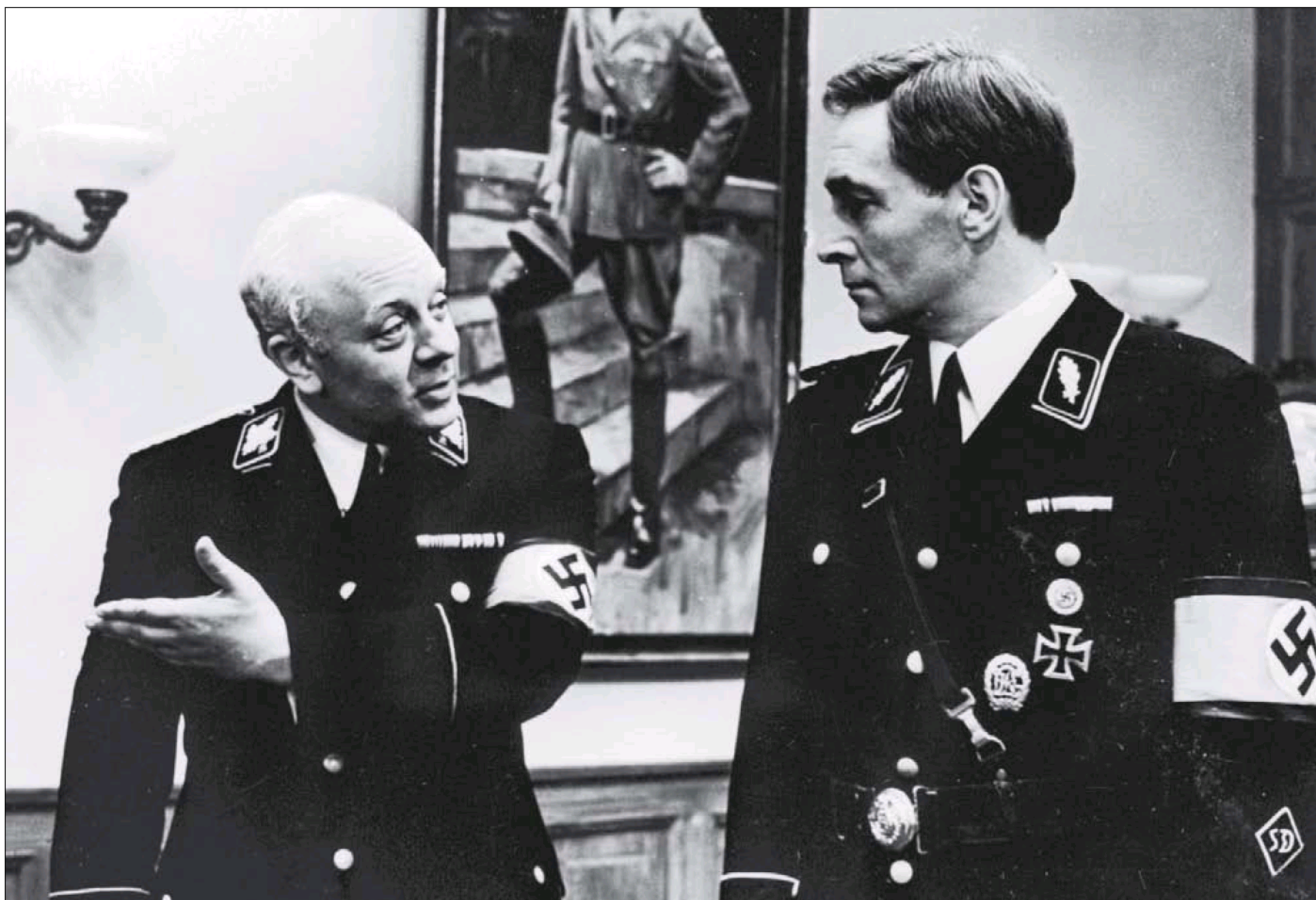
ЛЕОНИД БРОНЕВОЙ (В РОЛИ ГРУППЕНФÜРЕРА СС ГЕНРИХА МЮЛЛЕРА) И ВЯЧЕСЛАВ ТИХОНОВ (ШТАНДАРТЕНФÜРЕР СС ШТИРЛИЦ). КАДР ИЗ ТЕЛЕФИЛЬМА ТАТЬЯНЫ ЛИОЗНОВОЙ «СЕМНАДЦАТЬ МГНОВЕНИЙ ВЕСНЫ»

казалось, что зритель её не увидит — цензура отправит готовый фильм на полку.