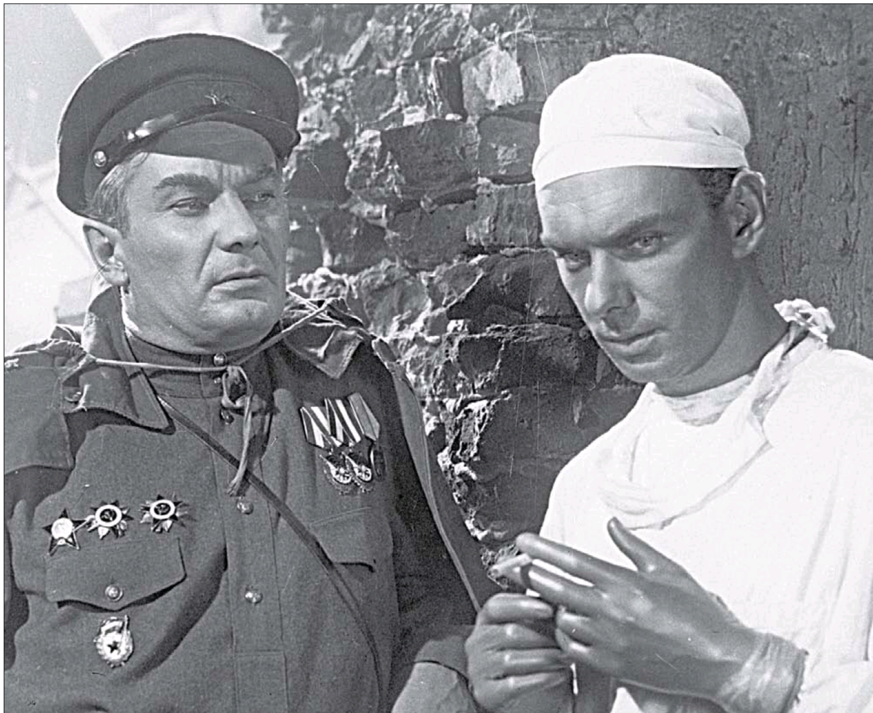
В ПАРЕ С АЛЕКСЕЕМ БАТАЛОВЫМ В ФИЛЬМЕ «ДОРОГОЙ МОЙ ЧЕЛОВЕК»

— Они встретились на съёмках какой-то украинской картины, к сожалению, не помню её название. Она пела в хоре, а такие русские хоры в то время записыва-