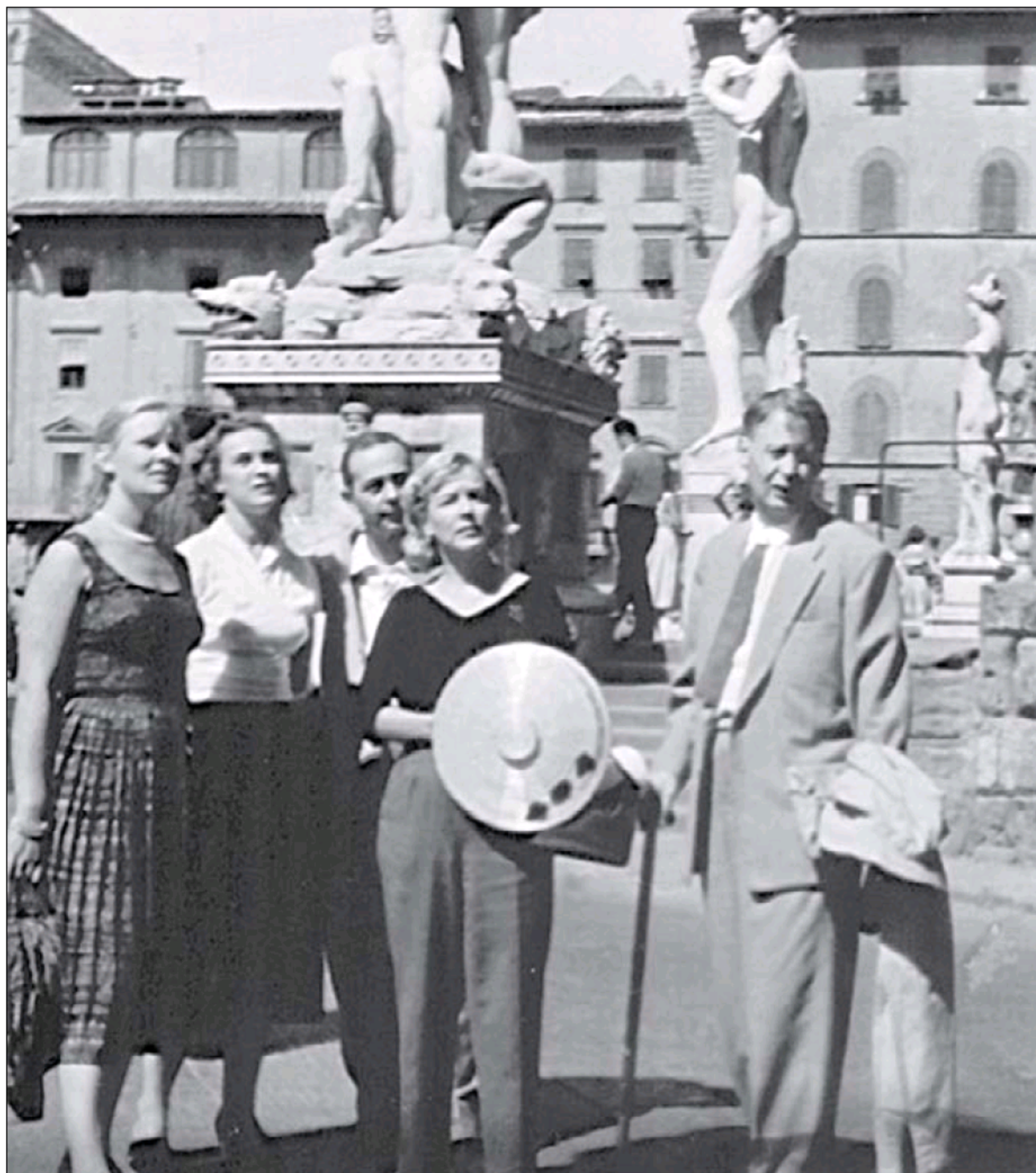
В ПЕРВОМ РЯДУ: НАДЕЖДА ЧЕРЕДНИЧЕНКО, ТАТЬЯНА ПИЛЕЦКАЯ, МАРИНА ЛАДЫНИНА И ИВАН ПЫРЬЕВ. ФЛОРЕНЦИЯ. 1957