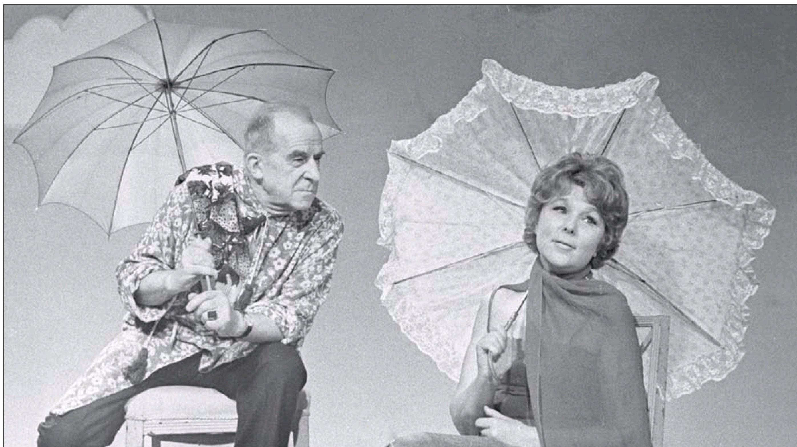
С СЕРГЕЕМ МАРТИНСОМ В МУЗЫКАЛЬНОМ ФИЛЬМЕ-СПЕКТАКЛЕ «БЕНЕФИС СЕРГЕЯ МАРТИНСОНА». 1974

и правительственная награда, и огромная слава «свалились» на мою молодую неопытную голову не совсем заслуженно. Я не создавала образ, а была именно такой — наивной, симпатичной, простодушной девочкой. Просто попала в хорошие руки Ивана Александровича Пырьева.