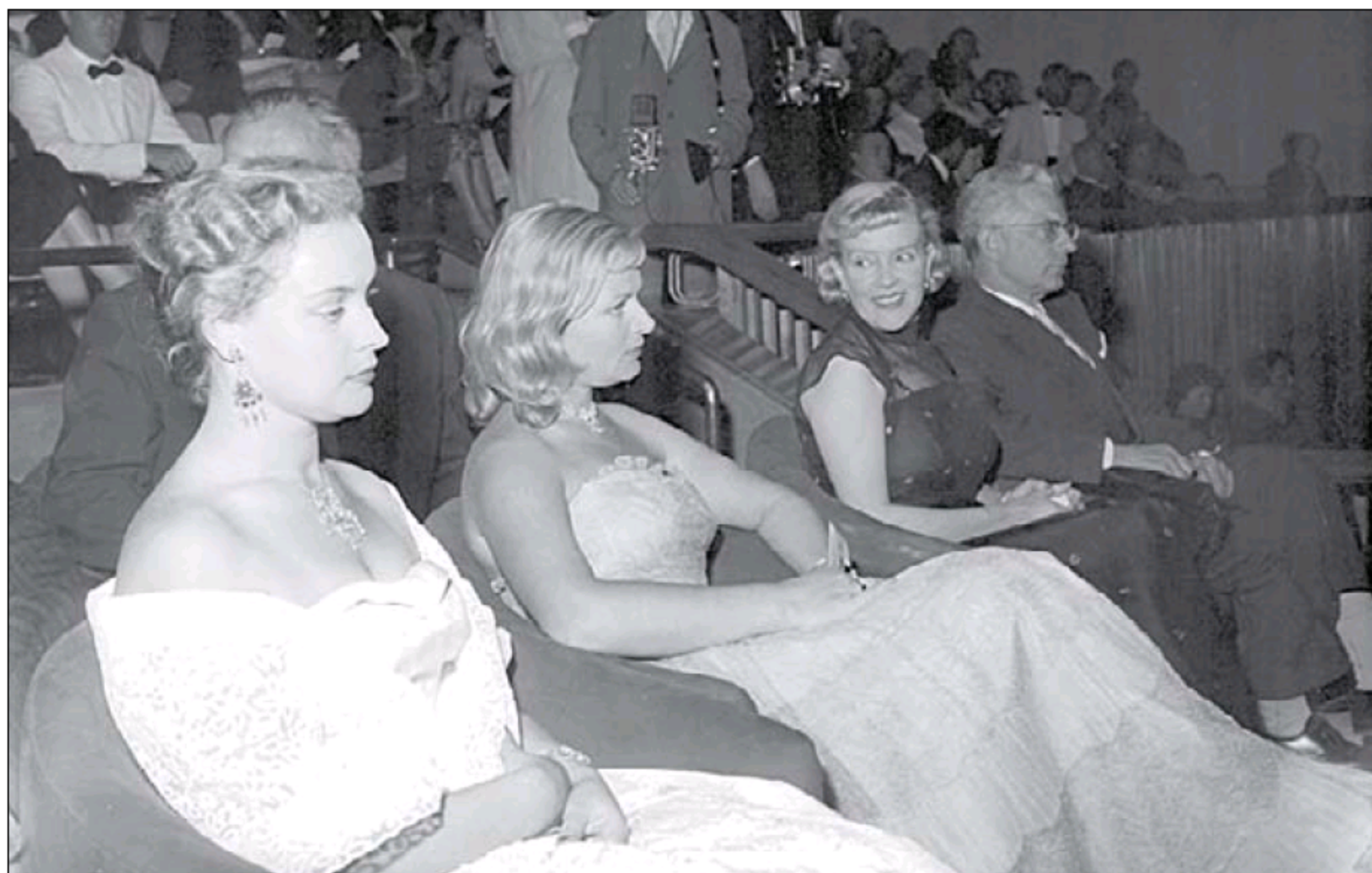
ЧЛЕНЫ СОВЕТСКОЙ ДЕЛЕГАЦИИ АКТРИСЫ ТАТЬЯНА ПИЛЕЦКАЯ, НАДЕЖДА ЧЕРЕДНИЧЕНКО, МАРИНА ЛАДЫНИНА НА ЦЕРЕМОНИИ ОТКРЫТИЯ ВЕНЕЦИАНСКОГО КИНОФЕСТИВАЛЯ, ИТАЛИЯ. 1957

— О, ещё как! Помню, что я жутко волновалась — сердце ходуном, руки ледяные. Вышла на сцену Дома кино на