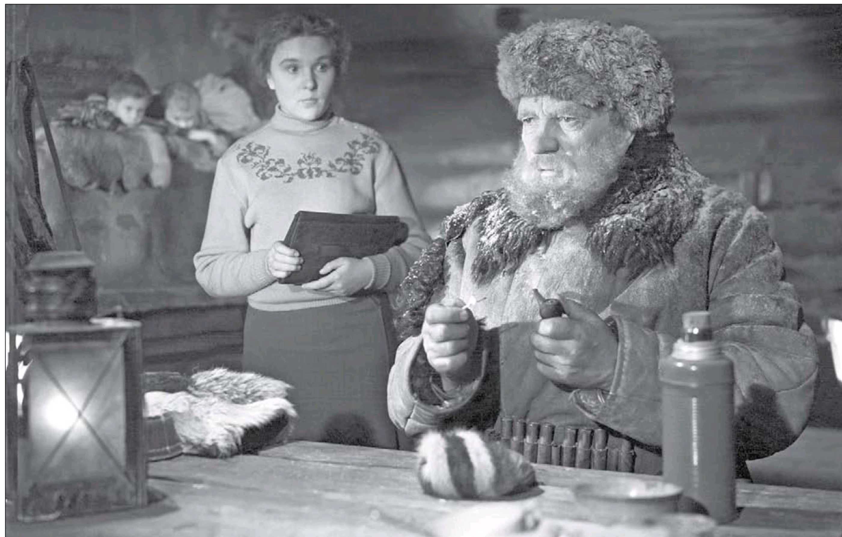
ВЕРА ВАСИЛЬЕВА И АКТЁР НИКОЛАЙ КОМИССАРОВ В КАРТИНЕ «ЧУК И ГЕК». МОСКОВСКАЯ КИНОСТУДИЯ ИМЕНИ М. ГОРЬКОГО. 1953

— Я даже не знаю, была ли я счастлива. Наверное, была. Хотя всегда считала, что