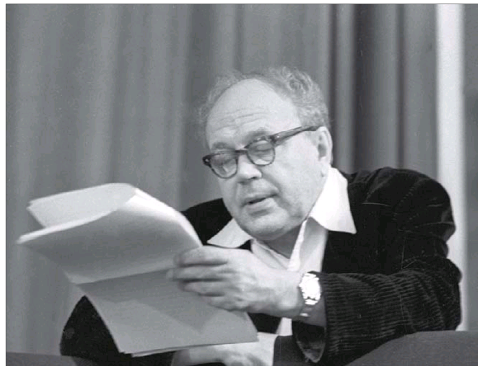
ГЛАВНЫЙ РЕЖИССЁР МАЛОГО ТЕАТРА — НАРОДНЫЙ АРТИСТ СССР БОРИС ИВАНОВИЧ РАВЕНСКИХ. МОСКВА. 1975