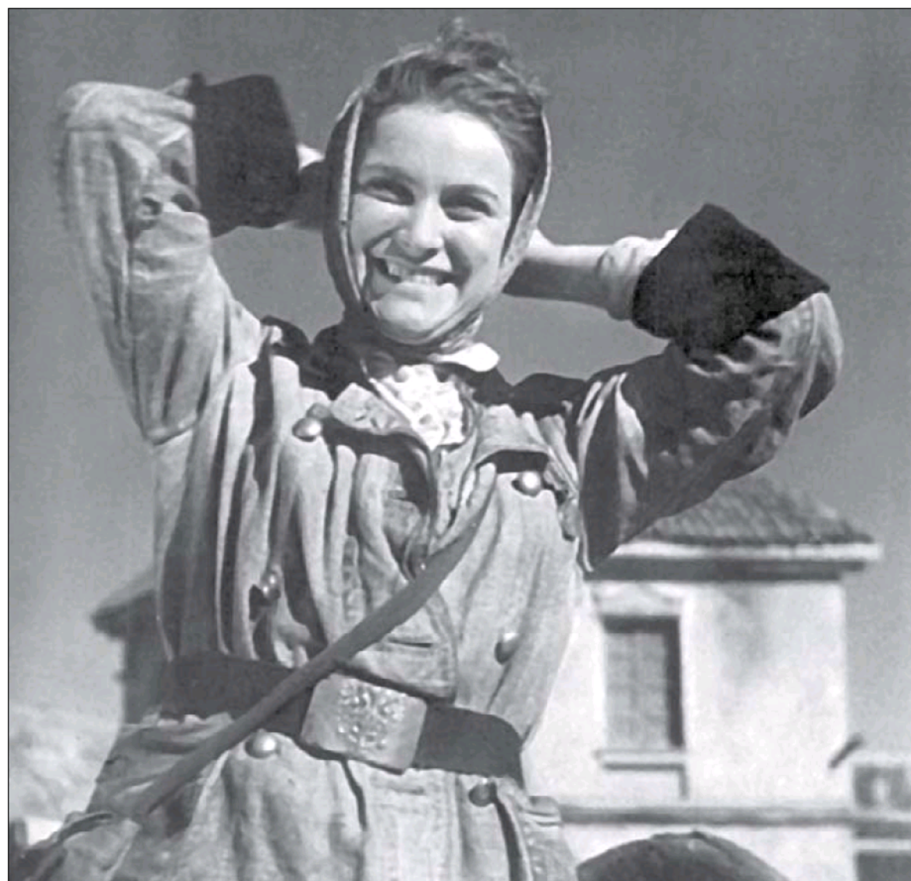
ТАТЬЯНА ПИЛЕЦКАЯ В РОЛИ ДАШИ СЕВАСТОПОЛЬСКОЙ. КАДР ИЗ ФИЛЬМА ГРИГОРИЯ КОЗИНЦЕВА «ПИРОГОВ». 1947

— Популярность у вас была сумасшедшая. Как зрители выражали свою любовь?