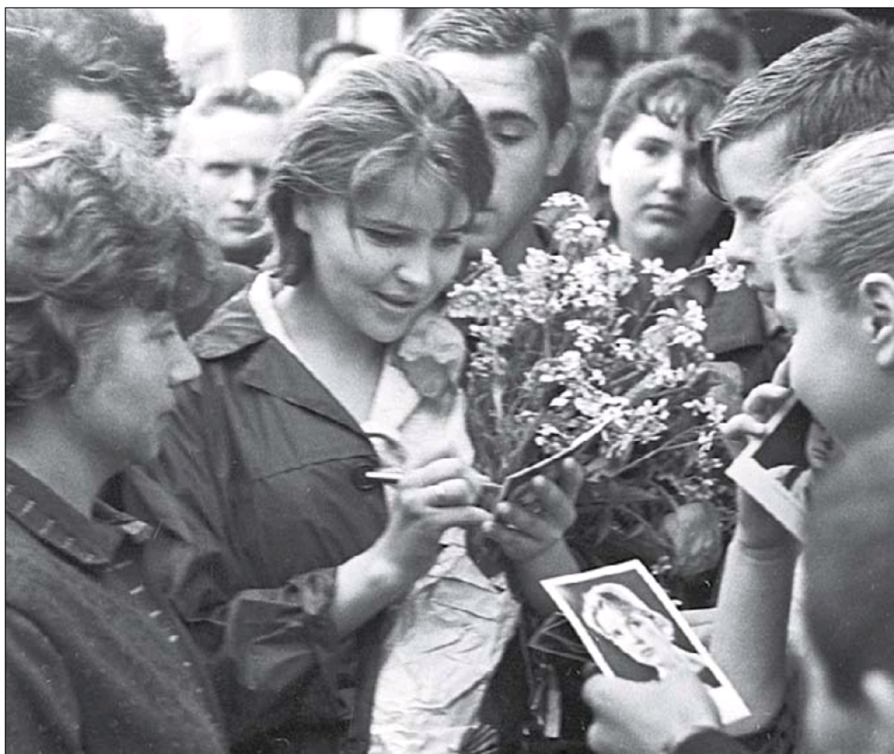
ЗАСЛУЖЕННАЯ АРТИСТКА РОССИИ ТАМАРА СЁМИНА НА ВСЕСОЮЗНОМ КИНОФЕСТИВАЛЕ В КИЕВЕ. СЕНТЯБРЬ. 1966