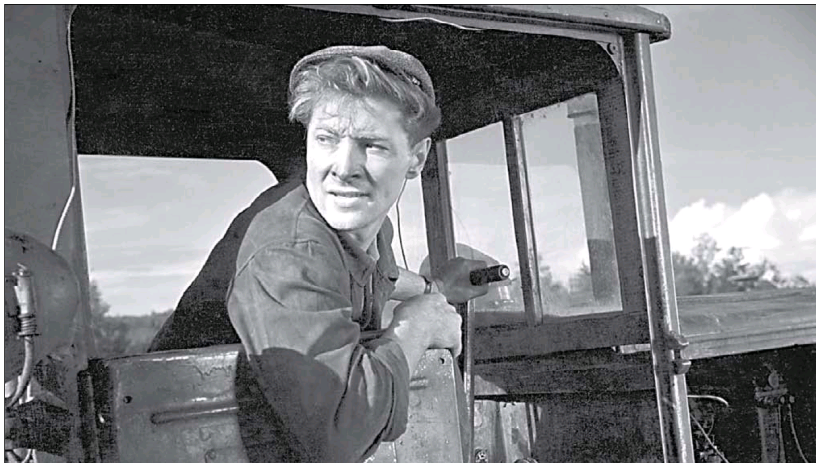
ВЯЧЕСЛАВ ТИХОНОВ (В РОЛИ ТРАКТОРИСТА МАТВЕЯ МОРОЗОВА) В ПРИНЁСШЕМ ЕМУ СЛАВУ ФИЛЬМЕ СТАНИСЛАВА РОСТОЦКОГО «ДЕЛО БЫЛО В ПЕНЬКОВЕ». КИНОСТУДИЯ ИМЕНИ ГОРЬКОГО. 1957

А вспомнить Вячеславу Васильевичу было что.