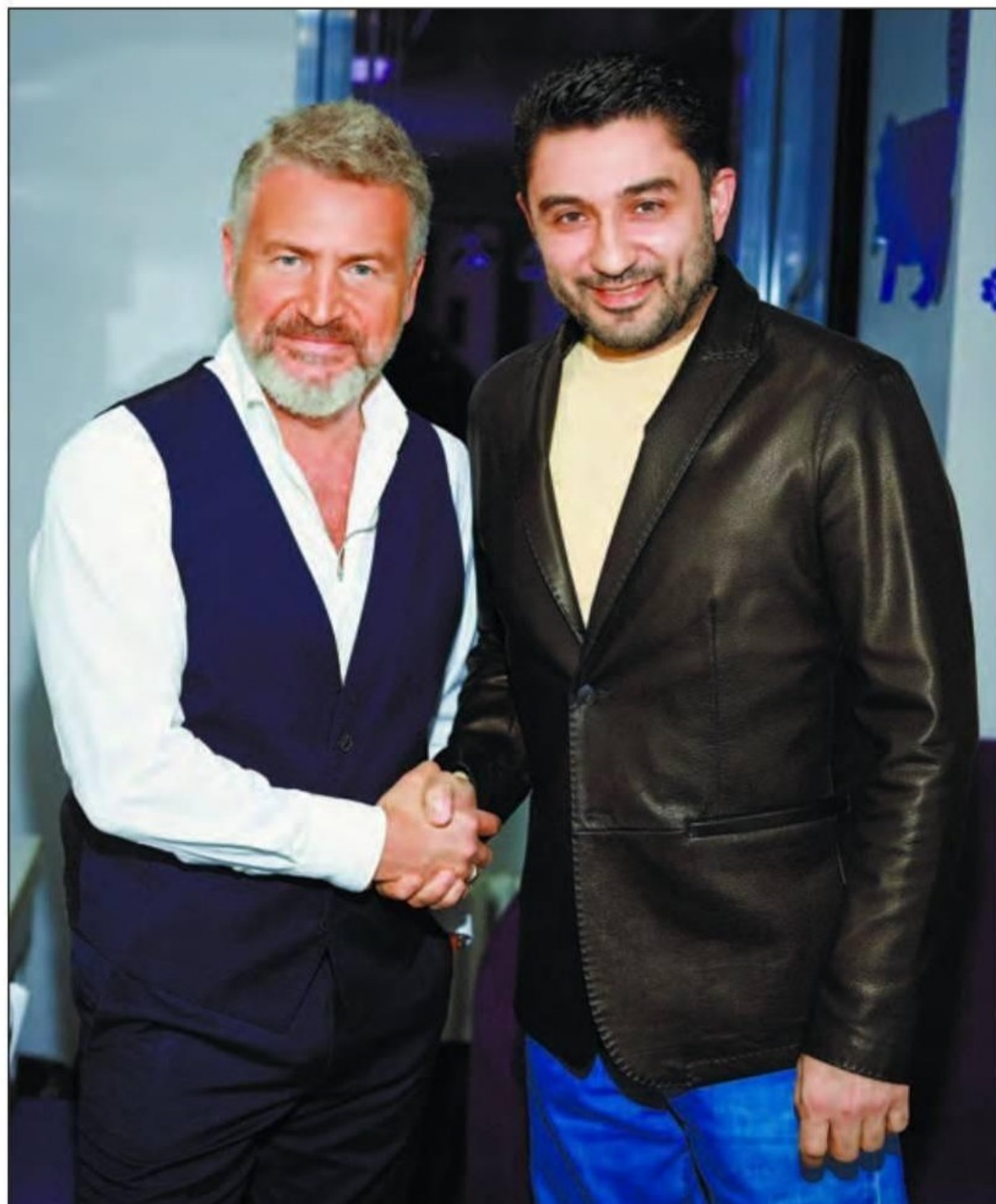
ТАБРИЗ ШАХИДИ И ЛЕОНИД АГУТИН