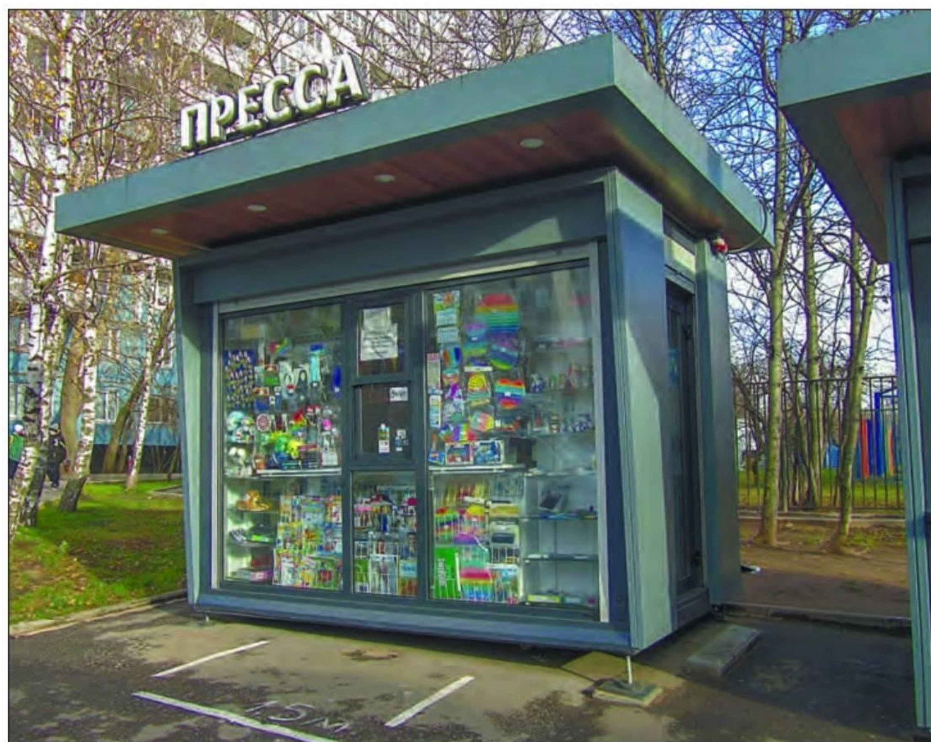
ТИПИЧНЫЙ ГАЗЕТНЫЙ КИОСК: ЗАБИТ ВСЯКОЙ ЕРУНДОЙ, ГАЗЕТ И ЖУРНАЛОВ ПРАКТИЧЕСКИ НЕ ВИДНО И... ТРЕБУЕТСЯ КИОСКЕР

“ Говорят, что газеты и журналы – это вымирающий динозавр. Заметно упал их авторитет как «четвертой власти». Очень сильно «просел» тираж. Если говорить о причинах такого «проседания», то их много. Одна из них – рост цен на полиграфические услуги и удорожание почтовой доставки. Эти расходы сжирают весьма значительную часть газетно-журнального бюджета. Другая, не менее важная, и в то же время очевидная причина – это Интернет.