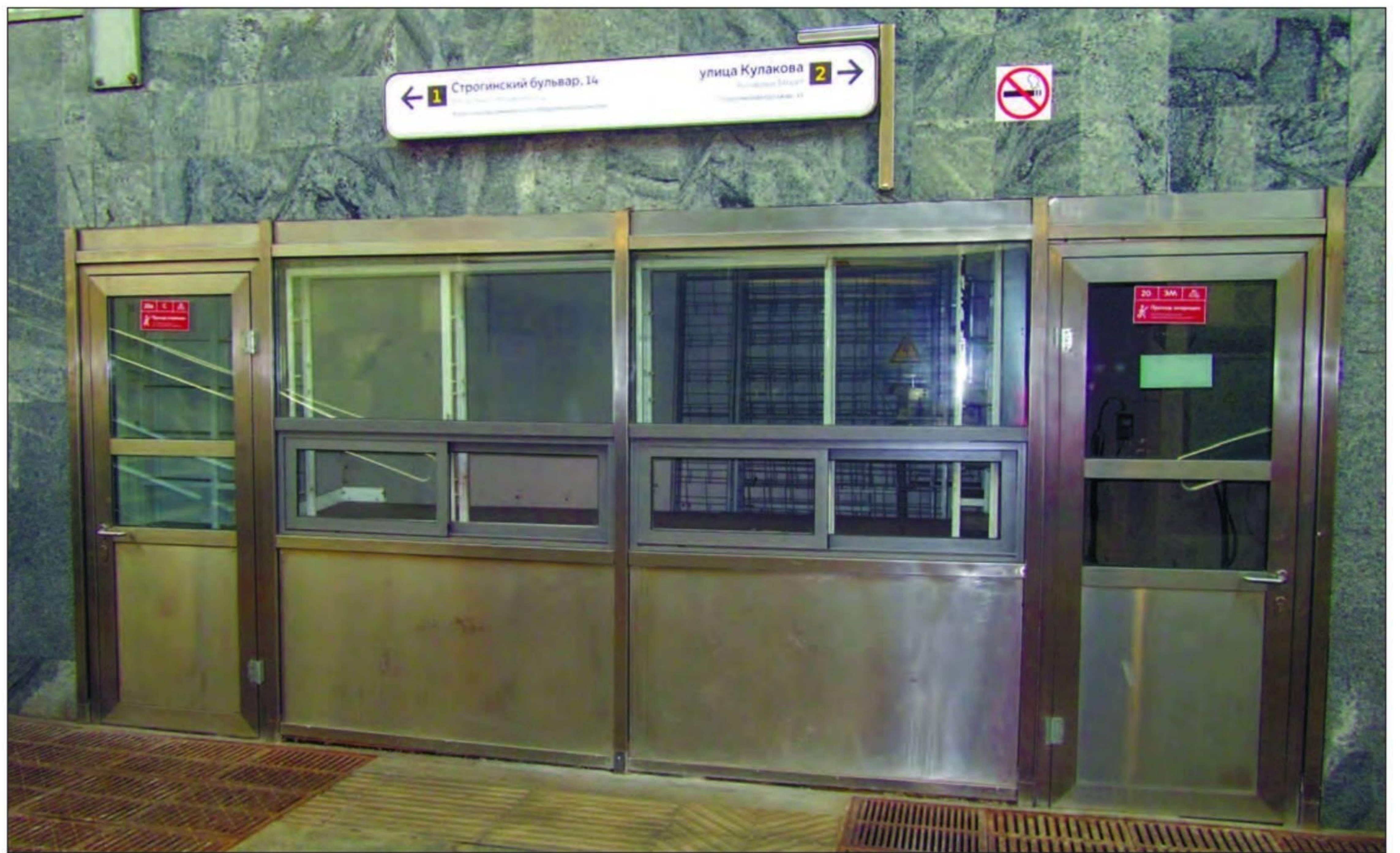
КОГДА-ТО ЭТО БЫЛ ПРЕКРАСНЫЙ ГАЗЕТНЫЙ КИОСК НА СТАНЦИИ МЕТРО «СТРОГИНО» В МОСКВЕ. УЖЕ НЕСКОЛЬКО ЛЕТ ОН СТОИТ ПУСТОЙ ИЗ-ЗА БЕЗУМНОЙ АРЕНДНОЙ ПЛАТЫ

Итак, во-первых, неуклонно редет «печатное поле». Если в 2009 году количество зарегистрированных периодических печатных изданий составляло 72498, то по состоянию на конец 2020 года их осталось 39794. Таким образом, это количество сократилось примерно на 45%, причем самое большое сокращение произошло в 2019 году. В Роспечати считают, что сокращение числа печатных СМИ «отчасти связано с экономикой печатной прессы, отчасти со снижением тиражей, и здесь существенную роль играют новые технологии и новые платформы (социальные сети, мессенджеры и т.д.), которые являются серьезными конкурентами для прессы». В целом в ведомстве видят в сокращении числа бумажных изданий объективную тенденцию: с рынка уходят слабые невостребованные газеты и журналы, а также те издания, «которые в силу консерватизма своих редакций не способны перестроиться и соответствовать вызовам времени или же недостаточно работают со своей целевой аудиторией, не понимают ее запросов». Например, в упомянутом 2019 году список закрытых печатных изданий пополнился журналами «Автомир», «Мой прекрасный сад», «Мой ребен-