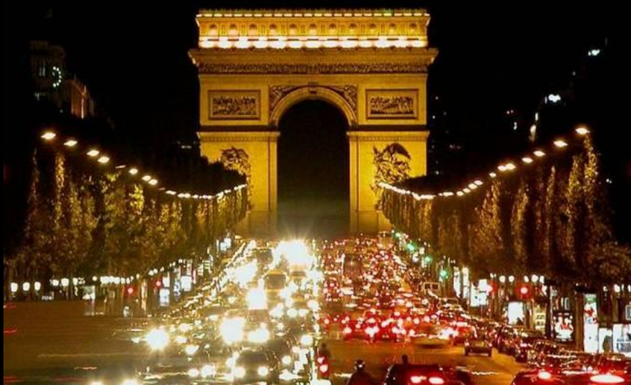
Символ Парижа — Пизда, Триумфальная арка 7