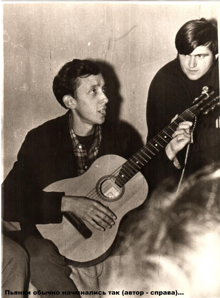
Пьянки обычно начинались так (автор - справа)...

Новый, 1972 год, отмечал в родном общежитии №4 на улице Ломоносова.