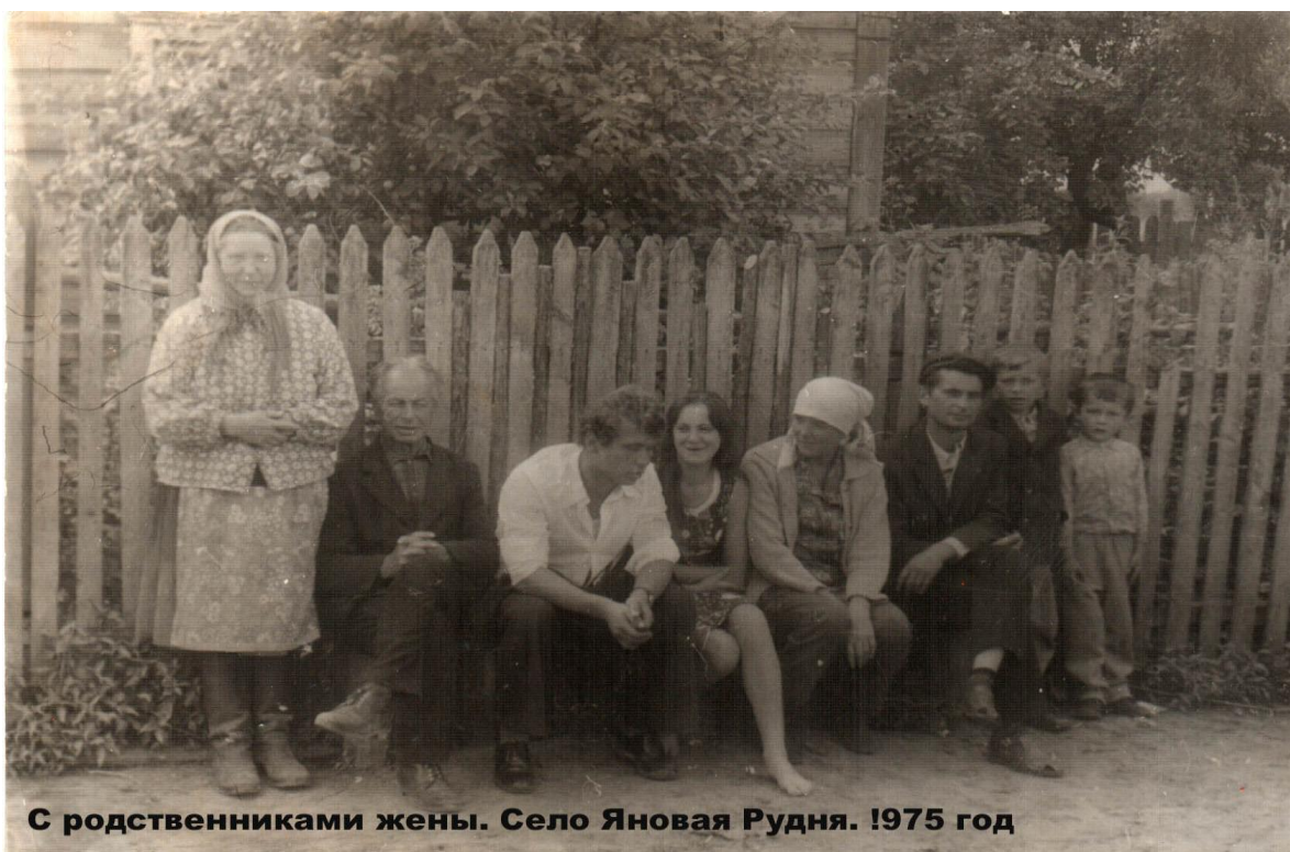
С родственниками жены. Село Яновая Рудня. 1975 год

Однако все халявное когда-нибудь заканчивается. Свободную комнату заняла семья майора, переведенного в Овруч. Он, узнав, кто мы такие, тут же пожаловался начальству: мол, в военном доме живут гражданские без каких-либо прав на это, а он тем временем прозябает в одной комнатухе.