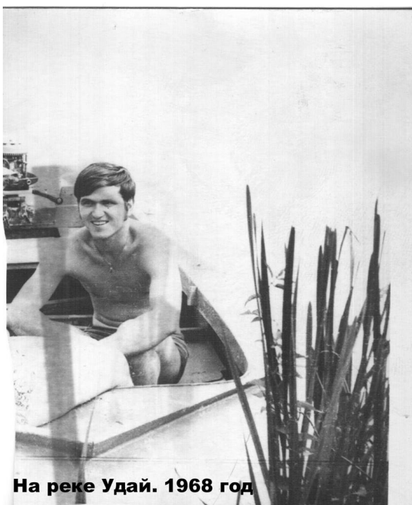
На реке Удай. 1968 год