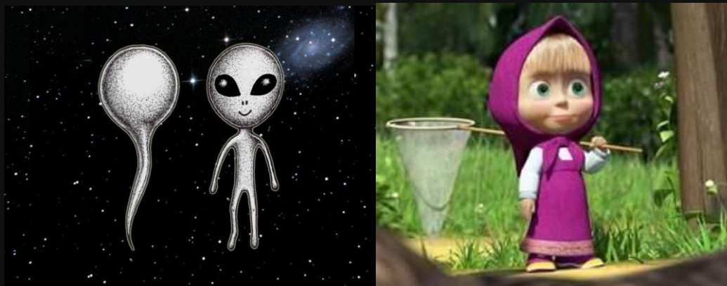
Рис. 2. Космит, Гость, как спермий, копье в То: в Утробу, Тьму-Мать, что Вселенной зовем мы. Пропорции Гостя как спермия — детские: дитя и спермий — одно.

Ответ: Это КРАТЕР Ук ЕРТ , расположенный в центре Луны и имеющий форму равностороннего ТРЕ угольника. Центральность этих врат для наших глаз обусловлена замыслом Бога, кладущего Тайну на самое видное место, наилучшее для сокрытия; их треугольность — прямой знак того, что треугольник — фигура единая Сфере, которой есть Вечность, и бренному миру, который есть плоскость как Сфера, разъятая в нуль . Подземелье Укерта есть и раздевалка Гостей, где они подбирают костюм к Встрече с нами, и парк НЛО для походов к Земле.