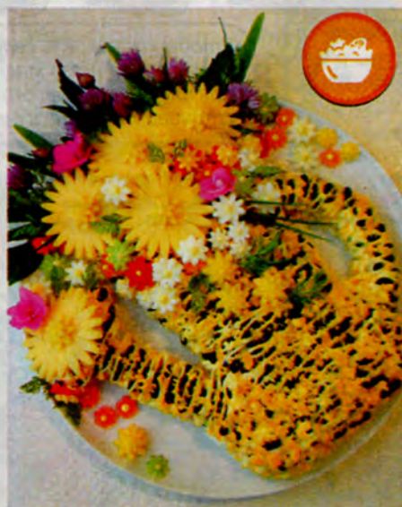
Жанна СКРЯБИНА, г. Тукумс, Латвия.

Мясо нарезаю мелкими кубиками, зелень кухонными ножницами — в виде перьев, огурец и перец — брусочками, белки отделяю от желтков, белки и сыр натираю на крупной терке. Выкладываю подготовленные продукты на блюдо слоями в виде садовой лейки: сначала белки, сеточка из майонеза, часть зелени и куриного мяса, сеточка из майонеза, часть фасоли, сеточка из майонеза, огурец и перец, майонез, затем зелень, снова куриное мясо, сеточка из майонеза, фасоль, майонез. Украшаю салат измельченным желтком, зеленью, ромашками из сыра, моркови, перца, огурца и вареных яиц (вырезаю их формочками для печенья).