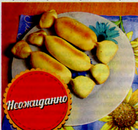
Вера ВОЛОХ, г. Североморск.

• 1 ст. молока • 20 г сухих дрожжей • 4 ст. муки • яйцо • соль • растительное масло. Для начинки: • филе горбуши или другой рыбы • соль. Дрожжи соединяю с мукой и солью, вливаю теплое молоко, перемешиваю и даю опаре постоять 15 мин. Вбиваю яйцо и тщательно вымешиваю тесто. На присыпанной мукой поверхности раскатываю тонкий пласт, разрезаю на квадраты. Филе рыбы нарезаю небольшими кусочками, солю и кладу понемногу в центр каждого квадрата. Формую пирожки в виде конфеток и выпекаю на смазанном маслом противне до готовности.