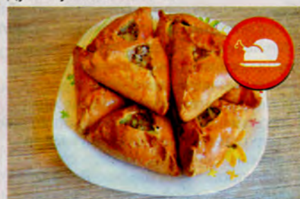
Евгения ИВАНОВА, г. Северск.

30 мин., периодически помешивая. Из теста формую колбаску (5-6 см в диаметре), нарезаю кусочками, каждый раскатываю в лепешку толщиной 3-5 мм, в середину кладу начинку (кусочки «лаврушки» убираю), формую треугольники. Каждый смазываю взбитым яйцом, перекладываю на противень, ставлю в разогретую до 180 град. духовку на 30-40 мин.