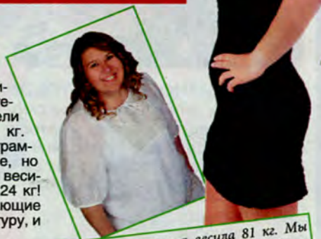
На фотографии слева я весила 81 кг. Мы были на отдыхе в Крыму, и не могло быть и речи о том, чтобы я надела купальник. Сегодня я весю 57 кг (фотография справа) и не могу дождаться лета.