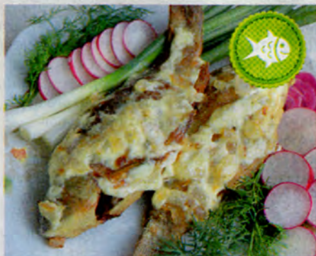
Ольга ИСАКИНА, п. Новостройка Кемеровской обл.

Рыбу чищу от чешуи, удаляю жабры и внутренности. Замачиваю карасей в подсоленном молоке на 30 мин., затем обсушиваю бумажным полотенцем, солю и перчу. Обжариваю на сливочном масле с двух сторон до полуготовности, перекладываю в сковороду или форму для запекания. Посыпаю мелко нарезанным луком, заливаю сметаной и ставлю в разогретую духовку на 15 мин. Подаю карасиков с отварной молодой картошкой и салатом из свежих овощей.