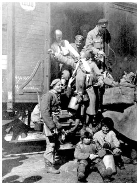
Эвакуация белогвардейцев в "теплушках"

Мы уехали в Королевский затон. Отец остался на судне. Через реку велась артперестрелка. Перестрелка становилась все реже и на другой день стихла. Через