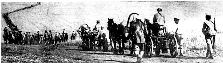
Отступление белой армии лето 1919г.

Враг оказывал сопротивление на стратегически важных пунктах. С боями вышли в начале мая к с.Дебеси, затем освободили с.Черновское Оханского уезда. За село Андреево были бои, взяв его вышли на берег р.Камы. Средств для переправы под руками не было. Противник или угнал или уничтожил лодки. Реку держал под обстрелом, перестрелка через реку длилась 10 дней. В течении этих 10 дней нашей армии удалось построить плавучий мост, ниже г.Оханска в 7 км, и по данному мосту пошло все движение и снабжение для армии.