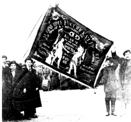
Нерушимый союз рабочих и солдат

После Октябрьской революции в помощь завкому для контроля над производством были выбраны бригады рабочего контроля по цехам, в управлении же завода был послан политкомиссар. Комиссара по нашей просьбе назначил губернский комитет партии. В декабре 1917 г. я был избран делегатом на первую Уральскую областную конференцию фабрично-заводских комитетов профсоюза. На этой конференции были уточнены задачи