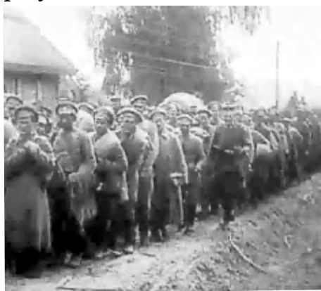
Рекруты гражданской войны...

Не дойдя 100 км до Красноярска, в декабре заболел тифом. Через 2-3 месяца выздоровел и был направлен в военизированную охрану завода Балашова.