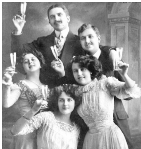
Контрасты гражданской войны...

Вся эта шушера жаждет показать важность и доверенность своего приположения, всеми кончиками своих юрких ушей ловит проходящие мимо обрывки фраз, выуживает из переписки наиболее благодарный для распростра-