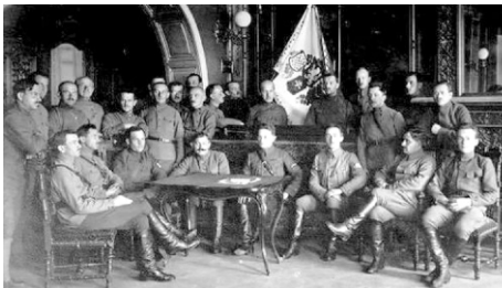
Руководство чехо-словацкого корпуса 1919г.