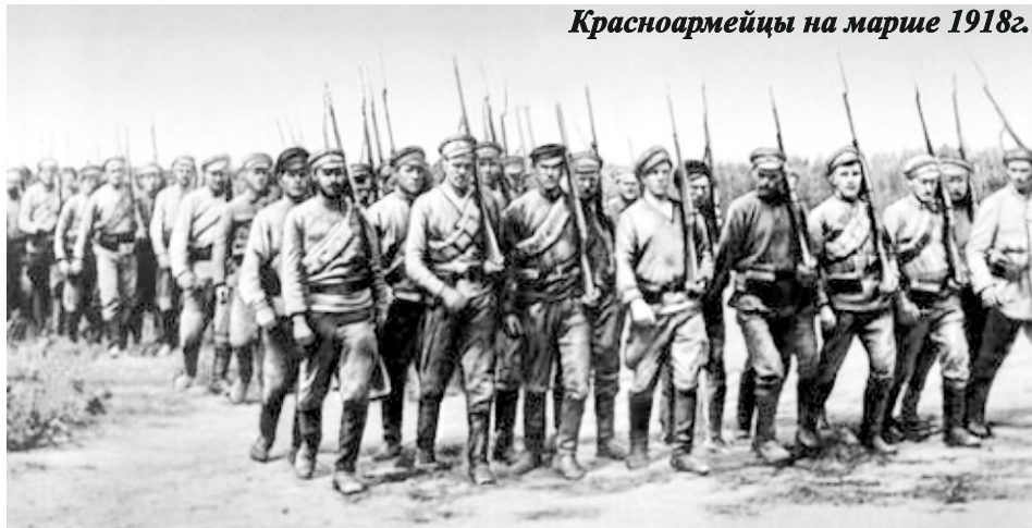
Красноармейцы на марше 1918г.

8 июля мы были в г.Белорецке. Сил военных в городе было мало. 9 июля эссеры пытались поднять восстание, убили несколько видных партийных работников. 10 июля утром белоказаки перешли в наступление, наш батальон был атакован в лоб и с тыла. Но мы сумели выйти из тисков, перешли в наступление и отбросили белоказаков.