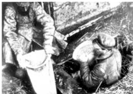
Продотряд изымает зерно у крестьян

В феврале 1920 г. был направлен в г.Сызрань в части НКВД. Вели борьбу со спекуляцией и саботажем. В 1922 году в августе демобилизовался.