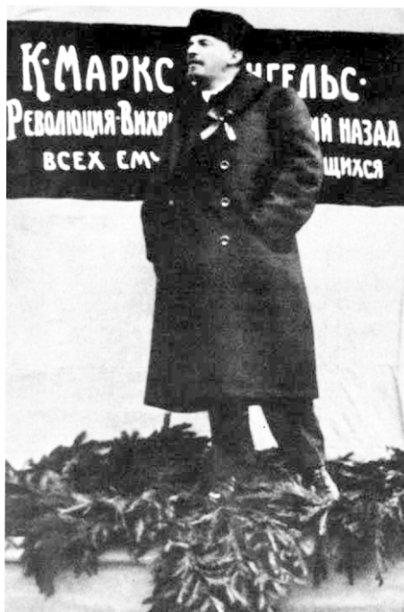
В.И. Ленин в 1918г.

Приходилось решать все вопросы: снабжение завода материалами, топливом, продовольствием, сбыта продукции, изыскание кредитов. Было очень тя-