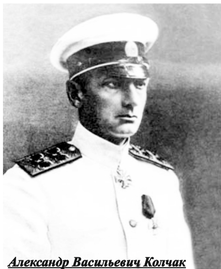
Александр Васильевич Колчак

Я начал работать рано. В 1914г. меня мать через знакомых устроила на работу в Пермское губернское управление. Я мечтал достигнуть совершеннолетия и поступить в водный транспорт, но так не получилось.