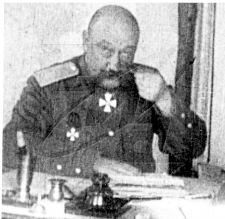
Николай Николаевич Юденич 1919г.

В мае 1918г. я добровольцем был в продотряде. Нас было 180 человек. Отряд послали в Тамбовскую губернию, Кирияновский уезд. Работал там до января 1919 г. Вооруженного сопротивления не было, но хлеб приходилось искать, прятали, закапывали в землю. Хлеб направляли в Череповец и Москву. В июне 1919 г. мобилизован в Красную Армию. Направлен во 2-й Ярославский полк. В августе был на фронте против Юденича в Ямбургском уезде. В первый день боев я потерял своего брата - убили. Полк наш был не обстрелян, а у Юденича войска были вымущтрованы, наполовину состояли из офицеров. В местечке Мизовановское стояли около месяца. Были отрыты окопы и блиндажи. В сентябре армия Юденича нашу