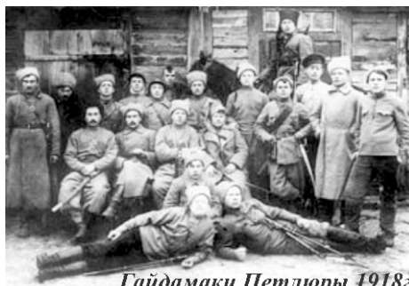
Гайдамаки Петлюры 1918г.

В нашей части были большевики, они разъясняли, что войну надо кончать. Но братания с немцами не получилось. В ноябре наш ротный сообщил нам, что в России власть захватили большевики. Вскоре у нас все офицеры