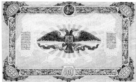
Врангелевские купюры достоинством 50 и 1000 рублей 1919г.