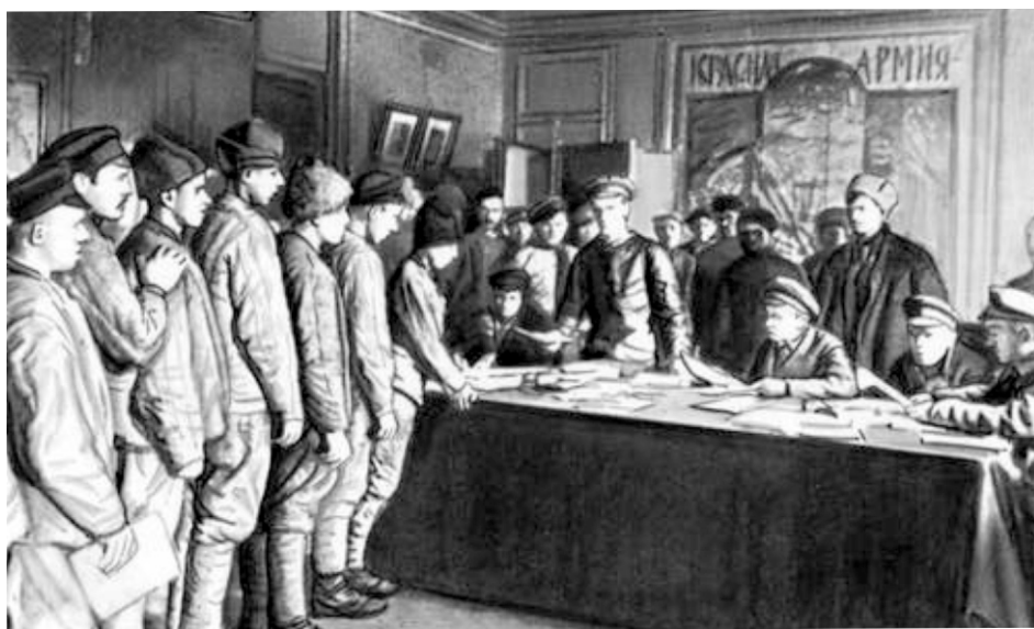
Военный всеобуч: запись добровольцев в Красную армию 1919г.

В августе 1919 г. я был направлен в распоряжение Казанского военкомата. В тот период проходило всеобщее военное обучение - Всеобуч - и меня направили в территориальный полк в наш район обучать молодежь, где и работал я до сентября 1920г.