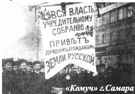
«Комуч» г. Самара

Богуруслан и Белебей. Снова раз- вернулись бои за Уфу. Продол- жались с 25 мая по 9 июня. Мосты через Белуб и Уфу были взорва- ны. 13 июля взяли Златоуст. 24 ию- ля взят Челябинск, затем в сере- дине августа взяли Курган, в кон- це октября были на подступах к Омску. Затем участвовал в осво- бождении Новониколаевска, за- болел тифом, лечился в Омске, по- сле выздоровления направлен в команду выздоравливающих в г.Семипалатинск и затем участво- вал в ликвидации банд басмачей. Получил контузию, снова заболел тифом. В 1920 г. демобилизовался.