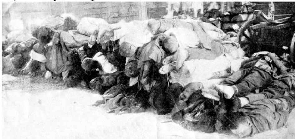
Расстрелянные красноармейцы зима 1918-1919г.г.

Полянка была небольшая, на ней было много пней. От нее в сторону Мысов начиналась низина. Полянка от станции находилась близко. Похоронено на полянке человек 20-25.