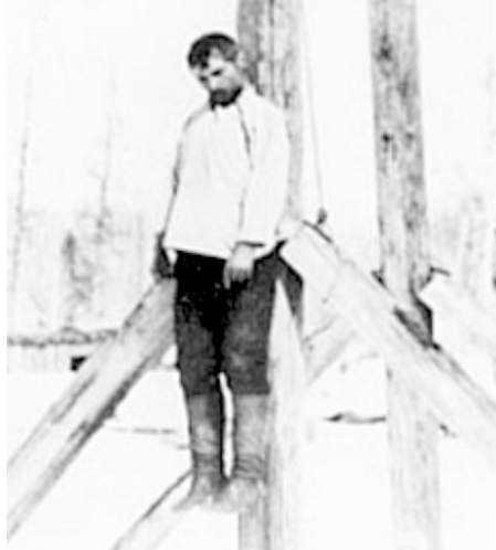
Контрасты гражданской войны...

Этим думают поднять настроение. Какое вредное и опасное заблуждение!..