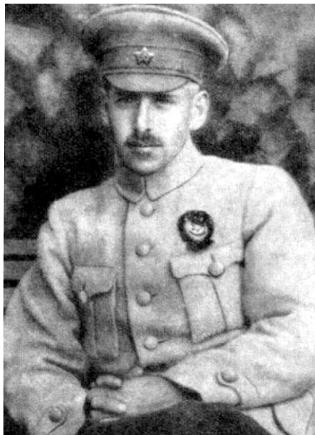
Главнокомандующий Сводным Уральским отрядом Василий Константинович Блюхер.