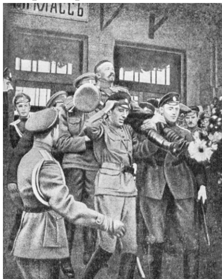
Генерал Лавр Георгиевич Корнилов

Доехали до ст.Селенга и там перевели в труд-армию. Шесть месяцев работал в Черемховских шахтах. 15 декабря 1921 г. Демобилизовался.