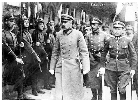
Польские легионеры Пилсудского 1919г.

Мы делились с ними продуктами, были конечно и неприятности, у нас пытались кое-что и забрать. Приехали в г.Вязьма.