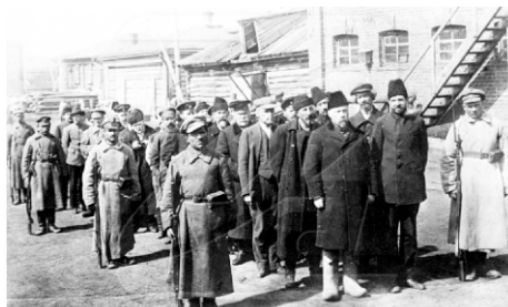
Правительство Колчака, арестованное красноармейцами 1920г.

Понятно, почему так ненавидят на фронте ставку; все ее распоряжения отдаются безграмотными в военном деле фантазерами и дилетантами, не знающими ни настоящей, неприкрашенной обстановки, ни действительного физического и морального состояния войск, т.е. тех решительных коэффициентов, которые в своей сумме определяют боевую эффективность армий, их способность выполнения операции. Все делается без плана, без расчетов, под влиянием минутных импульсов, навешаемых злой критикой, раздражением, личными неудачами и привычкой цукать.