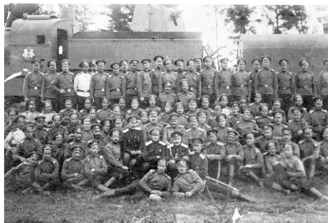
Бронепоезд белогвардейцев 1919 г.

Я видел, как был взорван железнодорожный мост. Был сильный звук и много дыма. Второй