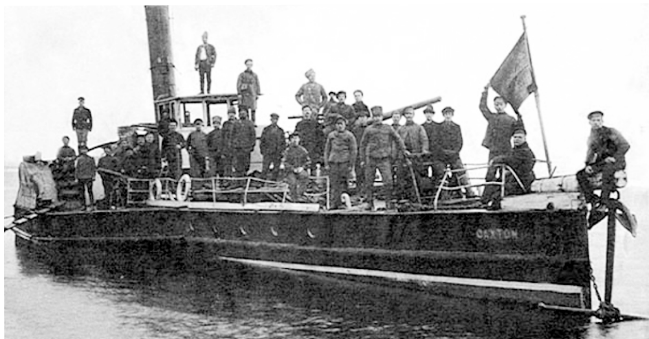
Революционный катер Волжско-Камской флотилии 1919г.

В мае 1919 г. вторая армия перешла в наступление, нашу дивизию бросали в разные места, участвовал в начале июня во взятии Ижевска, вскоре Оханска и Очеры. Нам хорошо помогала Волжско-Камская флотилия.