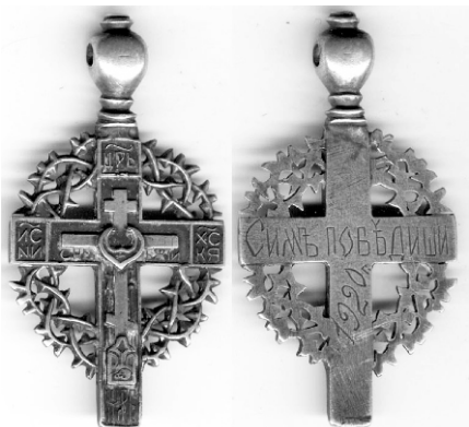
Нательный крест белогвардейца

На один такт верный приходится девять неверных или поспешных; все думают, что юношеский задор и решительность достаточны, чтобы двигать крайне сложную и деликатную машину центрального управления.