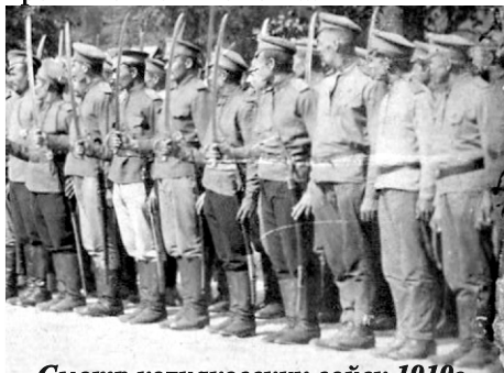
Смотр колчаковских войск 1919г.