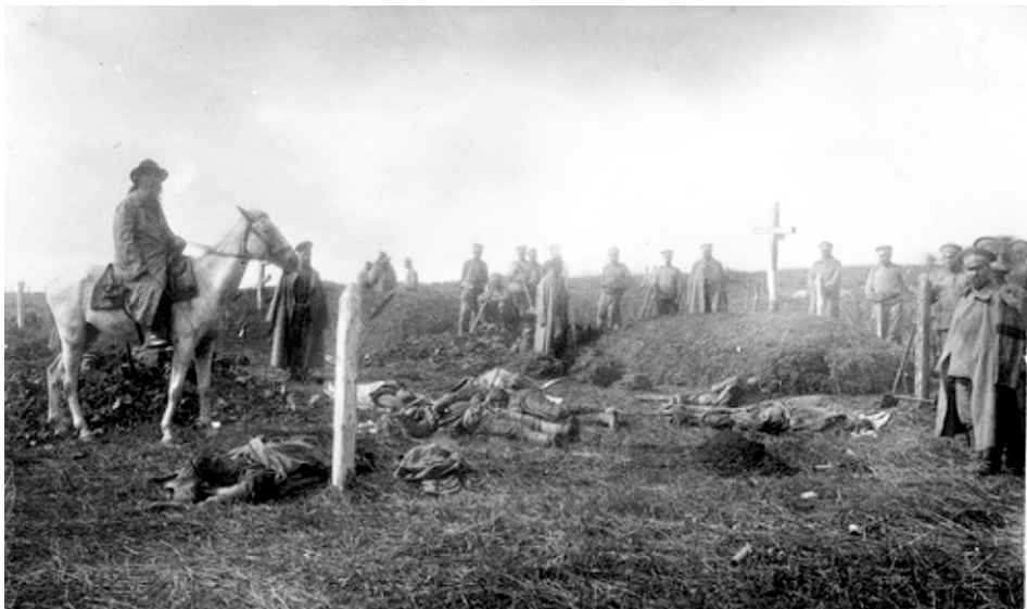
Еще не наступила Гражданская война, но уже пролилась кровь: Убитые офицеры и солдаты.

Наш полк был из числа «не-надежных» и поэтому правительство Керенского на фронт нас отправить не решалось.