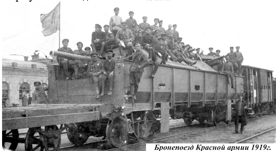
Бронепоезд Красной армии 1919г.

После отпуска, это было уже в 1921 году, меня направили в 18-й запасный полк. В дороге в г.Вятка заболел тифом, лежал в госпитале №128 в г.Москве. Когда выздоровел отправили на трудовой фронт. Демобилизовался в 1922 г.