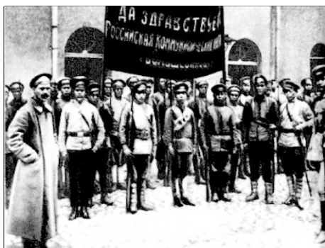
Коммунистический китайский отряд