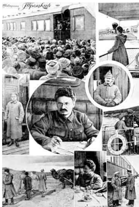
Агитационный плакат Троцкого составленный по принципу Жития Святых

В Н.Туру 4 и 5 декабря приезжал Троцкий. Был митинг, Троцкий был страстный красноречивый оратор, он нам объяснил положение на фронтах, что наступление белых на Кунгур приостановлено, что там в сентябре соединилась партизанская армия Блюхера, силы Красной Армии укрепились и она сама готовится наступать, а поэтому белогвардейцы вынуждены были сменить направление в наступлении и пытаются взять г.Пермь наступая по Горнозаводской линии. Митинг продолжался два часа. Троцкий призывал взять Верхотурье и Нижний Тагил.