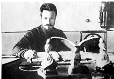
Командующий 4 армией Восточного фронта Михаил Васильевич Фрунзе

Полку удалось вырваться из окружения и пришлось изменить направление отступления. К нам в это время поступило подкрепление, и полк перешел в контратаку. Наступление белых на нашем участке мы приостановили,