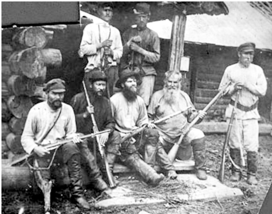
Красные партизаны? Кулацкая банда? Попробуй разберись кем они были в 1919г.

Нам хорошо помогали партизаны, но были и отрицательные явления. Солдаты от белых разбегались, причем некоторые с оружием и кое-где создавали банды, которые нападали на отдельные группы наших солдат и на обозы. Приходилось их вылавливать, помощь оказывали местные жители. На ст.Тайга у меня случился приступ аппендицита. После операции получил отпуск на один месяц, в ноябре был в Оханске. Оханским военкоматом был направлен в г.Пермь, а оттуда в 57-ю стрелковую дивизию.