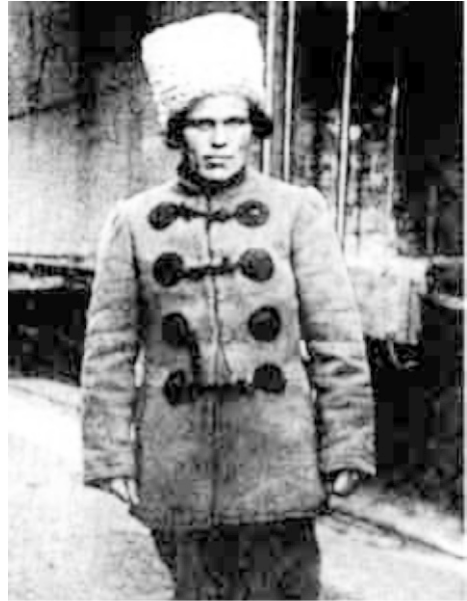
Предводитель "Вольных Советов" батька Нестор Махно в 1919г.

В числе первых форсировал Сиваш, но удержаться на Арбатской стрелке не могли, пришлось отступить, причем обратно ветер нагнал воды много, и переправа была очень трудная.