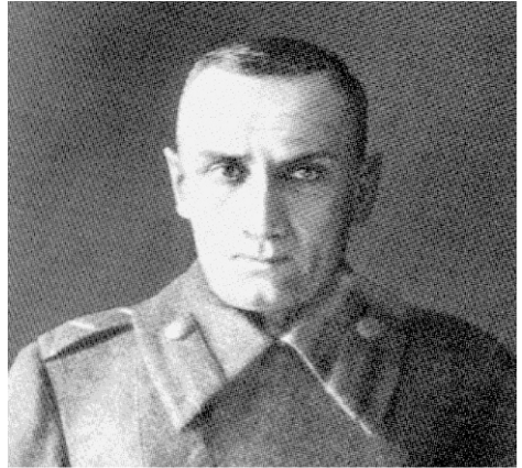
Последняя фотография А.В.Колчака 1920г.

Я сравнил чехов с холодным нарывом, способным дать когда-нибудь острое и опасное для нас воспаление. Чехи, прожив с нами год, от нас отошли; ничего не делая, относясь критически к