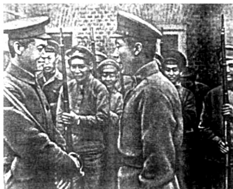
Формирование китайского полка 1918 г.

Занимались разными работами, вытаскивали дрова на Каме и