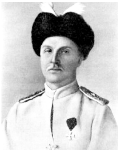
Гетман украины Павел Скоропадский

С боями прошли Сызрань, Самару, Богуруслан. 31 декабря 1918 г. заняли г.Уфу. Но затем в марте 1919 г. белые начали снова наступать и мы отступили почти до Самары. Не дошли 85 км. 28 и 29 апреля 5-я армия пошла в наступление и в начале мая (4) взяли