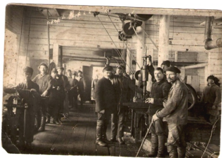
Слесарно-токарные мастерские 1923г. СРЗ п/м. Двержинского. г. Пермь

Попробуем прочитать чуть больше записанного, заглянуть чуть дальше увиденного ими: с высоты нашего вре-