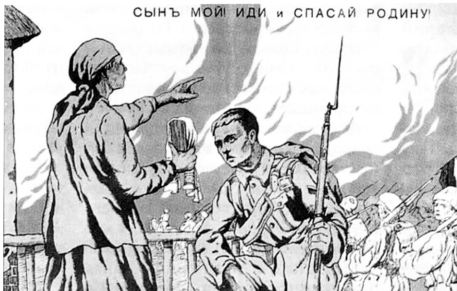
Белогвардейский агитационный плакат

Опасаясь, что меня заберут, скрылся в лесу. 10 дней кормил комаров, потом сообщили, что белые ушли и я вышел из леса.