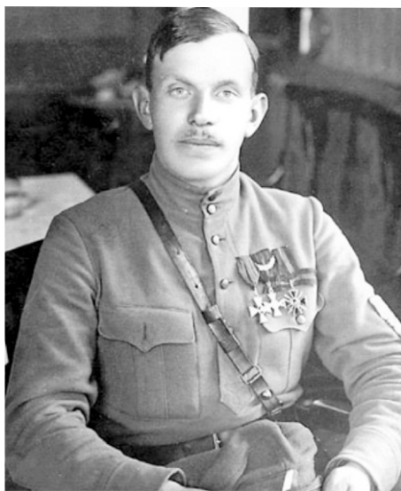
Радолга Гайда, с января 1919 года генерал-лейтенант, командующий Сибирской армией

21 сентября наш полк с ходу выбил белых со ст.Шумково и начались бои за ст.Кордон и Шамары. Ст.Кордон и Шамары мы взяли. Полк перевели на отдых на ст.Шумково. Фронт был в 70 км. Но отдыхали только день и снова наш полк вступил в оборону за ст.Кордон. Наш 1-й батальон был окружен с трех сторон, а с 4-й р.Сылва. Лесами, болотами вышли из окружения и через день соединились с полком.