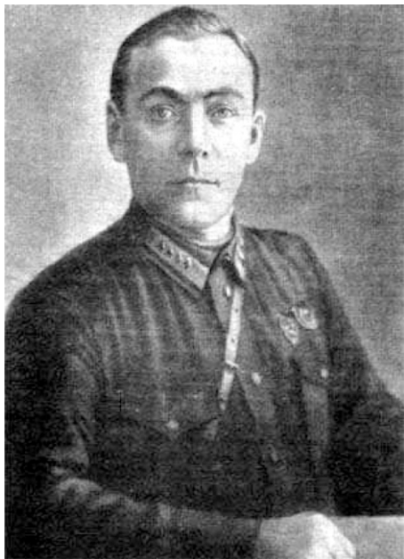
Главнокомандующий Сводным Уральским отрядом до 2 августа 1918 года Николай Дмитриевич Каширин.

В Белорецк подошли подкрепления: отряды Златоустовцев, Симского завода, Катав-Ивановского завода и отряды Н.Д.Каширина и В.К.Блюхера.