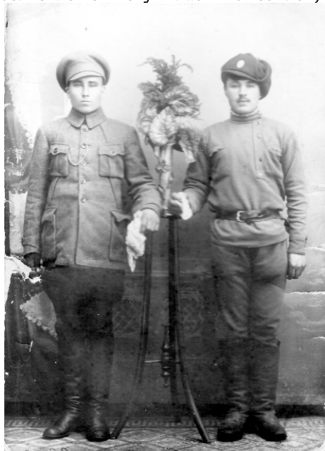
Справа боец в шапке-колчаковке с кокардой 1919г.

Очень хотелось, чтобы это совещание внесло новую живую и жизненную струю в дряблую работу нашей государственной власти и сблизило бы эту власть с землей,