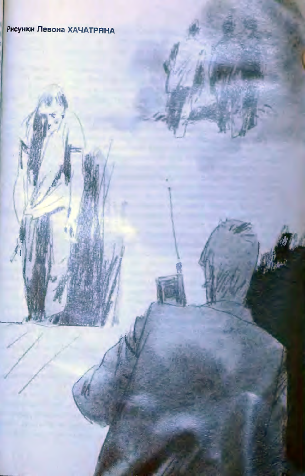
Рисунки Левона ХАЧАТРЯНА