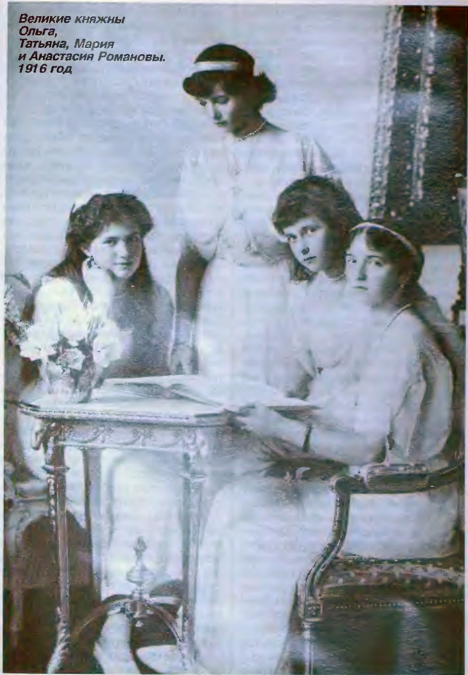
Великие княжны Ольга, Татьяна, Мария и Анастасия Романовы. 1916 год