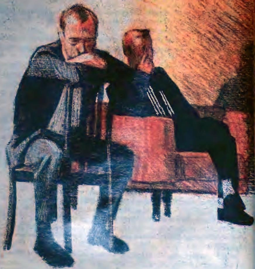
Рисунки Марины ПИНКИСЕВИЧ

так: ты, Аля, ступай на кухню, там Боборыкин один вкалывает. Ты, Женечка, останешься здесь, мы будем протирать фужеры. А товарищ доцент у нас мастер столы раздвигать.