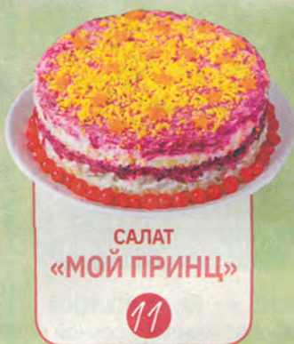
САЛАТ «МОЙ ПРИНЦ»

КРУПЫ И БОБОВЫЕ: НОВЫЙ ВЗГЛЯД НА ПРИВЫЧНУЮ ГРЕЧКУ 16