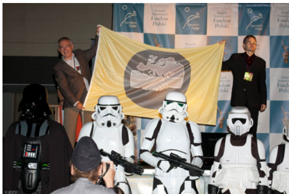
Шведская делегация со знаменем Еврокона