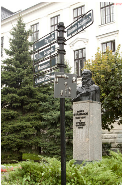
По всему городу висели указатели, показывающие дорогу на Трикон

Кстати, открылся Еврокон встречей на Мосту Дружбы мэров Цешина и Ческого Тешина. Каждый из мэров пришел в окружении свиты фантастических персонажей и фэнтезийных существ, среди которых были замечены доблестные рыцари и благородные дамы, имперские штурмовики и повстанцы из «Звездных войн», прекрасные эльфийки, огромный многоногий дракон и даже кролик от «Плейбоя».