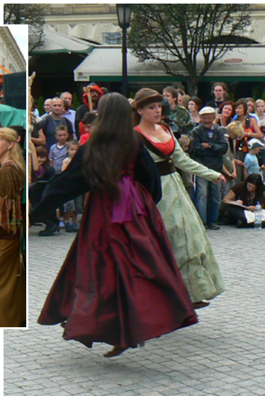
Фантастические персонажи и фэнтезийные существа смотрят на местных колдуний, исполняющих средневековые танцы