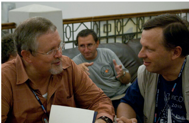
Орсон Кард рассказывает автору, почему он сам не написал сценарий «Игры Эндера»