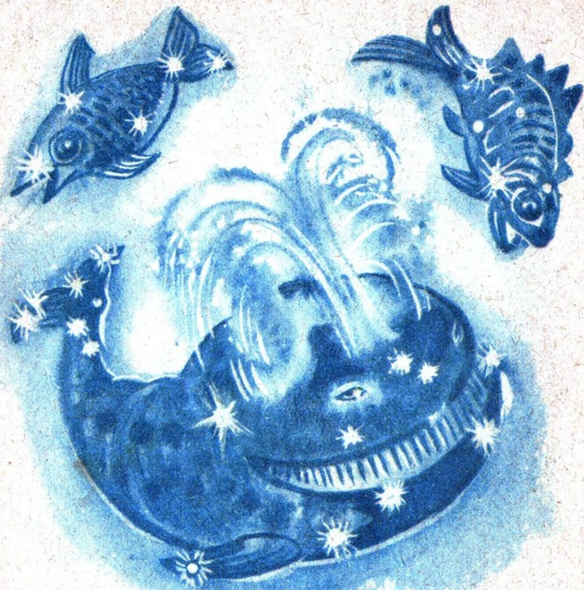
Засияли в синем небе Кит и Рыбы,