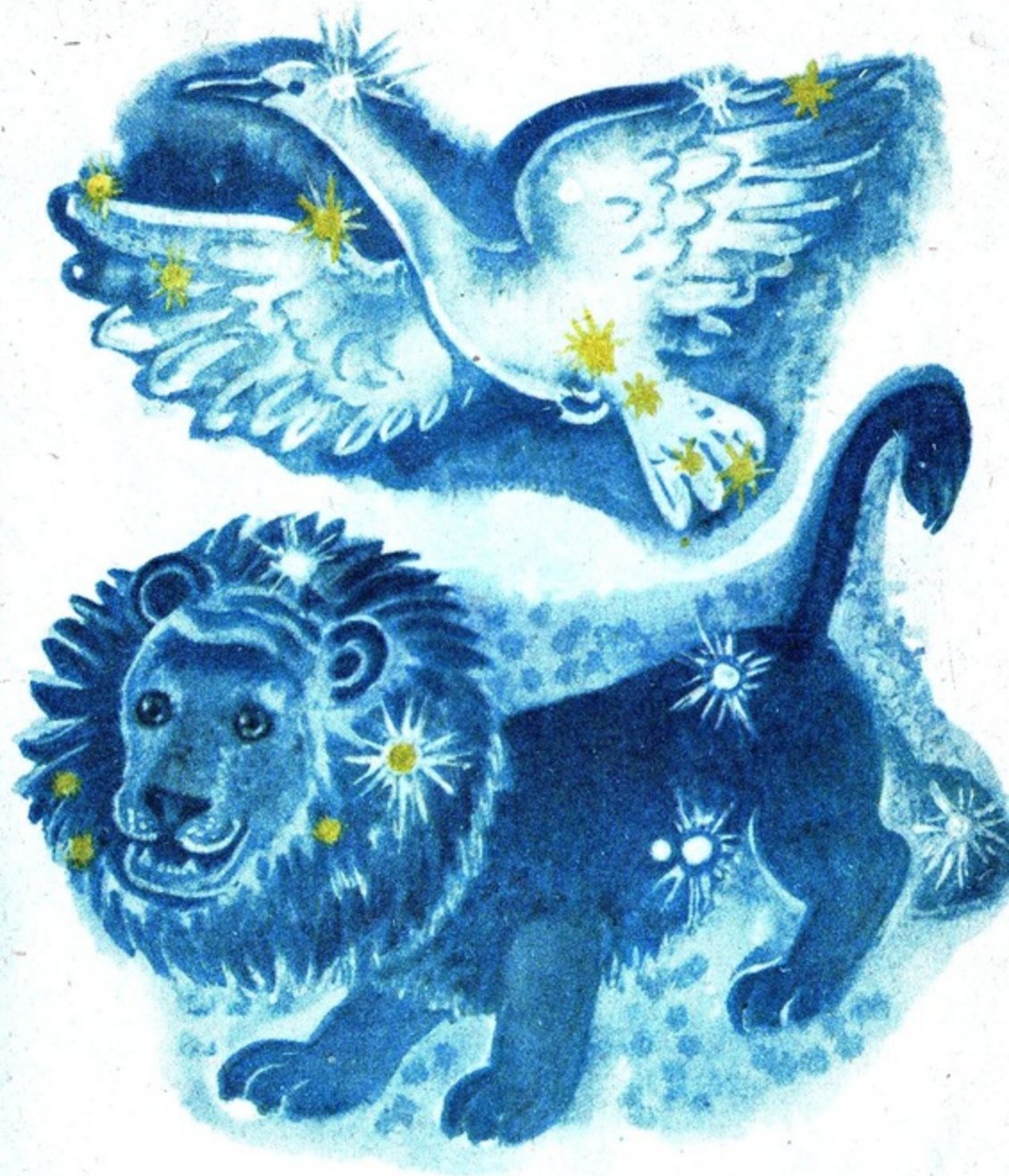
Лев и Лебедь,