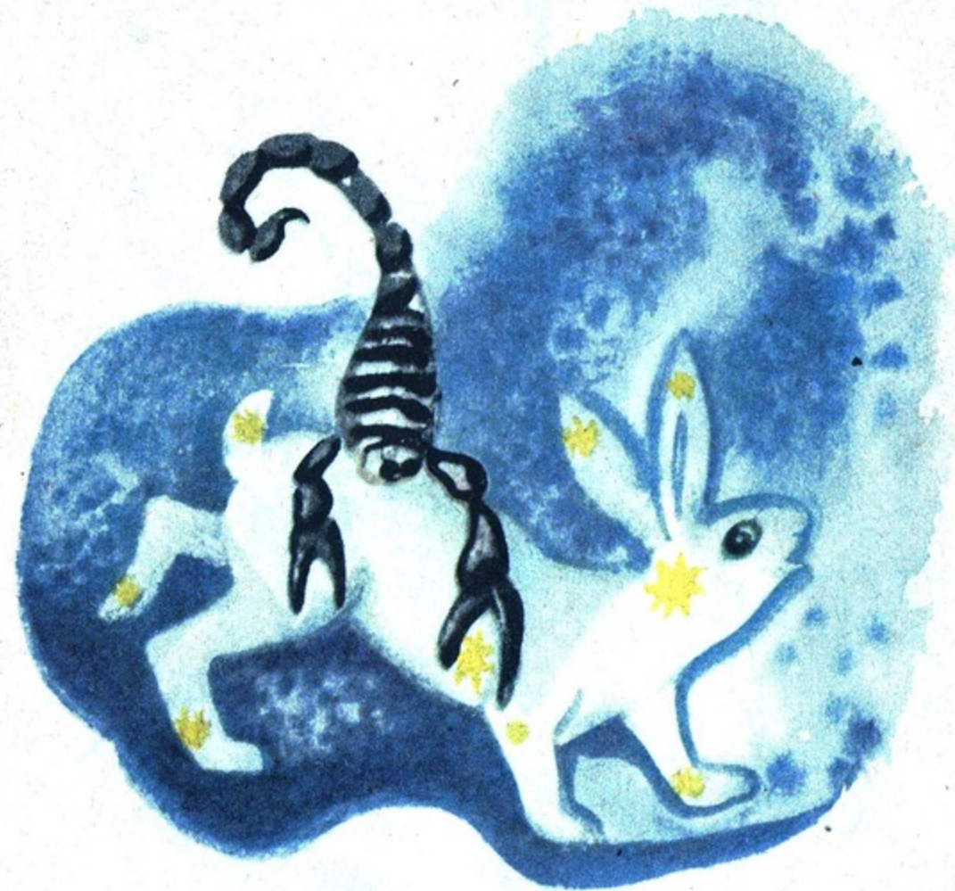
Жалит Зайца Скорпион!