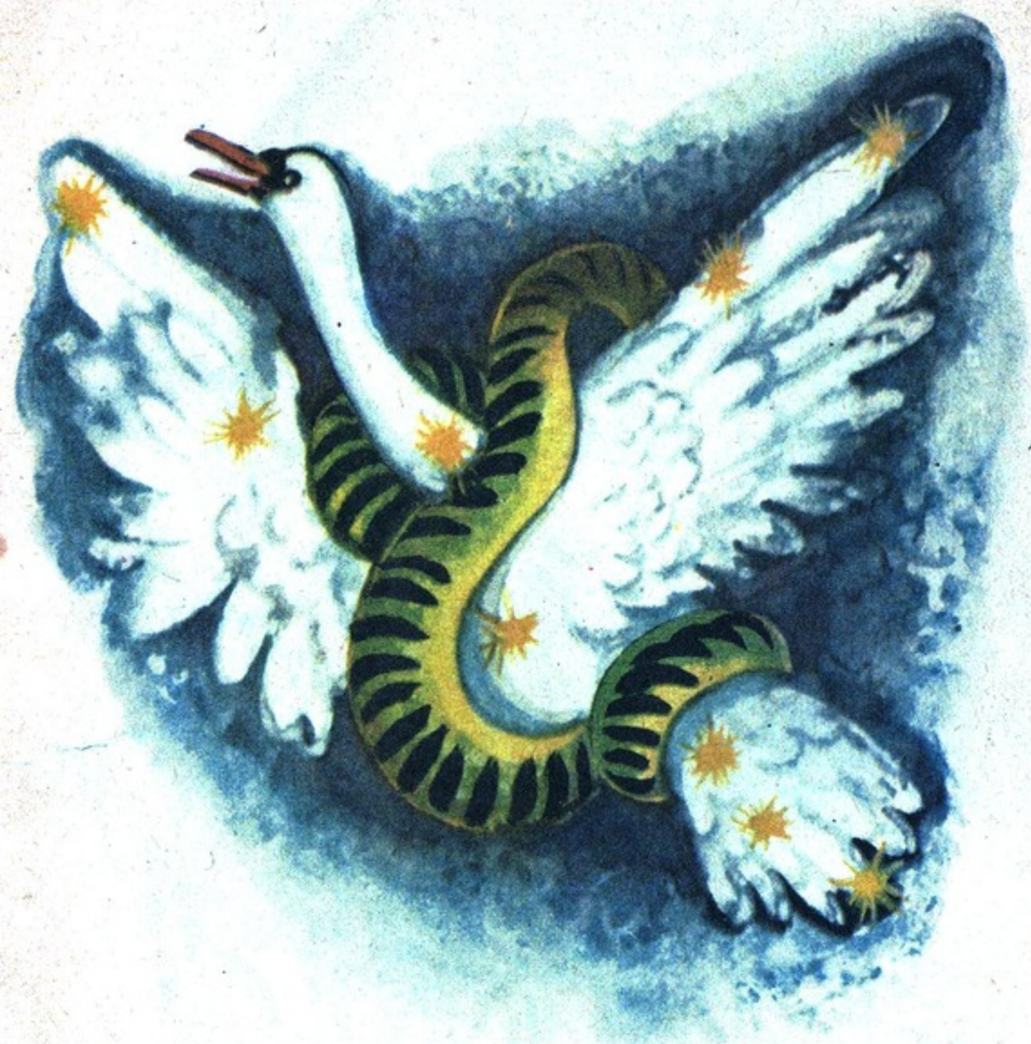
Душит Лебедя Змея!