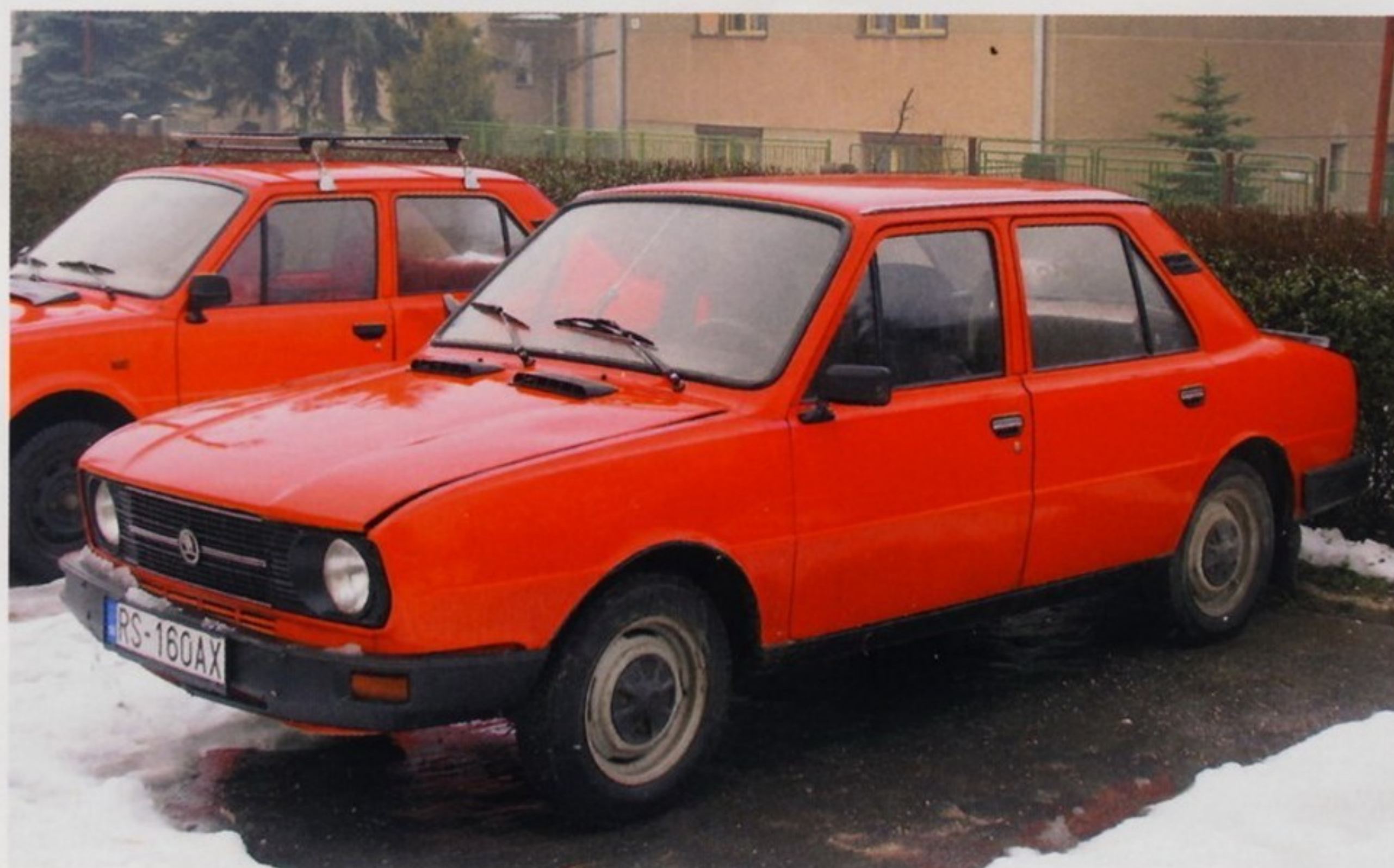
Автомобиль Škoda 105 L внешне легко отличить от модификации Škoda 105 S по дополнительному молдингу на решетке радиатора

При переносе радиатора вперед конструкторы были вынуждены усложнить систему охлаждения двигателя — увеличить общую