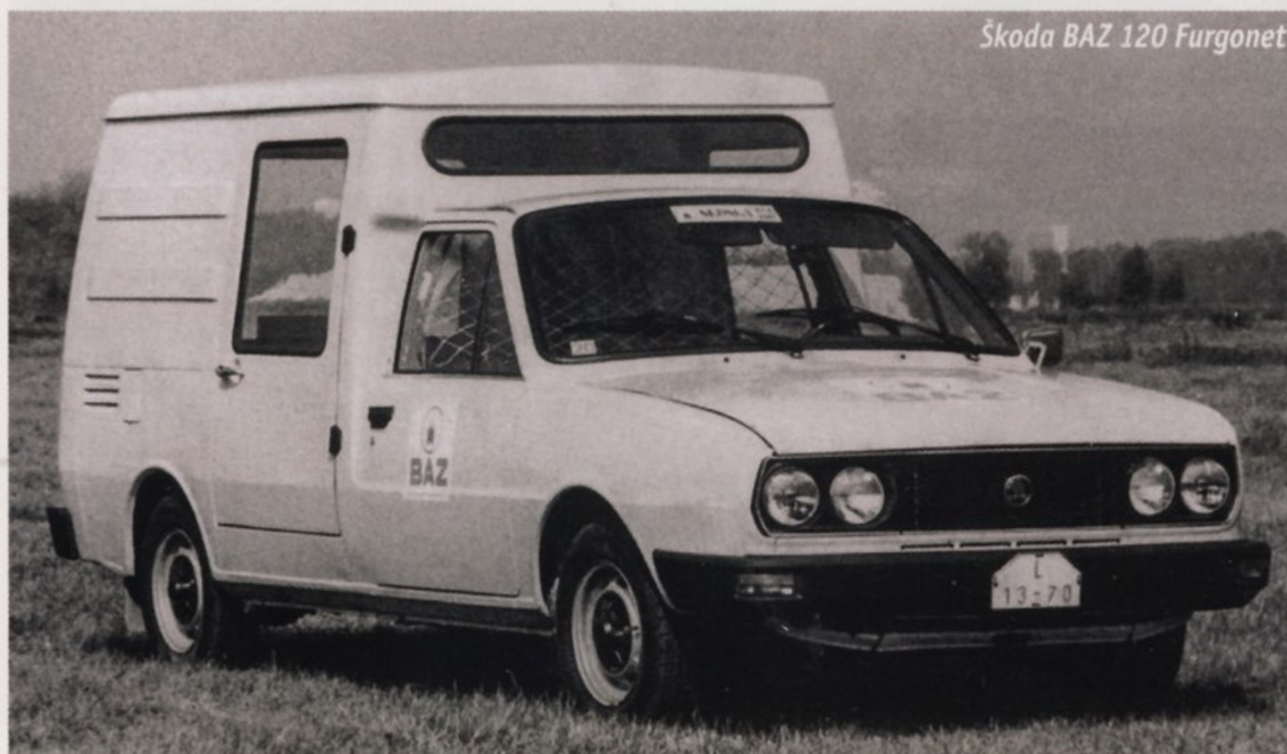
Škoda BAZ 120 Furgonet

В 1982 году в словацкой Братиславе на заводе BAZ ( Bratislavských automobilových závodov — Братиславский автомобильный завод) на базе заднемоторного автомобиля Škoda 105 был создан легкий фургон в двух вариантах исполнения: застекленный и с глухими стенками кузова. Задняя часть машины (после передних дверей) была полностью оригинальной и представляла собой огромный куб. Для погрузки