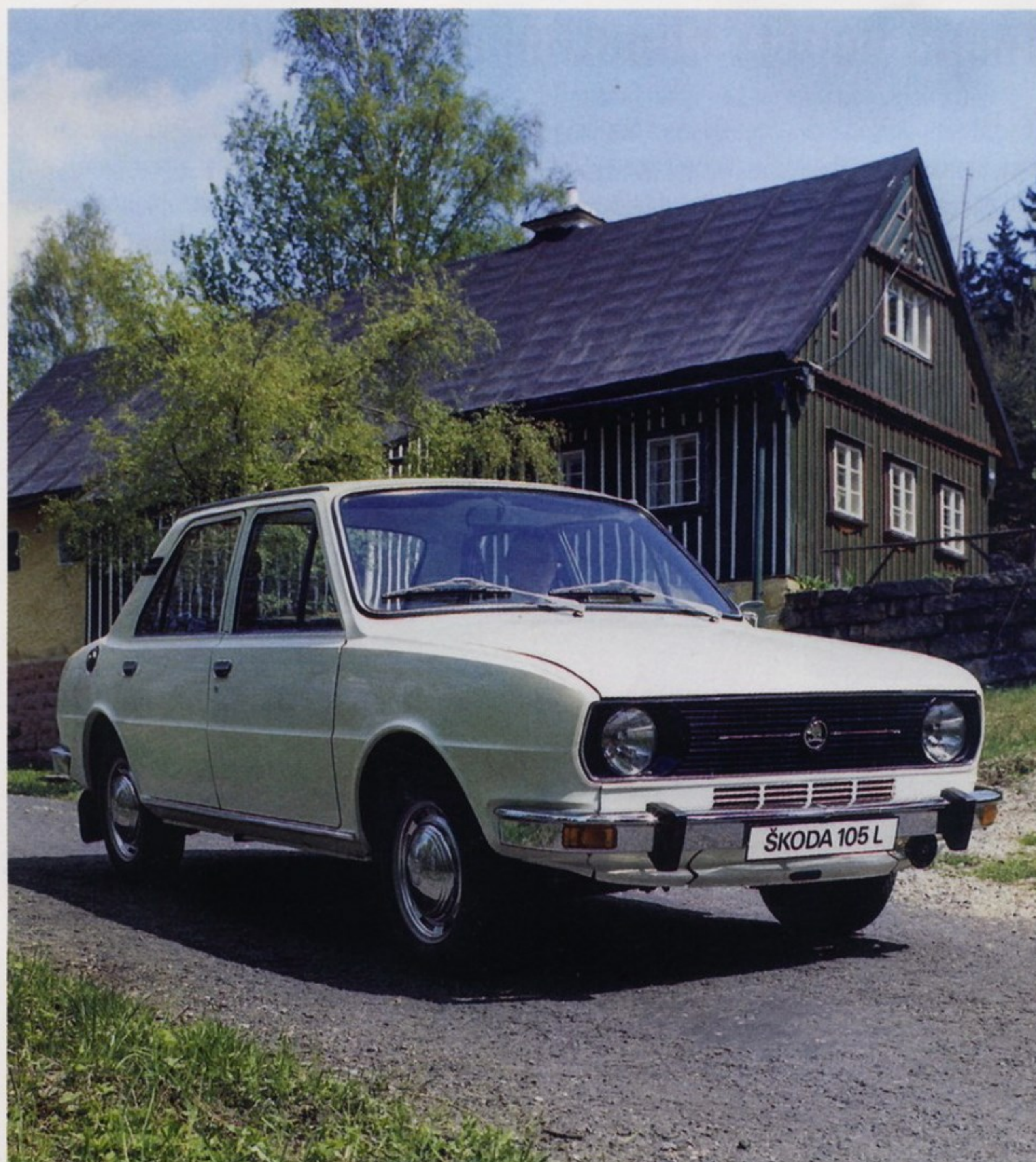
Легковой автомобиль Škoda 105 L в улучшенной комплектации

В соответствии с международными нормами безопасности кузовы Škoda оснастили передними и задними деформируемыми зонами и специальными усиливающими профилями в центральной части, чтобы она меньше