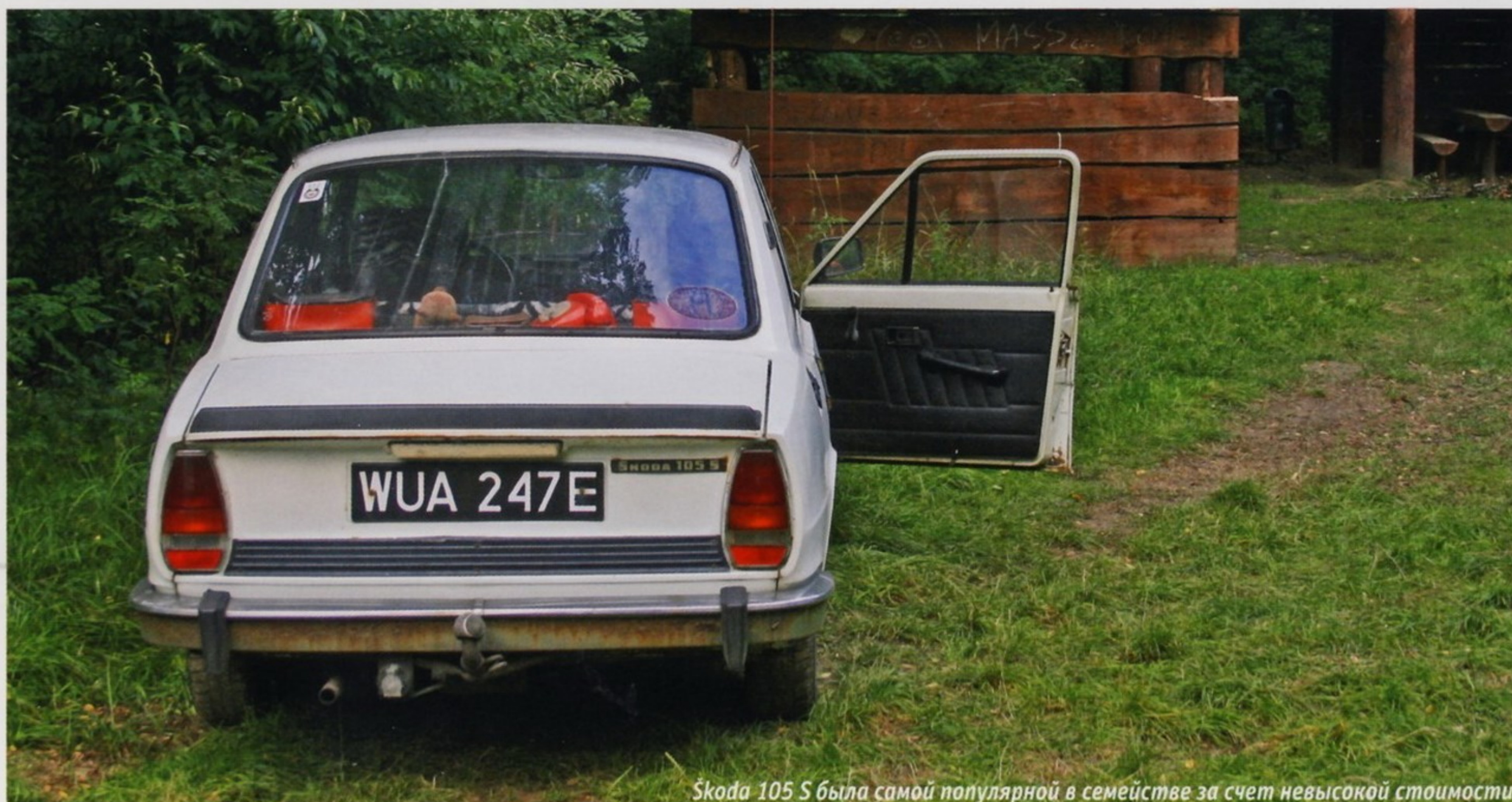
Škoda 105 S была самой популярной в семействе за счет невысокой стоимости

Отличить вариант Škoda 105 S от Škoda 105 L было сложнее — у машины в люксовом исполнении на решетке радиатора необходимо было разглядеть небольшой хромированный молдинг между фарами.