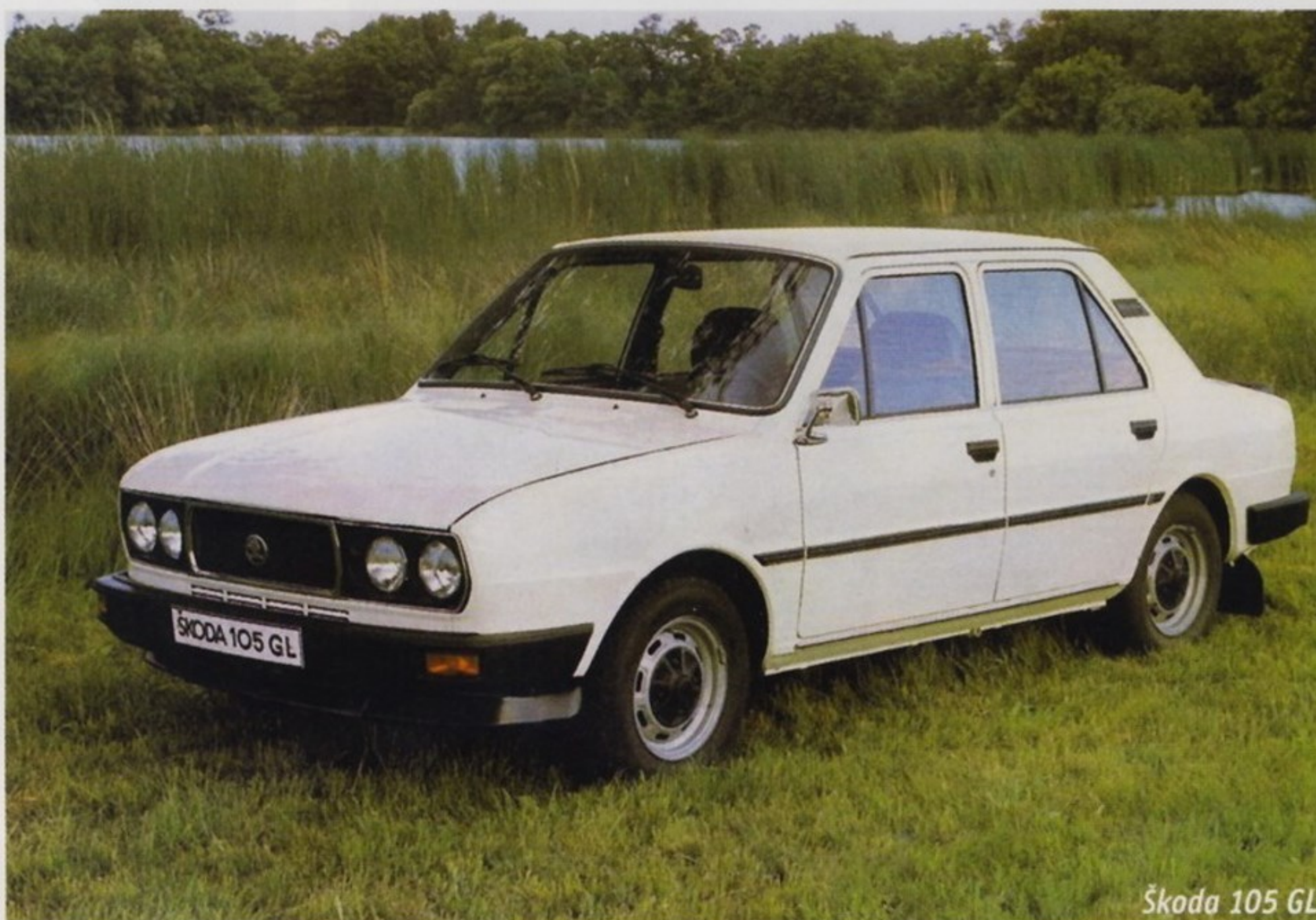
Škoda 105 GL

Škoda 105 GL и 120 GLS первых выпусков можно отличить от других модификаций по решетке радиатора, черным пластиковым бамперам, дополнительным боковым накладкам на кузове, а сзади — по новым большим горизонтальным задним фонарям. В 1984 году, после рестайлинга, автомобили Škoda 105 GL и 120 GLS внешне значительно меньше отличались от других модификаций — в основном дополнительными черными пластиковыми накладками на боковинах кузова между колесными арками. Интересный факт: Škoda 105 GL выпускалась филиалом завода Škoda