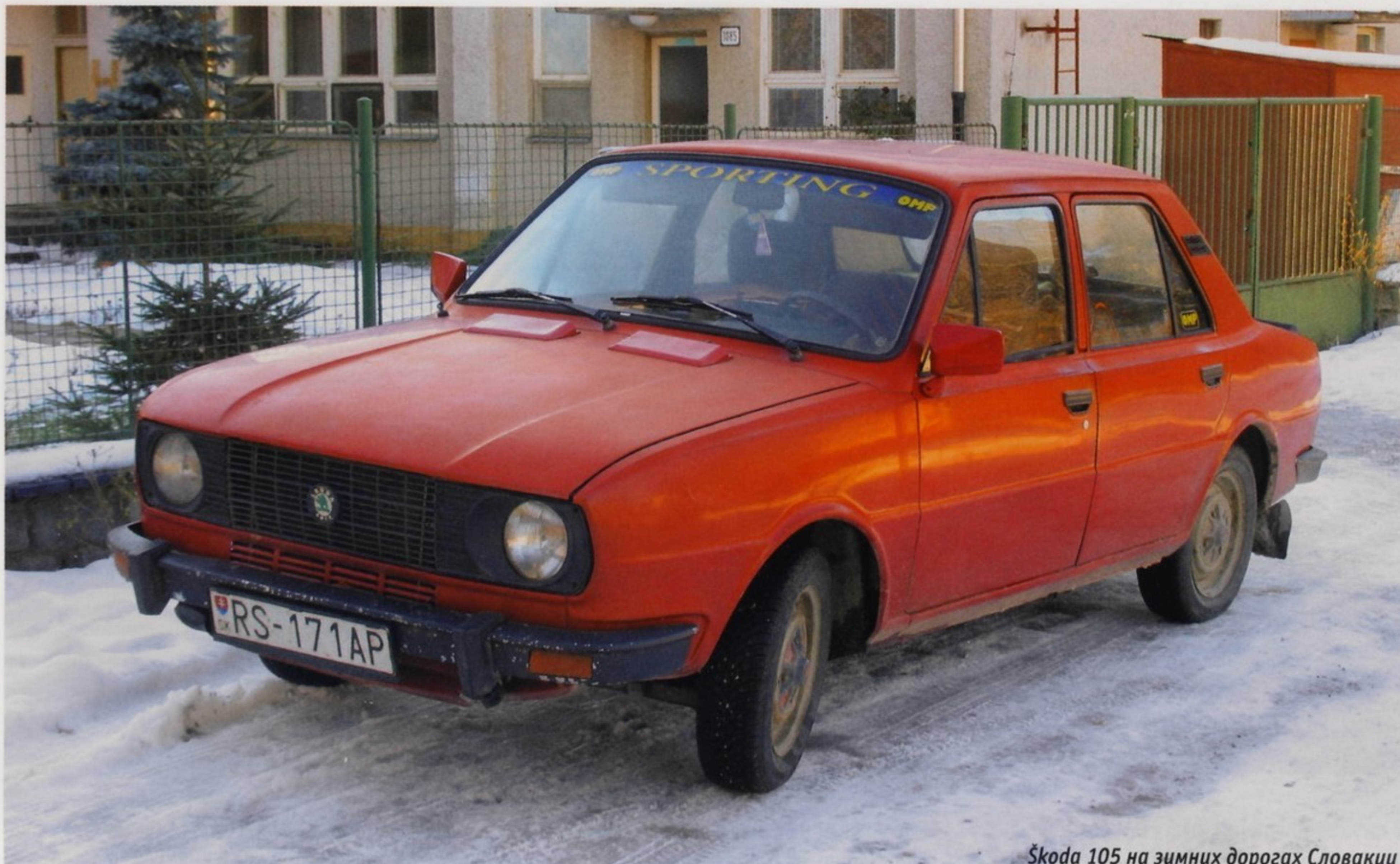
Škoda 105 на зимних дорогах Словакии

с размерами салонов автомобилей более высокого класса за счет рационального использования внутреннего пространства. Поскольку двигатель располагался сзади, все сиденья удалось сместить немного вперед относительно колесной базы, и в результате заднее пассажирское сиденье больше не зажималось по ширине задними колесными арками.