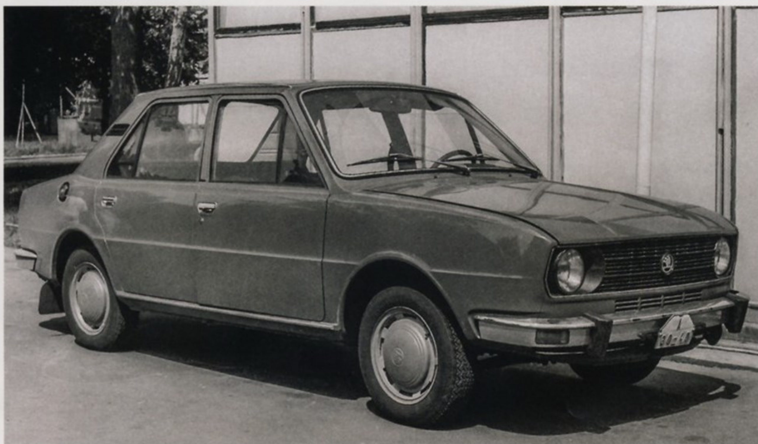
Легковой автомобиль Škoda 105 S в стандартной комплектации

деформировалась в случае ДТП. В салоне все опасно выступающие элементы были специально скруглены или покрыты мягкой травмобезопасной обивкой. Топливный бак на новых Škoda переместился из переднего багажника в более