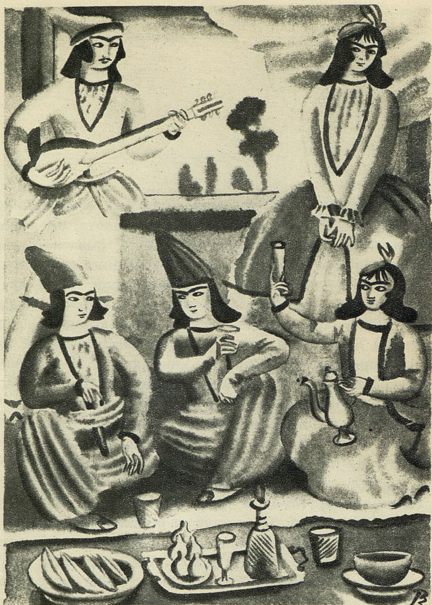
На одной свадьбе Ашик увидел Магуль-Мегери.