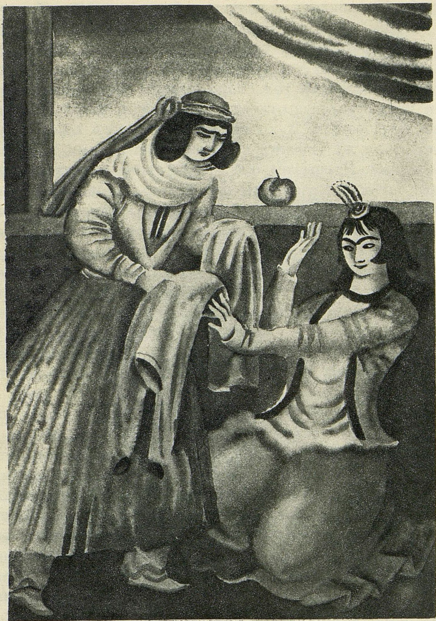
Мать взяла одежды и понесла к нареченной невестке.