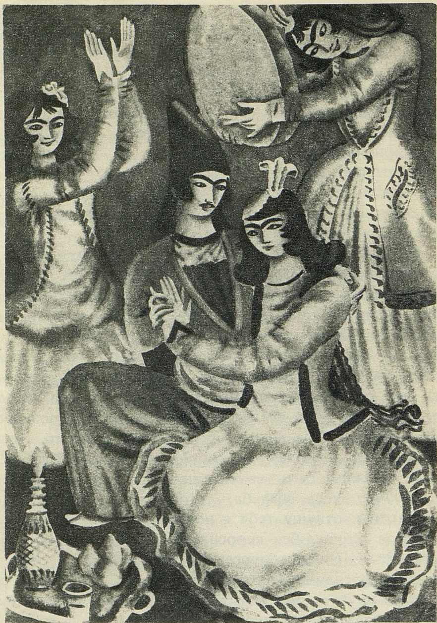
Магуль-Мегери узнала своего Ашик-Кериба.