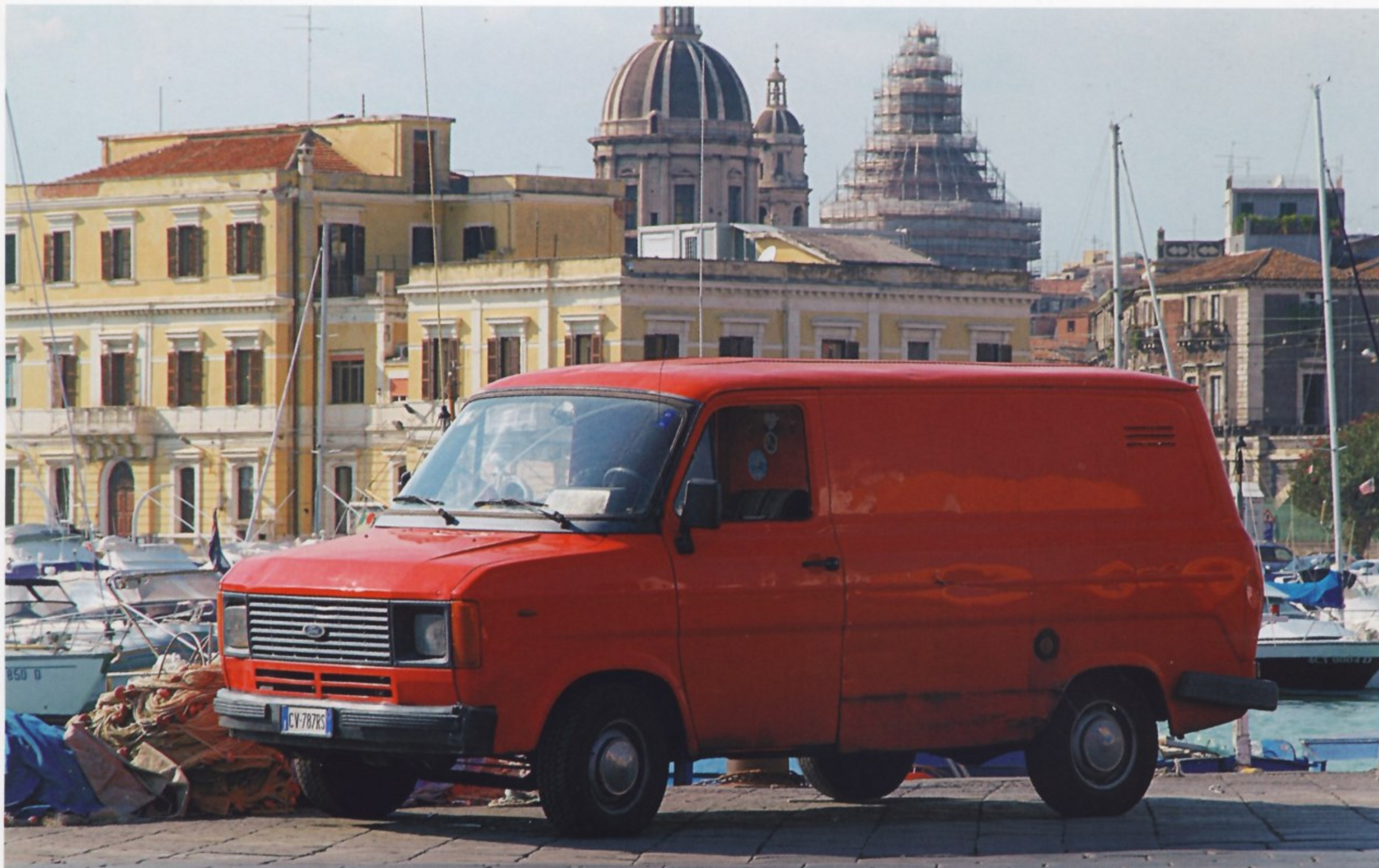
TRANSIT ДОСТАВИТ УТРЕННИЙ УЛОВ ИЗ ПОРТА В МАГАЗИНЫ И РЕСТОРАНЫ