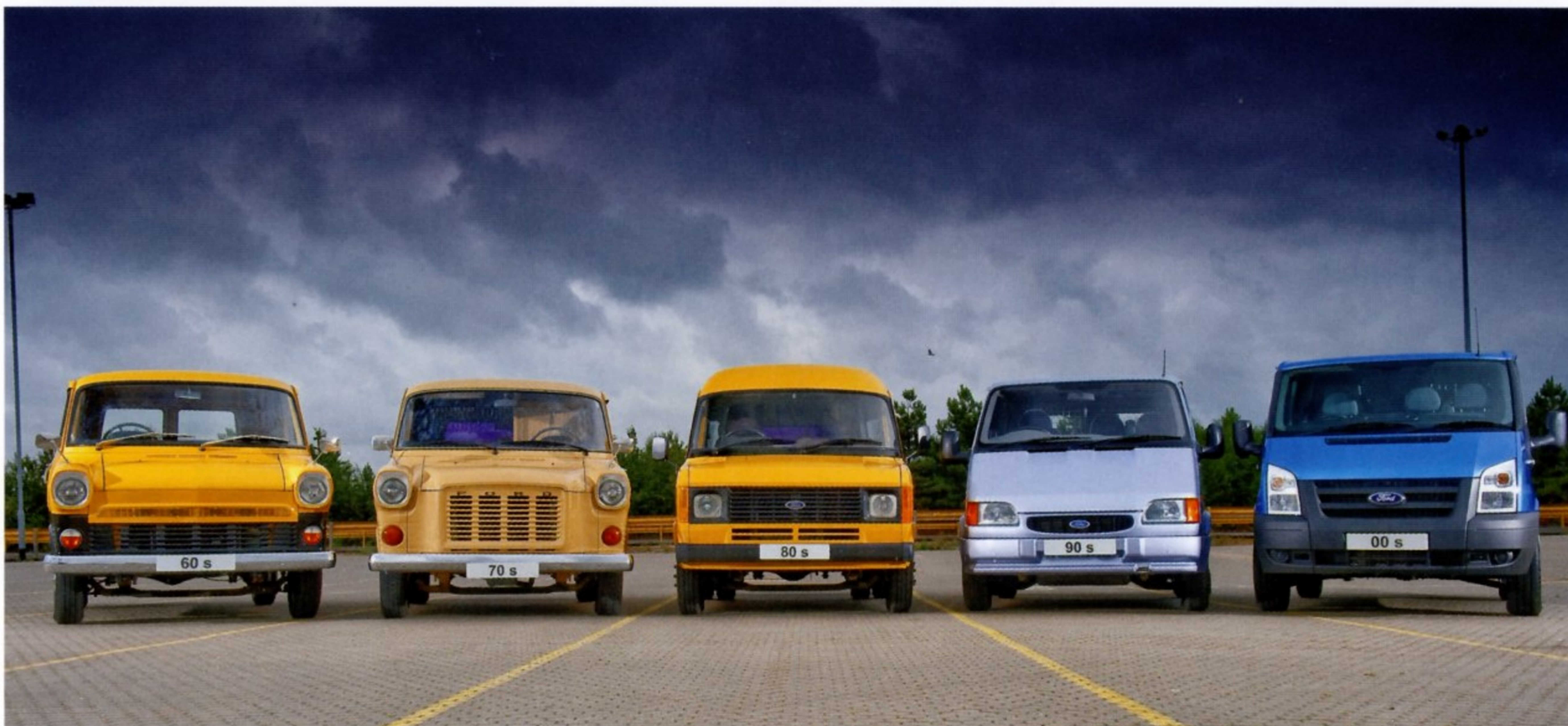
ЭТИ АВТОМОБИЛИ FORD TRANSIT НАГЛЯДНО ИЛЛЮСТРИРУЮТ, КАК МЕНЯЛАСЬ МОДЕЛЬ С ТЕЧЕНИЕМ ВРЕМЕНИ