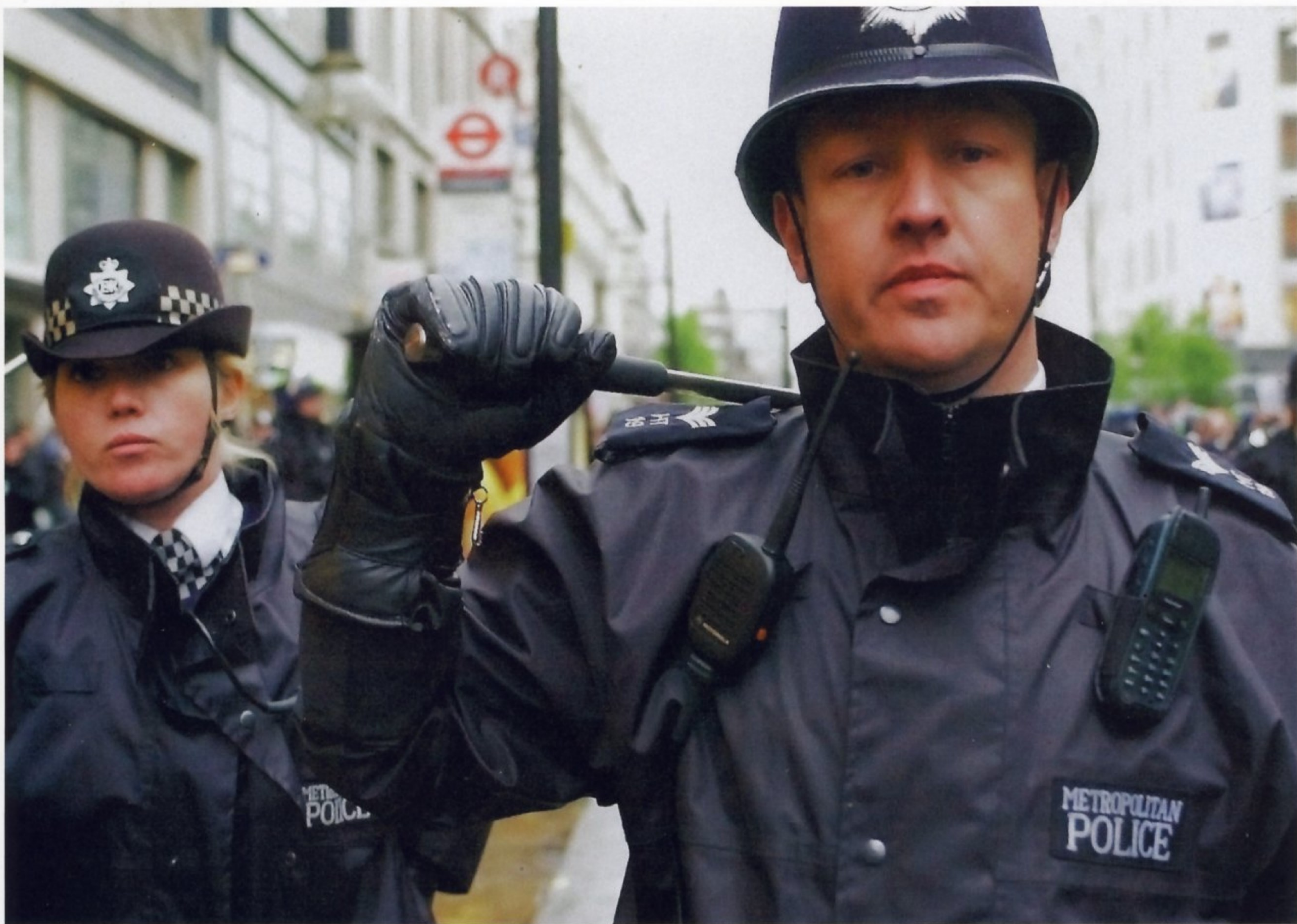
ПОЛИЦЕЙСКИЕ НА УЛИЦАХ БРИТАНСКОЙ СТОЛИЦЫ ПОКА ЕЩЕ ОБХОДЯТСЯ БЕЗ ОГНЕСТРЕЛЬНОГО ОРУЖИЯ

Каждый, кто хоть раз бывал в Великобритании, наверняка заметил, что полицейские, несущие службу на улицах городов, не имеют при себе огнестрельного оружия. Дубинка, наручники, газовый баллончик — вот и весь «джентльменский набор» британских «бобби». Для англичан это норма, а вот гостей из других стран Европы и тем более из Соединенных Штатов Америки такое «легкое вооружение» приводит в изумление. Дело в том, что в Великобритании действует один из самых жестких в мире законов об огнестрельном оружии, поэтому большая часть населения ружей и пистолетов не имеет — значит, и полиция их иметь не должна. Так было когда-то установлено, так дела обстоят и сегодня: только небольшая часть полицейских имеет право носить оружие. По данным Министерства внутренних дел, в Англии и Уэльсе огнестрельное оружие есть только у 5% личного состава полиции. К ним относятся сотрудники полицейских формирований, в задачу которых входит охрана важных персон, посольств иностранных государств, аэропортов, стратегических объектов, а также бойцы спецподразделений. Однако не стоит думать, что патрульные «бобби» абсолютно беззащитны перед преступниками. Они всегда могут вызвать на помощь «автомобиль огневой поддержки» с вооруженными полицейскими.