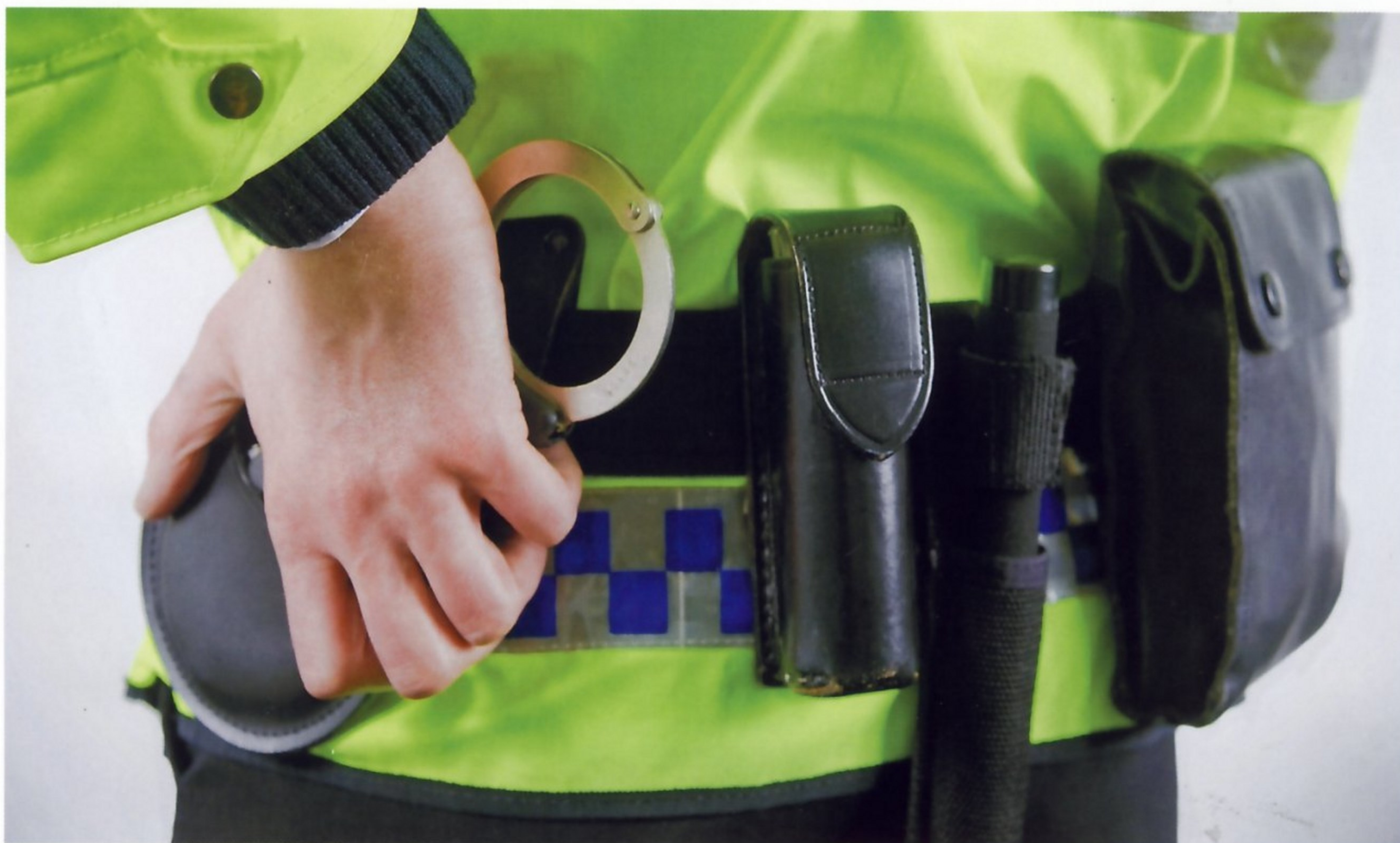
НА ПОЯСЕ ЛОНДОНСКОГО ПОЛИЦЕЙСКОГО — НАРУЧНИКИ, ГАЗОВЫЙ БАЛЛОНЧИК, ТЕЛЕСКОПИЧЕСКАЯ ДУБИНКА И ПОДСУМОК С ДОКУМЕНТАМИ И МЕДИКАМЕНТАМИ

часть полицейских вооружили электрошоковыми «тейзерами». Это устройство стреляет двумя дротиками, соединенными с корпусом оружия электрическими проводами. При попадании дротика в цель на него подается электрический разряд в 50 тысяч вольт, который проникает через одежду толщиной до 50 мм и вызывает у человека временный паралич. Дротики выстреливаются при помощи сжатого воздуха и летят со скоростью 55 м/сек, а наведение на объект поражения осуществляется при помощи лазерного прицела.