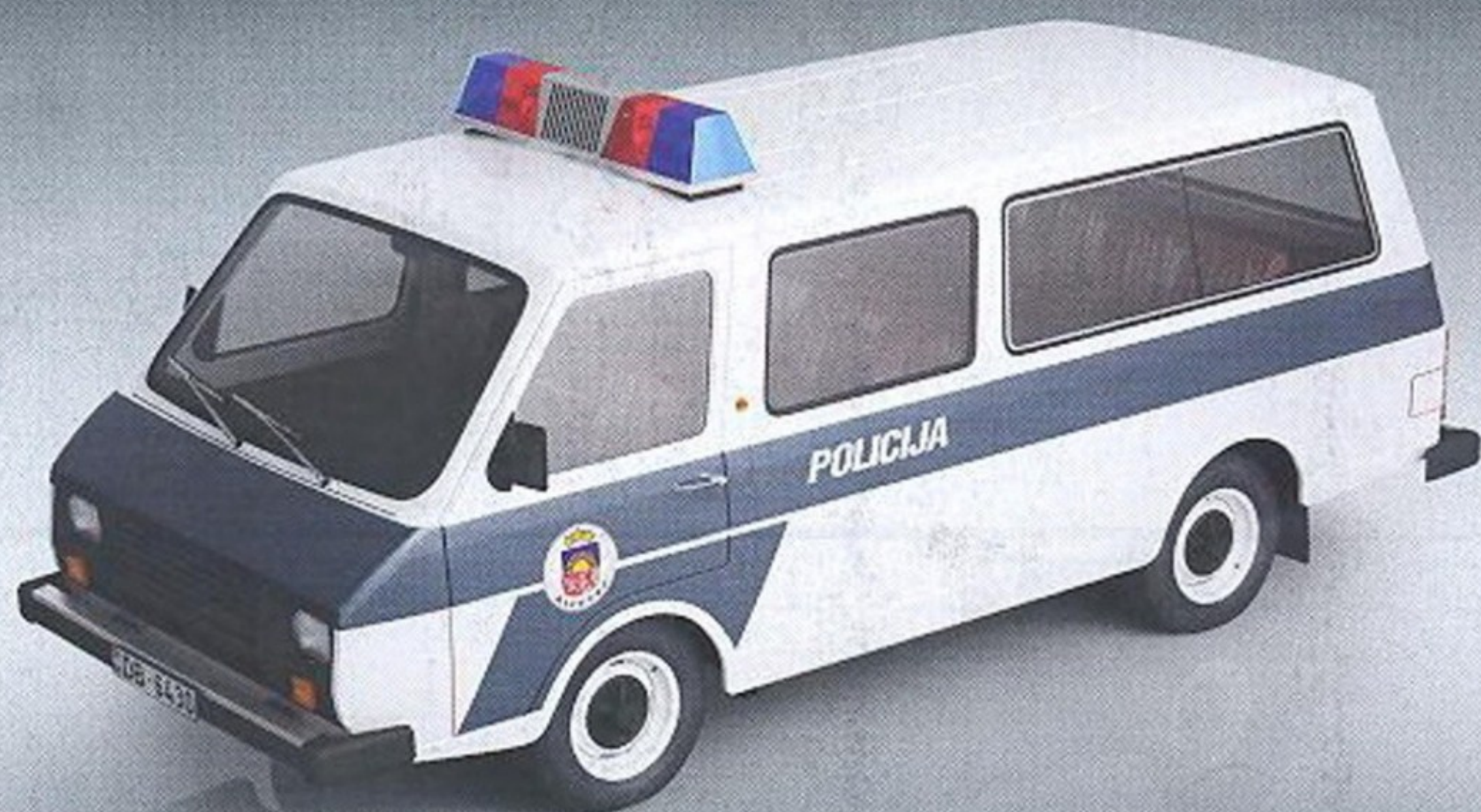
РАФ-22038 ПОЛИЦИЯ ЛАТВИИ