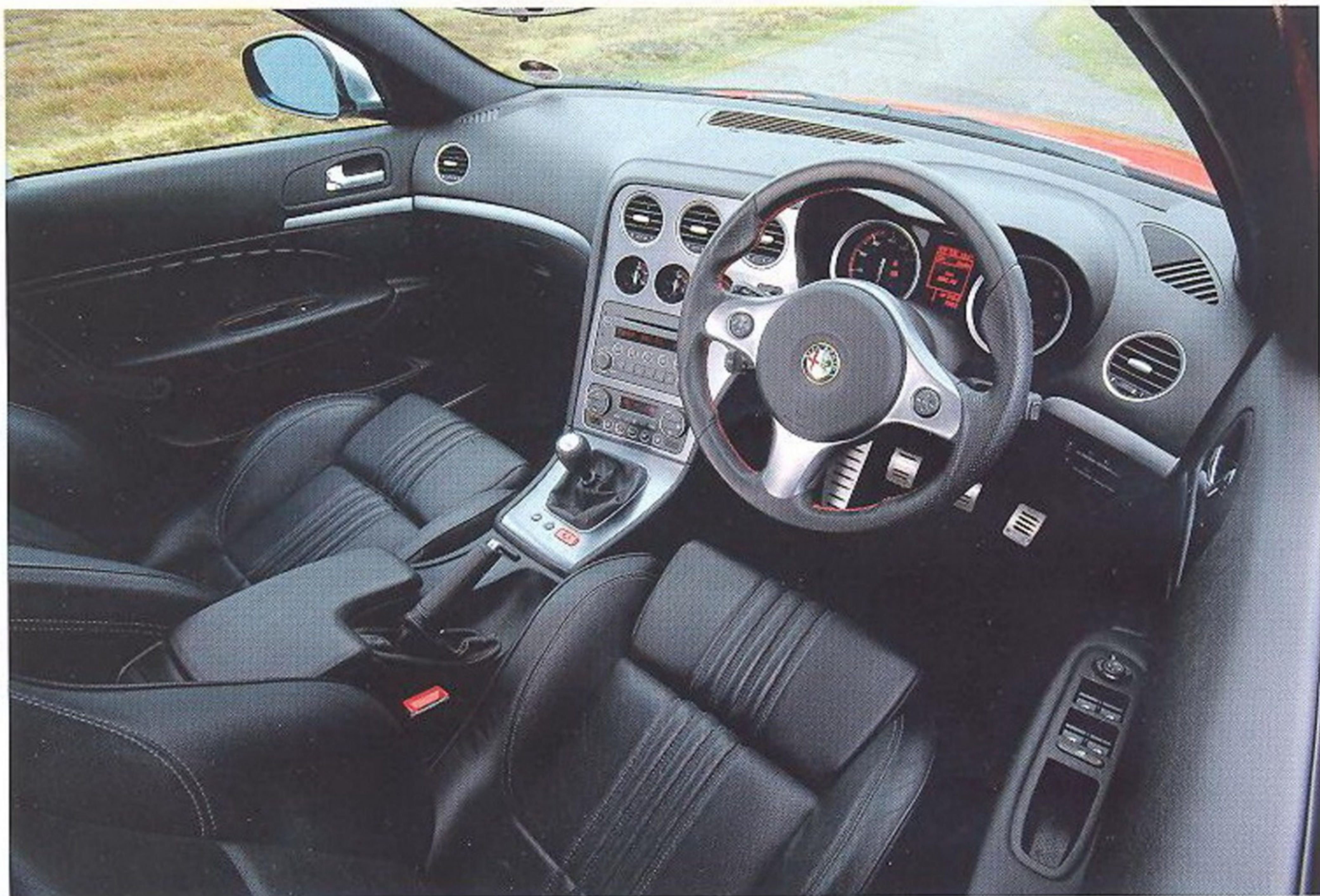
ИНТЕРЬЕР МОДЕЛИ ALFA ROMEO 159 2007 ГОДА, ПРЕДНАЗНАЧЕННОЙ ДЛЯ ЭКСПОРТА В СТРАНЫ С ЛЕВОСТОРОННИМ ДВИЖЕНИЕМ

решили поручить независимому дизайн-ателье. Выбор пал на студию ItalDesign, которой руководил один из крупнейших стилистов современности Джорджетто Джуджаро. Именно он в сотрудничестве с Alfa Centro Stile и придумал внешность Alfa Romeo 159. Перед конструкторами и дизайнерами поставили задачу сделать автомобиль, который по объему продаж, как минимум, не уступал бы модели «156», а в случае успеха и превзошел бы ее.