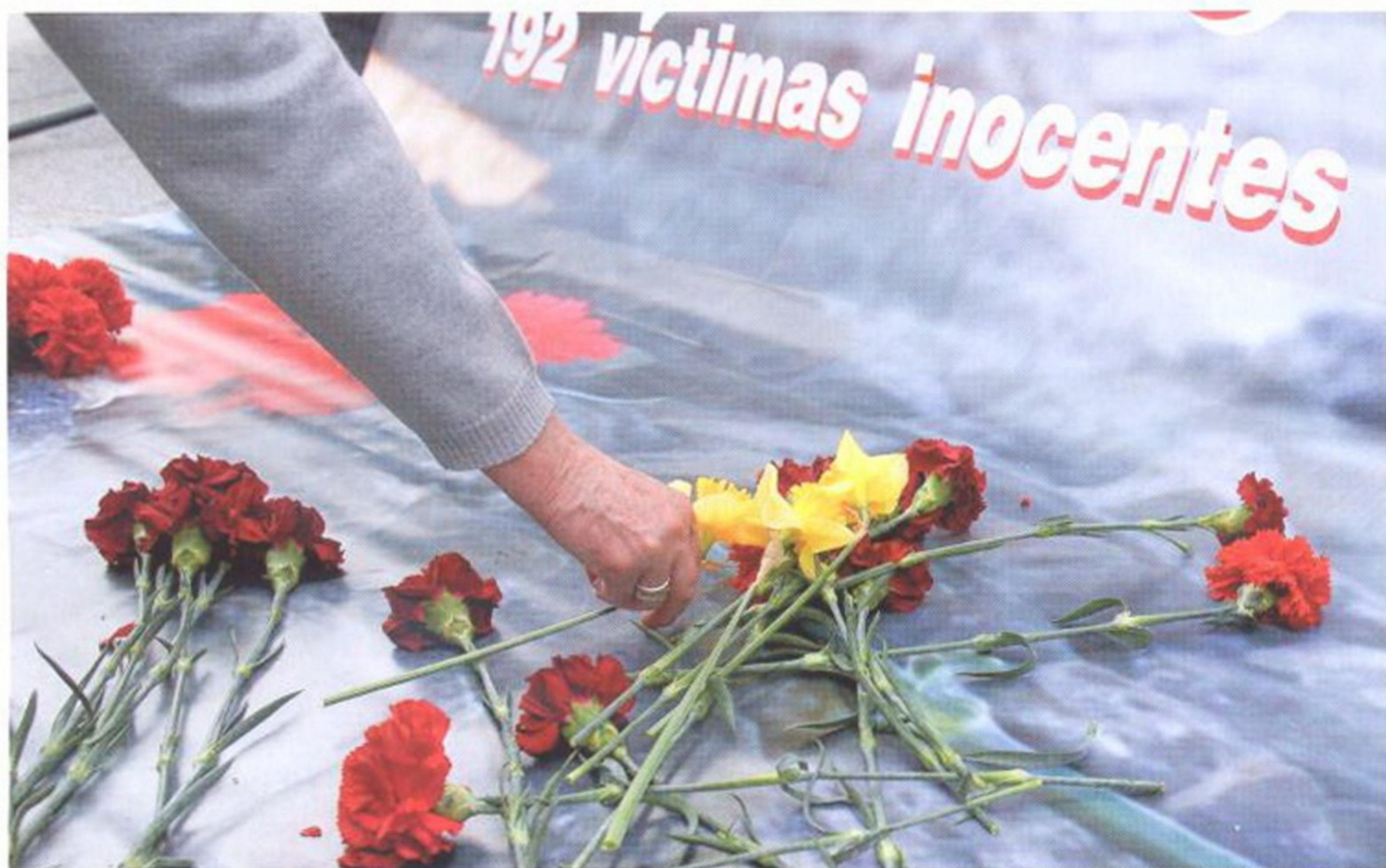
КАЖДЫЙ ГОД 11 МАРТА ИСПАНЦЫ ПРИНОСЯТ ЦВЕТЫ И СВЕЧИ К ПАМЯТНИКУ ПОГИБШИМ ВО ВРЕМЯ ТЕРАКТОВ В 2004 ГОДУ

11 марта 2004 года навсегда останется в истории Испании как день национальной трагедии. Тогда столицу страны Мадрид потрясла серия взрывов. Они прогремели между 7.30 и 8.00 утра возле трех железнодорожных вокзалов — Аточа, Санта Евгения, Позо Дель Тио Раймундо — и городской ассамблеи.