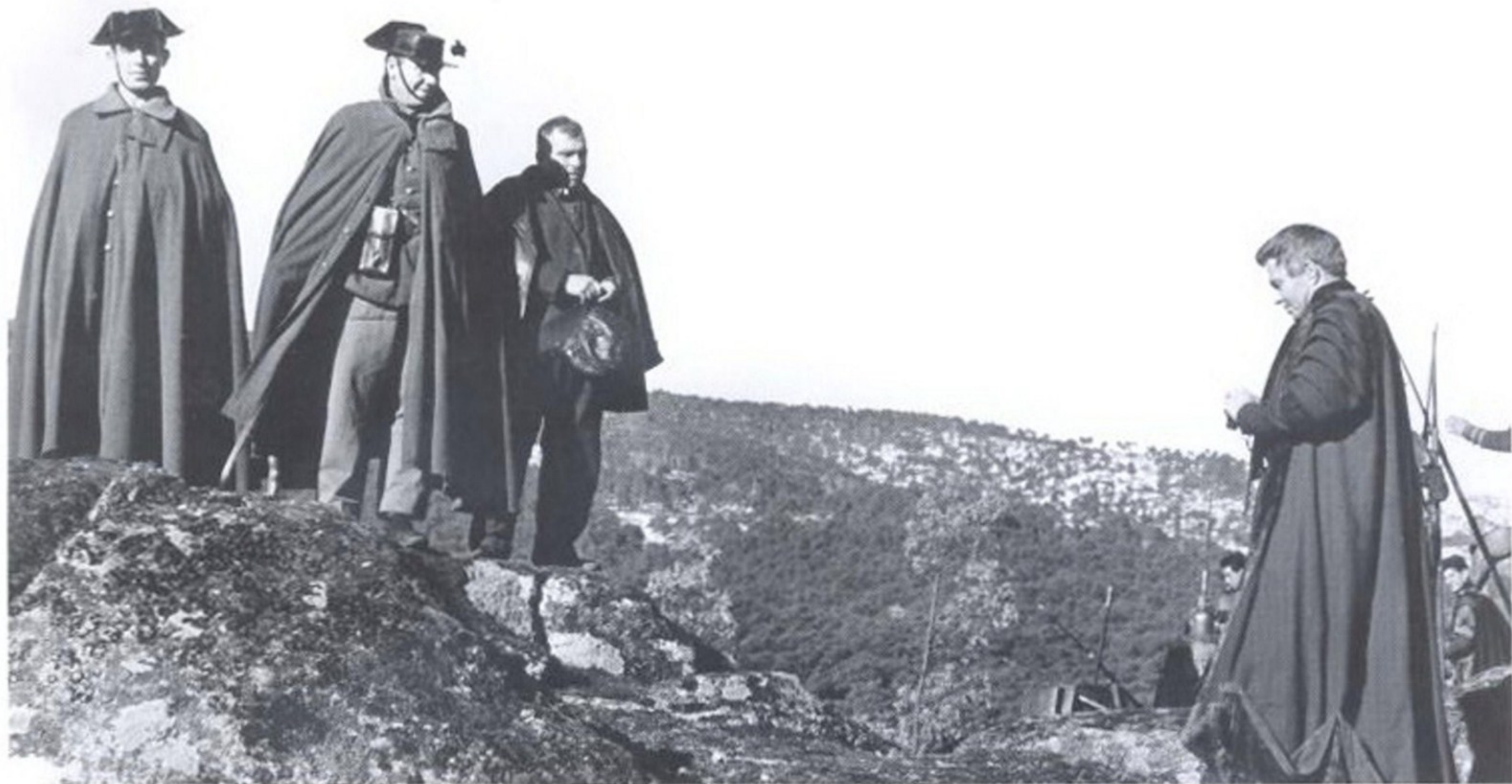
ГРАЖДАНСКИЕ ГВАРДЕЙЦЫ НЕ РАЗ СТАНОВИЛИСЬ ГЕРОЯМИ ИСТОРИЧЕСКИХ ФИЛЬМОВ. КАК ВСЕГДА, ИХ «ВИЗИТНОЙ КАРТОЧКОЙ» БЫЛА ТРЕУГОЛКА

Испанская Guardia Civil (гражданская гвардия) — это аналог жандармерии в других европейских государствах. Она фактически дублирует функции национальной полиции, но, в отличие от полицейских, гвардейцы, как правило, несут службу за пределами городов.