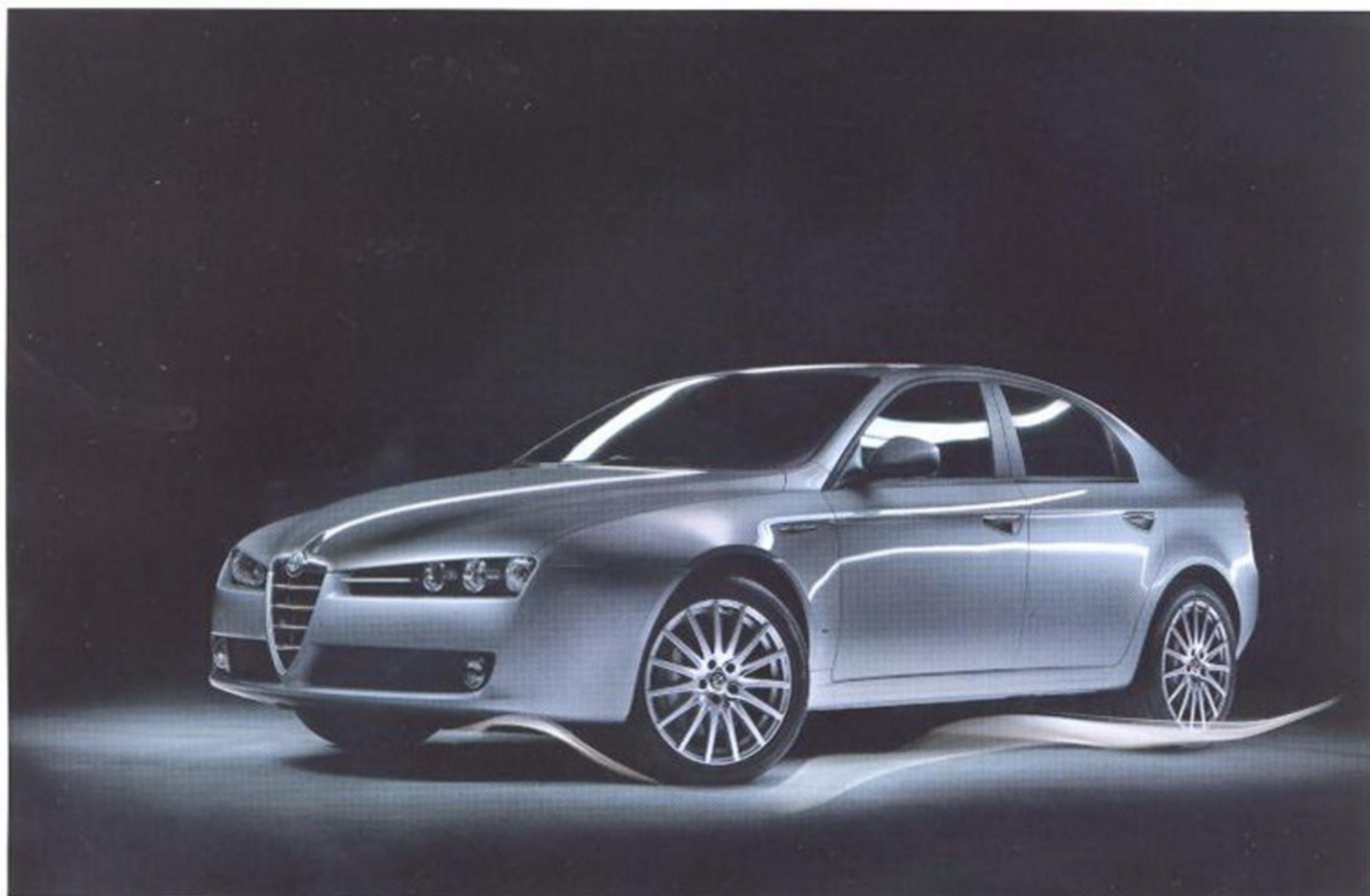
ALFA ROMEO 159 3.2 JTS Q4 БЫЛА СОЗДАНА СПЕЦИАЛЬНО ДЛЯ ЛЮБИТЕЛЕЙ ПОЛНОГО ПРИВОДА

с одинаковым объемом 1,9 л, но разной мощностью — 120 и 150 л. с., а третий на пол-литра больше (2,4 л) и, соответственно, мощнее — 200 л. с.