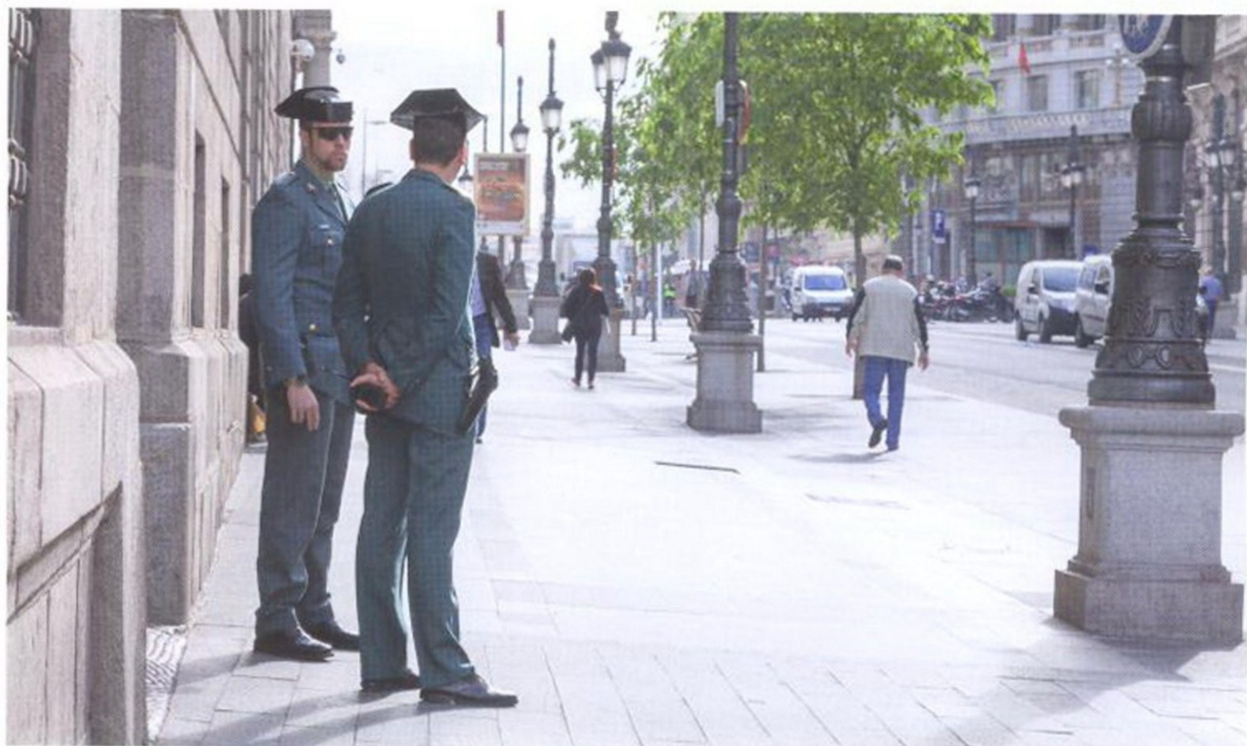
ГРАЖДАНСКИЕ ГВАРДЕЙЦЫ НА УЛИЦЕ АЛЬКАЛ В МАДРИДЕ

Испания — страна католическая, и у гражданской гвардии есть своя небесная заступница и покровительница — Святая дева Пилар, которая, по поверью, хлопочет за них перед Всевышним. Кстати, как выяснилось, симпатизирует гвардии и Святой престол. Во всяком случае, однажды папа римский Бенедикт XVI во время генеральной аудиенции на площади Святого Петра в Риме появился перед верующими в гвардейской треуголке. Это вызвало небывалый восторг гвардейцев и заметно подняло их реноме не только в Испании, но и во всей Европе.