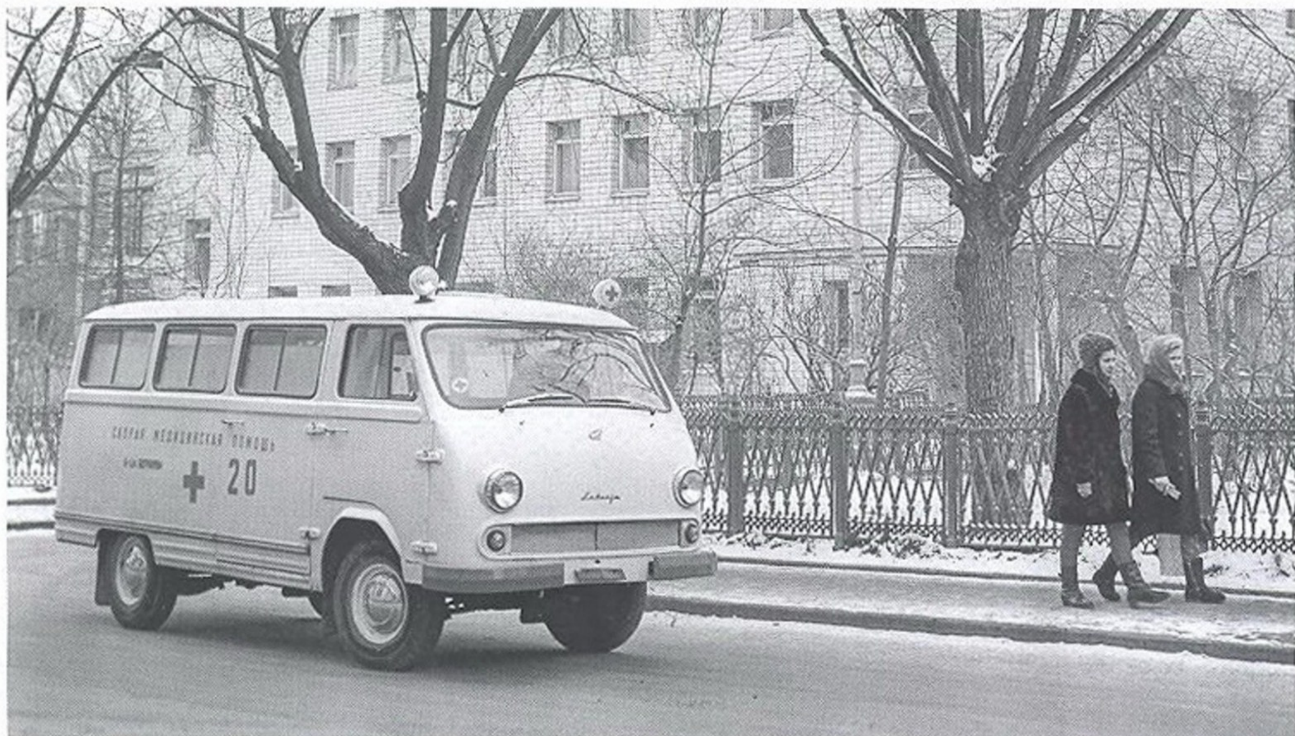
В СОВЕТСКОЕ ВРЕМЯ В КРУПНЫХ ГОРОДАХ БРИГАДЫ СКОРОЙ ПОМОЩИ РАБОТАЛИ В ОСНОВНОМ НА АВТОМОБИЛЯХ РАФ

РАФ-2203 «Латвия» с 11-местным цельнометаллическим несущим кузовом вагонного типа и 95-сильным двигателем. В самой Риге в то время оставалось производство лишь некоторых модификаций этой машины.