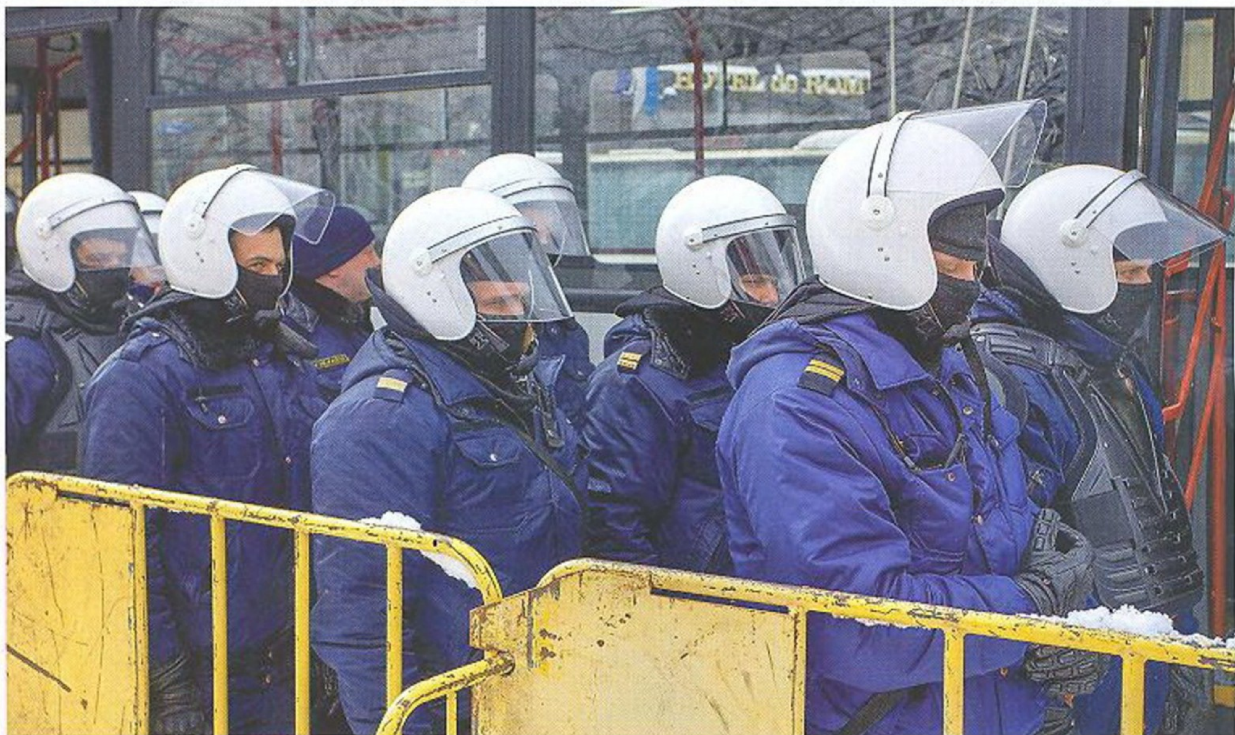
ПОЛИЦИЯ ГОТОВИТСЯ К РАЗГОНУ ДЕМОСТРАНТОВ. ПРОТЕСТУЮЩИХ ПРОТИВ ПОЛИТИКИ ПРАВИТЕЛЬСТВА

На службу в полицию принимаются только граждане Латвийской Республики в возрасте от 18 до 35 лет, не имеющие судимостей и правонарушений. Помимо хорошего здоровья — физического и психического, полицейский должен иметь соответствующее образование и говорить на официально принятом в стране языке (латышском). Поскольку на территории Латвии проживает большое количество людей, не говорящих по-латышски, полисмен должен владеть еще и вторым языком — самым распространенным в той местности, где он проходит службу.