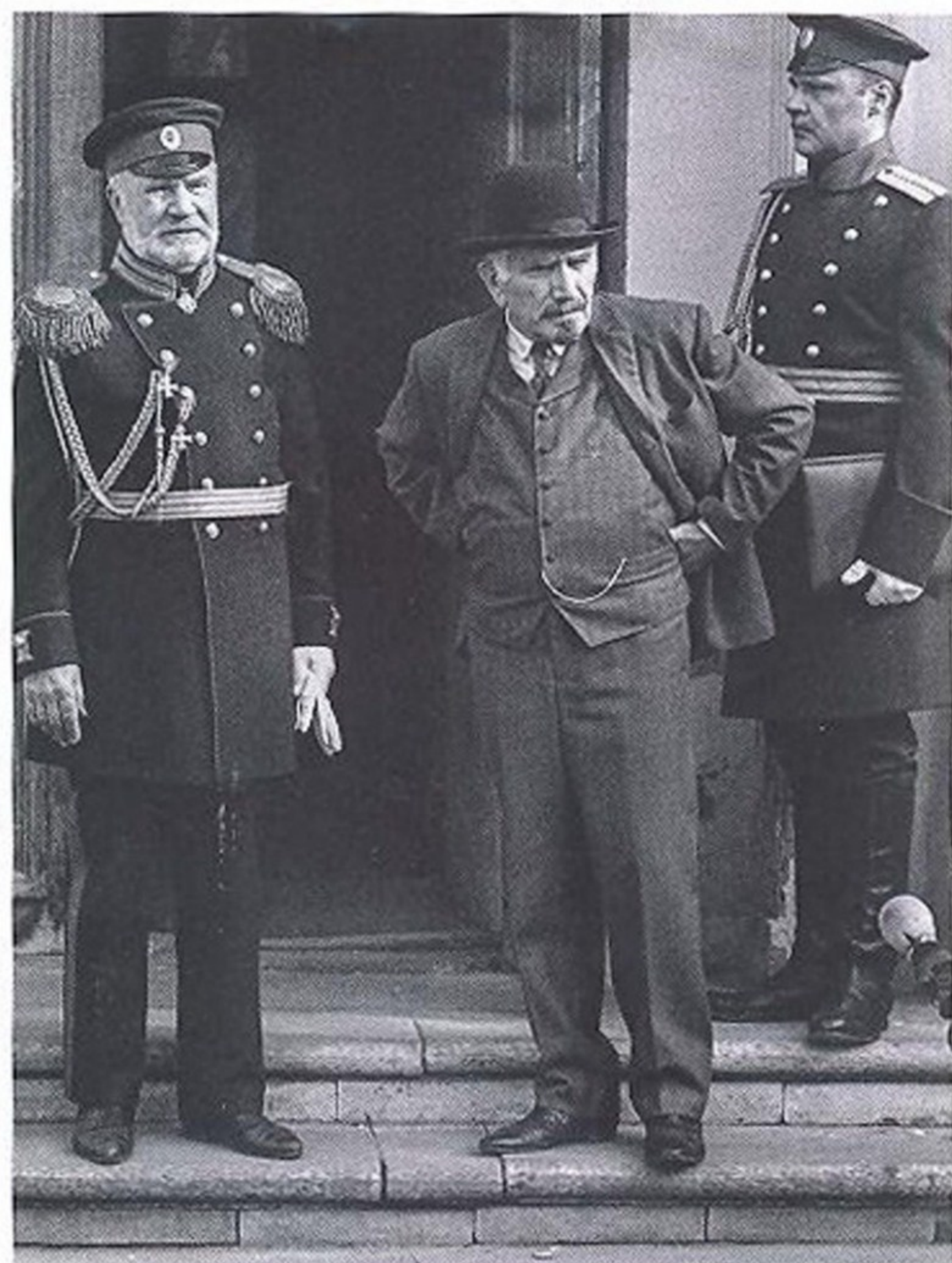
АРМЕН ДЖИГАРХАНЫАН В РОЛИ АРКАДИЯ КОШКО НА СЪЕМКАХ СЕРИАЛА «КОРОЛИ РОССИЙСКОГО СЫСКА»

Кошко согласился, правда, не без колебаний, ведь Рига — город немаленький. Зато и возможностей для профессионального роста на новом поприще было больше. Это и решило дело.