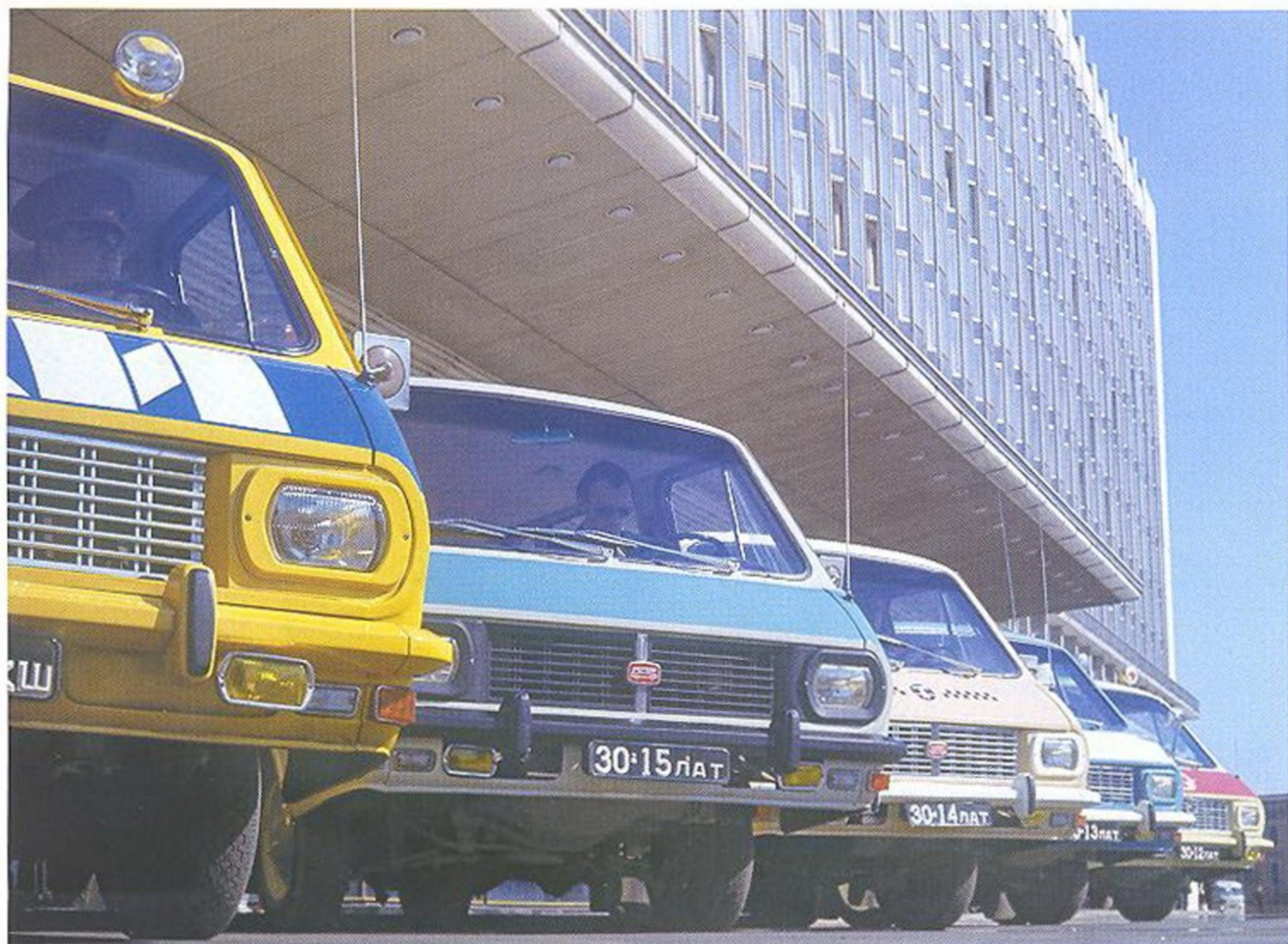
МИКРОАВТОБУСЫ РАФ, УКОМПЛЕКТОВАННЫЕ ДЛЯ ИСПОЛЬЗОВАНИЯ РАЗЛИЧНЫМИ КОММУНАЛЬНЫМИ СЛУЖБАМИ

они уже морально устарели и не соответствовали целому ряду принятых в мире норм по безопасности и токсичности выхлопных газов. Да и сама технология производства оставляла желать лучшего.