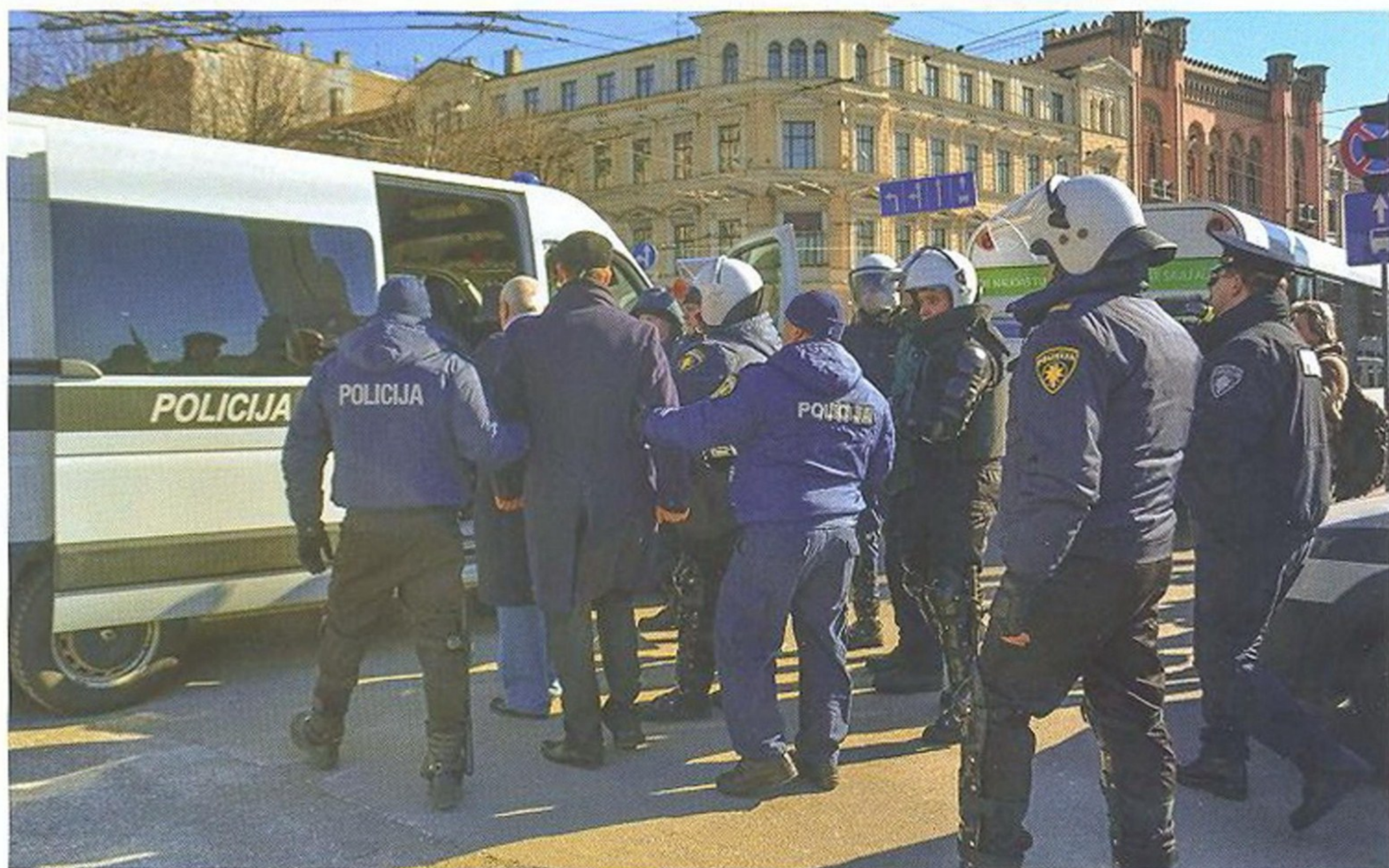
РИГСКАЯ ПОЛИЦИЯ ЗАДЕРЖИВАЕТ АКТИВИСТОВ, ВЫСТУПАЮЩИХ ПРОТИВ ПРОВЕДЕНИЯ ПАРАДА БЫВШИХ СОЛДАТ ВОЙСК СС (МАРТ 2013 ГОДА)

Латвийская Республика (Latvijas Republika) — государство с населением около 2,3 миллиона человек, входящее в состав Европейского союза. Столица — город Рига. Здесь сосредоточены основные органы государственного управления.