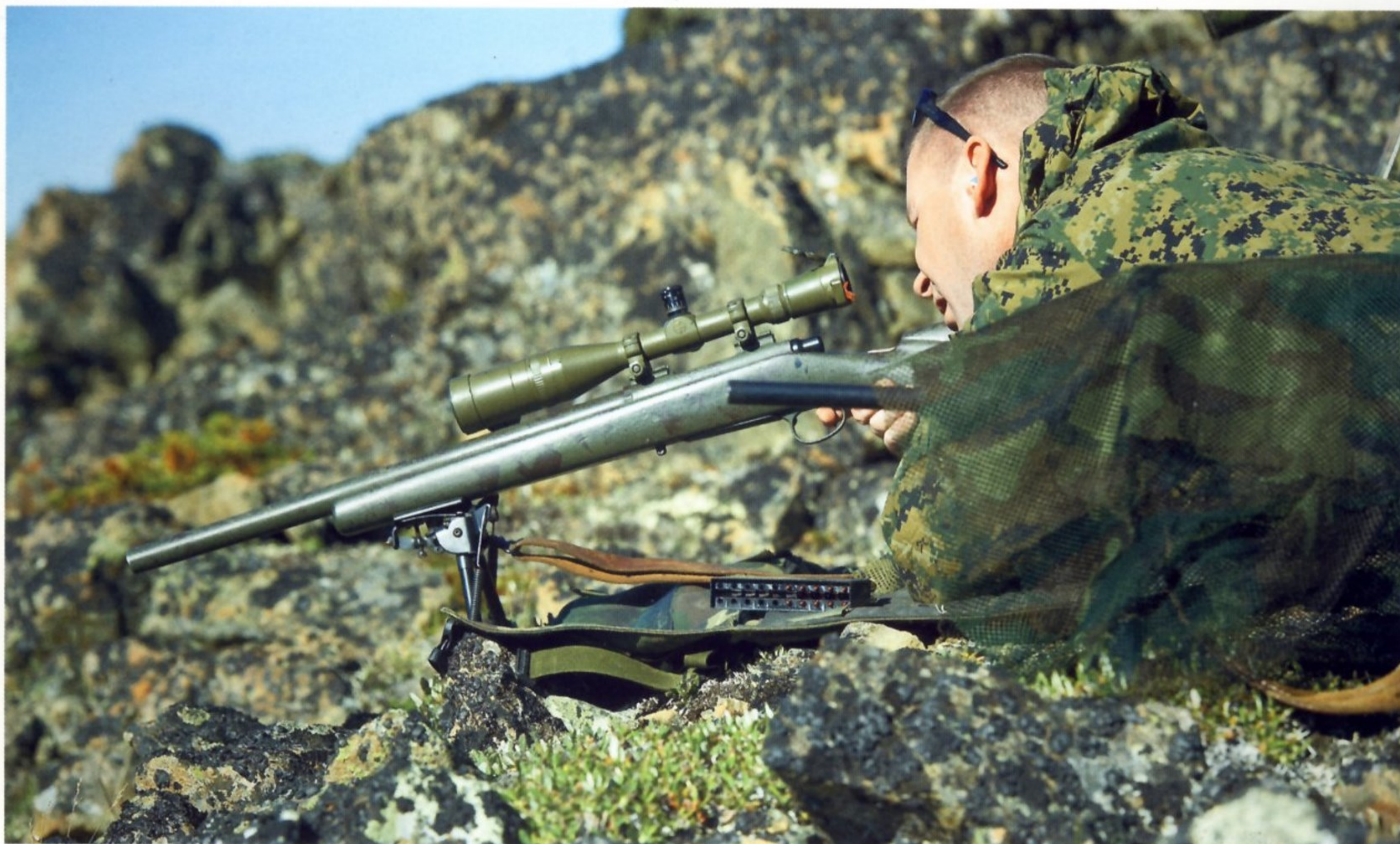
ОФИЦЕР ПОЛИЦИИ НА ТРЕНИРОВКЕ ПО СТРЕЛЬБЕ

Одна из школ, где готовят полицейских снайперов, находится в Миннесоте. Туда принимают людей, уже имеющих снайперский опыт. Переподготовка длится неделю. В начале обучения каждый курсант получает один боевой патрон как напоминание о том, что на «выпускном экзамене» ему необходимо будет поразить специальную мишень с первого выстрела. Несмотря на интенсивные тренировки, 35–40 % курсантов по разным причинам не справляются с поставленной задачей и отсеиваются. В работе полицейского снайпера нет мелочей, он должен не только идеально владеть собой в стрессовых ситуациях, но и досконально знать особенности своего личного оружия. Специалисты стараются использовать патроны не просто высшего качества и одного типа, но даже одной партии выпуска. Делая выстрел, снайпер должен точно знать, куда именно попадет его пуля, ведь промах зачастую означает гибель заложника и провал всей полицейской операции.