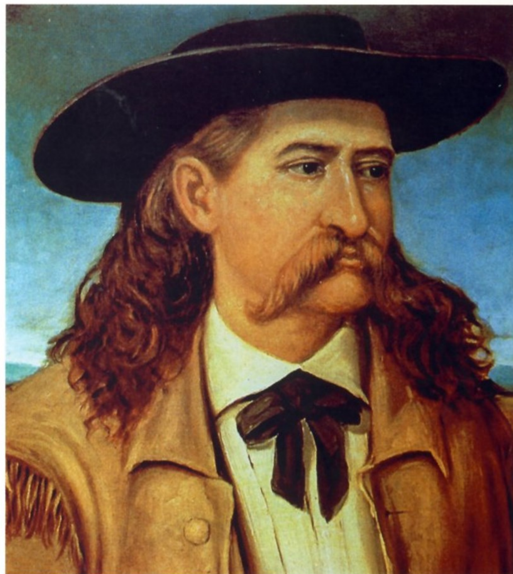
«ДИКИЙ БИЛЛ» ХИКОК. ПОРТРЕТ 1874 ГОДА ХРАНИТСЯ В ИНСТИТУТЕ ТОМАСА ДЖИЛКРЕЙСА В ТУЛЬСЕ (ШТАТ ОКЛАХОМА)

Со временем он стал одним из лучших стрелков в округе. Виртуозно владея револьвером и ружьем, юноша не задумываясь пускал их в ход. В 1855 году, после одного такого выстрела, ему пришлось бежать, спасаясь от обвинения в убийстве. С этого момента для Хикока-младшего началась новая жизнь: он воевал против рабства в отряде генерала Лейна, потом завел собственную ферму в Канзасе. Тогда-то его впервые избрали констеблем в местечке Монтиселло. Но из-за вспыльчивого нрава на должности констебля он долго не удержался. В следующие несколько лет молодой человек работал кучером почтового фургона, конюхом в Небраске и принимал участие в Гражданской войне, снискав себе славу одного из лучших разведчиков в армии северян. После окончания войны Дикий Билл стал профессиональным карточным игроком. Это было рискованное занятие, и навыки стрелка здесь оказались как нельзя кстати. В 1865 году в Спрингфилде Хикок познакомился с журналистом Джорджем Уордом Николсом и за стаканом виски рассказал ему о своей жизни. Николсу история понравилась, и он опубликовал ее в журнале Harper's New Monthly Magazine под заголовком «Дикий Билл».