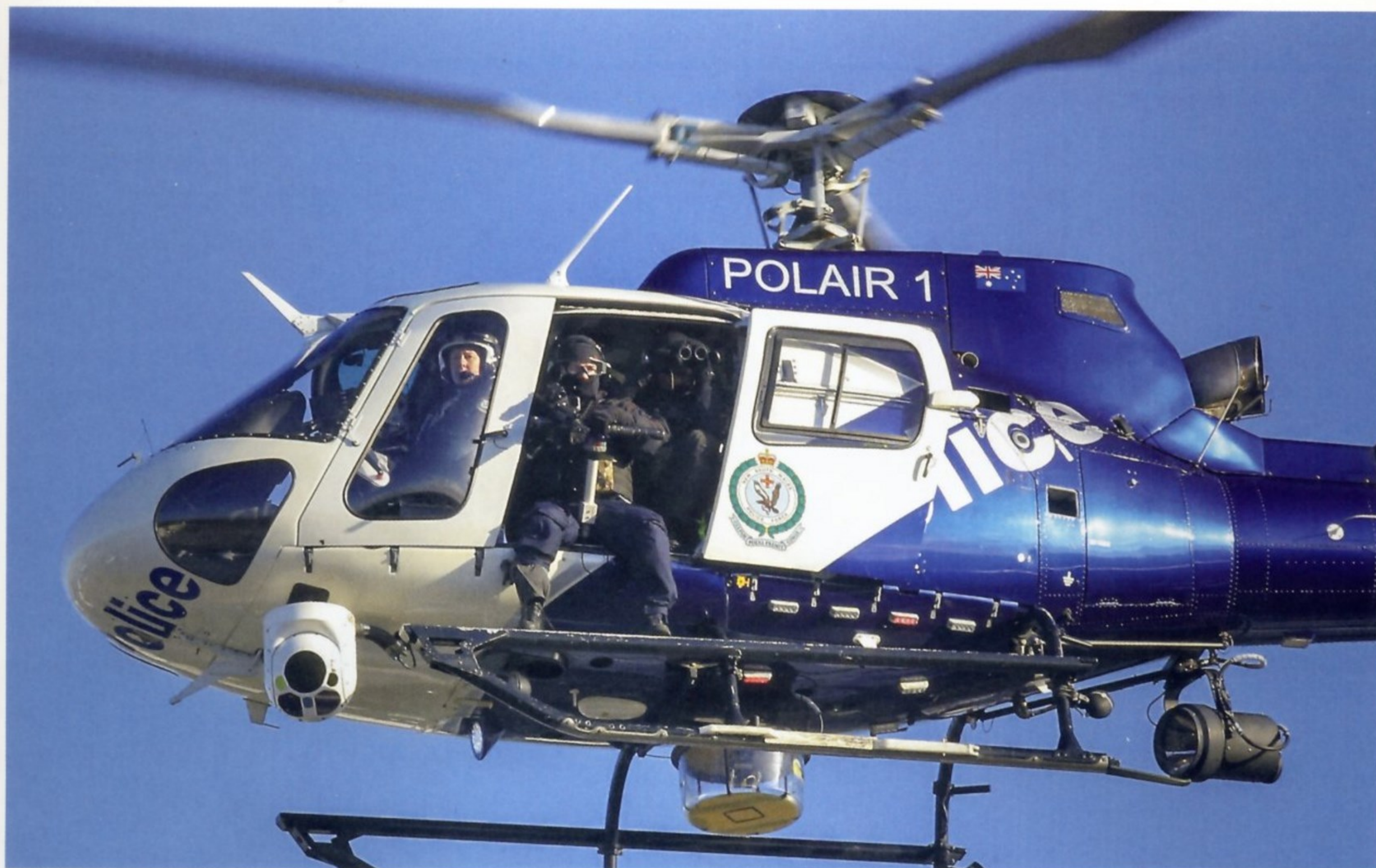
СТРЕЛЬБА С БОРТА ВЕРТОЛЕТА — ОДИН ИЗ САМЫХ ТРУДНЫХ ЭТАПОВ ПОДГОТОВКИ ПОЛИЦЕЙСКИХ СНАЙПЕРОВ (АВСТРАЛИЯ, АВГУСТ 2013 ГОДА)

оружия на большом расстоянии. Действовали они, как правило, самостоятельно. Снайперами их стали называть в годы Первой мировой войны.