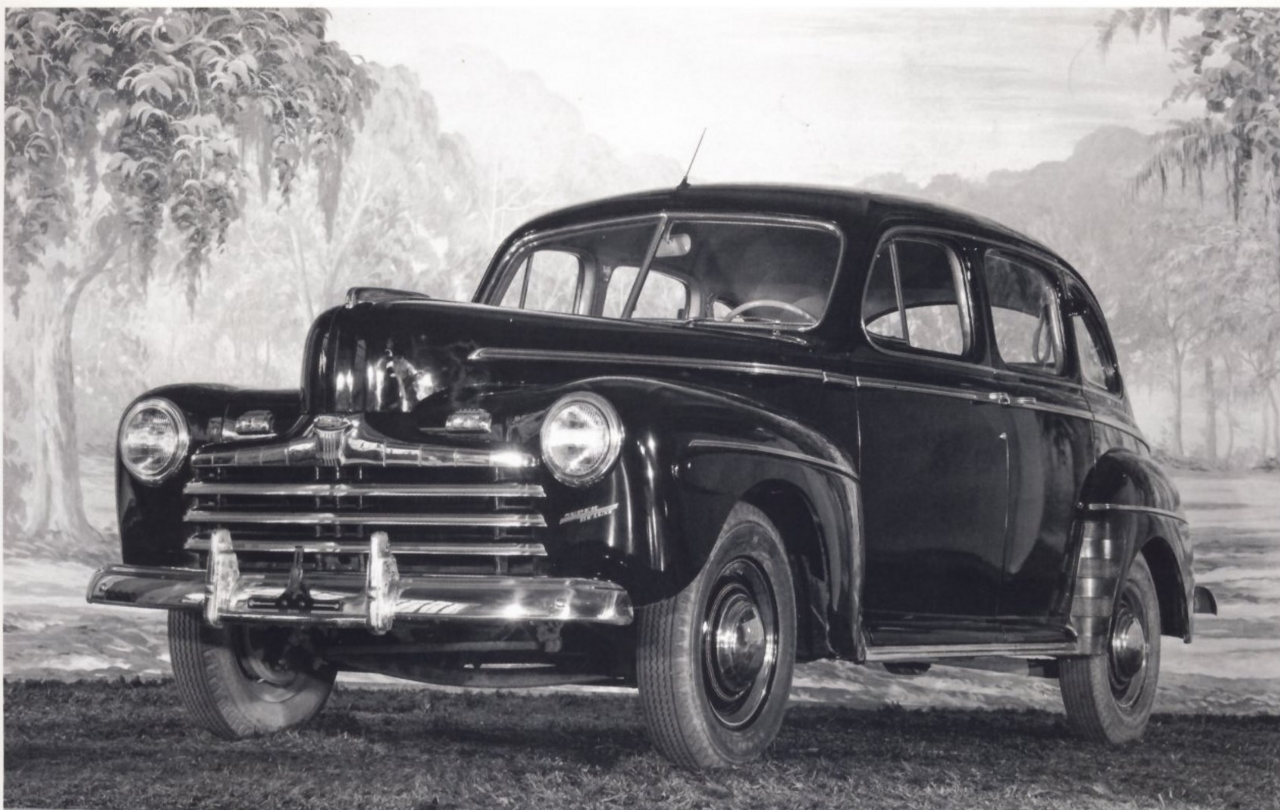
FORD SUPER DELUXE 1946 ГОДА ВЫПУСКА

окантовок и других деталей, сразу же бросавшихся в глаза покупателю. При этом техническая часть таких «новинок» годами оставалась без изменений.