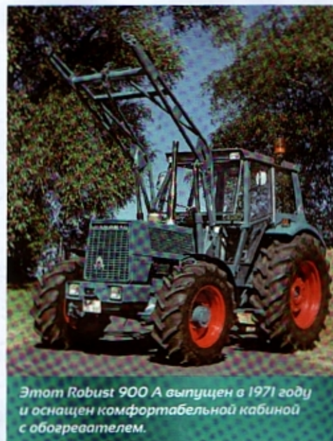
Этот Robust 900 A выпущен в 1971 году и оснащен комфортабельной кабиной с обогревателем.

Модель Robust 900 A была сконструирована по так называемому модульному принципу. В то время многие производители считали подобный метод верхом совершенства. Трактор собирали из крупных модулей: на смену мелкой винтовой сборке пришел монтаж сборных блоков. Такая процедура упростила процесс производства и открыла возможность изготовления на том же конвейере сходных и лишь слегка модифицированных вариантов одного транспортного средства. В 1960-е годы компания «Ганомаг» производила в общей сложности три модели, из которых Robust 900 был последней и идентичной прототипу, который затем технически адаптировали к запланированной области применения. Общим