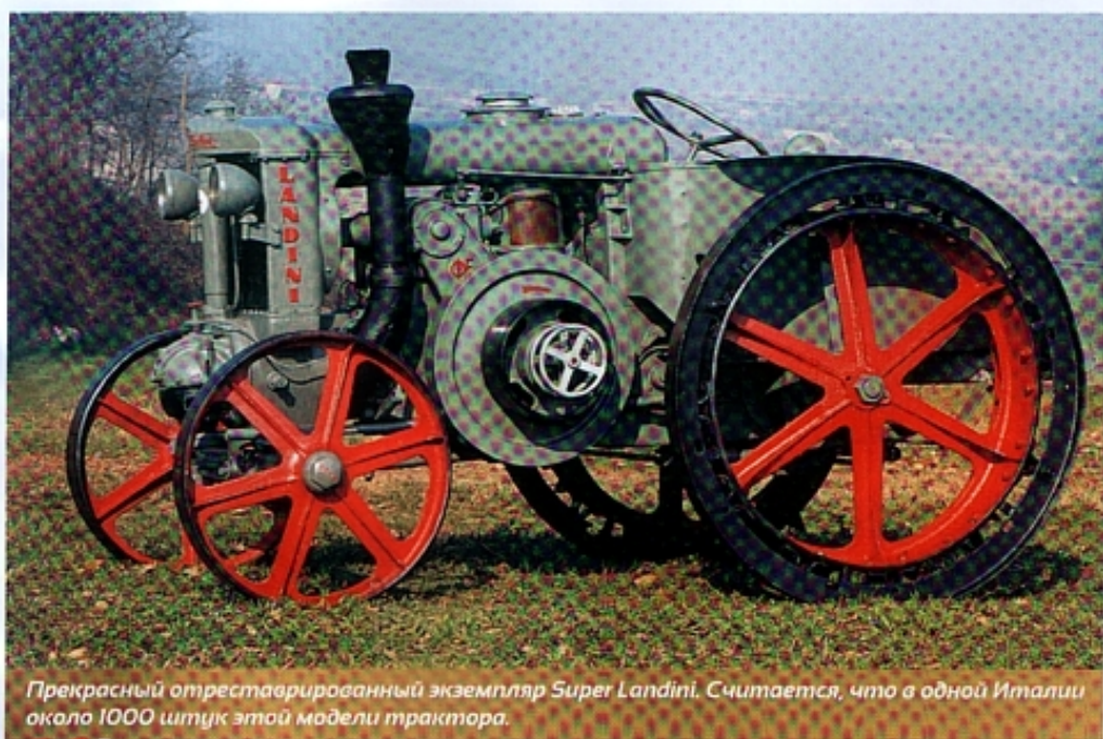
Прекрасный отреставрированный экземпляр Super Landini. Считается, что в одной Италии около 1000 штук этой модели трактора.

что означало «проворный, поворотливый, сильный солдат». Весом 2400 кг, он был легче и во всех прочих отношениях чуть меньше «старшего брата». С 1935 по 1953 год было выпущено 3500 экземпляров Velite. В 1941 году компания разрабатывает промежуточную модель, мощностью 27 л. с., предназначенную главным образом для вспашки. Трактор получил название Bufalo («Буйвол»). Это был первый трактор «Ландини» с калильным двигателем, оснащенный трансмиссией с четырьмя передними передачами, развивавший предельную скорость 8,5 км/ч. Поверх передачи у Bufalo стоял ленточный тормоз, включавшийся отдельной педалью, передающие пути были сокращены до минимума. Втулки передних колес смазывались в масляном картере, а сами колеса крепились заклепками для максимального упрощения смены предусмотренных для шоссе пневматических шин. Однако эти инновации клиентов не убедили. Для Bufalo за год удавалось найти всего от 15 до 20 покупателей, и в 1950 году выпуск модели прекратили. Однако без Bufalo компания «Ланини» не разработала бы следующую модель – легендарный трактор RTR L45, один из лучших тракторов с калильным двигателем. К 1958 году с конвейера сошли 2500 тракторов этой модели.