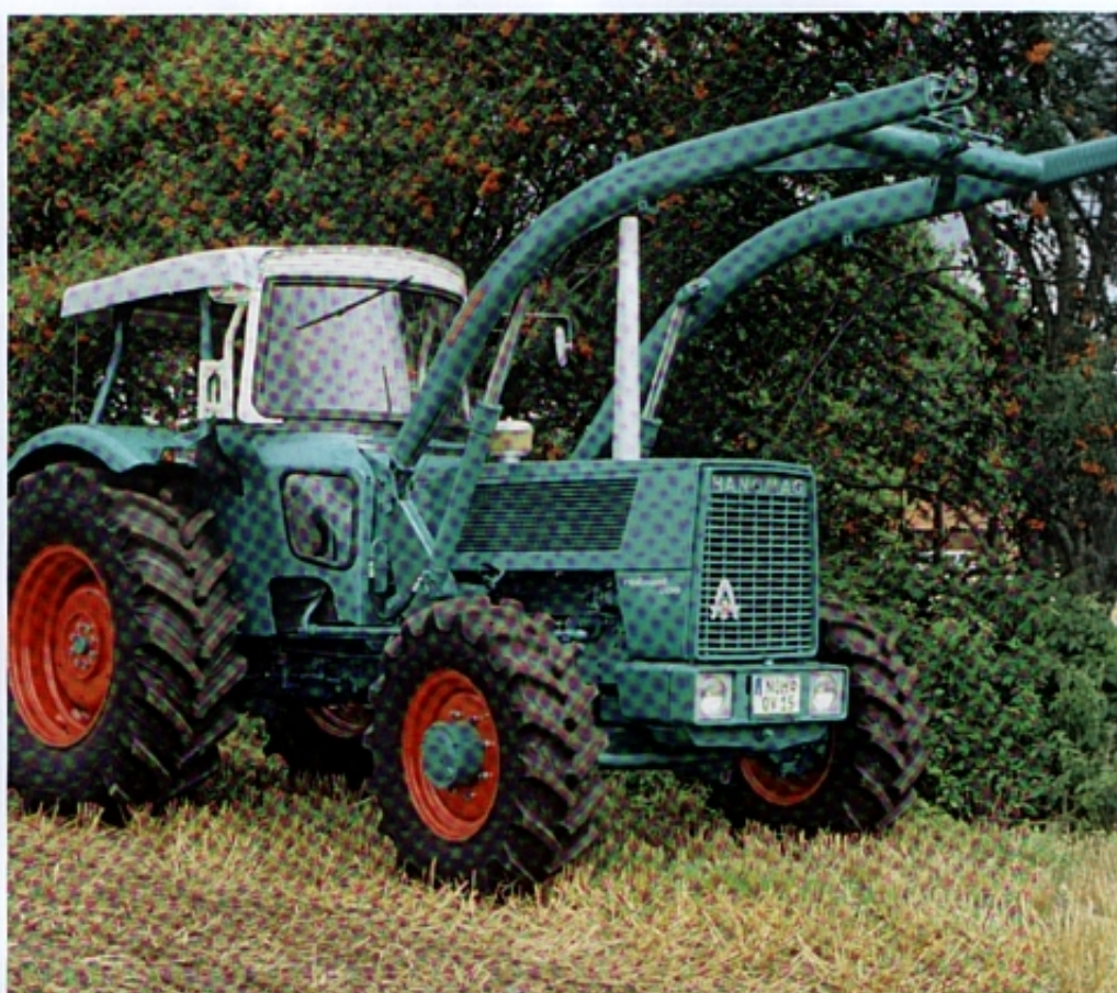
В то время как подъемник с трехточечной схемой навески принадлежал к стандартной комплектации, за установку такого фронтального погрузчика приходилось доплачивать.

Это была настоящая сенсация: французский звездный дизайнер Луи Лепуа взялся оформлять тракторы «Ганномаг»! Лепуа не был человеком с улицы. Незадолго до войны он сделал себе мировое имя, проектируя облик мотоциклов. В 1947 году модель BMW R 12 помогла ему и его клиенту завоевать огромную популярность. Лепуа выработал лаконичный, но выразительный стиль, и его проекты никогда не оставались незамеченными. Они воплощали