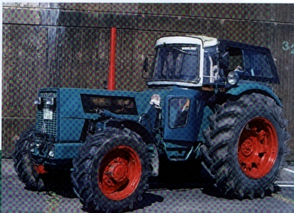
Явно выступающий над передней осью блок двигателя и длинная колесная база создают технические предпосылки для высокой силы тяги Robust 900 A.

Robust 900 A целиком использовал функцию полного привода. Благодаря снижению потери мощности на ведущих колесах до 7 % удалось добиться довольно значительного прироста мощности в целом. Максимально возможную передачу потока этой мощности обеспечивал ведущий мост с планетарными