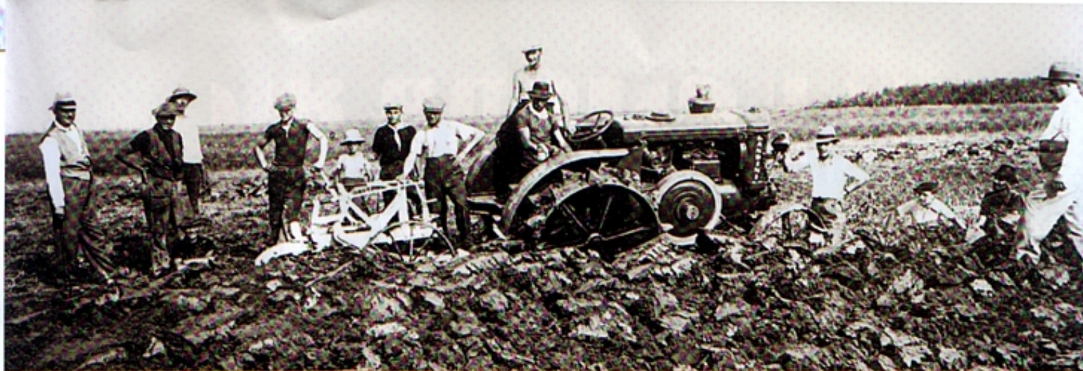
Благодаря мощности двигателя и собственному весу Super Landini развивает огромную силу тяги.

Несмотря на то что Super Landini – самый тяжелый и крупногабаритный трактор компании, он очаровывает притягательной простотой. Его сухой вес составляет 3500 кг при общей ширине 1,73 м, высоте 1,83 м и длине 3,35 м. Установленный спереди радиатор водяного охлаждения работал с вентилятором и циркуляционной системой водного охлаждения. Надежность двигателя обеспечивал конструктивный узел инжекторного насоса и регулятора, а также масляный бак и вентилятор системы охлаждения. Этот мини-центр был напрямую связан с двигателем. Других передающих ремней или цепей не было, не считая шедшей от динамо, для освещения, благодаря чему трактор мог работать и ночью. К узлам двигателя относится цилиндр, под которым стоит