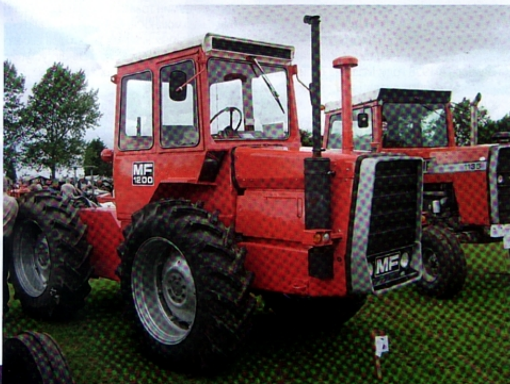
На почтовой марке «Трактор» номиналом 80 пфеннигов Немецкой федеральной почты из выходящей много лет серии «Промышленность» изображен трактор MF 1200. На почтовой марке номиналом 180 пфеннигов «Колесный погрузчик» представлен MF 77.

Через четыре года после почтовой марки «Трактор», 14 июля 1979 года, в той же серии «Промышленность и техника» вышла почтовая марка «Колесный погрузчик» номиналом 180 пфеннигов. И снова дизайнер Кноблаух выбрал изображение тягача фирмы «Месси Фергюсон» – на сей раз модель MF 77.