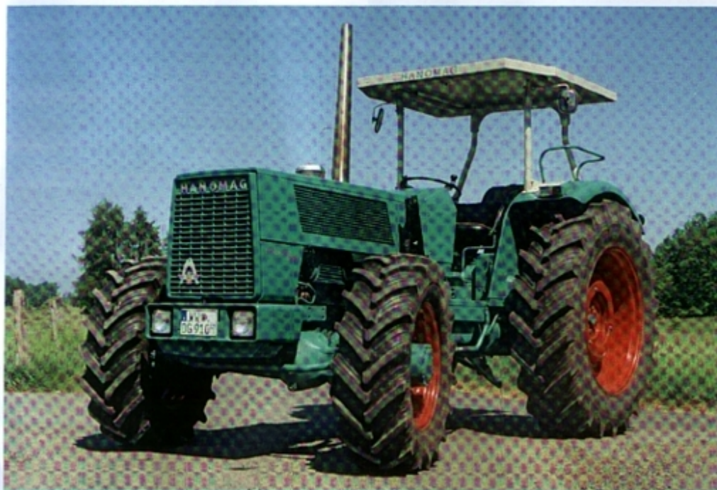
Эта модель с кодом региона WW на номерном знаке как раз то, что нужно для Вестервальда. Трактор вскоре отправится на лесные работы в подлеске. Небольшая крыша сможет немного защитить водителя.

Специально для выпуска модели Tups («Туп») D 162 R компания «Ганомэг» открыла завод в Ганновере, где располагалась ее штаб-квартира. Оборудованная здесь автоматическая сборочная линия считалась в тот период самой передовой. Объем продаж рос, а новая организация производства позволяла сокращать издержки. Вскоре все известные производители взяли на вооружение идею модульной сборки.