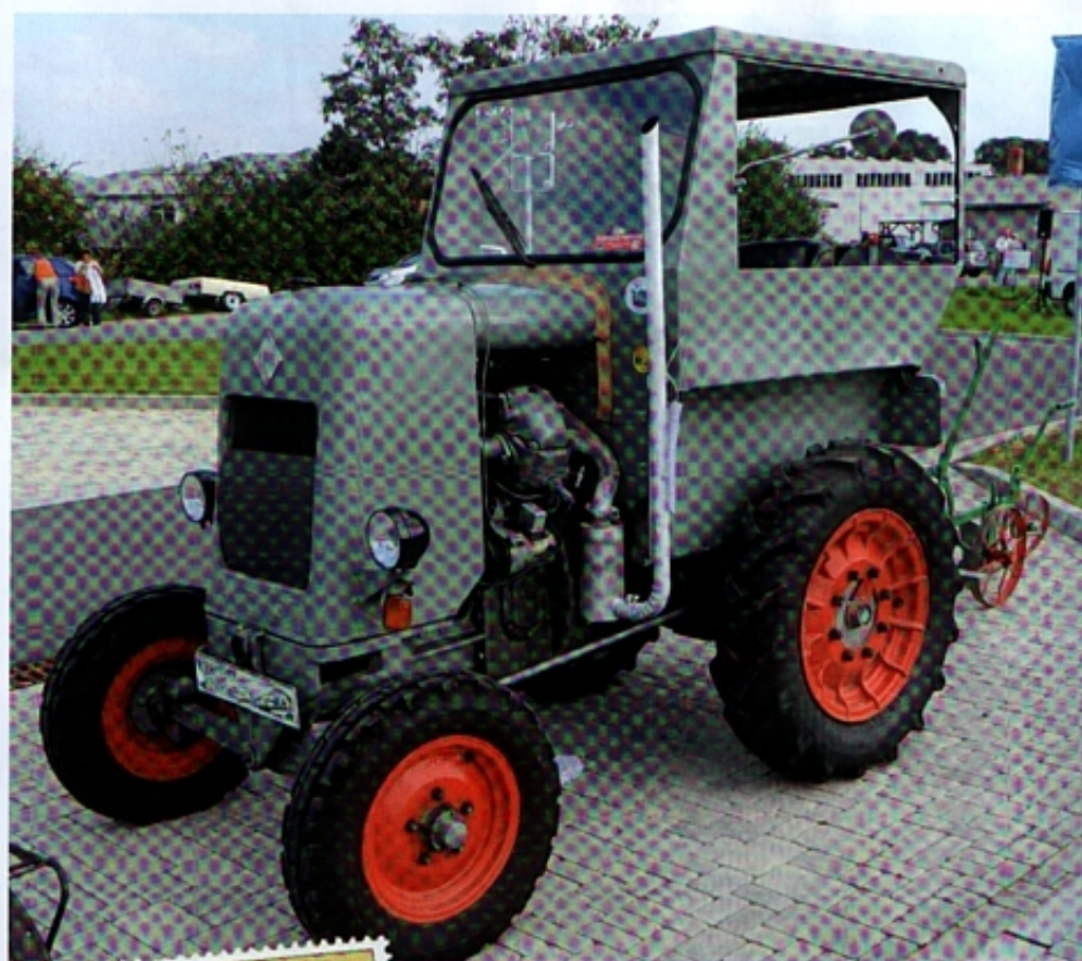
Трактор RS 03 Aktivist.

«Промышленность и техника» – так называлась серия западногерманских марок, выпускавшаяся с 1975 по 1982 год и находившаяся в обращении вплоть до 1988 года. Печатались марки и по заказу Немецкой федеральной почты и Немецкой федеральной почты Западного Берлина. Западноберлинские знаки почтовой оплаты отличались лишь дополнительной надписью «Берлин». Цвет и номинал были те же. Серия состояла из одноцветных марочных листов