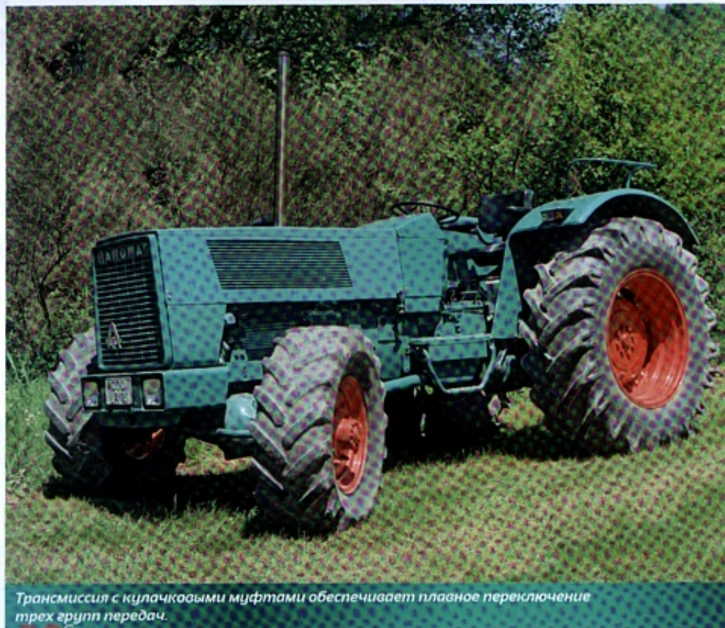
Трансмиссия с кулачковыми муфтами обеспечивает плавное переключение трех групп передач.

Вал отбора мощности от двигателя и подъемное устройство упрощали дооборудование. В то время как передние крылья и фронтальный погрузчик заказывали редко, очень востребована была обрывная муфта и косилка с гидравлическим приводом.