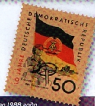
Марки слева иллюстрируют сельскохозяйственное производство 1988 года. Знак почтовой оплаты сверху справа выпущен к Лейпцигской Весенней ярмарке 1980 года, а внизу справа – в 1959 году десятилетнему государственному юбилею.

федеральная почта приступила к продаже марки «Трактор» номиналом 80 пфеннигов, также нарисованной Беатом Кноблаухом. На ней изображен трактор Тур MF 1200 с так называемой шарнирно-сочлененной рамой, с 1972 по 1979 годы выпускавшийся североамериканской фирмой Massey Ferguson («Месси Фергюсон»). Его 5,8-литровый двигатель развивал мощность 105 л. с.