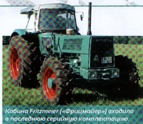
Кабина Fritzmeier («Фрицмайер») входила в последнюю серийную комплектацию.

Очень важной технической деталью была пара редукторов, смонтированных без прямого подключения к дифференциалу.