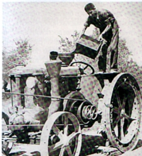
Для наполнения бака Super Landini порой требуется акробатическая ловкость. Его емкость достигает 85 л.

Трактор Super Landini оснащен ручным тормозом, связанным с трансмиссией, для задействования которой водитель тянет рычаг. В дорожном исполнении у Super Landini есть тормоз, соединенный с задними ведущими колесами, а также запасная пневматическая тормозная система. На рычаге переключения передач находится предохранитель, который отпускается, когда водитель крепко берется за рукоять рычага.