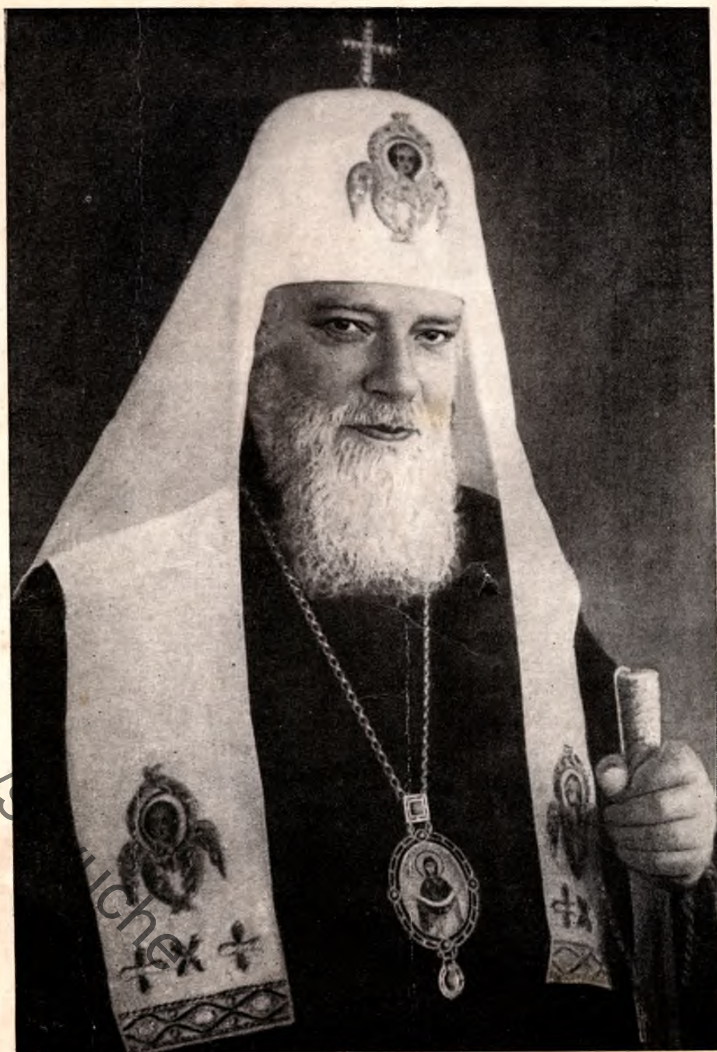
СВЯТЕЙШИЙ ПАТРИАРХ МОСКОВСКИЙ И ВСЕЯ РУСИ АЛЕКСИЙ