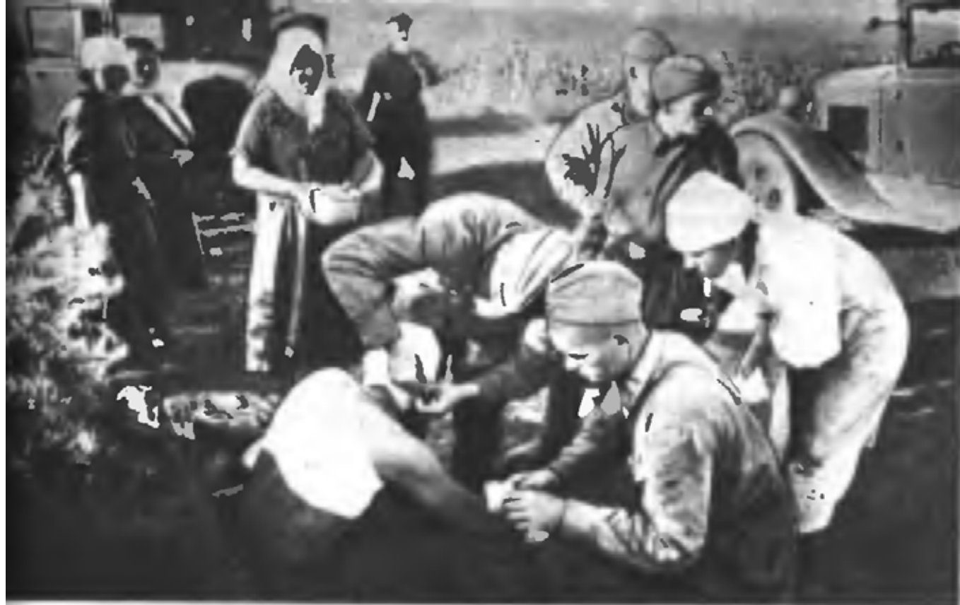
Оказание помощи раненым (22 июня 1941 г.)

9 Особый корпус (106, 156 сд, 32 кд). Штакор — Симферополь.