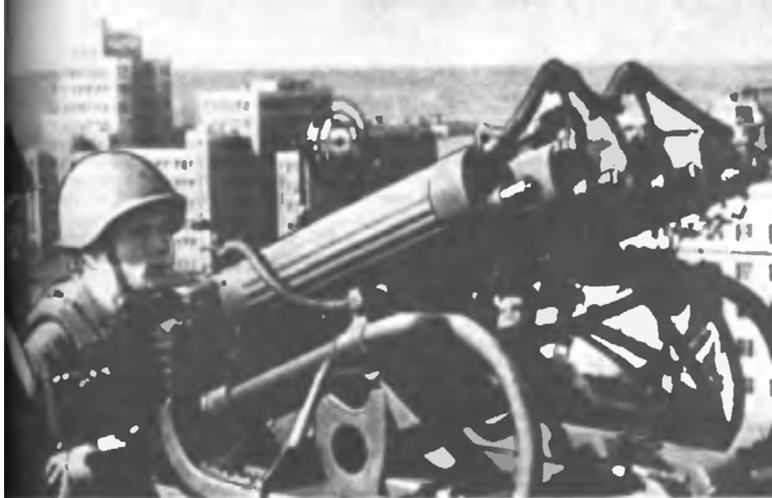
Против воздушного нападения (Харьков, 1941 г.)

1. Имеющееся количество войск в Крыму: две стрелковые дивизии и одна кавдивизия, причем кавдивизия сформирована по особым штатам сокращенного состава (3000 сабель) и состоит из трех кавполков и одного бронедивизиона (Т-40), полностью задачу по обороне Крыма не решат, как активную оборону, а будут представлять отдельные мелкие группы прикрытия, растянутые по всему побережью на широком фронте, и то только на вероятных направлениях. Поэтому вопрос увеличения войск в Крыму является необходимым.