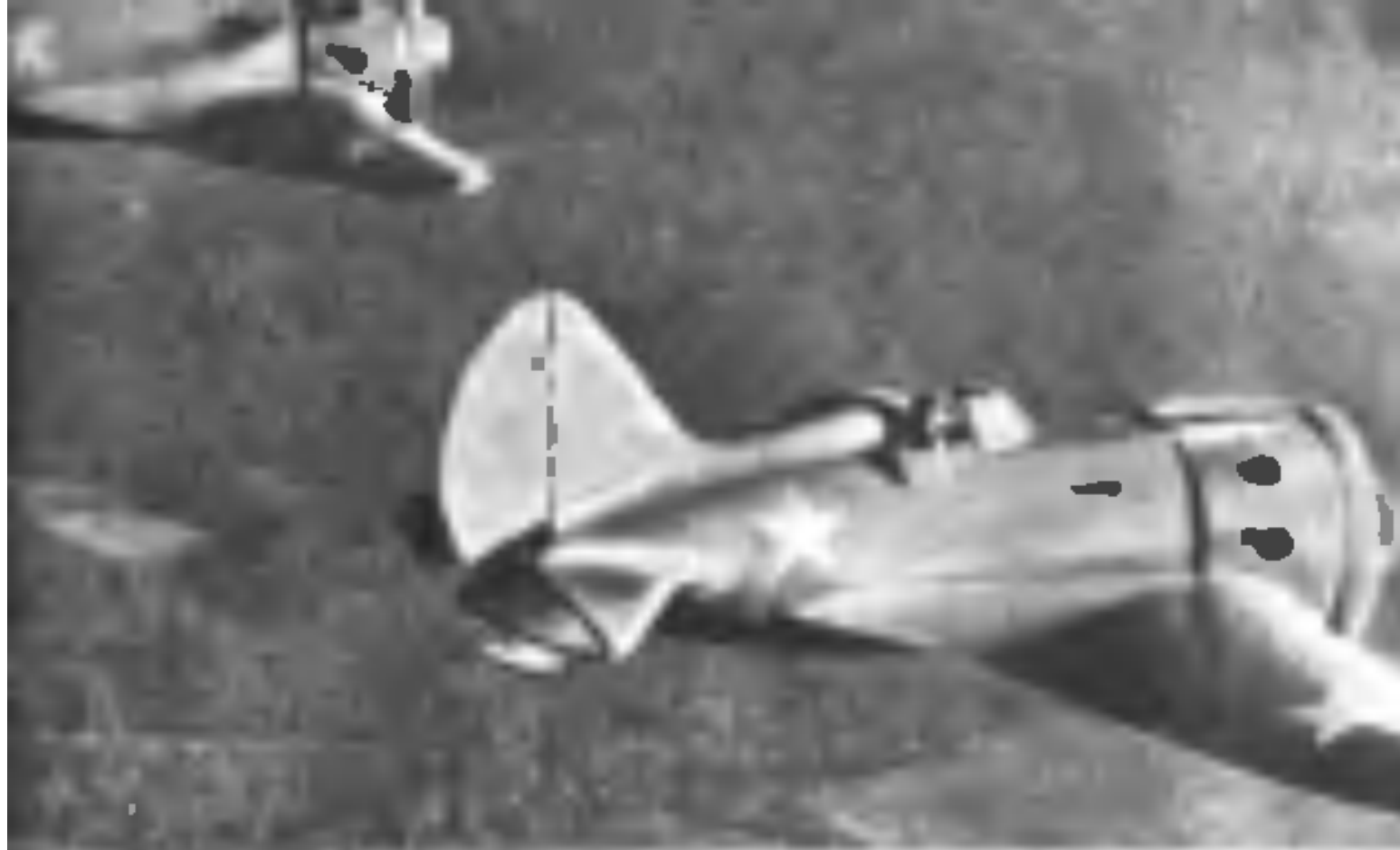
Истребитель Ил-10 в полете 1940