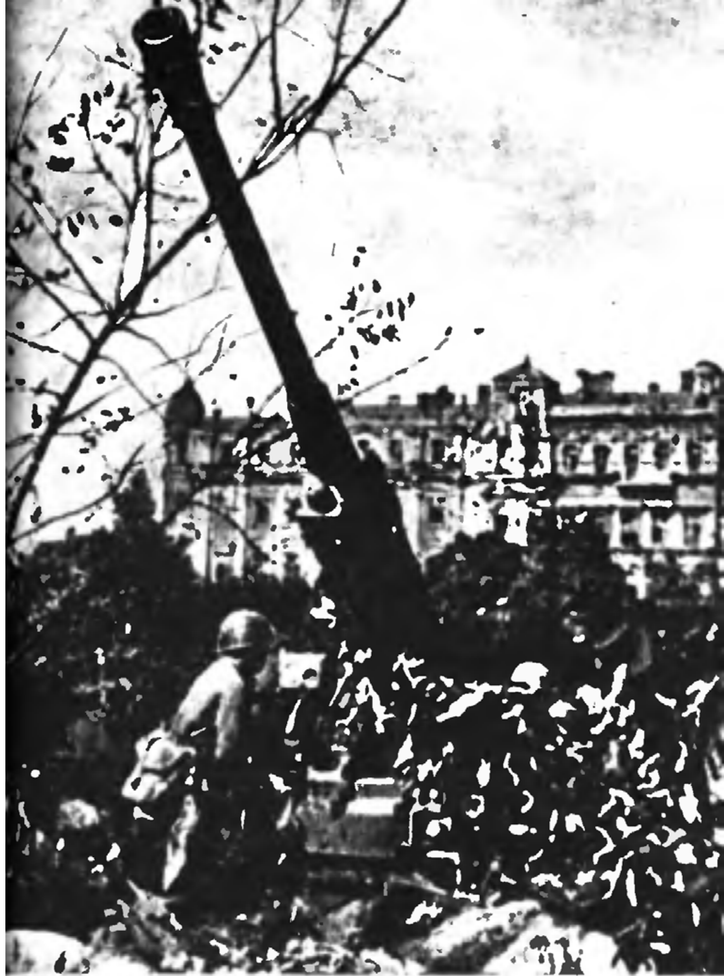
Охрана неба Одессы (1941 г.)