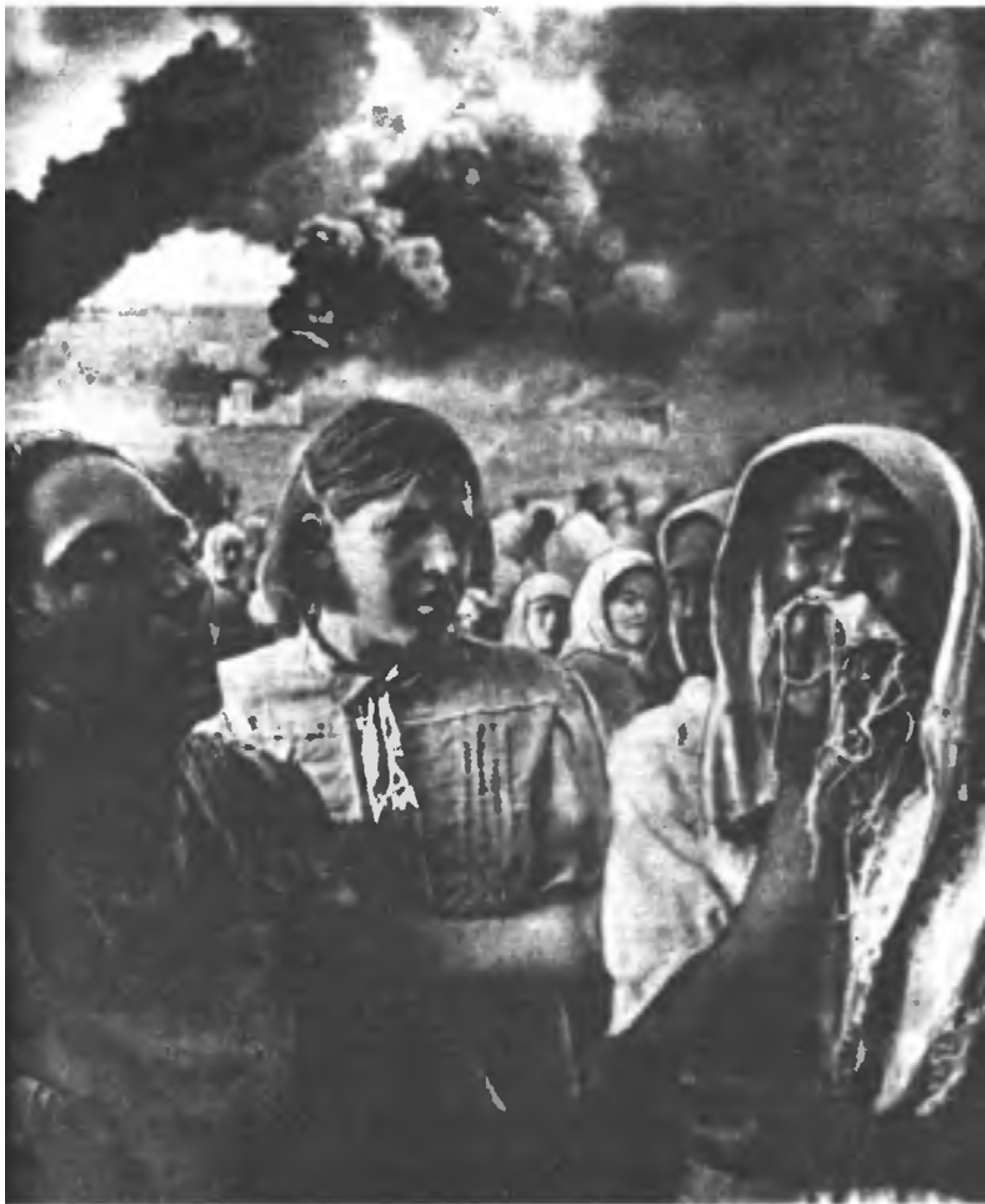
На хуторе Грушки под Киевом (23 июня 1941 г.)