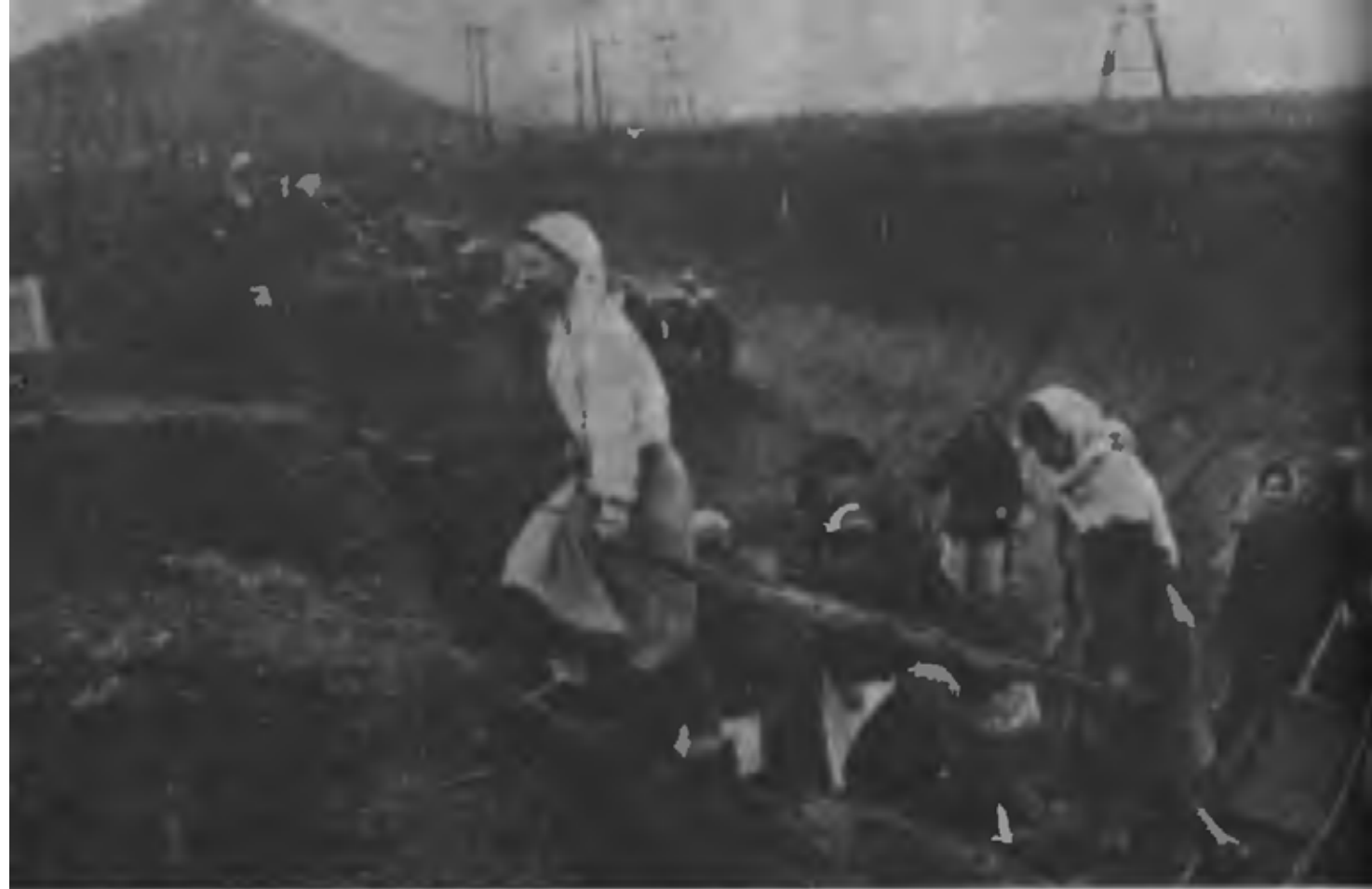
Строительство противотанковых рвов на Донбассе (1941 г.)

Трофеи: по предварительным подсчетам, захвачено орудий разных калибров — 78, минометов — 16, пулеметов — 76, винтовок сдано на арм. склад — 463, танков — 9, снарядов и мин — 2500, мотоциклов — 14, автомашин — 5, велосипедов — 30, пленных, прошедших через армпункт, — 663, последние продолжают еще поступать.