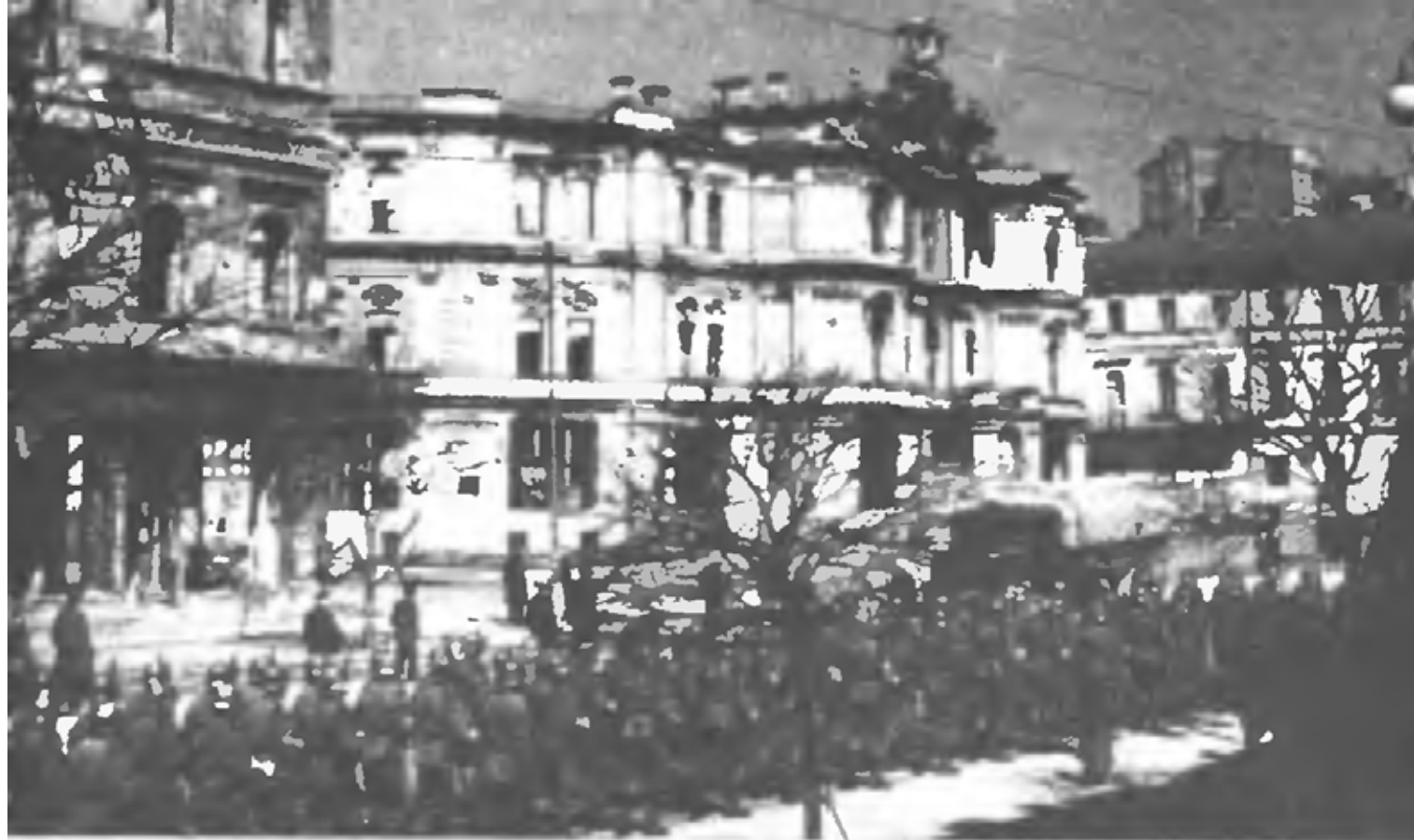
Немецко-фашистские оккупанты на Крещатике (Киев, 1941 г.)

два маршевых батальона, один стр. полк 264 сд и полк 227 сд на рубеж иск. ЛАЗУРЦЫ, вост. окр. БЕРЕСНЯГИ, КРУГЛИК, СИНЯВКА, 1 км ю.-в. МАСЛОВКА, которые ведут упорные бои на указанном рубеже. Захвачен пленный, принадлежащий новой, не участвовавшей еще в боях 68 пд.