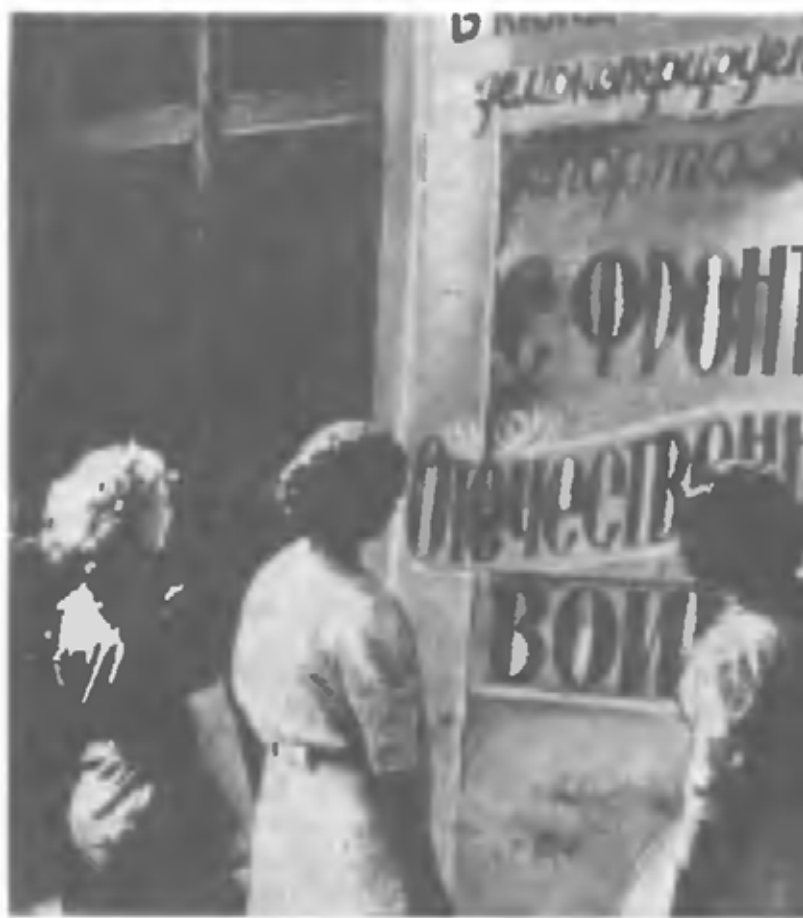
Жители Киева у афиш кинохроники (июль — август 1941 г.)