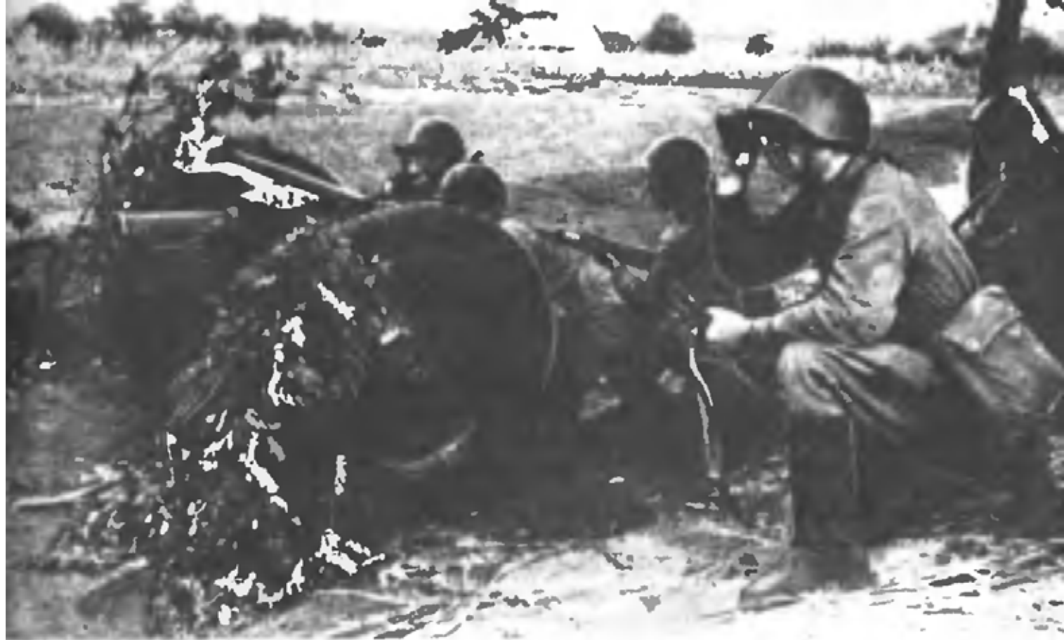
Орудийный расчет ведет огонь на одном из участков Юго-Западного фронта (сентябрь, 1941 г.)