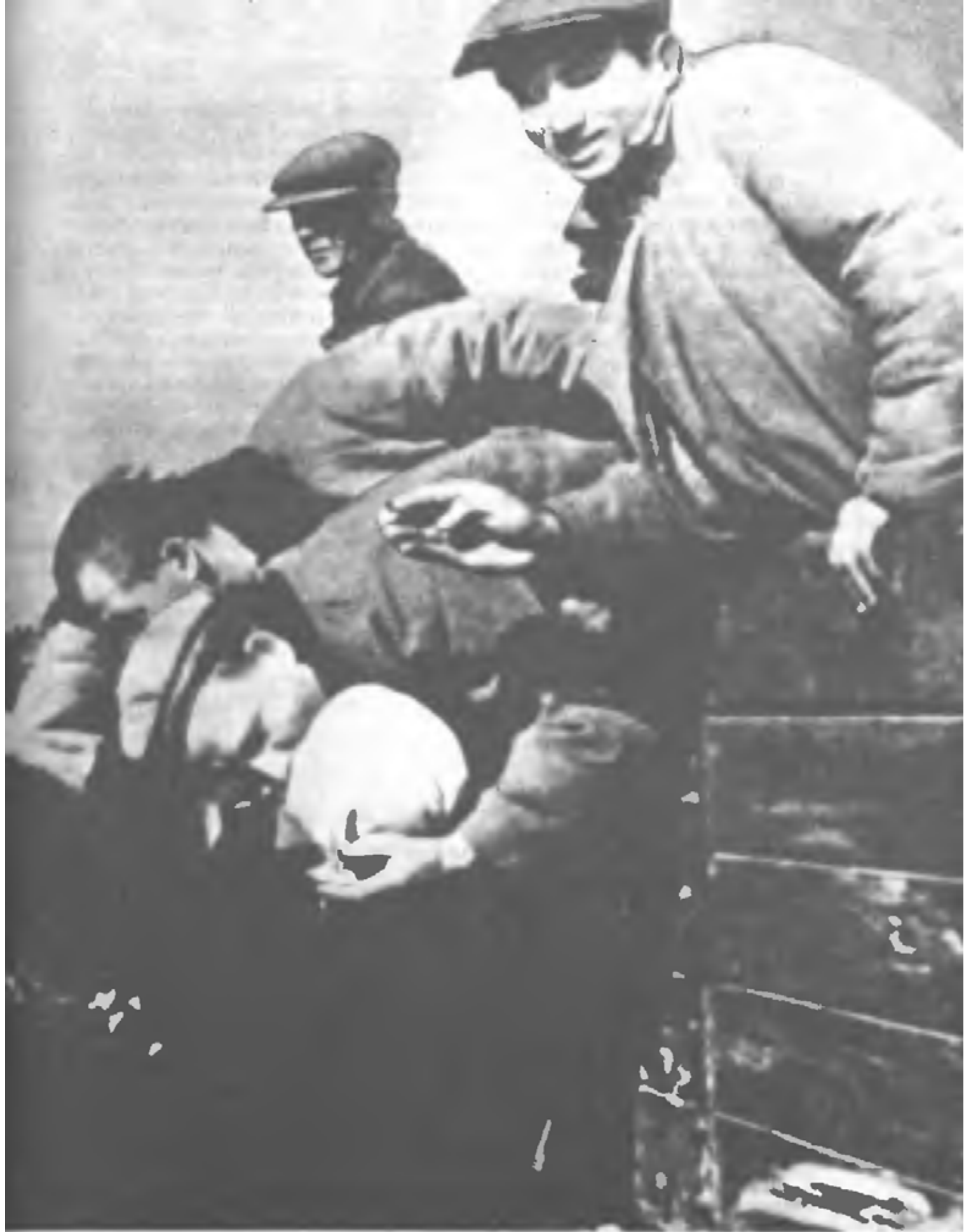
Призывники перед отправкой в Красную Армию (1941 г.)