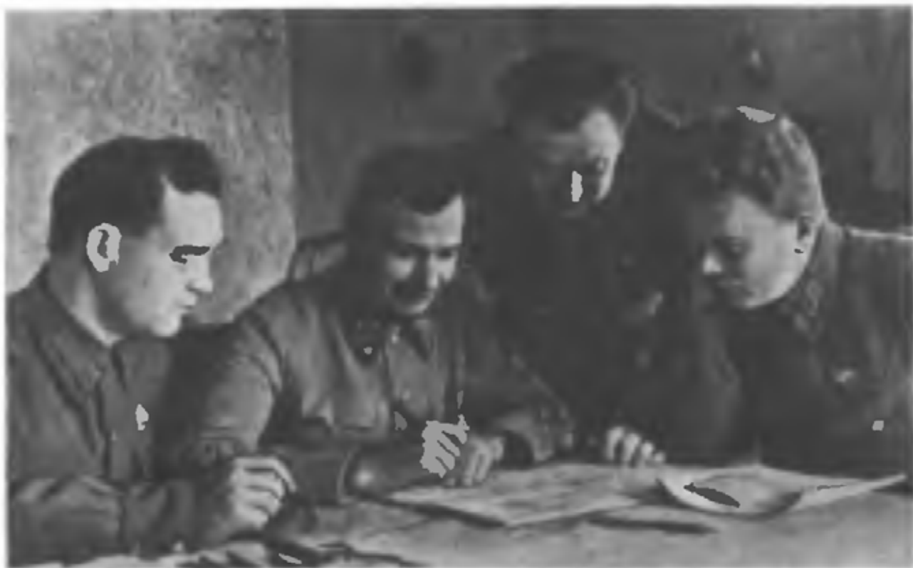
Члены военного совета Юго-Западного фронта над картой. Слева направо: М. А. Бурмистенко, М. П. Кирпонос, А. И. Кириченко, Е. П. Рыков (июль — август 1941 г.)

— Советские войска оставили населенные пункты: Верхнеднепровск (освобожден 22.10.1943 г. войсками 2 УФ), Кривой Рог (освобожден 22.2.1944 г. войсками 3 УФ).