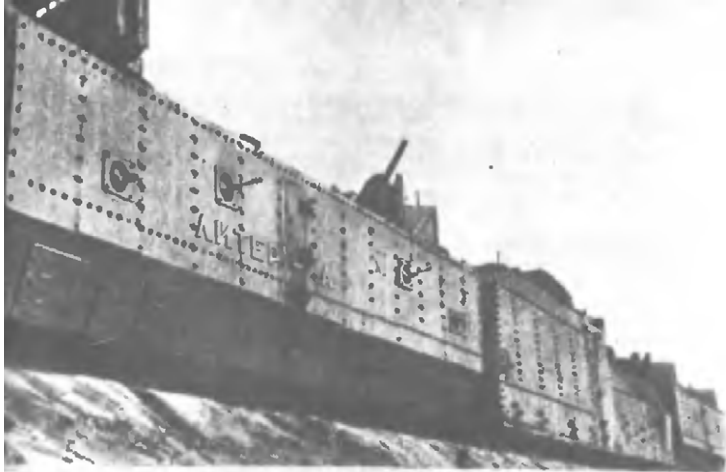
Бронепоезд киевских ополченцев «Литер А», принимавший участие в обороне Киева (1941 г.)

мя артдивизионами наступает в направлении Кулиши, обходя Емильчинский узел УР с юга. На остальном фронте корпуса мелкие группы противника.