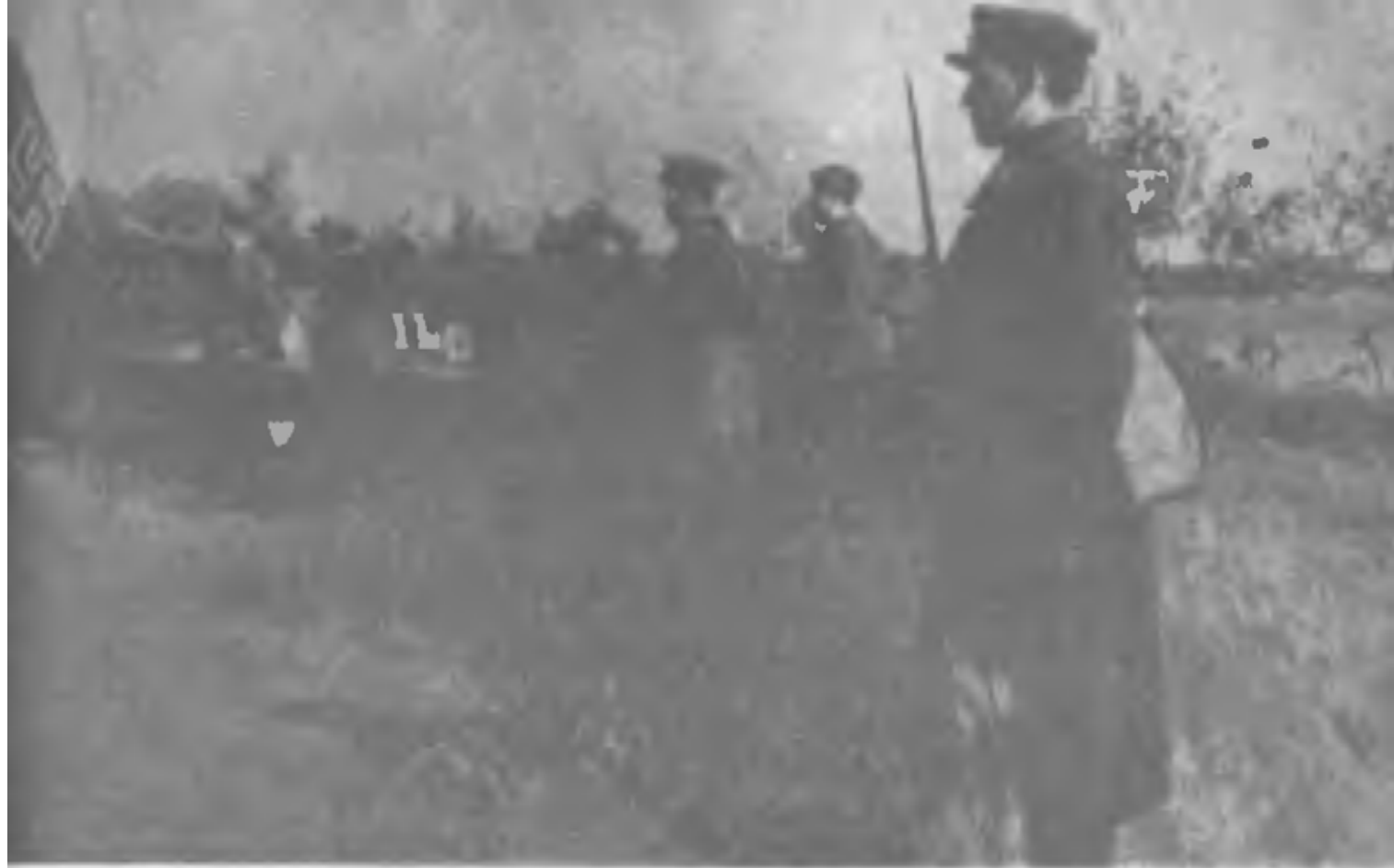
Первый немецкий самолет, сбитый в районе Киева (22 июня 1941 г.)

кол. Городище на Малииджур. Результаты атаки неизвестны, и третьим сп прикрывает сев. берег р. Ирша на фронте Пинязевичи, Ялцовка, ведя бой с противником силою до роты, переправившейся на сев. берег.