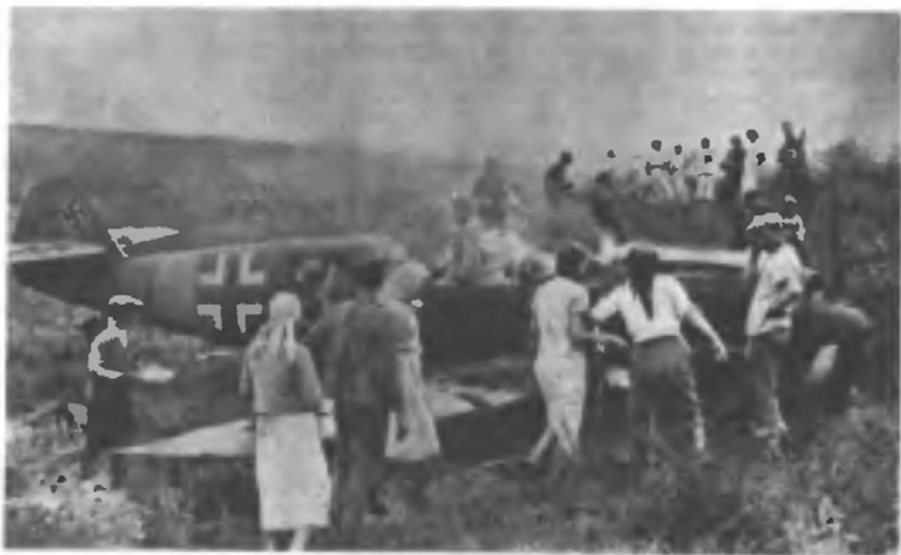
Сбитый фашистский истребитель Южный фронт, (1941 г.)

— Советские войска оставили города Переяслав (Переяслав-Хмельницкий, освобожден 21.9.1943 г. войсками ВорФ), Прилуки (освобожден 18.9.1943 г. войсками ЦФ и ВорФ).