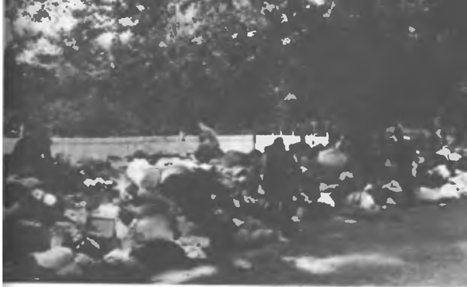
Фашистские мародеры ищут ценности в вещах расстрелянных советских граждан в Бабын Яру (Киев 1941 г.)

28 гсд. Противник мелкими группами в 22.30 28.8 повел наступление на мост через р. Ирпень у Романовка. Атака отбита. Остальные части КиУР — без изменений. Противник в 21.00 28.8 после короткой артиллерийской подготовки атаковал боевые порядки 232 сп из совхоза Феофания — положение восстановлено.