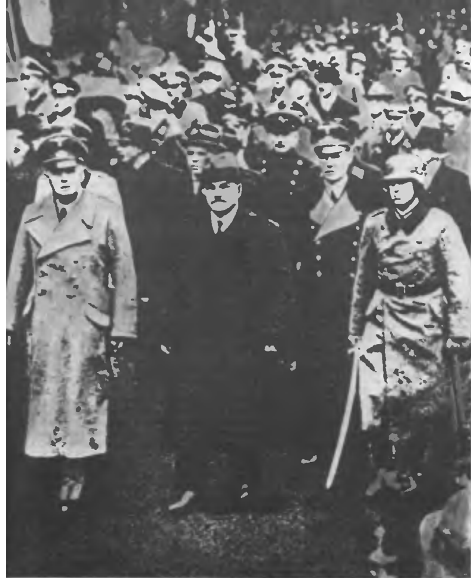
Молотов и Риббентроп Германия. 1940