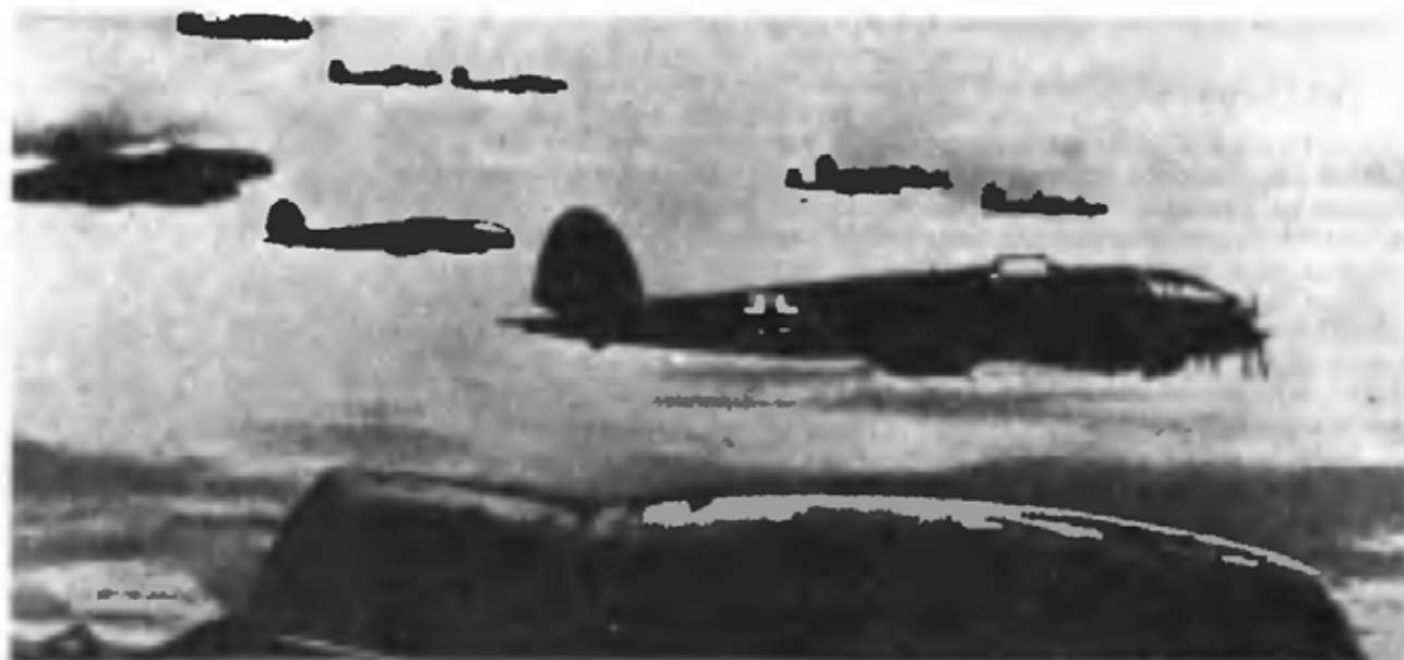
Первые немецкие самолеты над советской территорией

— Ставка Верховного Главнокомандования удовлетворила просьбу Главнокомандующего войсками Юго-Западного направления и