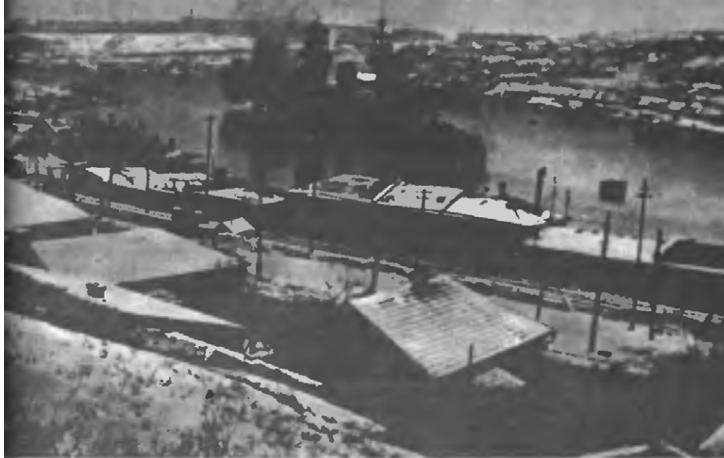
Линкор «Севастополь» ведет огонь у Южной бухты (Севастополь, 1941 г.)