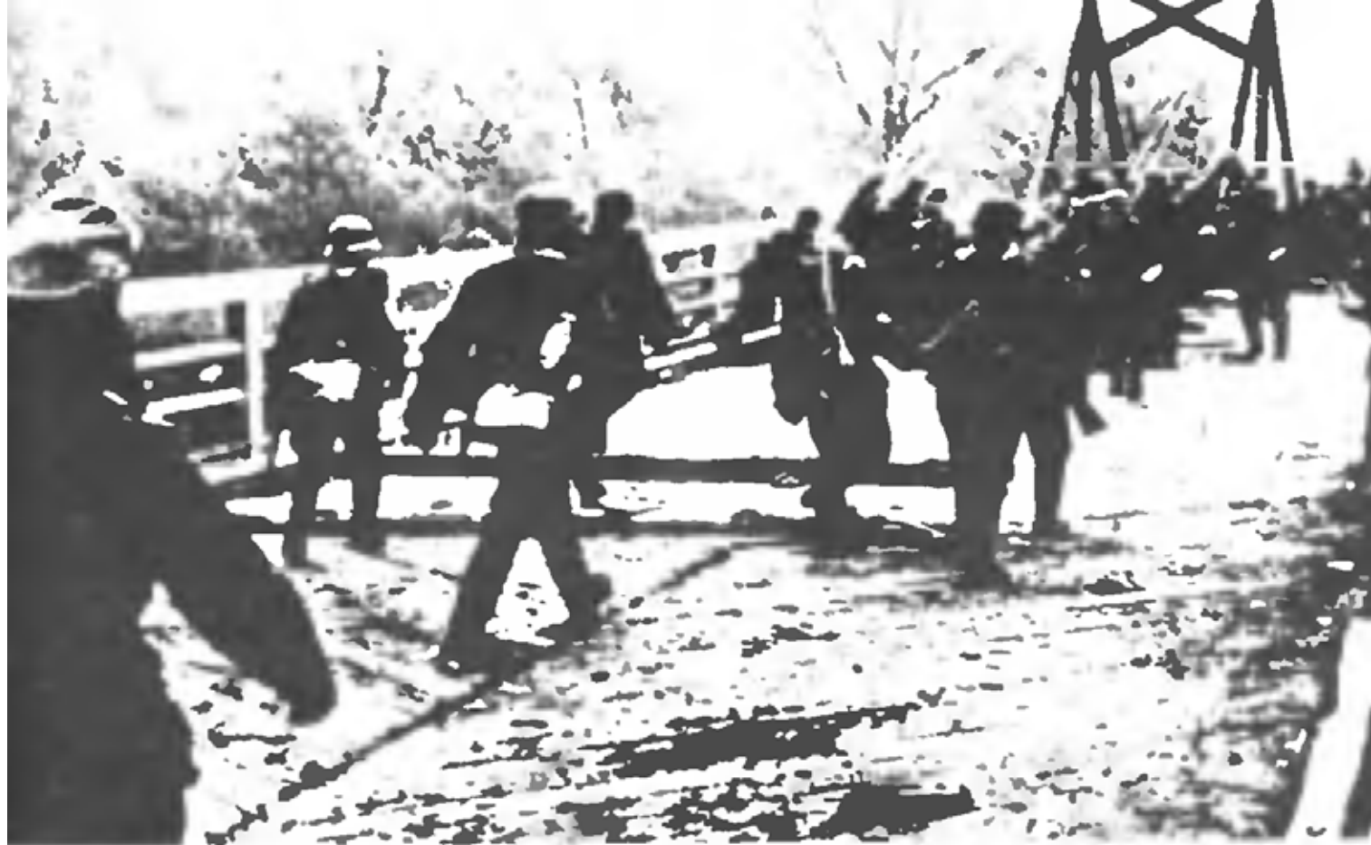
Немецко-фашистские захватчики переходят реку на границе СССР (22 июня 1941 г.)

96 гсд — Ур. Медведи [ ], Селетин, Бонтина-Альба исключительно 2 эшелона 155 гсп сосредоточены районе Берегомет, 651 гсп — районе Сторожинец, выс. 500, [ ] Панка. Штадив 96 — опушка леса 8 км ю. з. Волока.