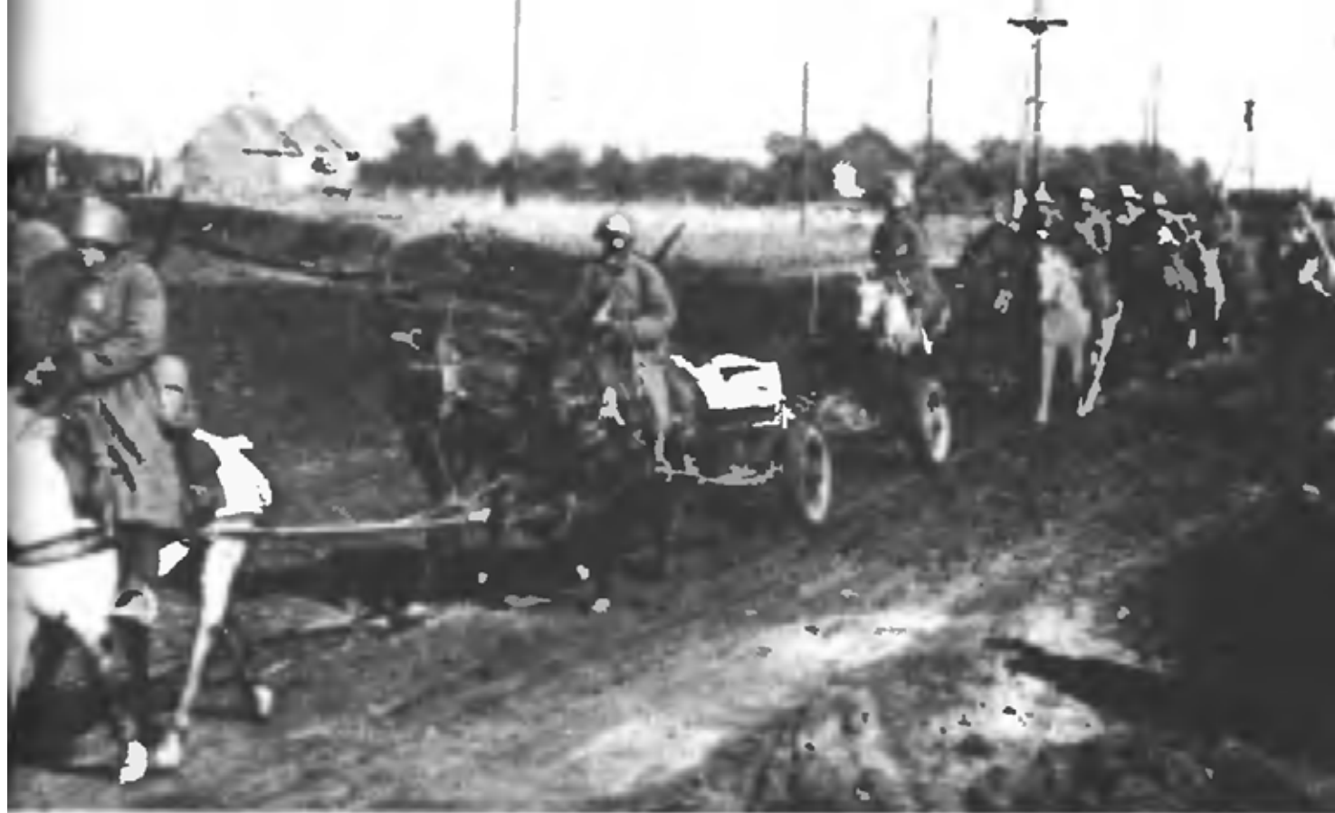
Советские воины на марше (Донбасс, 1941 г)

Части 383 сд и 38 кд переходят в подчинение командарма 18 с 00 ч. 13.10.41.