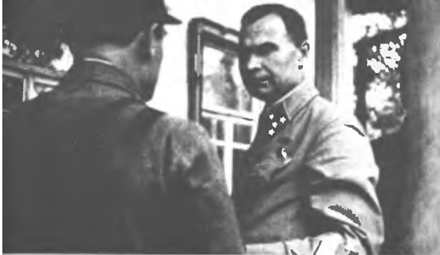
Командующий войсками Юго-Западного фронта М. П. Кирпонос во время обороны Киева (июль – август 1941 г.)

4. 26 армия с утра 26.7 продолжает вести бои по всему фронту с мотомехчастями противника.