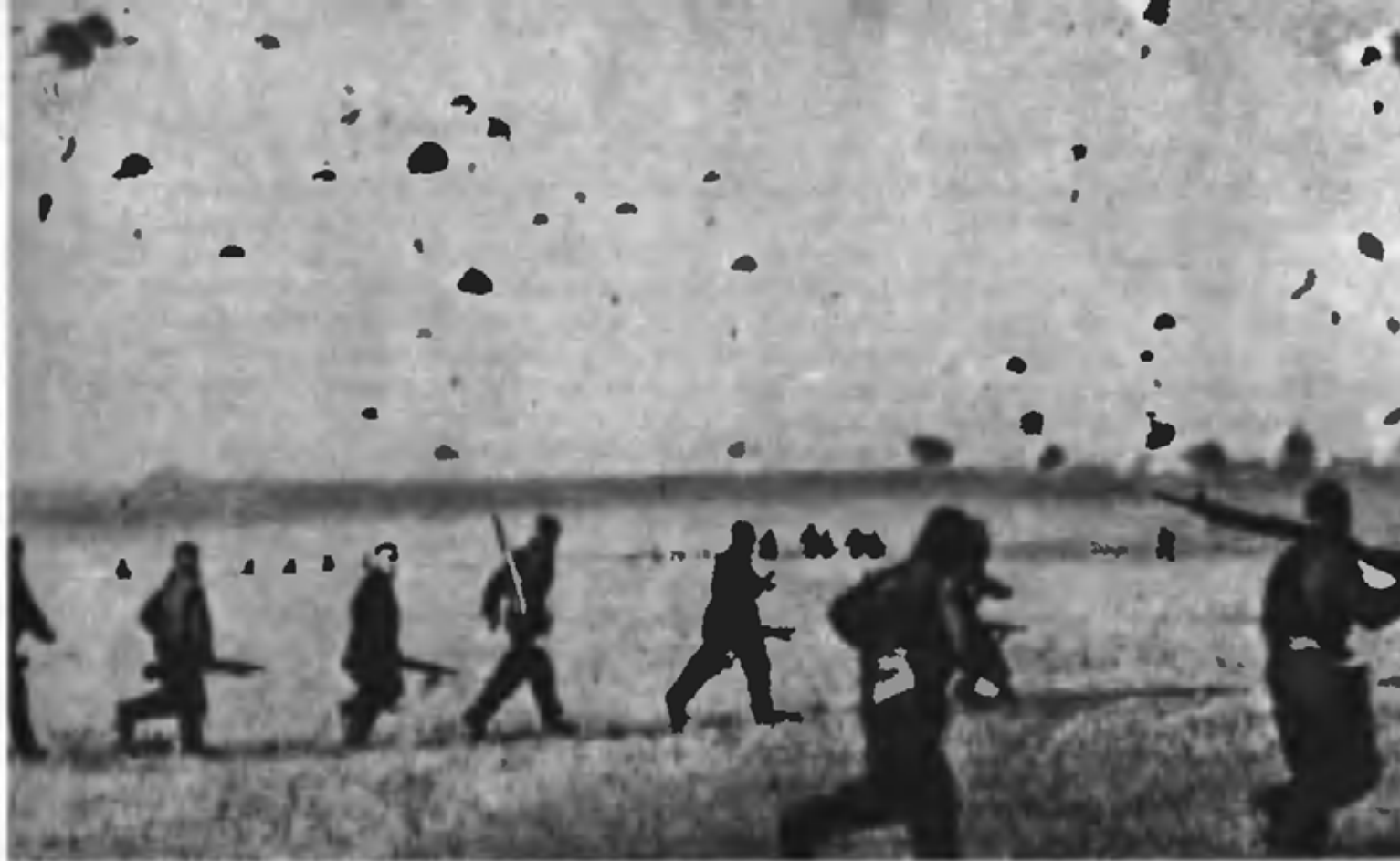
Десант на учениях Киевского военного округа (1935 г.)

быстрыми и глубокими ударами мощных подвижных группировок севернее и южнее Припятских болот и, используя этот прорыв, уничтожить разобщенные группировки вражеских войск.