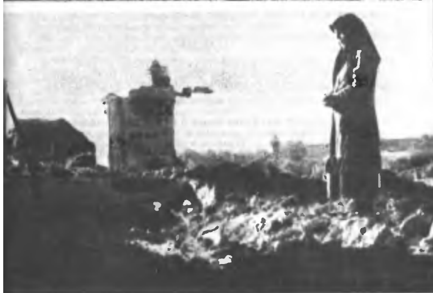
«Враги сожгли родную хату...»