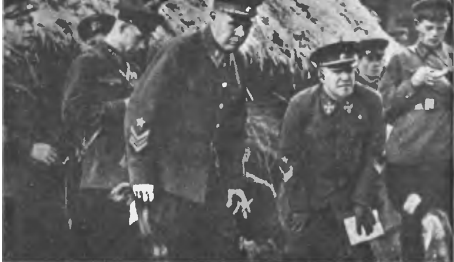
Маршал Советского Союза С. К. Тимошенко и генерал армии Г. К. Жуков на военных учениях (1940 г.)

Меве (16) — Вормдитт (16) — Фридланд (16) — Истербург (16) — Шмален- нингкен (18) — Расейняй (16) — Бойсогала (16) Екабпилс (16) — Яунелгава (16)