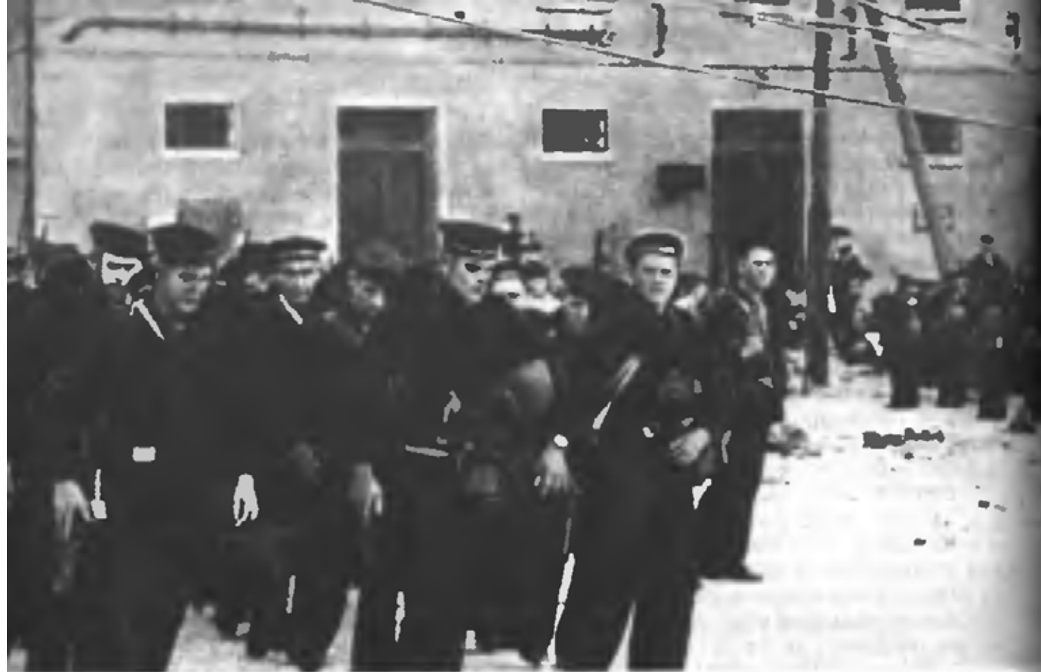
Краснофлотцы Севастополя (сентябрь, 1941 г.)

4. Нарушителей порядка немедленно привлекать к ответственности с передачей суду военного трибунала, а провокаторов, шпионов и прочих врагов, призывающих к нарушению порядка, расстреливать на месте.