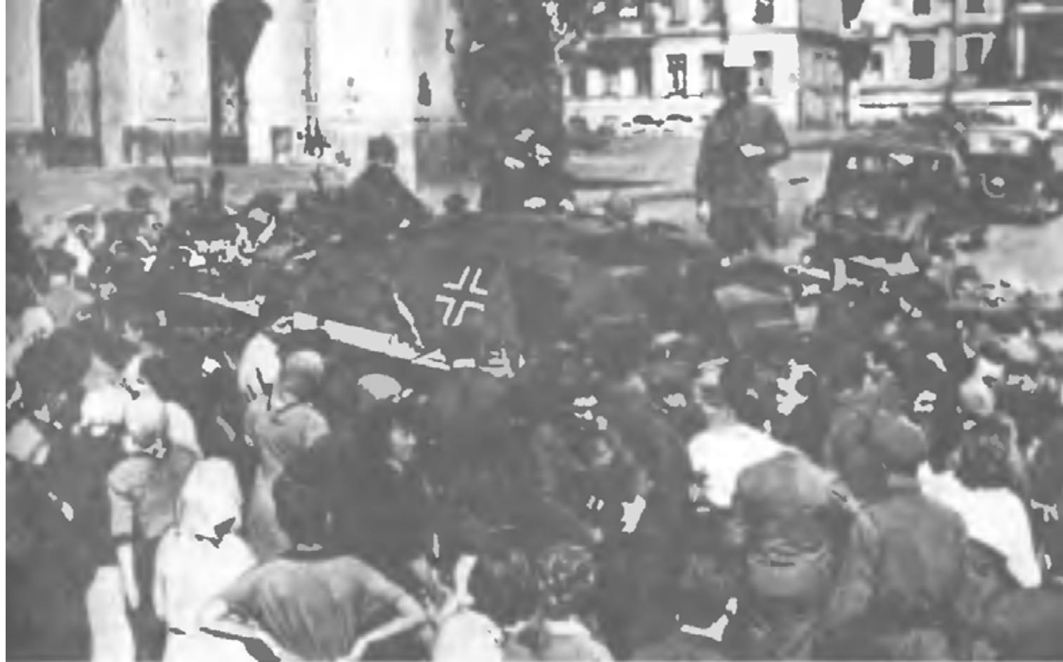
Киевляне осматривают немецкий танк, подбитый красноармейцами в с Витя- Почтовая (10 августа 1941 г.)