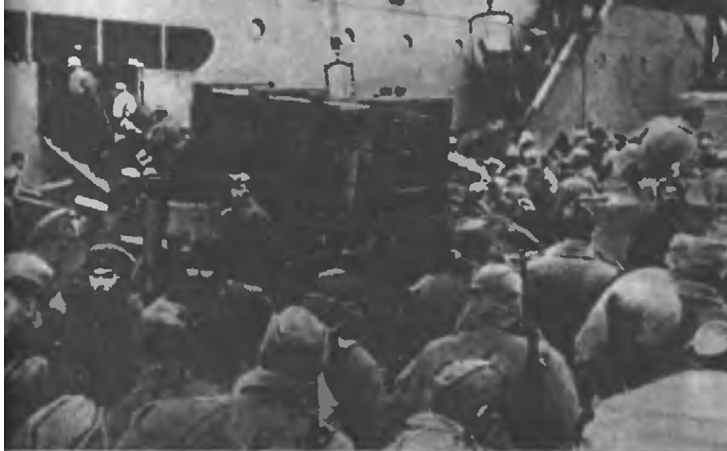
Эвакуация советских войск из Одессы (1941 г.)

ЗА и ЗП. Многие самолеты имеют пробоины. 2 И-16 вышли из строя, пробиты подкос шасси и крепление руля глубины.