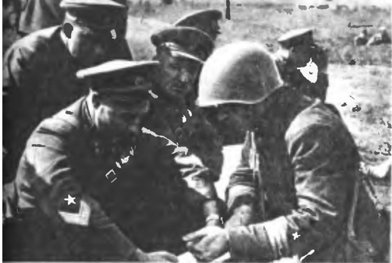
На командном пункте 9-й армии Южного фронта. Слева направо командарм — 9 генерал-полковник Я. Т. Черевиченко и генерал-майор И. Т. Еременко (июль — октябрь 1941 г.)

Хуже обстоит дело с пополнением противотанковой артиллерией и минометами. Надеяться на немедленное получение новой материальной части этих видов вооружения пока не приходится.