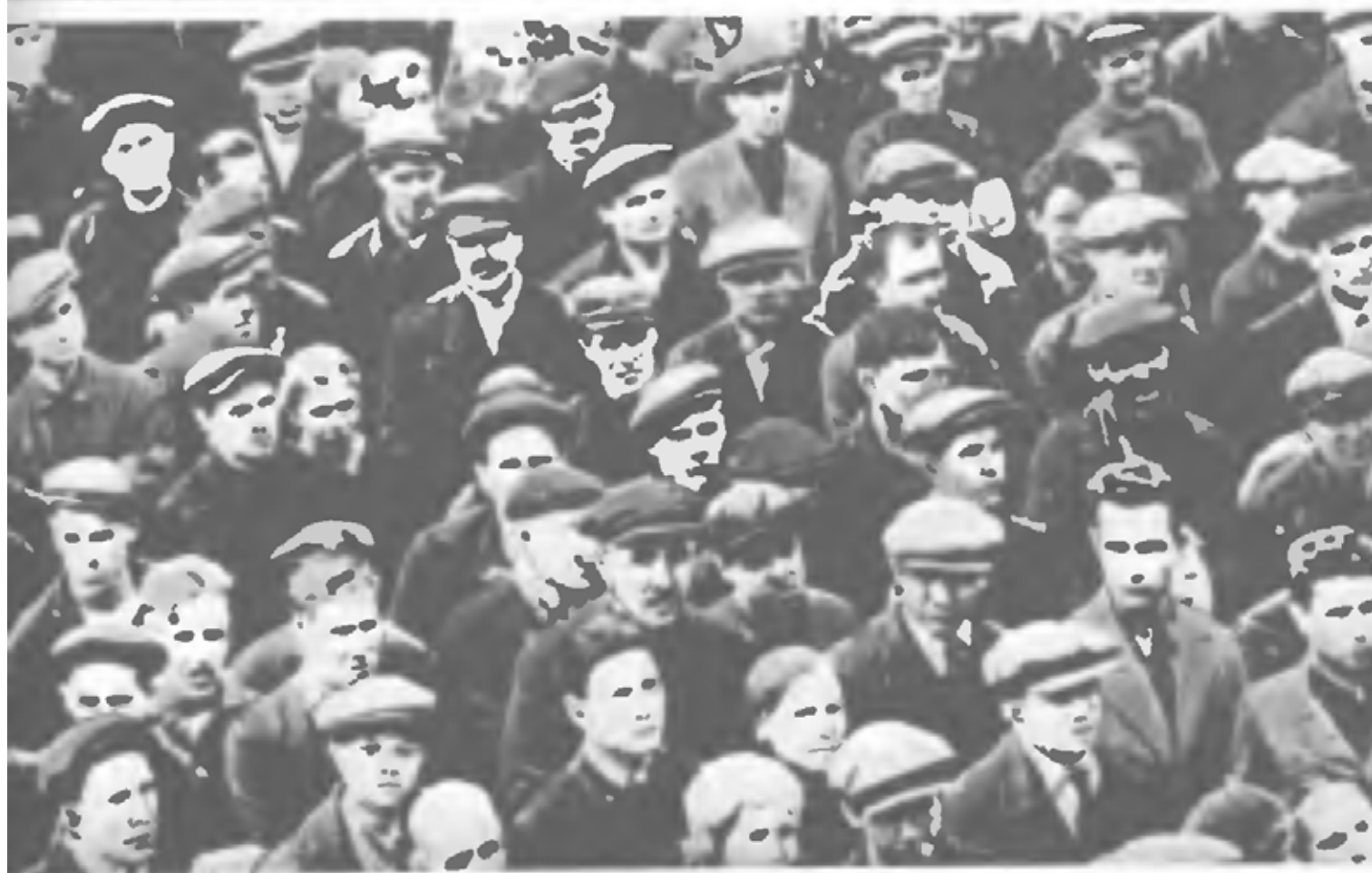
Киевляне слушают по радио сообщение Советского правительства о нападении фашистской Германии на Советский Союз (Киев, 22 июня 1941 г.)