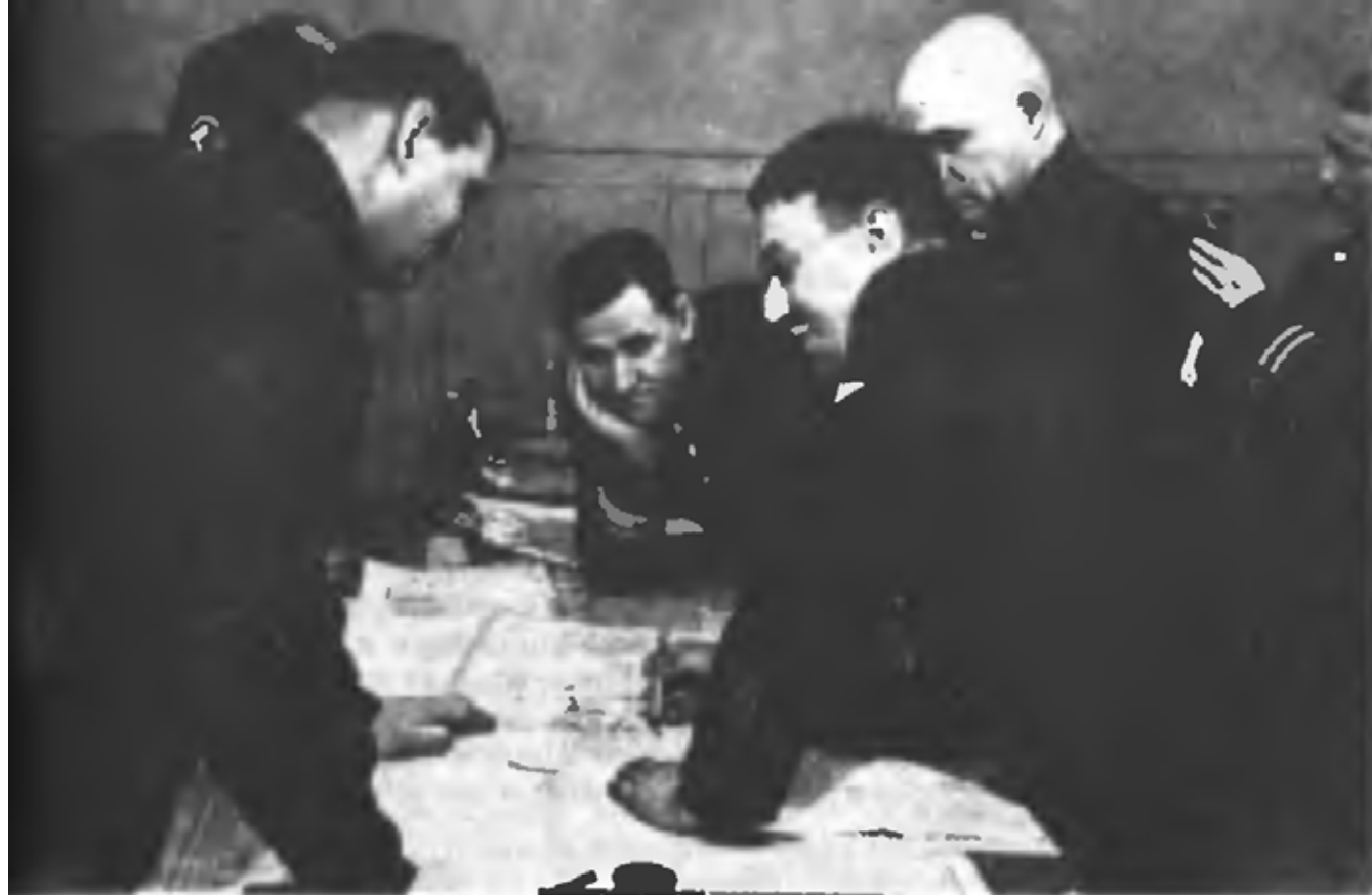
Заседание военного совета Черноморского флота в дни героической обороны Севастополя (1941 г.)

Организовать внезапные налеты по аэродромам противника в р-не Чаплынка, непрерывно разведывать перемещение и подход резервов перед фронтом армии.