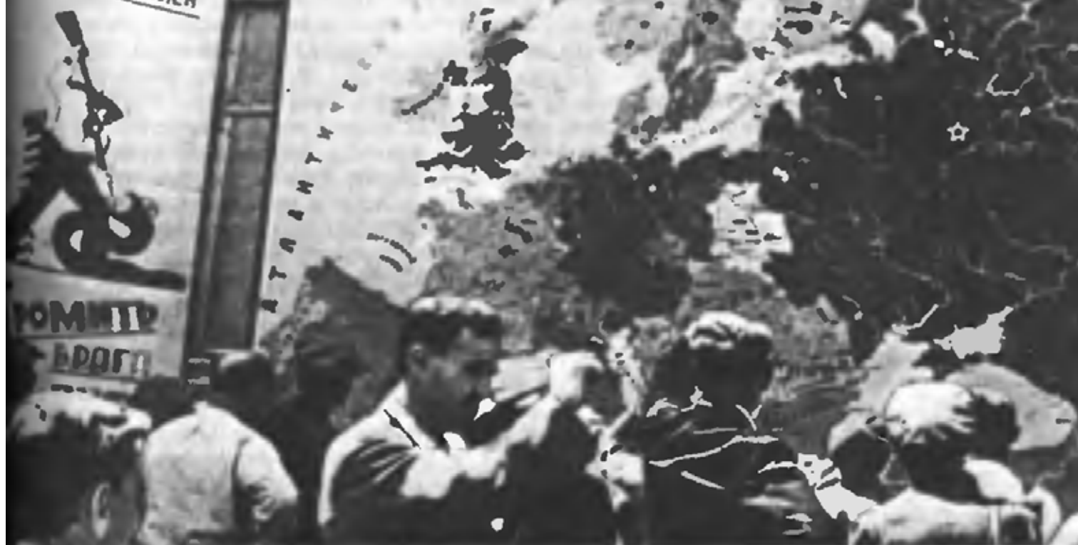
Севастопольцы у карты Европы со сводкой Совинформбюро (24 июня 1941 г.)

ТЕТИЕВ. Одновременно части 6 и 12 армий из района ПЛИСКОВКА, ИЛЫНЦЫ должны наступать на ЖИВОТОВ — ЖАШКОВ.