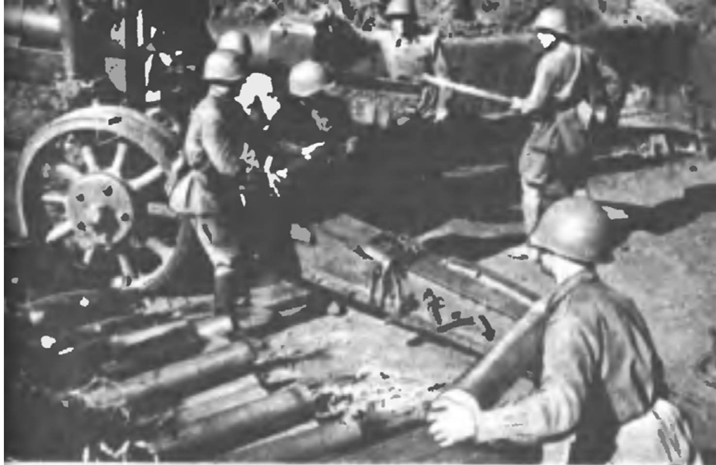
Советские артиллеристы на о. Хортица ведут огонь по вражеским позициям (Запорожье, август 1941 г.)

Управление 17 ск, спецчасть, остатки 169 сд — на марше из Николаевка — 2-я на Мостовое, Ляхово.