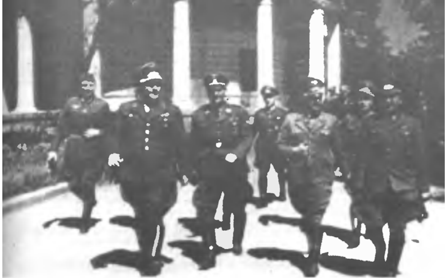
Аскольдова могила в Киеве в сентябре 1941 г.

Ксаверовка и потеснил к 15.00 левый фланг 45 сд к х. Липянка, 9 мк на рубеж Рудня-Калиновская, кирп. ю.-в. Ксаверов и правый фланг 1 вдоб в Дуброва.