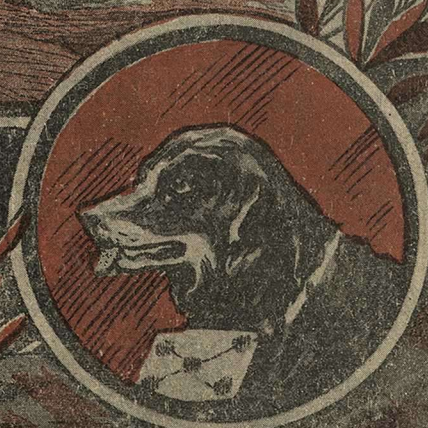
рис. Н. Давыдов