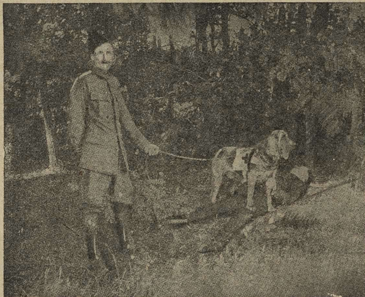
Англійская санитарная собака со своимъ учителемъ.

Кромѣ солдатъ, которыхъ во время войны берутъ въ плѣнъ, есть еще и другіе военнопленные. Попадаютъ въ плѣнъ также лошади и эта военная добыча цѣнится очень высоко.