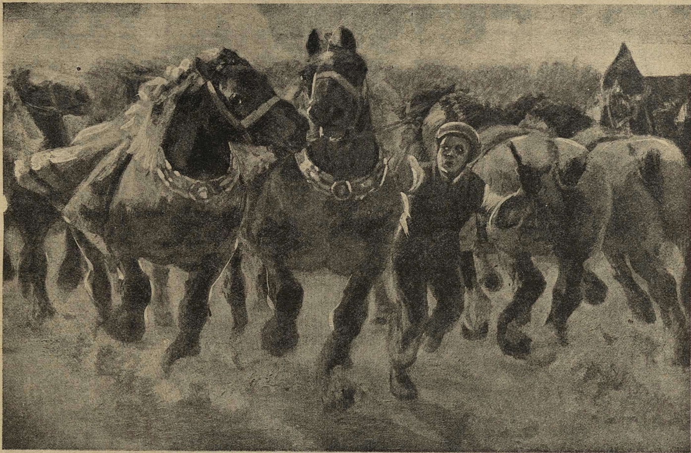
Нѣмецкіе тяжеловозы, приспособленны, для перевозки орудій, взбѣсались услыша выстрѣлы.