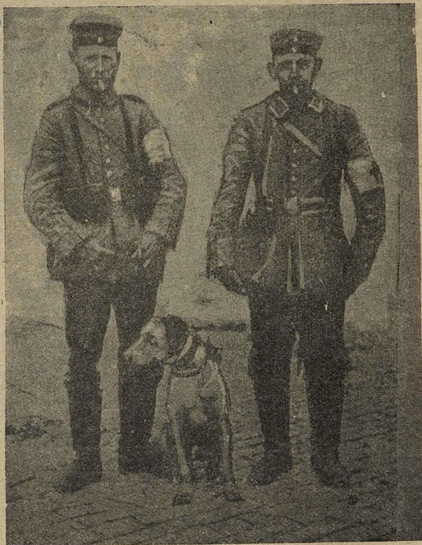
Германскіе варвары взяли въ плѣнъ бельгійскую собаку-санитара, оказывавшую помощь раненымъ на полѣ битвы.

Они же, перелетая съ мѣста на мѣсто и оглашая воздухъ определенными звуками: «ди-ди, ди-ди», указываютъ непріятельской артиллеріи, куда направлять выстрѣлы.