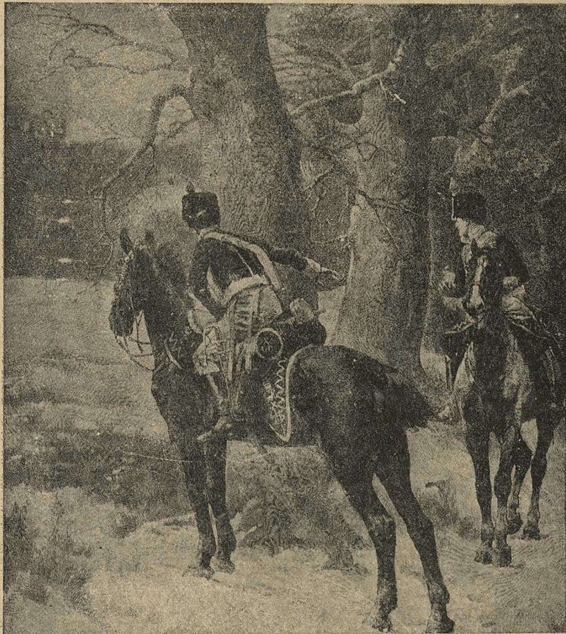
Въ засадѣ. Лошади польскихъ легионеровъ чуютъ приближеніе нѣмцевъ.

Угадывали и переживали ночное дѣло, участникомъ котораго мнѣ не довелось быть.