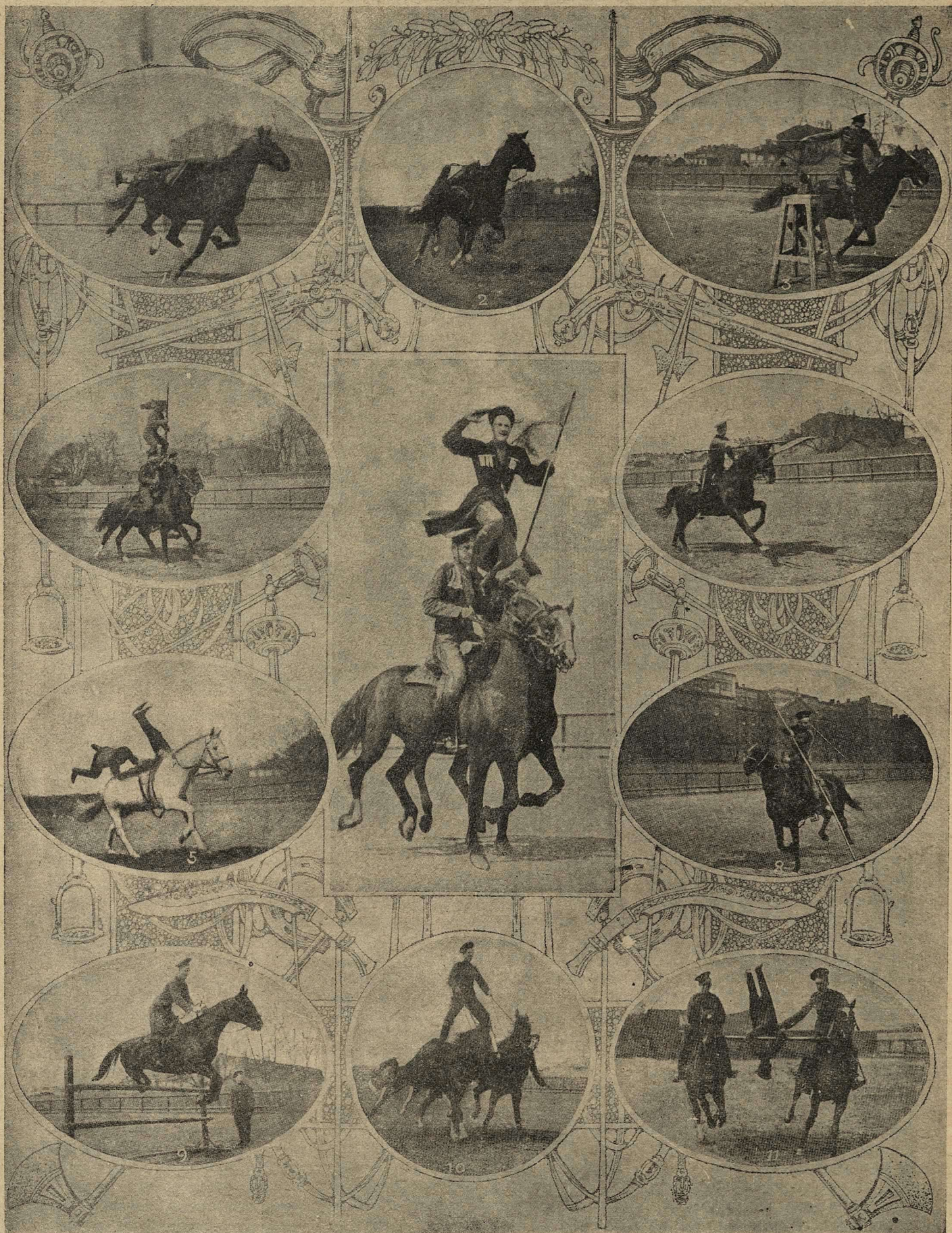
Чудо-ѣзда нашихъ молодцовъ-кавалеристовъ, юнкеровъ Николаевского училища.