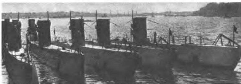
...и на море