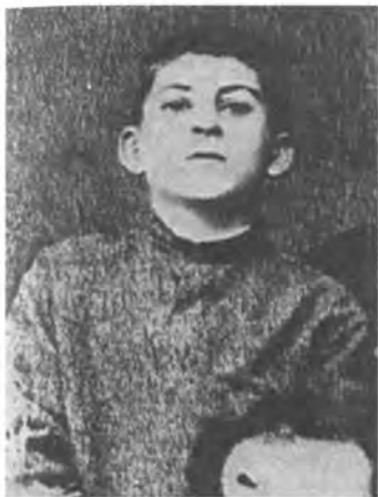
1890 г. И.В. Джугашвили (1878—1953) — учащийся Горийского духовного училища