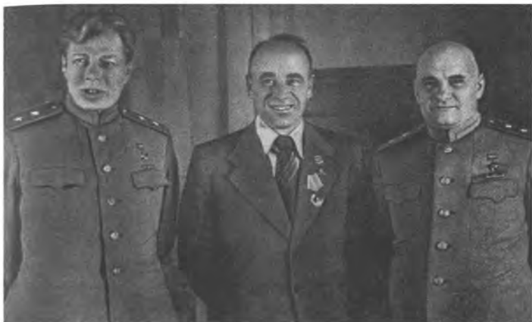
Руководители оборонной промышленности СССР: Д.Ф. Устинов (1908—1984), В.А. Малышев и Б.Л. Ванников (1897—1962)