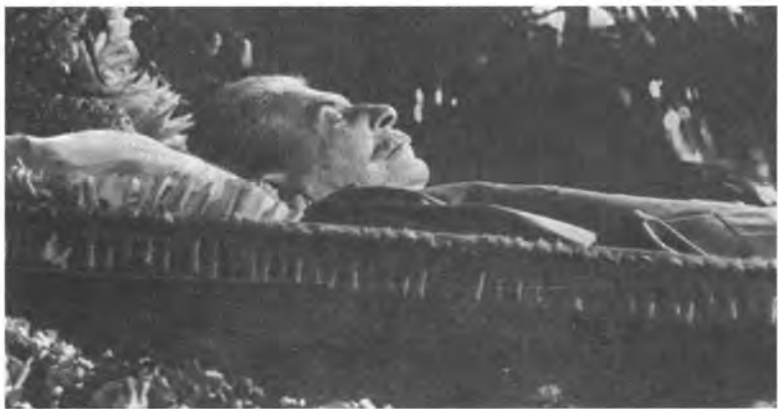
И.В. Сталин. Март 1953 года