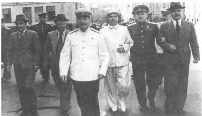
А.И. Микоян (1895—1978), Н.С. Хрущев (1894—1971), И.В. Сталин, Г.М. Маленков (1902—1988), Л.П. Берия (1899—1953), В.М. Молотов (1890—1986)