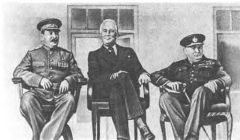
На Тегеранской конференции 1943 года