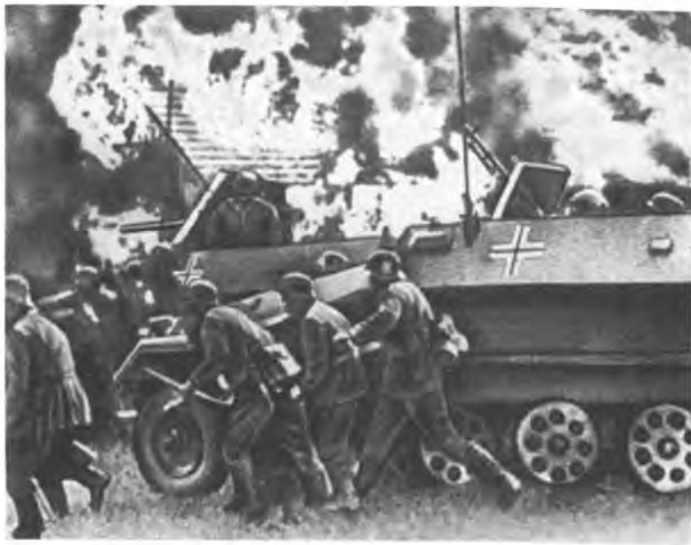
1941 г. Войска фашистской Германии переходят границу СССР