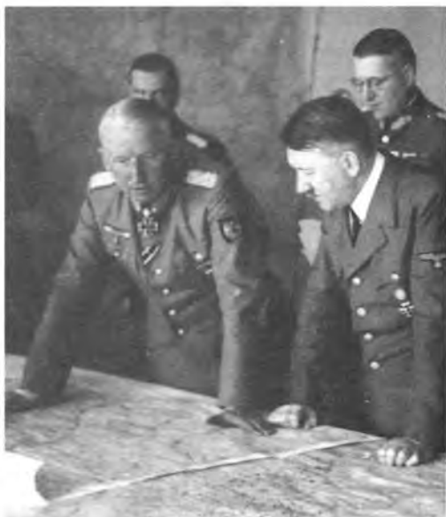
Ставка верховного главнокомандования в Пруссии. Гитлер над картой. Слева — генерал-фельдмаршал Эрих фон Маништейн (1887—1973)