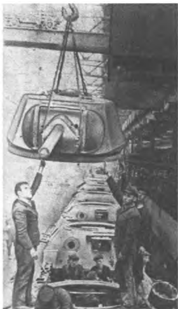
Производство танков на уральском заводе