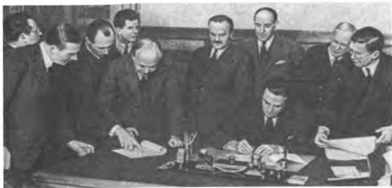
Москва, октябрь 1941 г. Подписание документов о военных поставках представителями СССР, Великобритании и США