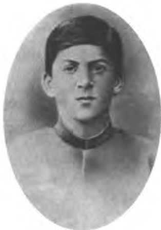
И.В. Джугашвили в 1894 г.