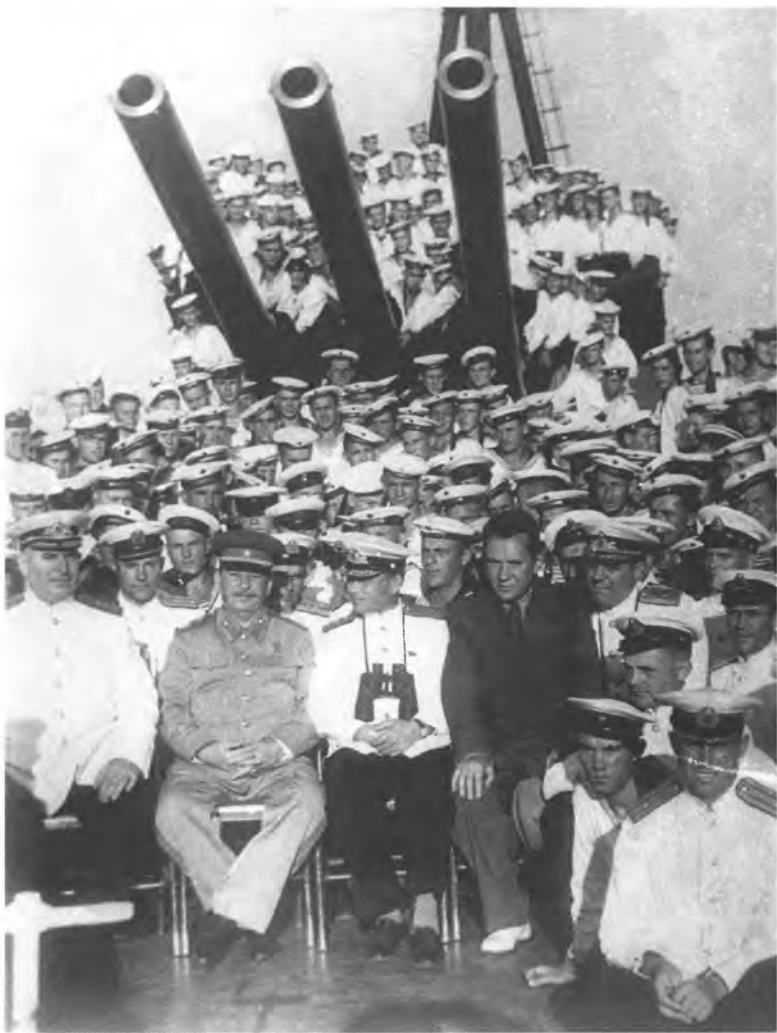
И. В. Сталин с военными моряками