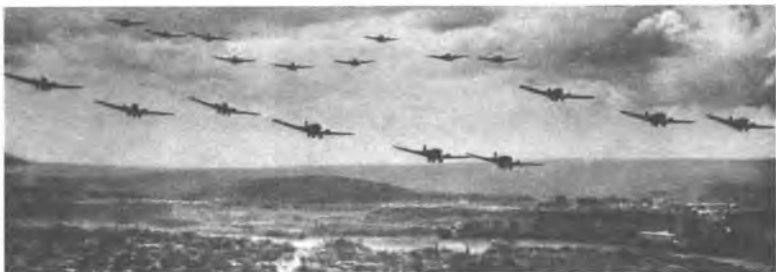
Германия готовится к войне в воздухе...