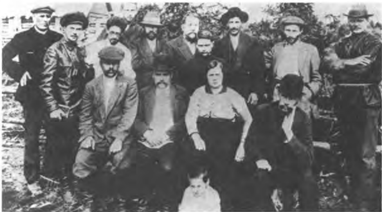
Группа ссыльных в Туруханском крае (И.В. Сталин стоит вторым справа)