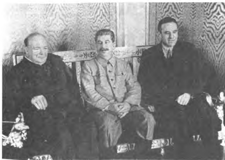
1942 г. У. Черчилль (1874—1965), И.В. Сталин и У.А. Гарриман (1891—1986) в Кремле