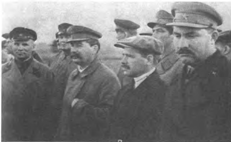
Август 1936 г. И.В. Сталин, Л.М. Каганович (1893—1991) и А.А. Андреев (1895—1971) на Центральном аэродроме