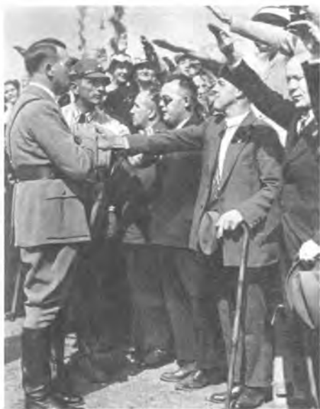
1934 год. Гамбург встречает Гитлера