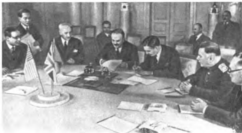
Москва, октябрь 1943 г. Конференция министров иностранных дел СССР, США и Великобритании