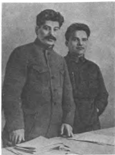
1926 г. И.В. Сталин и С.М. Киров (1886—1934)