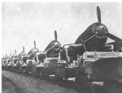
Боевые самолеты следуют к линии фронта