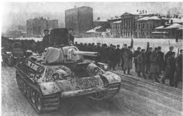
Боевые резервы отправляются на фронт по улицам Москвы