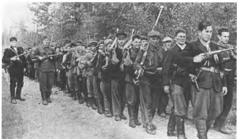
Партизаны на марше