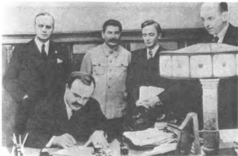
1939 г. Подписание германо-советского договора о дружбе и границе между СССР и Германией