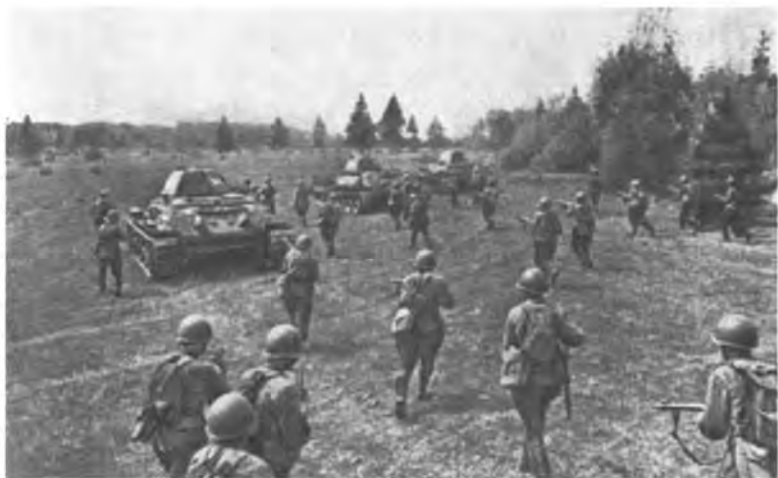
Советская пехота контратакует под Смоленском