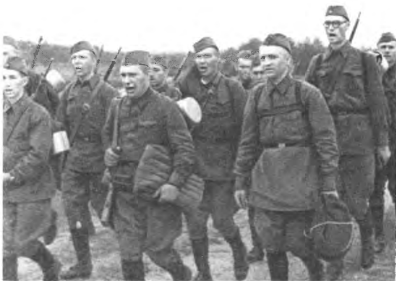
Бойцы московского народного ополчения