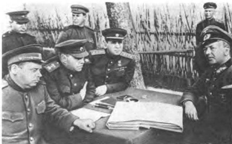
Допрос пленного немецкого генерала