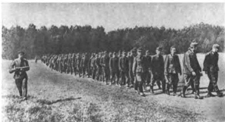
Колонна пленных, взятых в ходе операции «Багратион»