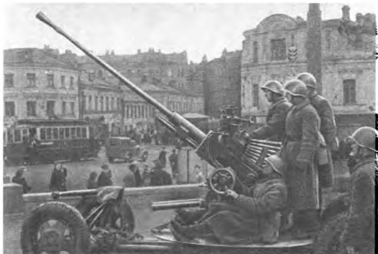
Москва, 1941 г. Зенитная установка у Никитских ворот