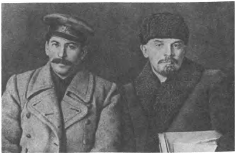
Март 1919 г. В.И. Ленин и И.В. Сталин на VIII съезде РКП (б)