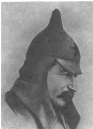
1919 г. И.В. Сталин во время посещения Первой Конной армии