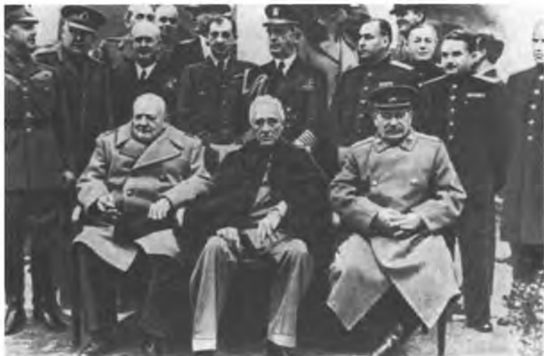
Февраль 1945 г. На Крымской конференции