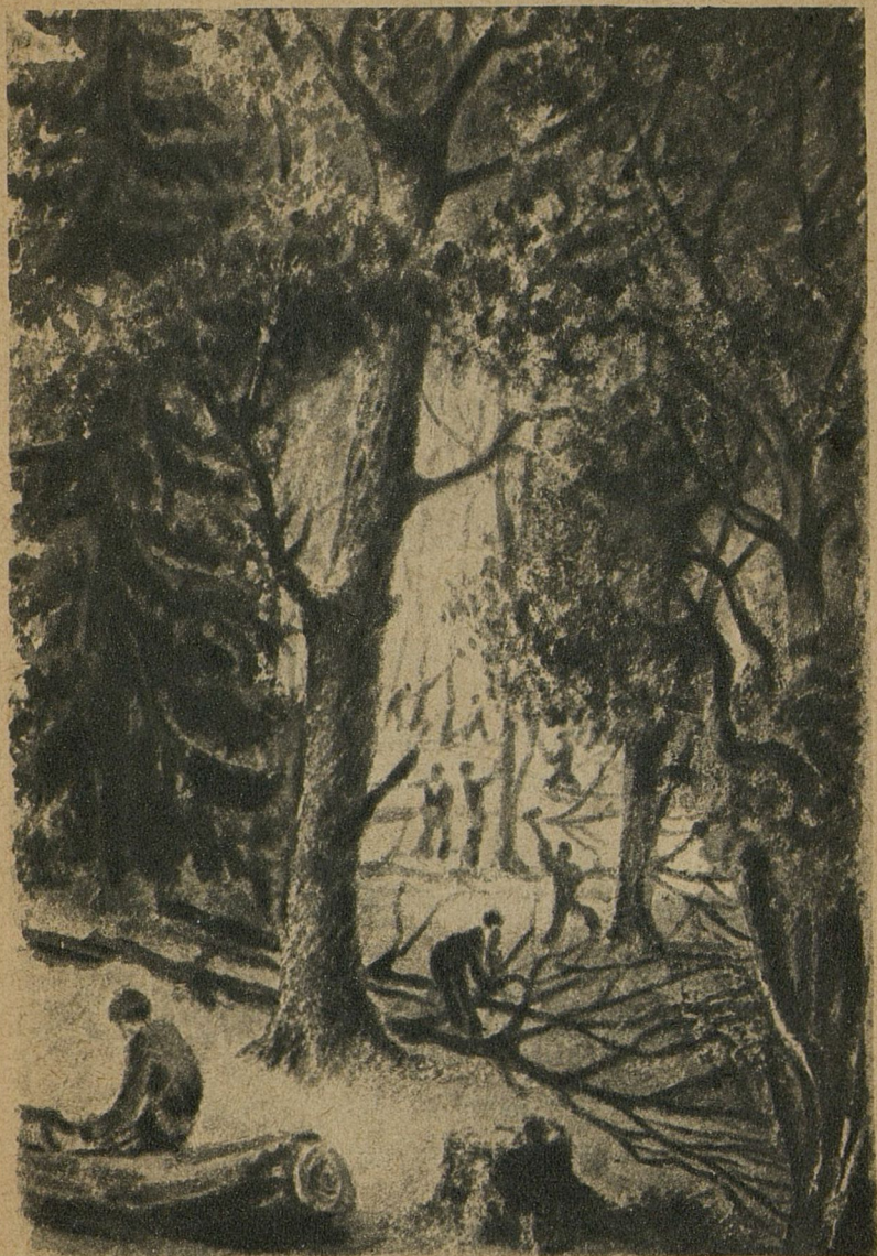
Лес зазвенел, застонал, затрещал.