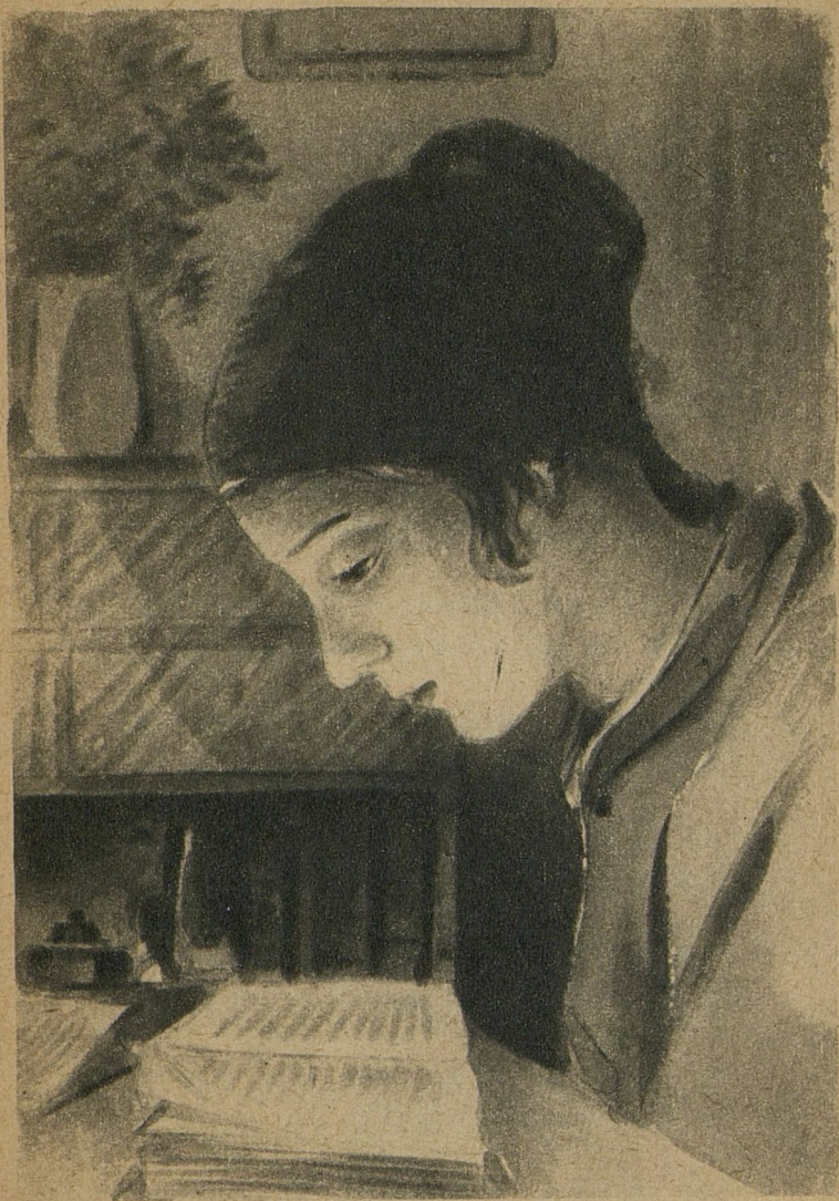
Книжки читает, украдкой плачет.