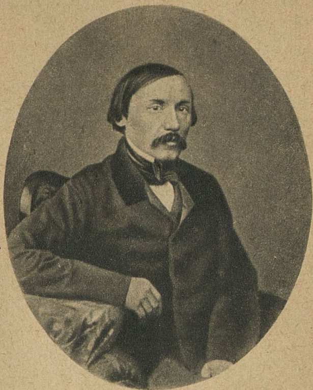
Н. А. НЕКРАСОВ.