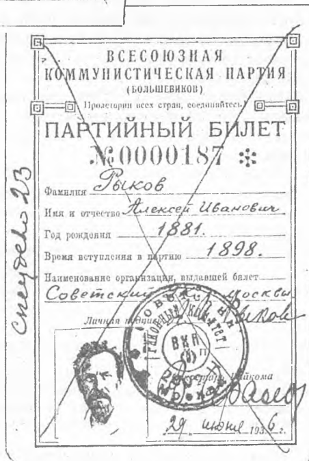
Партийные билеты Н. И. Бухарина и А. И. Рыкова (образца 1936 г.). Погашены в 1937 г. (список на погашение № 23). Билеты хранятся в ЦК КПСС.