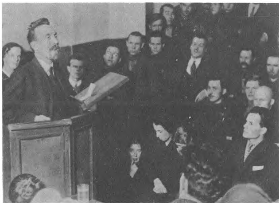
А. И. Рыков выступает на II Всероссийском агрономическом съезде. Москва, 1929 г.