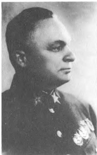
А. И. Егоров.

М. Н. Тухачевский передает знамя кавалерийской дивизии Ленинградского военного округа в день ее 10-летия. Начало 30-х годов.