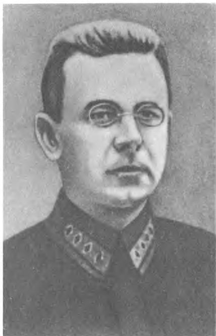
И. Э. Якир.