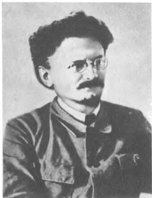
Л. Д. Троцкий.