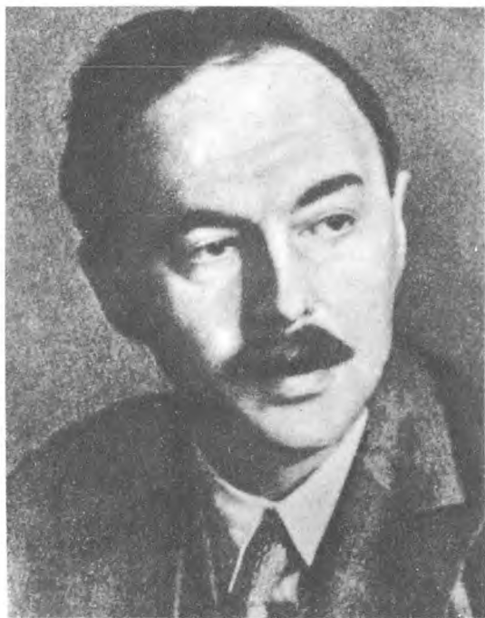
Г. Я. Сокольников. Конец 20-х годов.