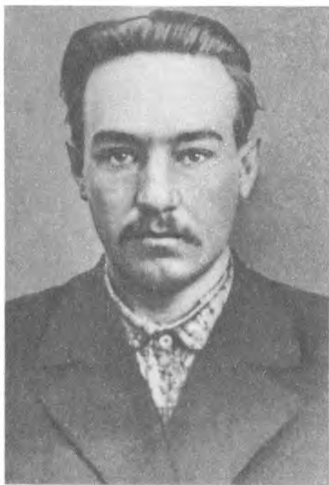
А. Г. Шляпников.