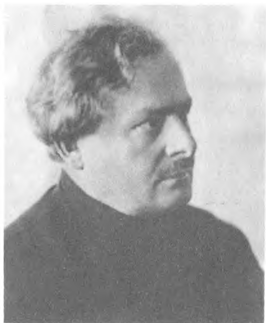
А. С. Енукидзе.