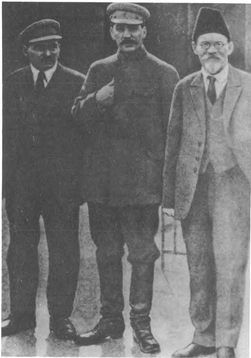
М. П. Томский, И. В. Сталин, М. И. Калинин. Москва, 1927 г.