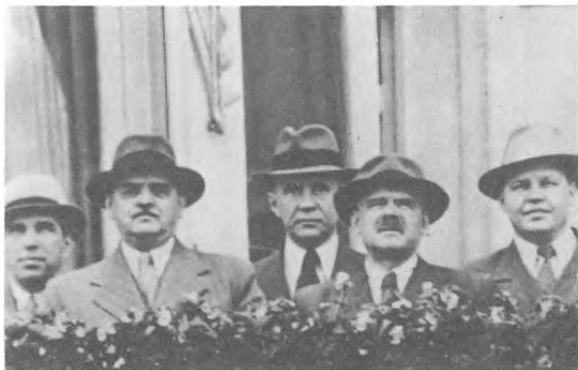
На авиационном параде в Тушине. Слева направо: А. А. Кузнецов, Н. М. Шверник, А. Н. Косыгин, А. А. Андреев, Н. А. Вознесенский. Москва, 1946 г.