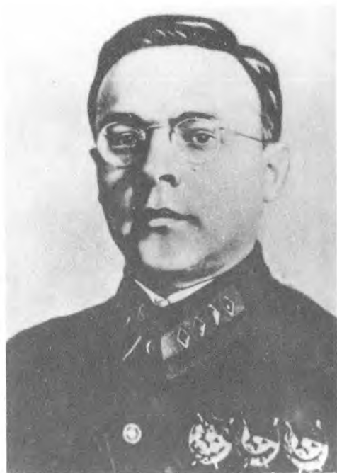
В. М. Примаков.