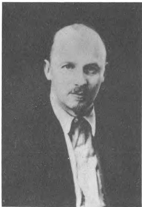
Н. И. Бухарин.