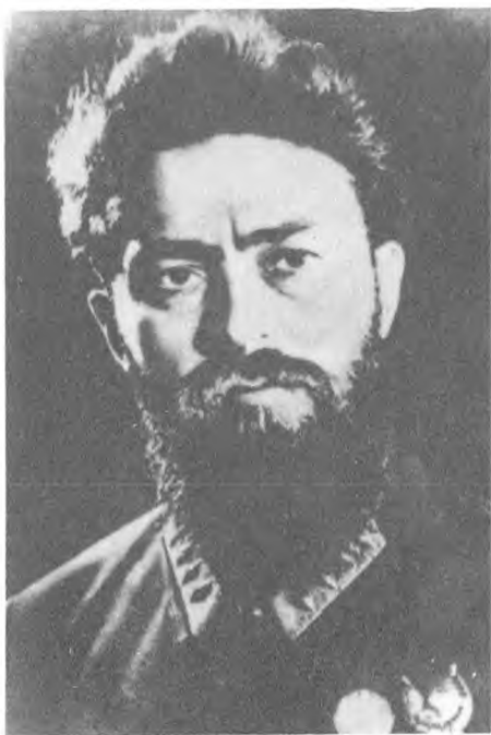
Я. Б. Гамарник.