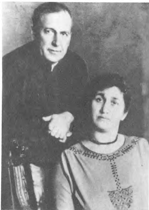
Х. Г. Раковский с женой. 30-е годы.