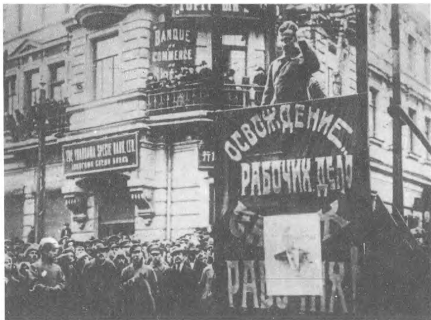
И. П. Уборевич выступает на митинге, посвященном освобождению Приморья. Владивосток, 1922 г.