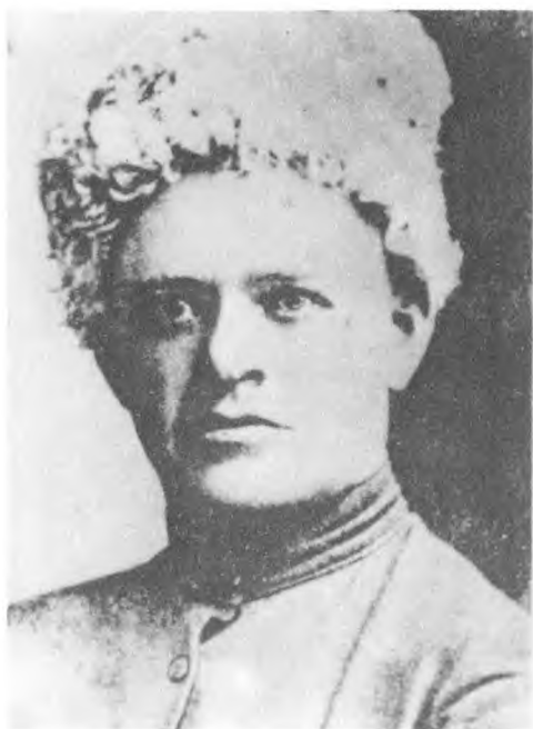
С. В. Косиор.