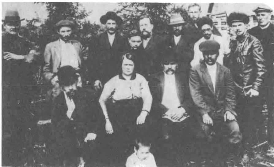
Во втором ряду слева направо: В. М. Молотов (1-й), И. В. Сталин (3-й), Л. Б. Каменев (5-й), Я. М. Свердлов (7-й) в группе ссыльных. Туруханский край, 1915 г.