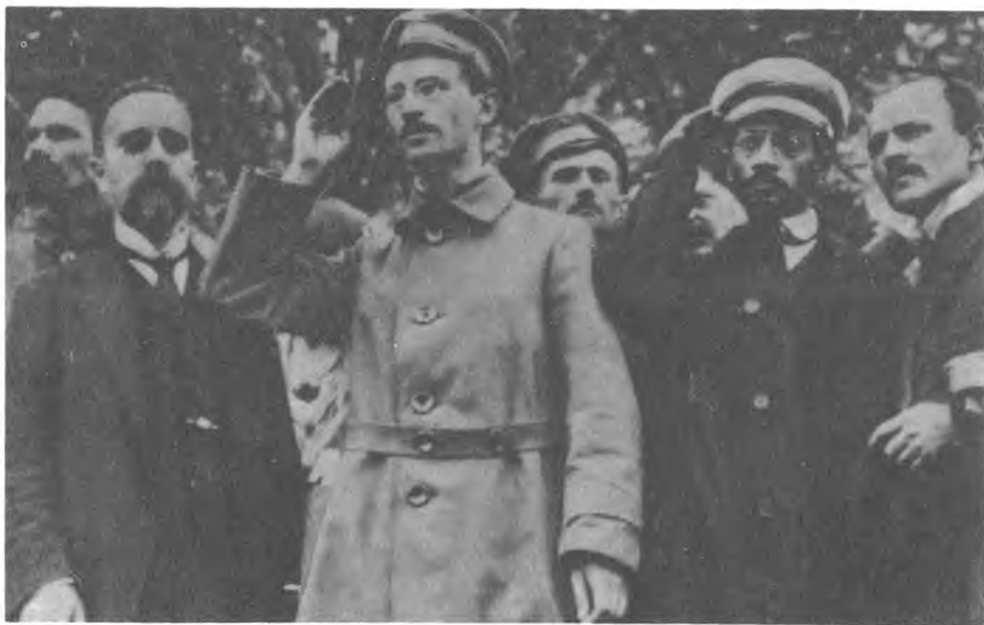
На Первомайском празднике. Слева направо: Л. Б. Каменев (2-й), Э. М. Склянский (3-й), Я. М. Свердлов (5-й). Москва, 1918 г.