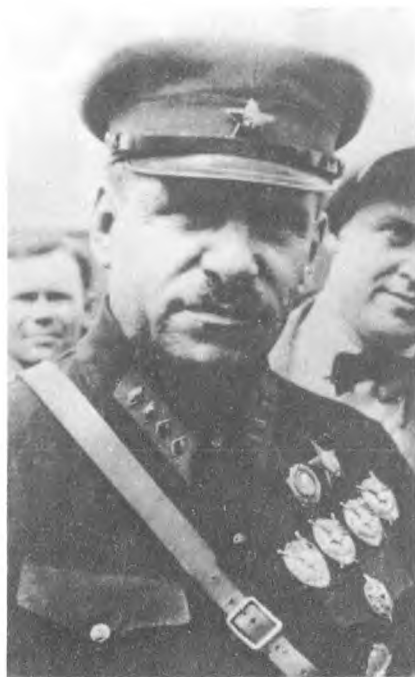
В. К. Блюхер.