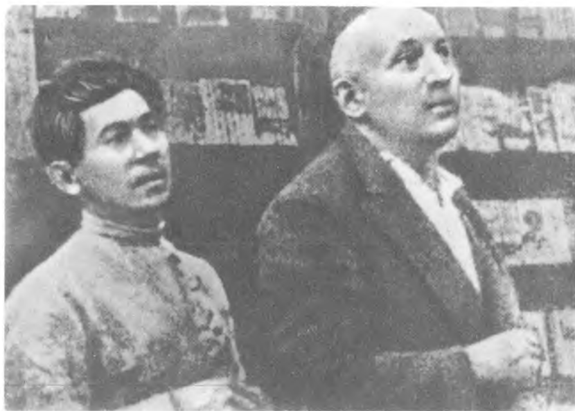
О. А. Пятницкий (справа) и Н. И. Ежов осматривают выставку Коминтерна в Доме союзов. Москва. Начало 30-х годов.