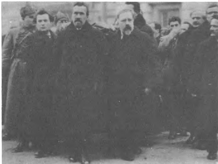
Слева направо: Г. Е. Зиновьев, А. И. Рыков, Л. Б. Каменев выносят гроб с телом М. В. Фрунзе из Дома союзов. Москва, 1925 г.