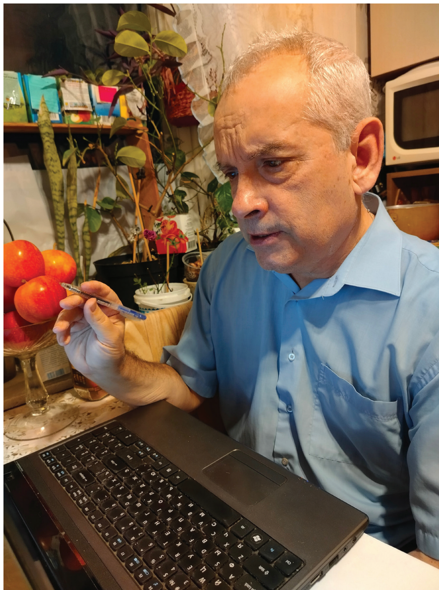
Андрей Малышев Номинант на Нобелевскую Премию в области литературы