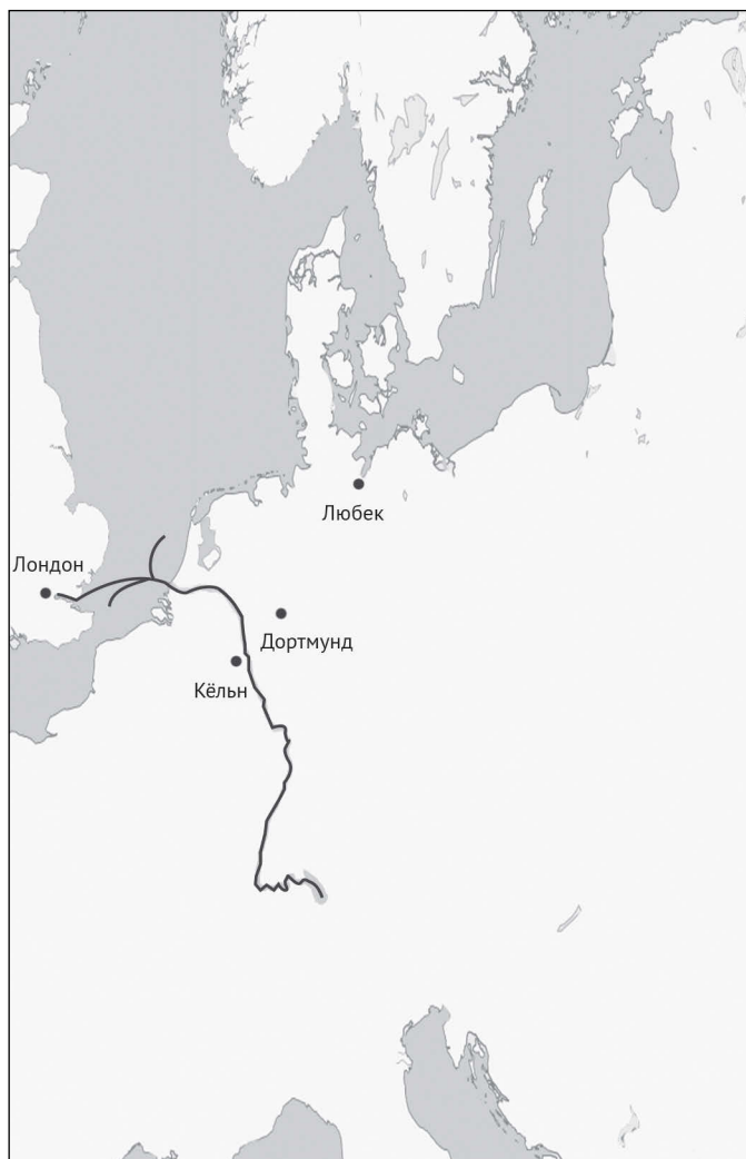
Рейнский торговый путь