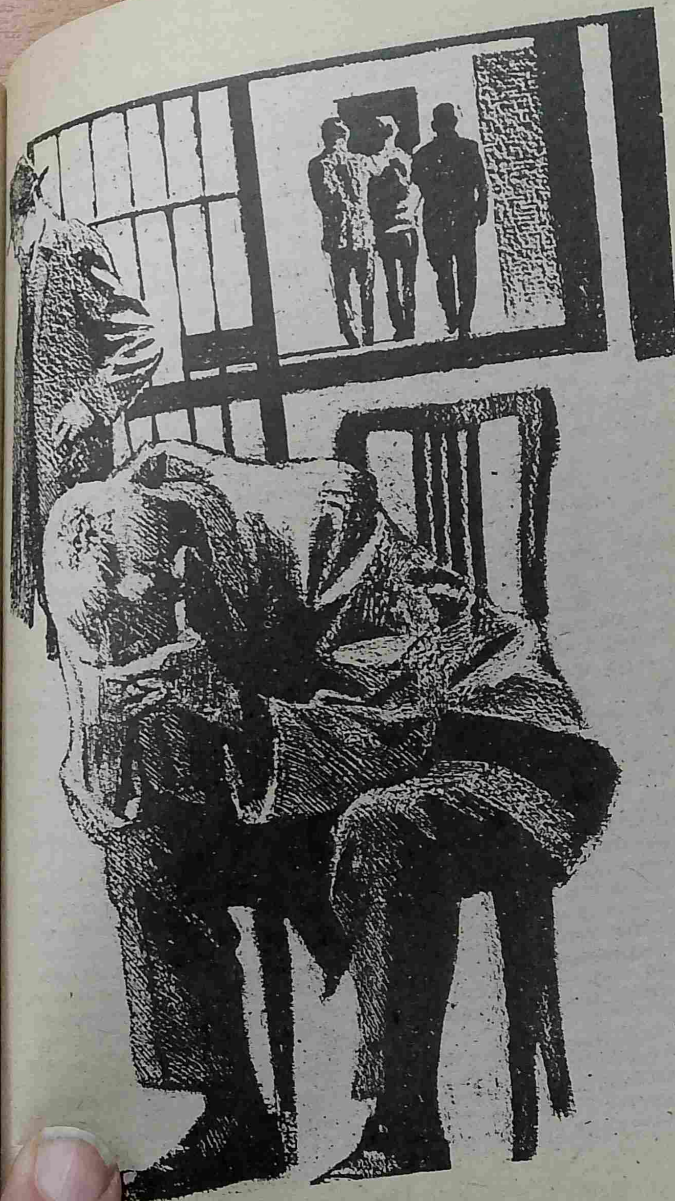
Рисунки Марины ПИНКИСЕВИЧ

Они замолчали и погрузились в воспоминания.