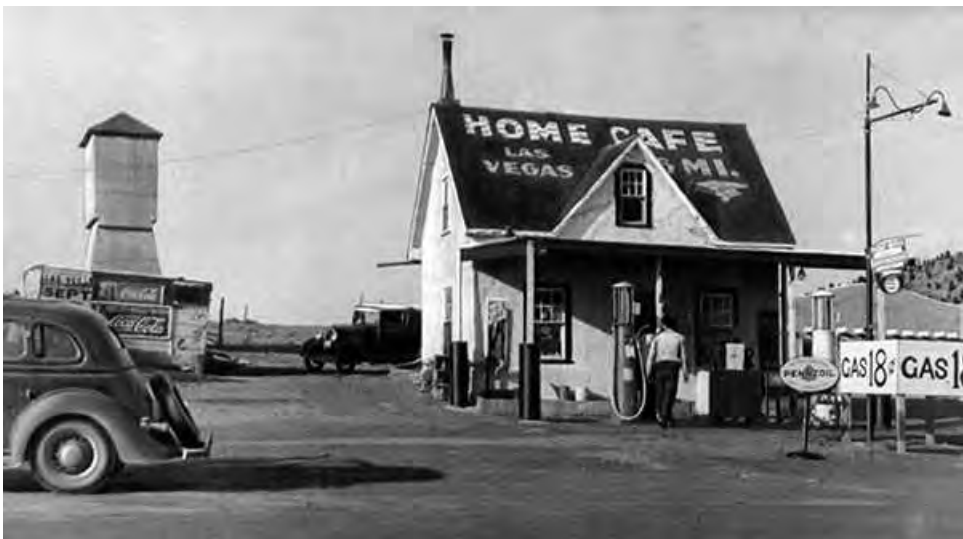
На газолиновой станции

О, эта дорога! В течение двух месяцев она бежала нам навстречу — бетонная, асфальтовая или зернистая, сделанная из щебня и пропитанная тяжелым маслом. /.../ Мы катились по ней с такой легкостью и бесшумностью, с какой дождевая капля пролетает по стеклу.