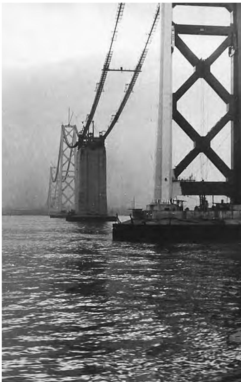
Сан-Франциско. Строящийся мост «Золотые ворота». Так вот оно, всемирное чудо техники, — знаменитый висячий мост!