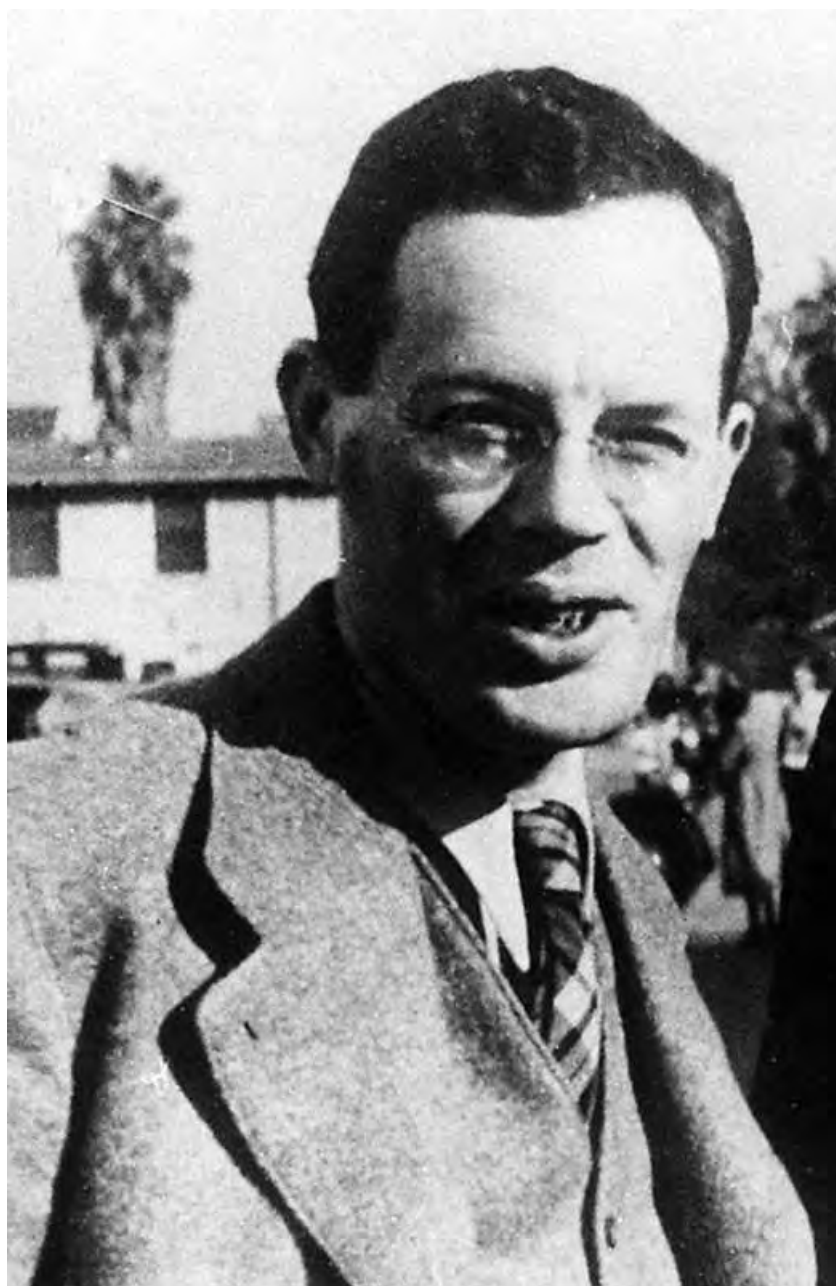
Илья Ильф в Голливуде