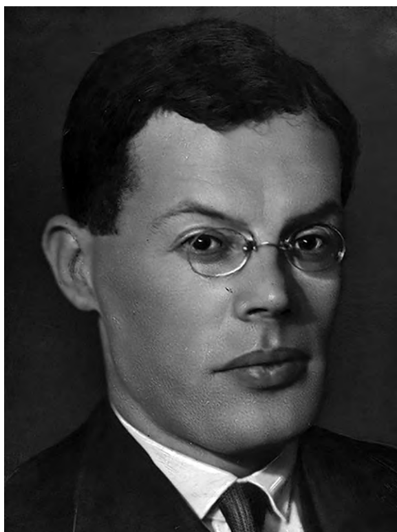
ИЛЬФ ИЛЬЯ АРНОЛЬДОВИЧ 1897—1937