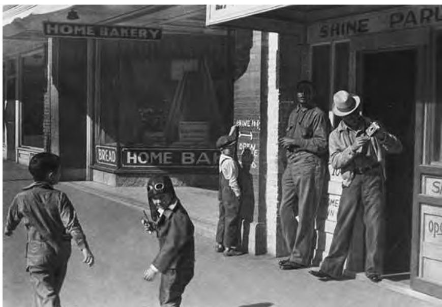
В маленьком городке