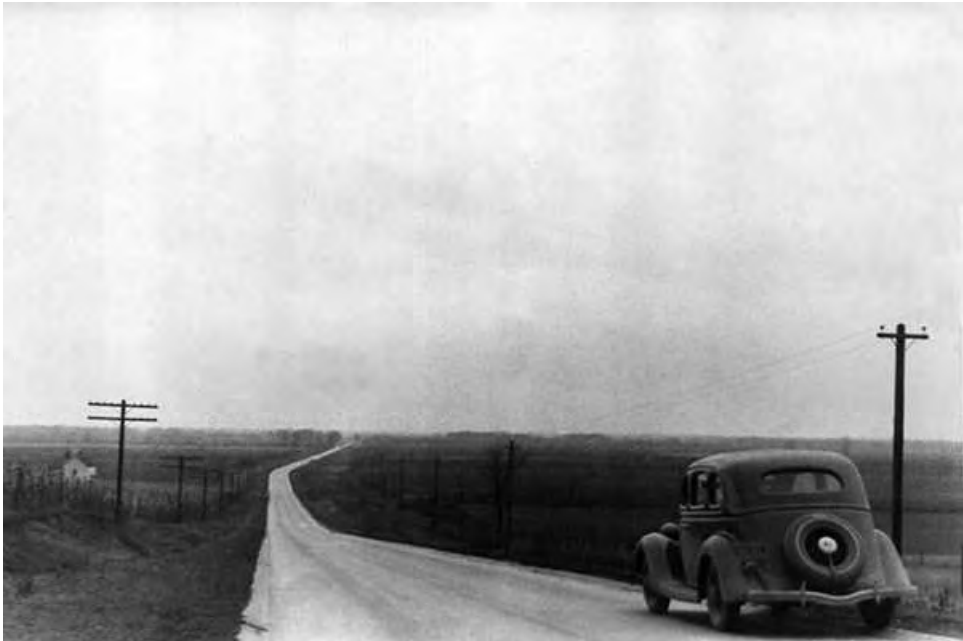
На автомобильной дороге