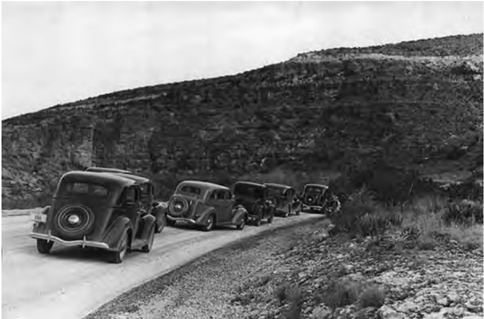
Америка лежит на большой автомобильной дороге.