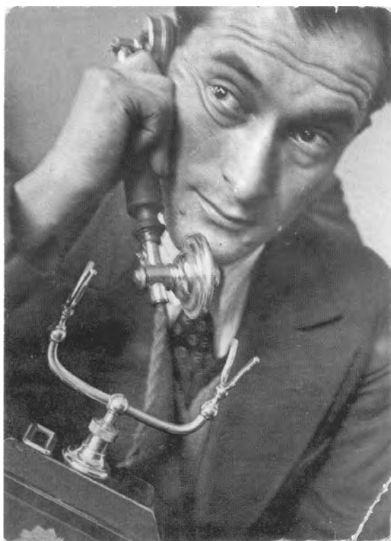
ПЕТРОВ ЕВГЕНИЙ ПЕТРОВИЧ 1902—1942