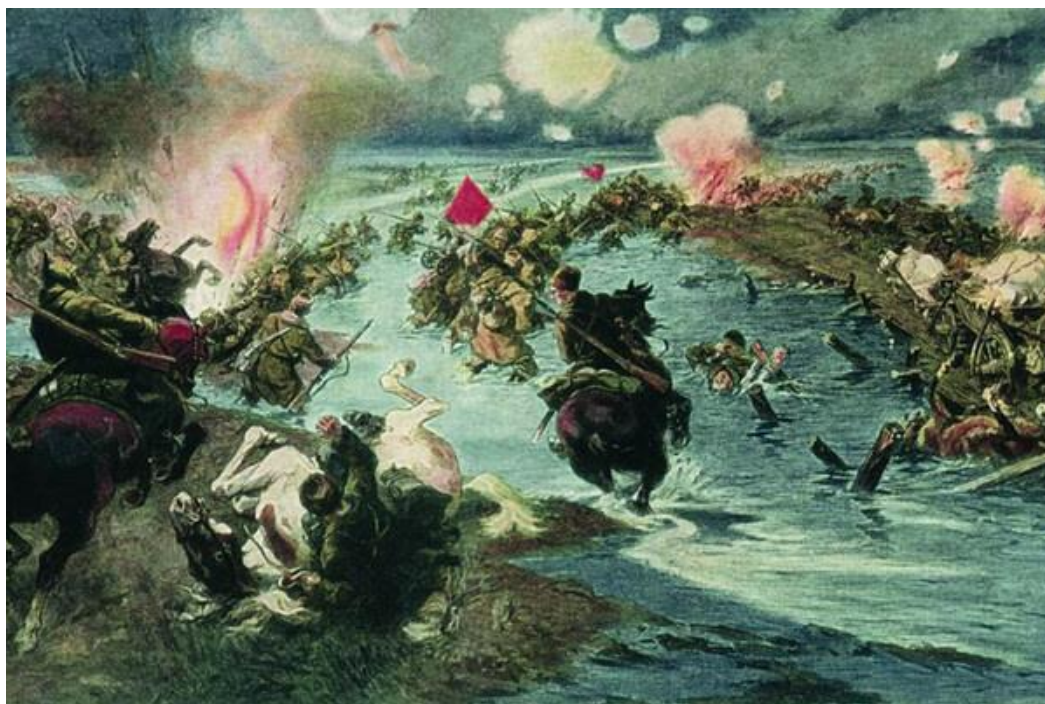
Картина «Переход Красной армии через Сиваш» (1935). Николай Семёнович Самокиш.

Часть из их, проваливаясь сквозь тонкую ледяную корку, молча уходили в соленую, холодную и вязкую грязь, чтобы из года в год, при штормовом ветре, задубевшие и просоленные, снова выходили на поверхность озера, пугая местных жителей.