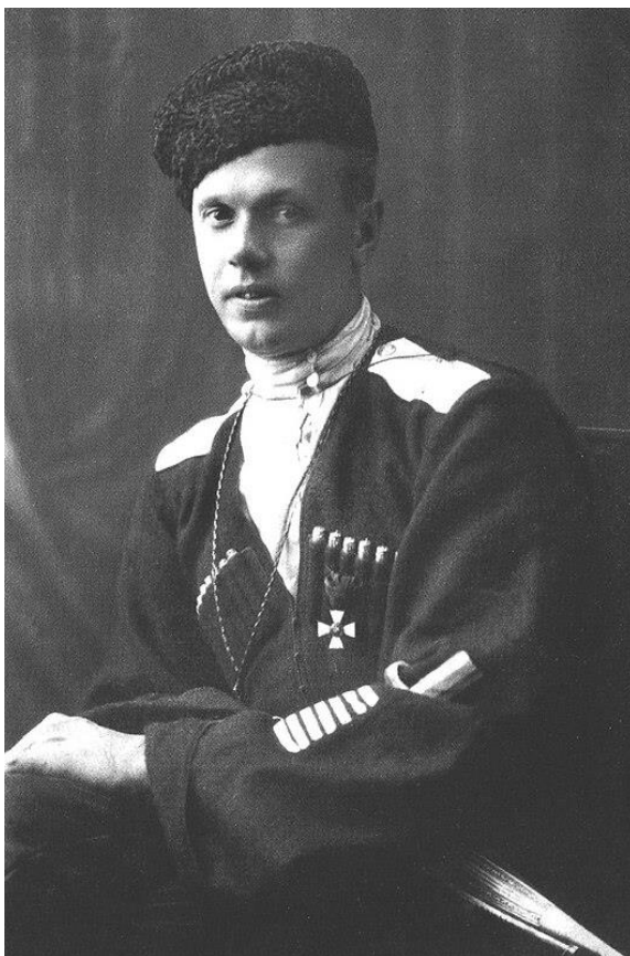
Я. А. Слащёв

Многие историки говорят, что если бы вместо Врангеля главнокомандующим в это сложное время был Слащёв, с железной дисциплиной в войсках, то прорыва бы не случилось. Артиллерия белых легко бы расправилась с наступающими частями Красной армии на льду Сиваша, независимо от их количества. И история Крыма могла пойти по совершенно другому пути.