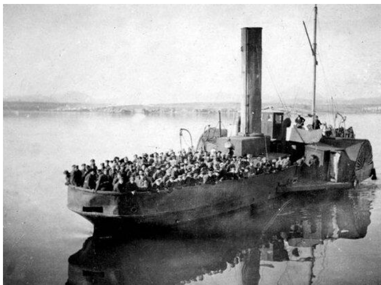
Белые покидают Россию

На некоторых судах, рассчитанных на 600 человек, находилось до 3 тыс. пассажиров: каюты, трюмы, командирские мостики, спасательные лодки были битком набиты народом. Шесть дней многие должны были провести стоя, едва имея возможность присесть. Мало было хлеба и воды. Задохались от тесноты. Кто-то не выдержал сходил с ума. А кто-то кончал жизнь самоубийством, бросившись в воду.